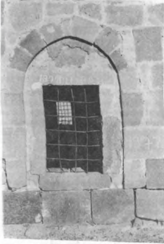
RESİM:4 Mescidin batı cephesindeki pencere