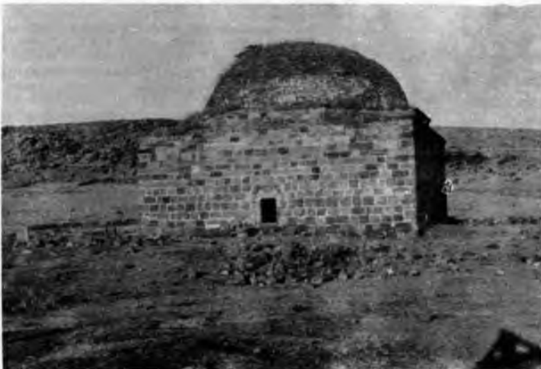
RESİM:1 Yağmırcınarı Mescidi'nin ..raktan görünüşü.