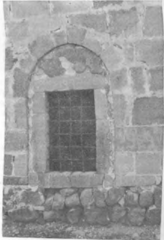
RESİM:5 Mescidin doğu cephesindeki pencere