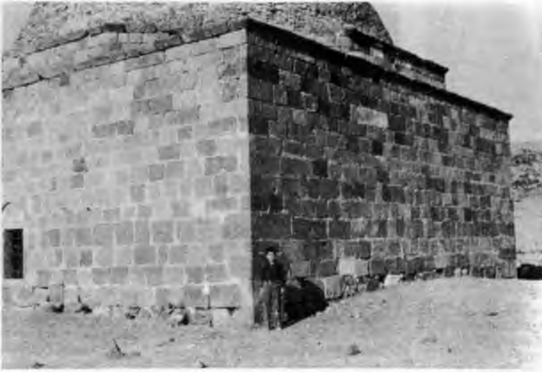
RESİM : 6 Mescidin güney-batıdan görünüşü.