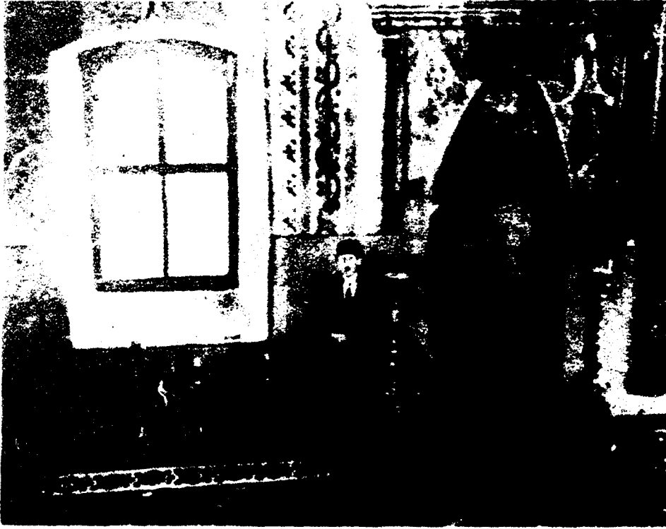
Resim : 2 — Мухрабност Бајракли џамие са мухрабом

Resim : 2 — Camiin içi ve mihrabı (Mihrabın önünde duran zât camiin imamı Rahmetli Abdullah Hacıç)