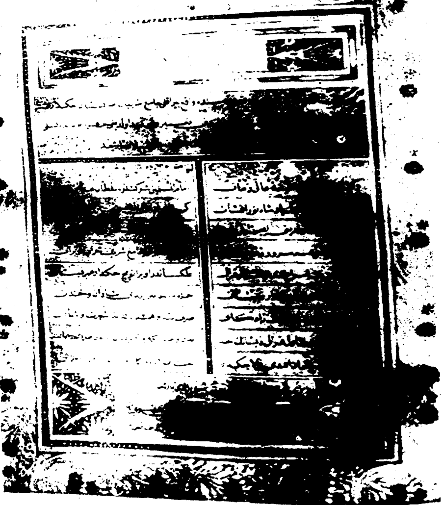
Ср. 4 — Хронограм поводом завршавања џамије Бајракли: џамији у Београду. 1893/4. година. Оригинал се налази у Библиотеци Српске академије наука и уметности у Београду.