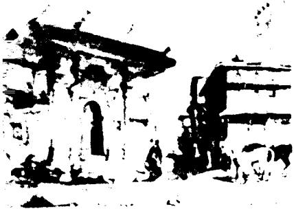
Topkapı Sarayı Dış Kapı Önleri