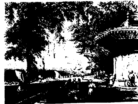
Günlük Hayattan Görünümler