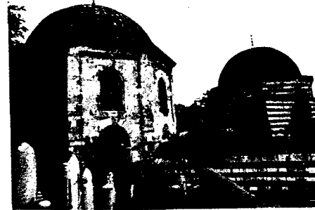
Eyüp'te Sokollu Türbesi