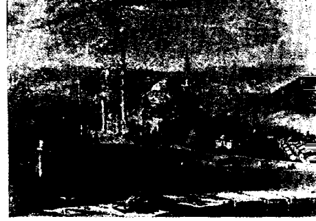
Serasker Kulesinden Süleymaniye

2. Osmanlı Devleti'nin yabancı ülkelerdeki başarısının bir tarafı da getirdikleri yeni ve Hıristiyan memleketlerinden farklı bir iktisadî düzendir. Bizans