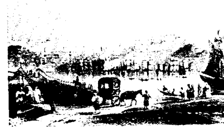
Haliç Üzerinde Bir Köprü