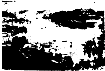
Beşiktaş Sırtlarından Boğaz

Zengin ve güçlü olan bu Devlet gereğinde Hıristiyan ülkelerin de yardı- mına çağrılıyordu. Pavie'de 1525'de Charles Quint'e esir düşen Fransa Kralı I.