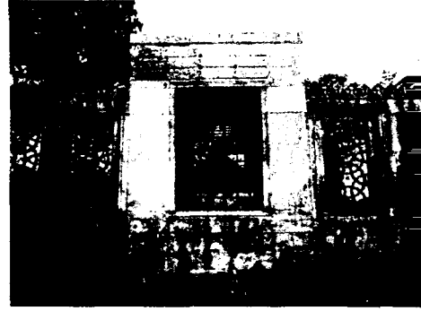
Mimar Sinan'ın Türbesi

İstanbul'un dış görünüşünde yeşil benekleri meydana getiren küçük ağaç toplulukları, konakların, camilerin bahçe ve avlularındakilerden başka mahalle aralarındaki küçük mezarlıklardan yani hazirelerden çıkıyordu. Ayrıca, şehrin içindeki belirli bir düzeni olmaksızın Bizans çağından beri süregelen bir sisteme göre olan ve kaynaklardan anlaşıldığına göre bir kısmı arnavut kaldırımı denilen kaba taş döşenmiş sokakların birleştiği yerlerde gayet ufak meydan-cıklar da birkaç ağaç tarafından gölgelendiriliyordu. Türkler'in ve İstanbul halkının bu devirlerdeki ağaç sevgisi yabancıların da dikkatini çekecek ve onların övgülerini üzerinde toplayacak kadar kuvvetli idi. İstanbul'un bir özelliği de, şehrin dış sınırlarını âdeta yeşil bir kuşak içine almış olan uçsuz bucaksız mezarlıklardı. Belirli bir düzeni olmaksızın ulu selvi ağaçlarının bir orman gibi gölgelediği bu sahalar, surların dışında Marmara'dan Eyub'e kadar şehri kuşattıktan sonra, Eyub sırtlarını da kaplıyor, ikinci bir kuşak ise Kasımpaşa'dan başlayarak Tepebaşı'na Şişhane'ye çıkıyor, burada Galata surları dışında Taksim- Ayaspaşa ve Tophane üstünden tekrar kıyıya kadar iniyordu. Üçüncü büyük kuşak ise karşı yakada, Anadolu tarafında Üsküdar'dan şimdiki Kızıltoprak semtine kadar uzanan Karacaahmet mezarlığı idi. Eski resimlerde, hatta geçen yüzyılın sonlarına kadar çekilmiş fotoğraflarda bugün pekçok yerde izi kalmamış mezarlıklar görülebilir.