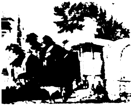
Şehzade Camii ve Çeşmesi