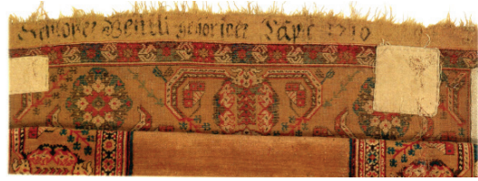
Fotoğraf 5. Bağış yazıtlı 5 Tek Nişli "Transilvanya" Tipi Halı (Ionescu 2005; 6)

Dindar ve halı satın alabilecek kadar varlıklı cemaat üyelerinin halılarını kiliseye getirme ve bağışlama davranışlarının özünde bir çeşit manevî ölümsüzlük arayışı olabileceği gibi gösteriş amaçlı bir hareket olabileceği de düşünülmektedir. Halıların kilise sıralarında kullanılmasının bir diğer amacı da, üzerlerindeki yazıtlarından o sıranın hangi aileye veya loncaya ait olduğunun belirtilmesidir (Ionescu 2007: 36). Fotoğraf 5'de görülen halı yazıtında geçen "Halı Demirciler Loncasına Aittir – 1710" ifadesi bu hususta önemli bir kanıttır.