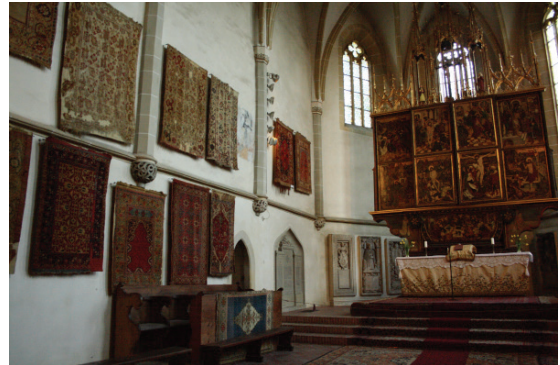
Fotoğraf 9. Mediaş Azize Margaret Kilisesi Halıları (Boz 2013; 108, Fot.58)