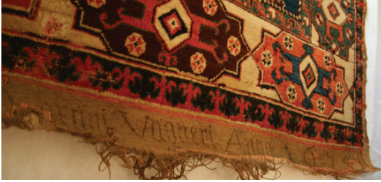
Fotoğraf 2. Bağış yazıtlı 2 Çift Mihraplı "Transilvanya" Tipi Halı [Ayrıntı] (Boz 2013; 66, Fot.19)