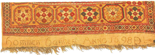
Fotoğraf 4. Bağış yazıtlı 4 Çift Mihraplı "Transilvanya" Tipi Halı [Ayrıntı] (Ionescu 2007; 219)

Dindar ve halı satın alabilecek kadar varlıklı cemaat üyelerinin halılarını kiliseye getirme ve bağışlama davranışlarının özünde bir çeşit manevî ölümsüzlük arayışı olabileceği gibi gösteriş amaçlı bir hareket olabileceği de düşünülmektedir. Halıların kilise sıralarında kullanılmasının bir diğer amacı da, üzerlerindeki yazıtlarından o sıranın hangi aileye veya loncaya ait olduğunun belirtilmesidir (Ionescu 2007: 36). Fotoğraf 5'de görülen halı yazıtında geçen "Halı Demirciler Loncasına Aittir – 1710" ifadesi bu hususta önemli bir kanıttır.