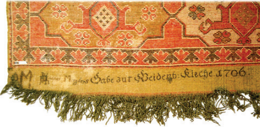
Fotoğraf 3. Bağış yazıtlı 3 Çift Mihraplı "Transilvanya" Tipi Halı [Ayrıntı] (Ionescu 2007; 219)