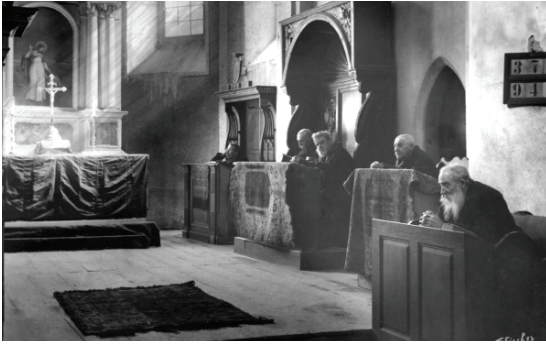
Fotoğraf 11. Sibiu Azylum Kilisesi, 1901

1901 tarihli Fotoğraf 11’de, Anadolu halılarının Transilvanya Bölgesi Sibiu Şehri Azylum Kilisesi’ndeki kullanımını yansıtan bir sahne görülmektedir ve geleneğin, 20. yüzyıl başında da devam ettiğini göstermesi açısından önemlidir. Kilise günümüzde Ortodoks cemaatine aittir ve burada bulunan tüm halılar Sibiu Brukenthal Müzesi’ne bağışlanmıştır.