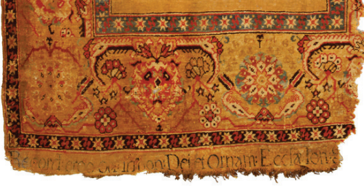
Fotoğraf 1. Bağış yazıtlı 1 Seccade Biçimli "Transilvanya" Tipi Halı [Ayrıntı] (Ionescu 2007; 37)