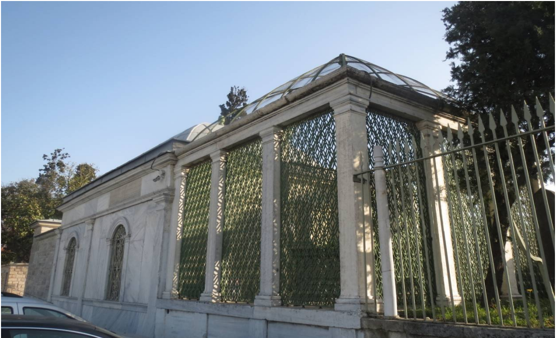
Resim 2. Yenikapı Mevlevihânesi Kütüphânesi ve Bânisi Abdurrahman Nafiz Paşa'nın Türbesi