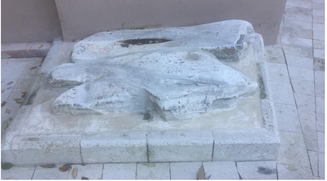
İstanbul Müftülüğü'nün içerisinde yer alan Cellat taşı

orijinal bir fikirdir. Saltanatın göz alıcı noktalarına, saray hayatına ve kazanılan zaferlere yer veren romanların aksine Cellat Taşı'nın üzerinden Osmanlı Devleti'nde yaşanmış acılara, acı olaylara yer verilir.