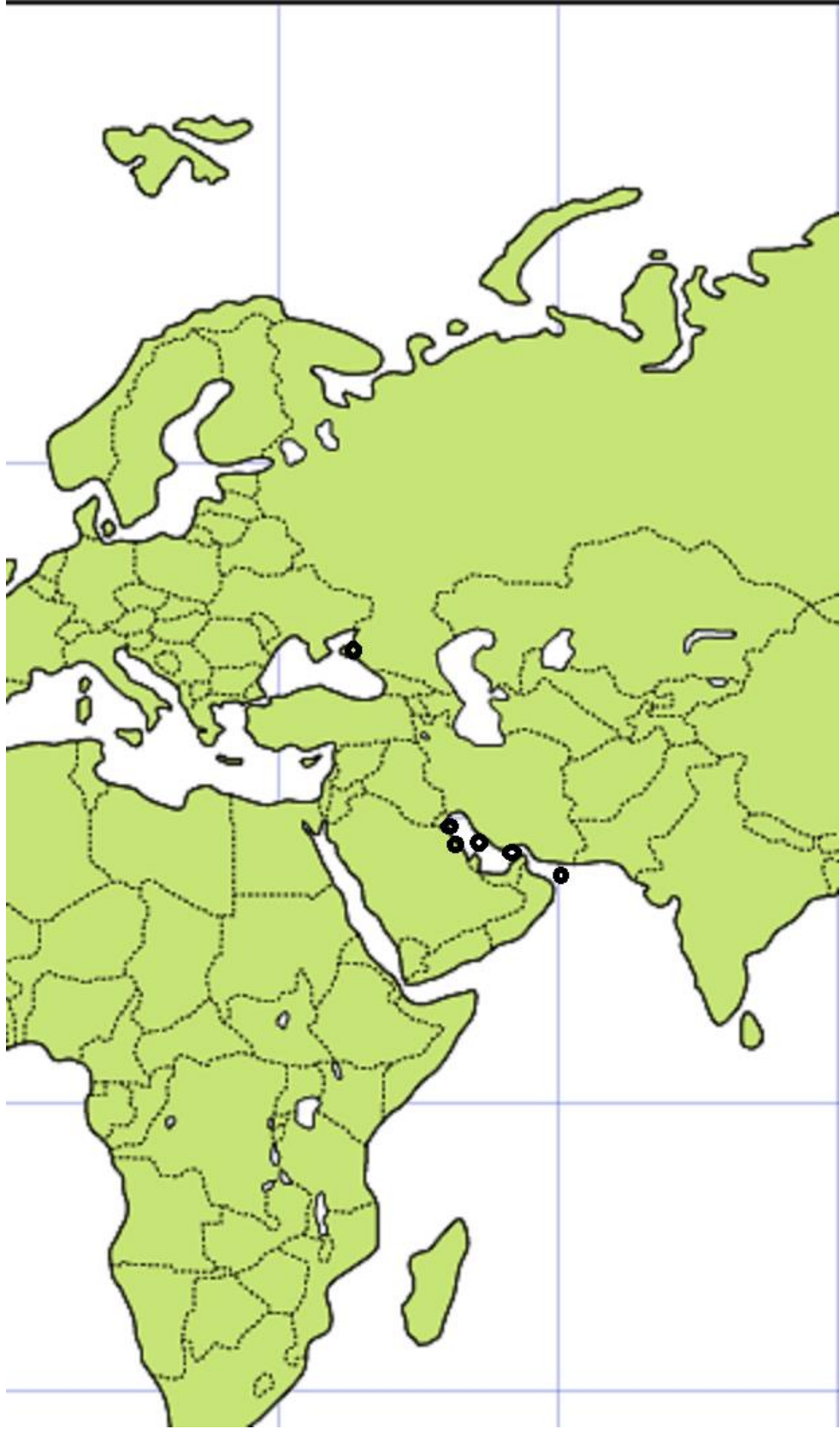
Resim 2: Evliya Çelebi Seyahatnâme'sinde geçen inci dalış yerleri