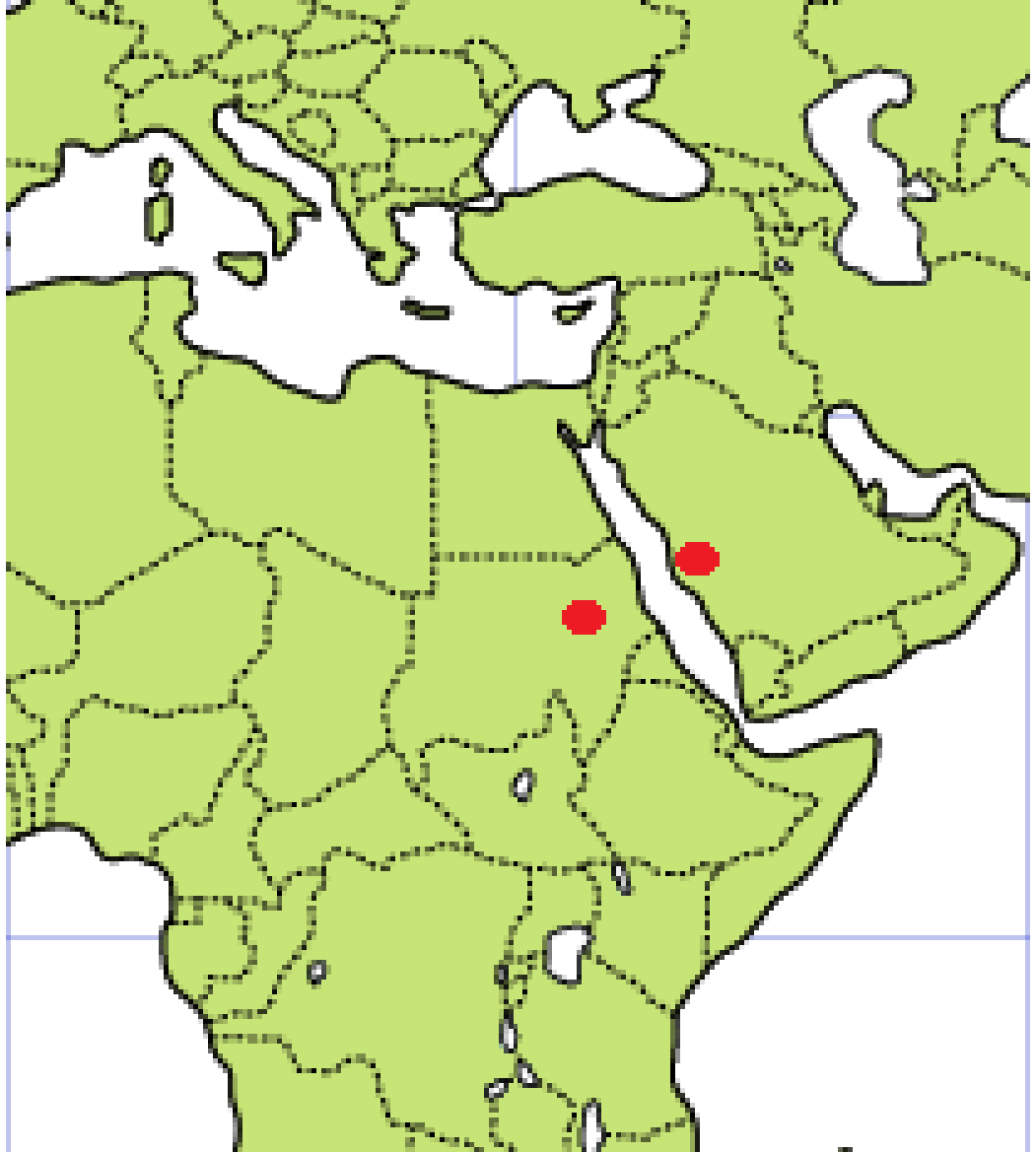
Resim 3: Evliya Çelebi Seyahatnâmesi'nde geçen zümrüt madenleri