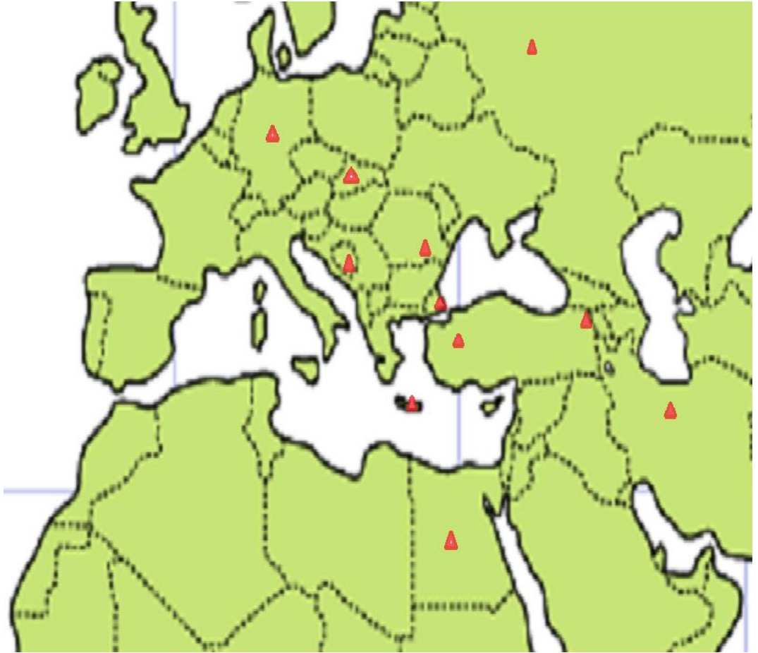
Resim 1: Evliya Çelebi Seyahatnâmesinde geçen altın madenleri

Evliya Çelebi Seyahatnâme'inde adı geçen Sarıyer, Kütahya, Kağızman, Akra Dağı, Bosna, Filibe, Almanya, Levice, Romanya (Bükreş), Moskova, Mısır ve Girit adasında çıkarılan altına harita üzerinde bakacak olursak: