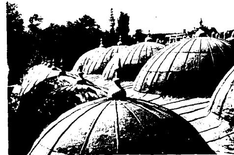
Süleymaniye Külliyesinden Kubbe