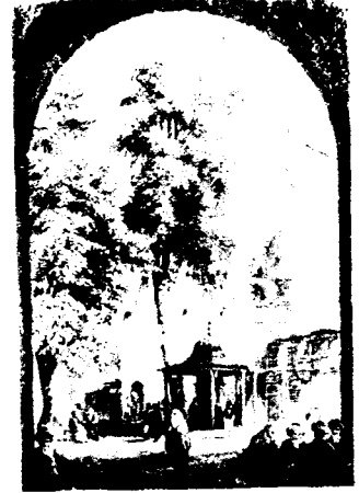
Eyüp Câmii Avlusu