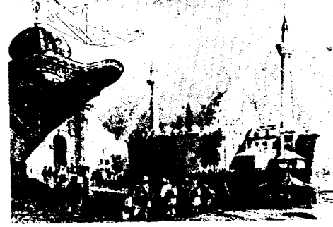
Serasker Kapısı ile Bayezid Câmii

San'atkârın dehâsı, geleneği kalıntıdan ayırmasını bilir, geleneği yeniden kalıba dökerek orijinalitesini ortaya koyar, yeniliğin sırrına ulaşır. Buna bir de san'at muhitini ve kamuoyunu ilâve etmelidir. Zira o san'at eserini, seyreden takdir eden, hayran kalan, okuyan, yazan ve tenkid eden sonunda bir hüküm veren insanların topluluğu olması lâzımdır ki san'atkâr gelişsinsin.