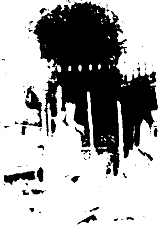
Sultan Süleyman'ın Turbesi