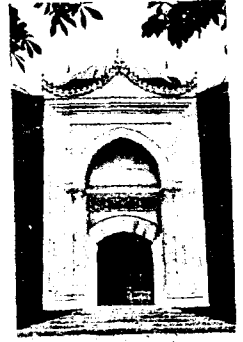
Selimiye Câmiinden iki Görünüm

Psikolojik temâşâyâ tekabül eden sosyal kalabalık, sosyal kolektivite, okuyucu, seyirci gibi kalabalıklar san'at kamuoyudur. Bunun da temelinde "sosyal sempati" vardır. Onun da temelinde Allah aşkı ve Allah sevgisini görmek gere-