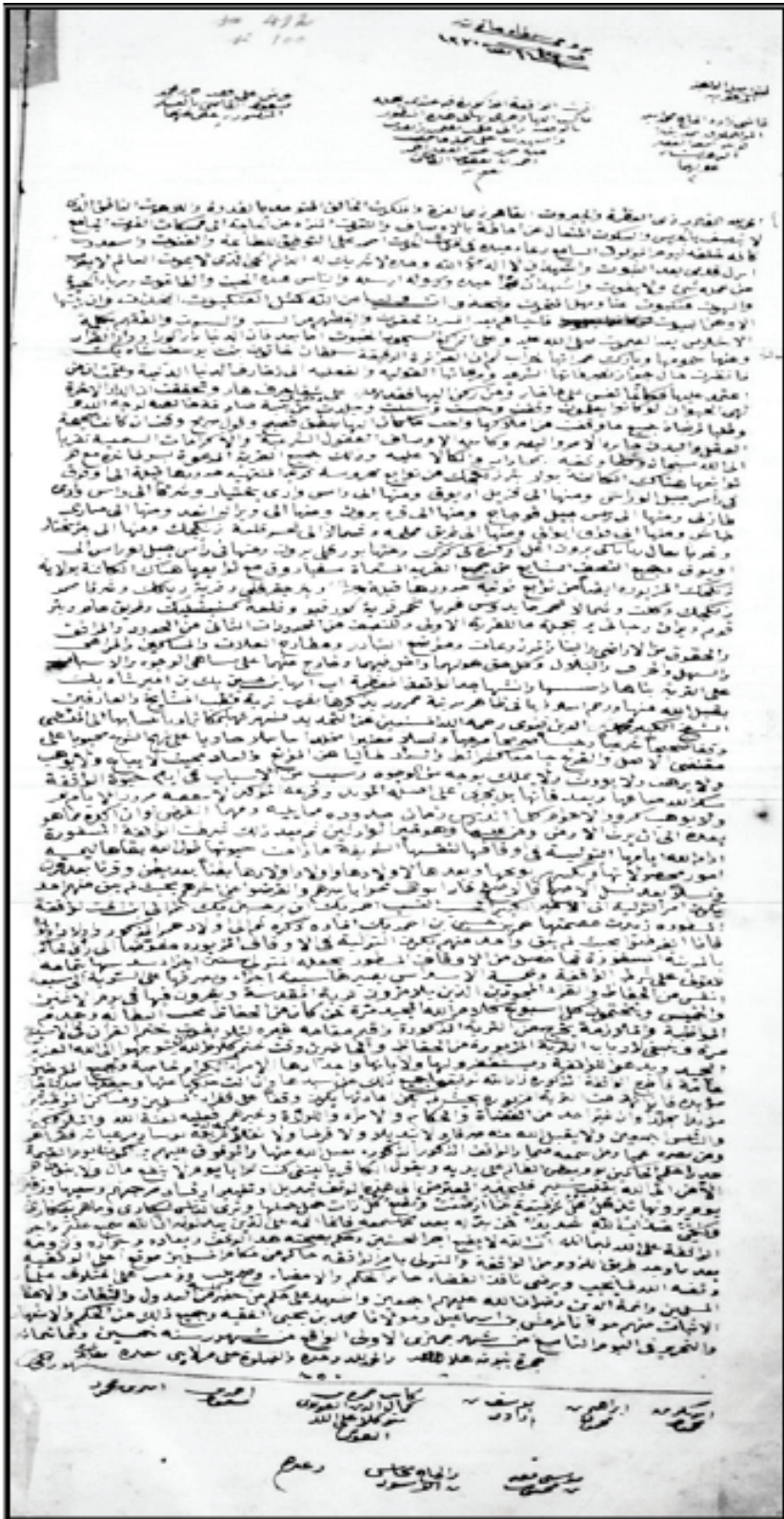
Ek 1: Sultan Hatun'un 1446 Tarihli Vakfiyesi Sûreti (VGMA, d. 582/1, 237:166)