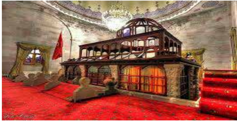
Resim 2. Ebu'l-Hasan el-Harakâni Hazretleri Türbesinin içinden görünümü.