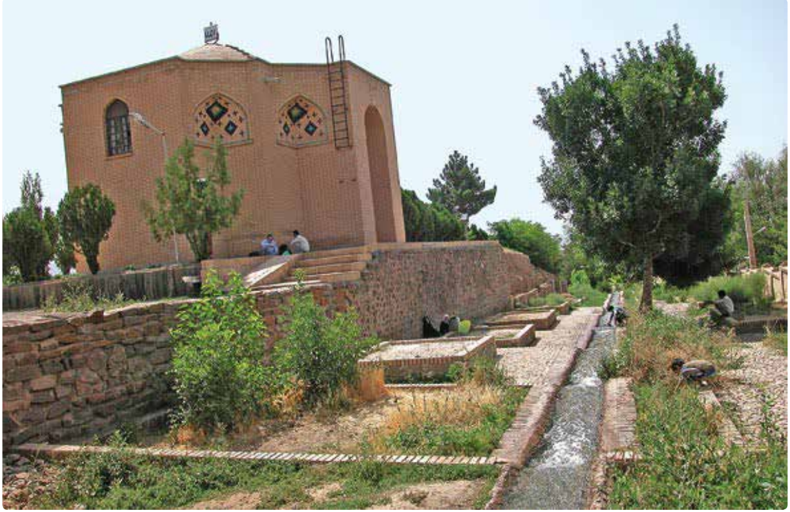
Resim 1. Ebu'l-Hasan el-Harakâni Hazretleri Türbesi/Kars