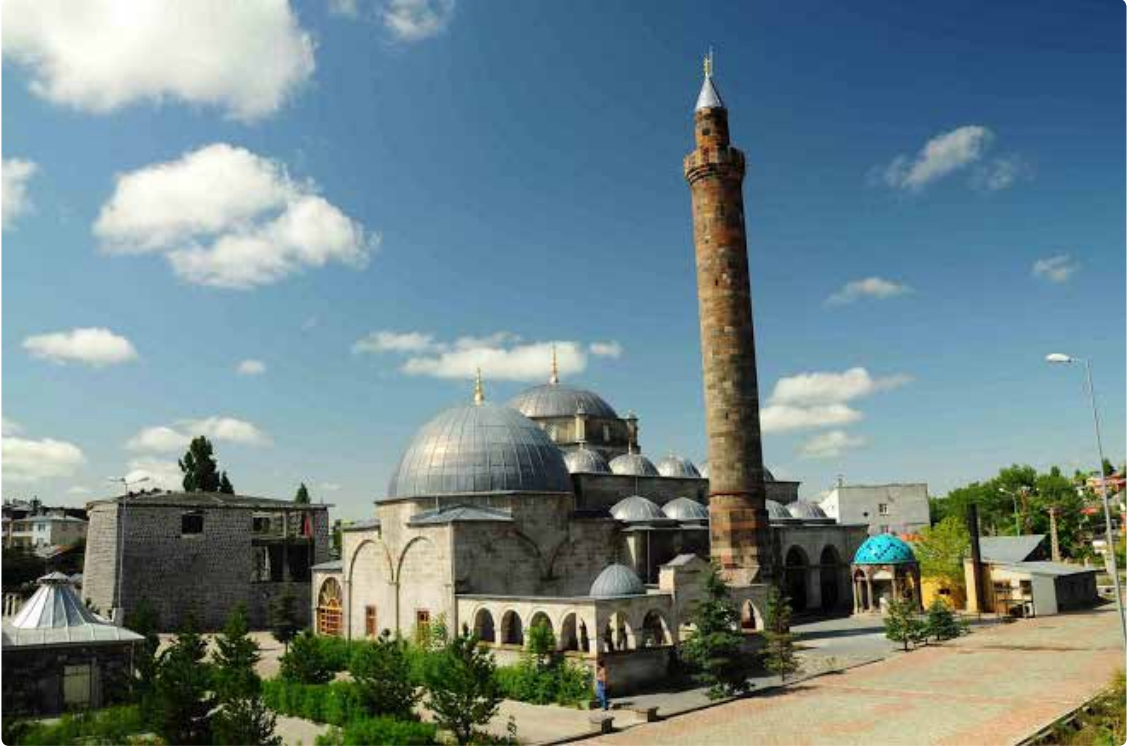
Resim 3. Sultan III. Murat Camii/Kars