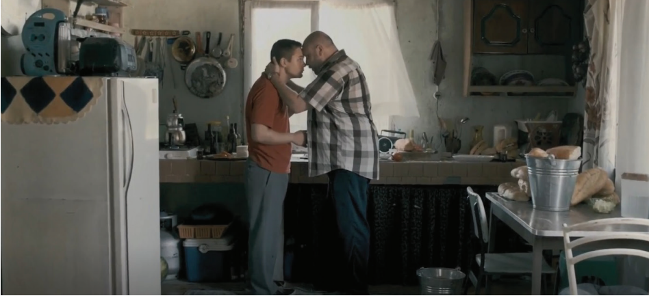
Resim-1: Ahad'ın Gaza'yı baskı yoluyla ikna etmesi