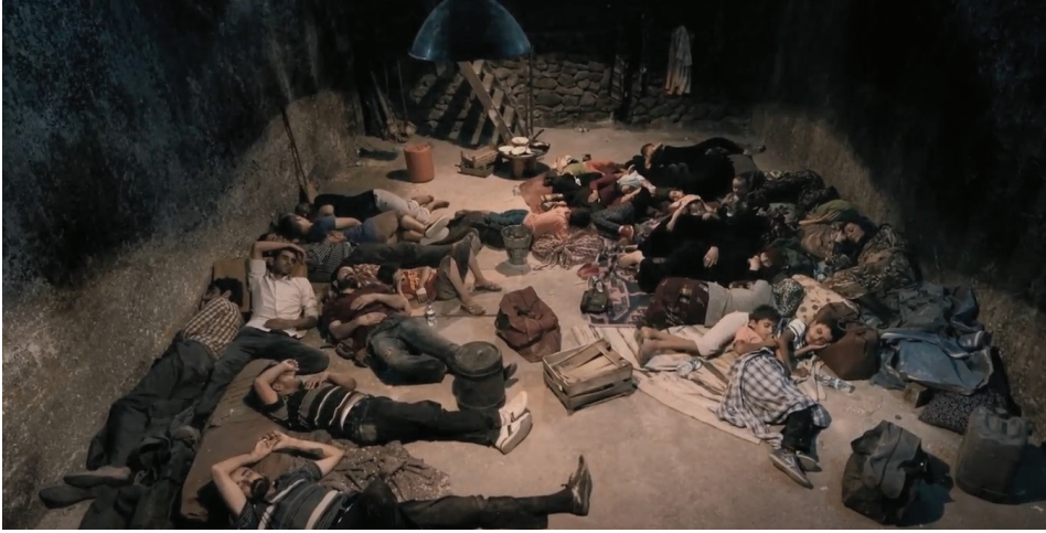
Resim-2: Kandallı'da yer alan evin deposundaki Suriyeli kaçak göçmenler

ceğre çevirir, böceğre. Girersin bir deliğre, orada birbirini yersin ". Ahad'ın bakış açısından Suriyeli göçmenlerin Avrupa yolculuğru boş bir hayalin ürünü olarak görülmekte, bu anlamda göçmenler boş bir hayalin peşinden sürüklenmekte ve bu hayal uğrunda yersiz bir sıkıntıya katlanmaktadır. Ahad'a göre göçmenlerin hayalleri gerçeğri yansıtmadığı gibi onları böcek örneğinde olduėu gibi sürekli ezilmeye mahkûm etmektedir. Bu anlamda, göçmen kaçakçılıru açısından göçmenlerin yersiz-yurtsuz olmaları, onları yok edilme tehdidiyle baş başa bırakmakta ve onları depolara hapsedmektedir (Bkz. Resim-2).