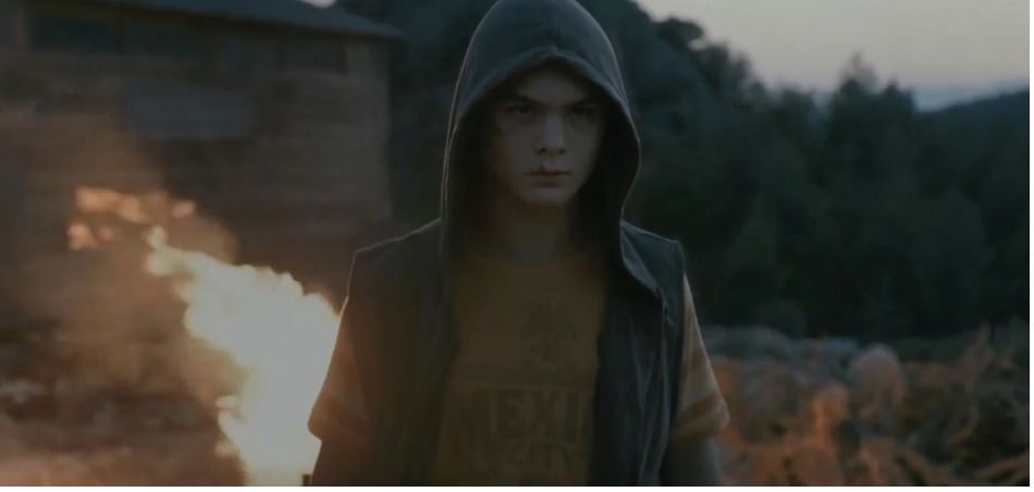
Resim-3: Gaza'nın direniş ateşini yakması ve direniş müziğini söylemesi

Gruplar mekânda ancak görece bir kalıcılığa sahip oldukları ve üyelerinden bazıları da uzlaşabildiği için, bir bireyi ilgilendiren bir olay grubu ancak belli bir süre, yani bireyler birbirlerine yaklaştıkça ve birinin eylemi ya da durumu diğerlerinin var olma biçimlerini ve yöntemlerini etkilediği ya da etkileyebileceği ölçüde de ilgilendirir. Grubun dönüşümü ise, şu ya da bu üyenin ayrılmasının sonucu değildir sadece; bireylerin rolleri ve durumları da aynı toplumun içinde durmadan değişir. 30 Ahad'ın iktidarını direnişle sarsıntıya uğratan Gaza, babasını diğer göçmen kaçakçısı teknelere şikâyet ederek onun öldürülmesine neden olmuş ve bu sayede bütünüyle babasından kurtulmuştur.