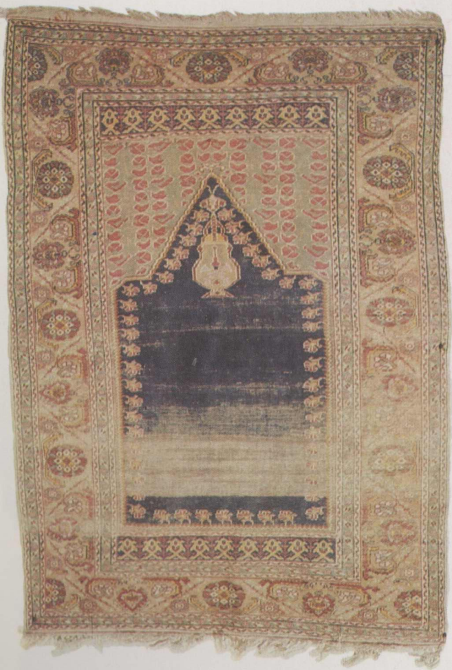
Resim 3 197