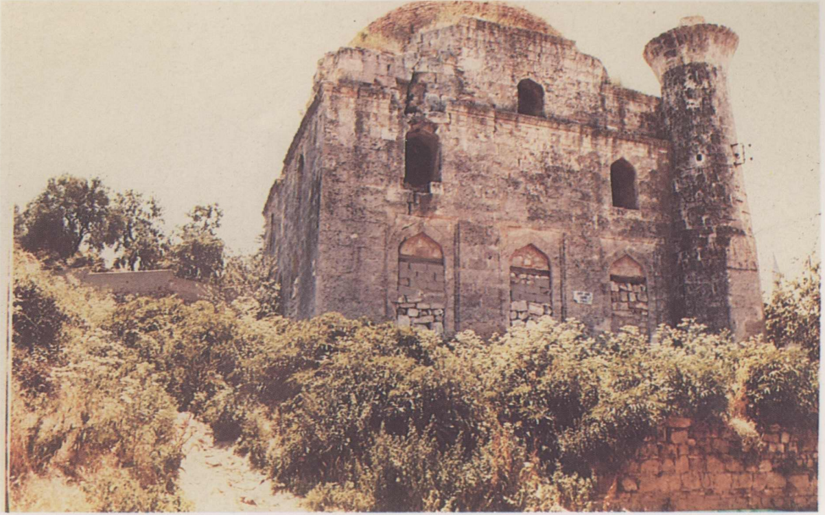
1. Arif Ağa Camii restorasyon öncesi.