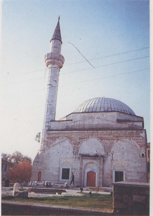
7. Sitti Hatun Camii restorasyon sonrası.