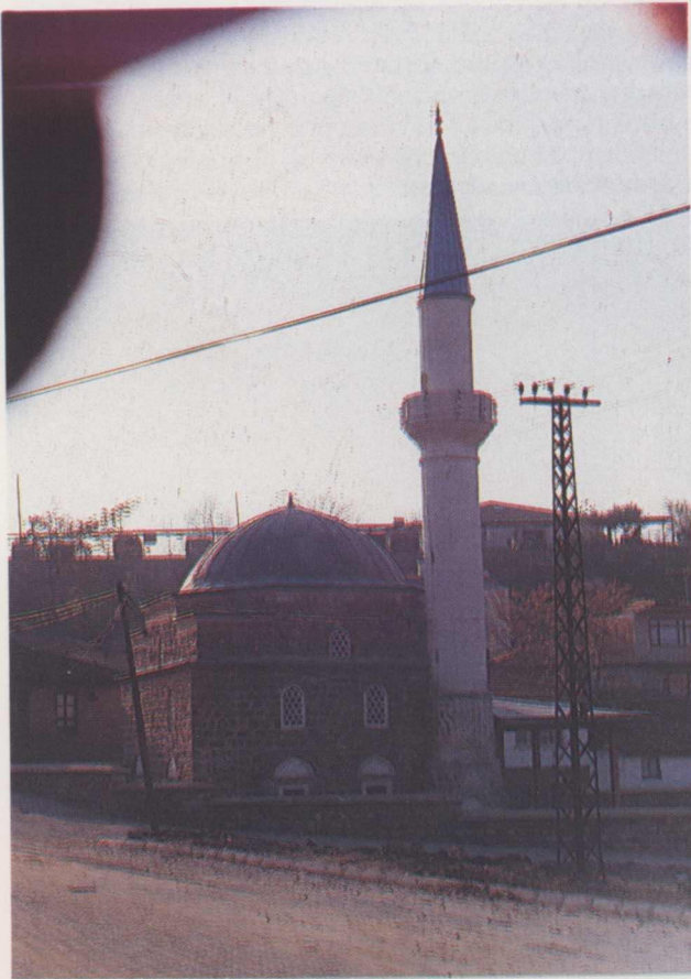
5. Ismail Ağa Camii restorasyon sonrası.