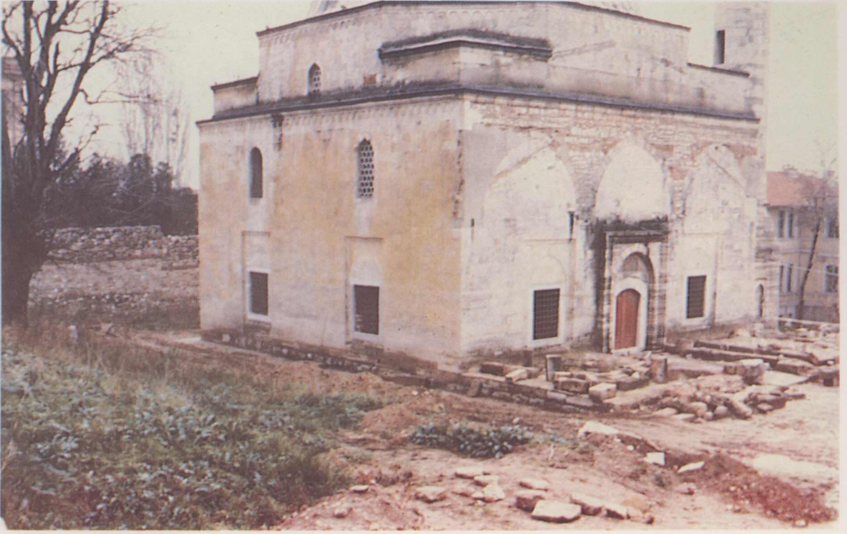
6. Sitti Hatun Camii restorasyon öncesi.