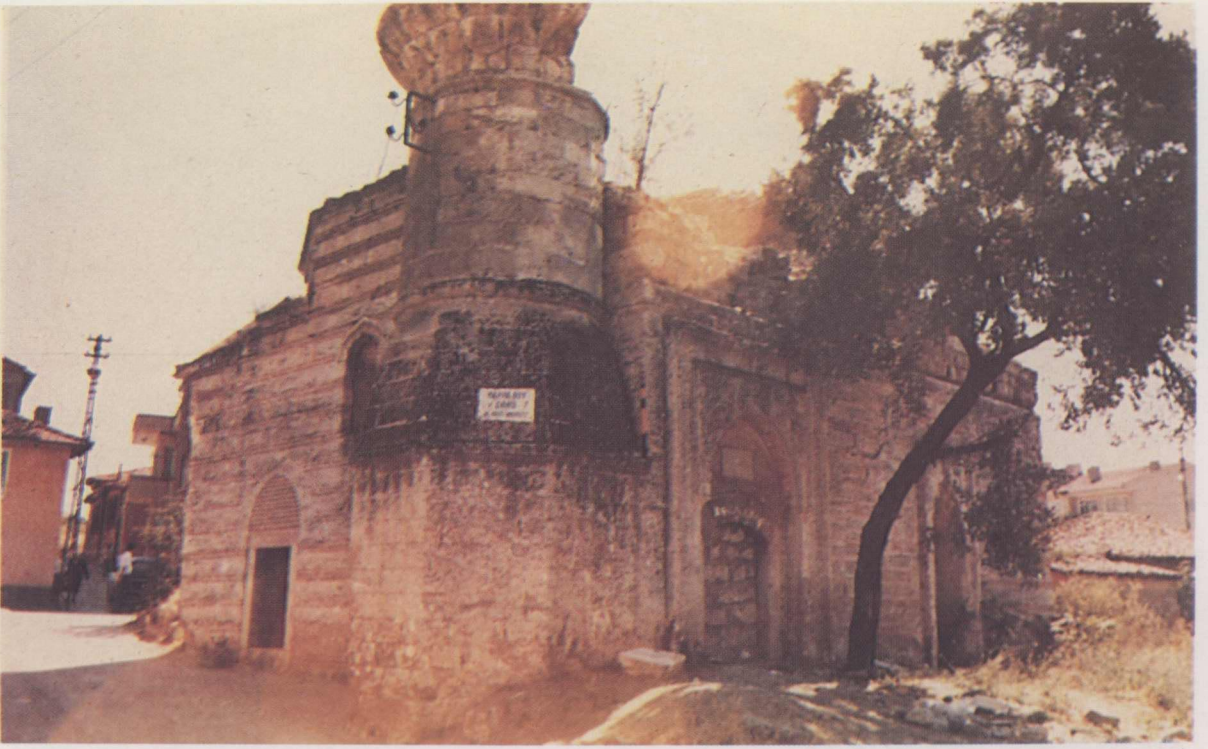
8. Yahya Bey Camii restorasyon öncesi.