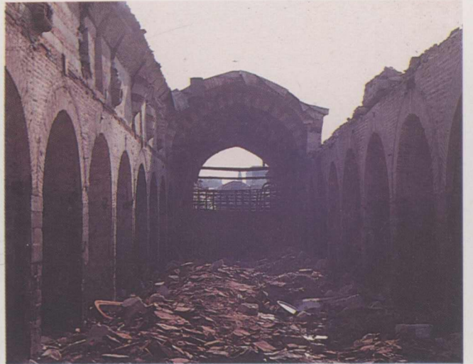
10. Ali Paşa Çarşısı restorasyon öncesi.