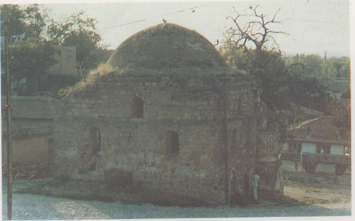
4. Ismail Ağa Camii restorasyon öncesi.