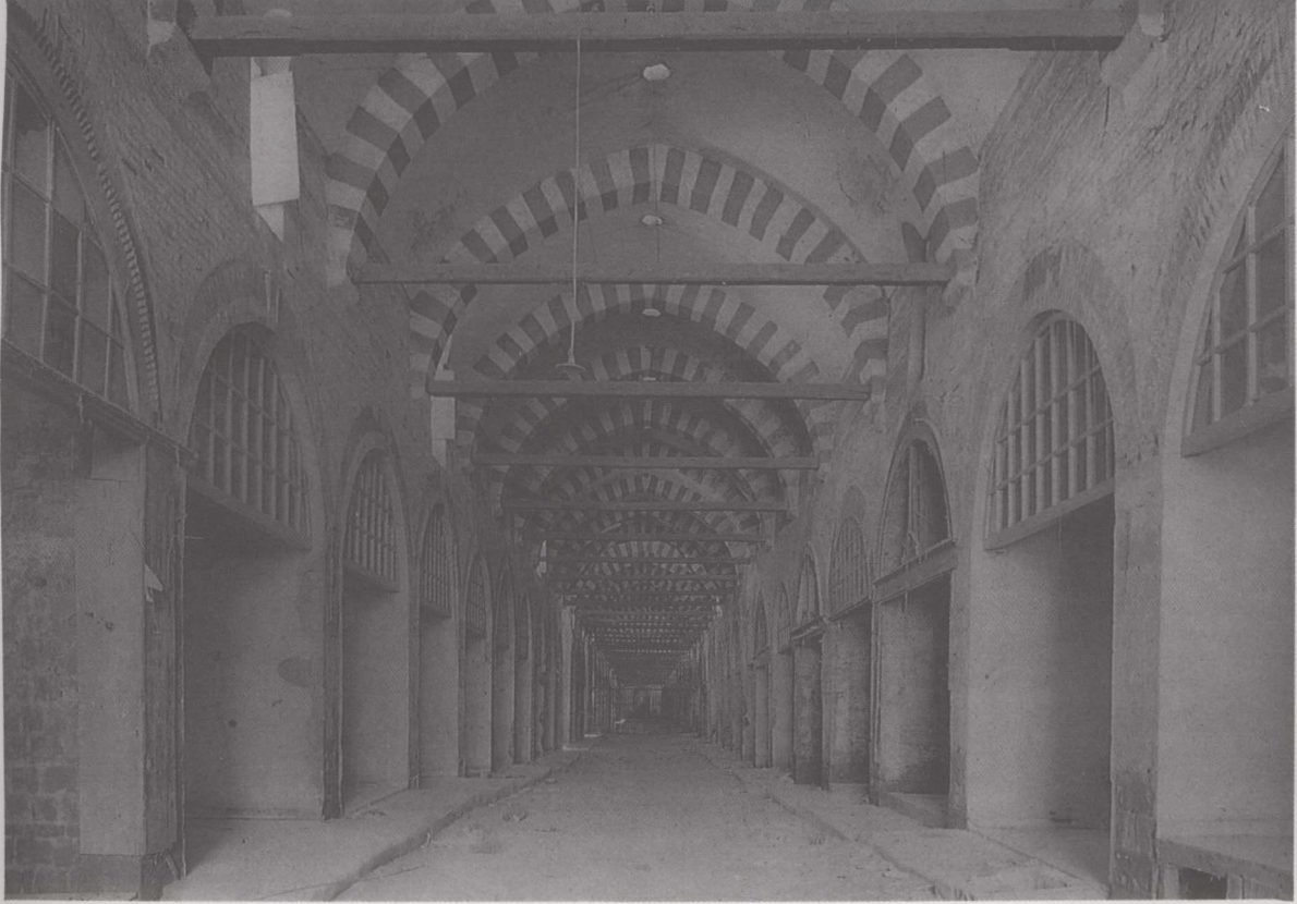
11. Ali Paşa Çarşısı restorasyon sonrası.