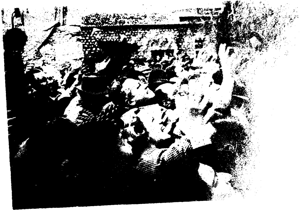
Resim : 6 — Mesir Macunu kapışan başka bir grup.