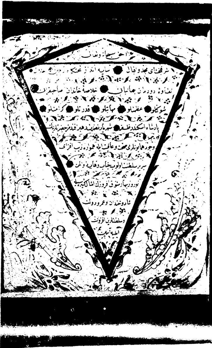
Resim : 2 — Nevruziye kâsesinin kulağı