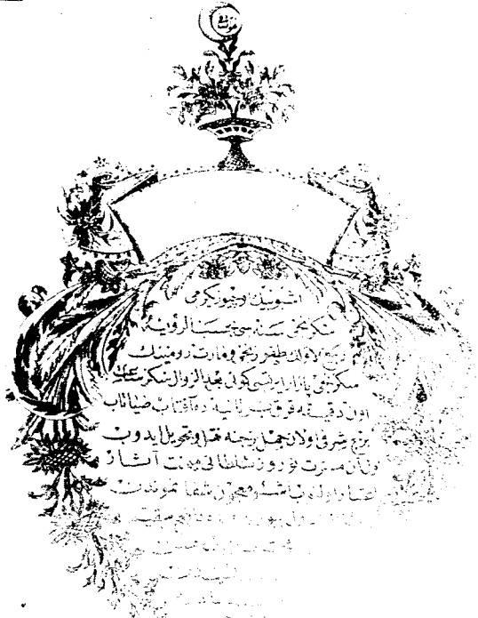
Resim : 10 — Üsküde, Şifalı Mesir Macununun şifalıları