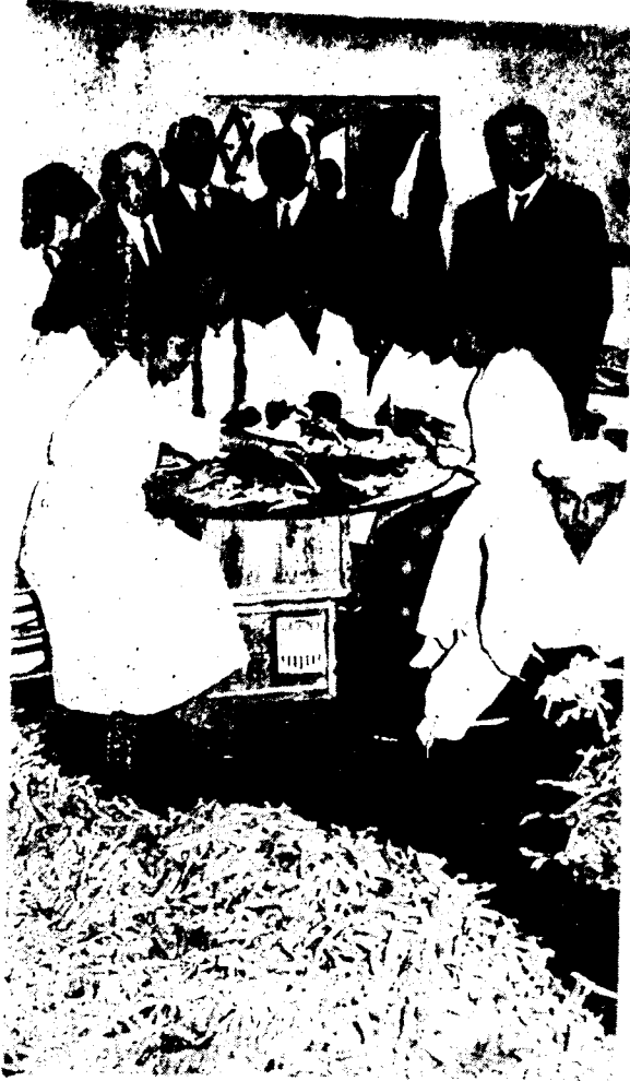
Resim : 7 — Mesir Macunu saran genç kızlar