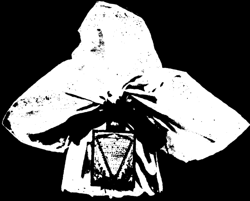
Resim : 12 — Padıřaha sunulan kumařa (at'asa) sarlı Nevruzıye