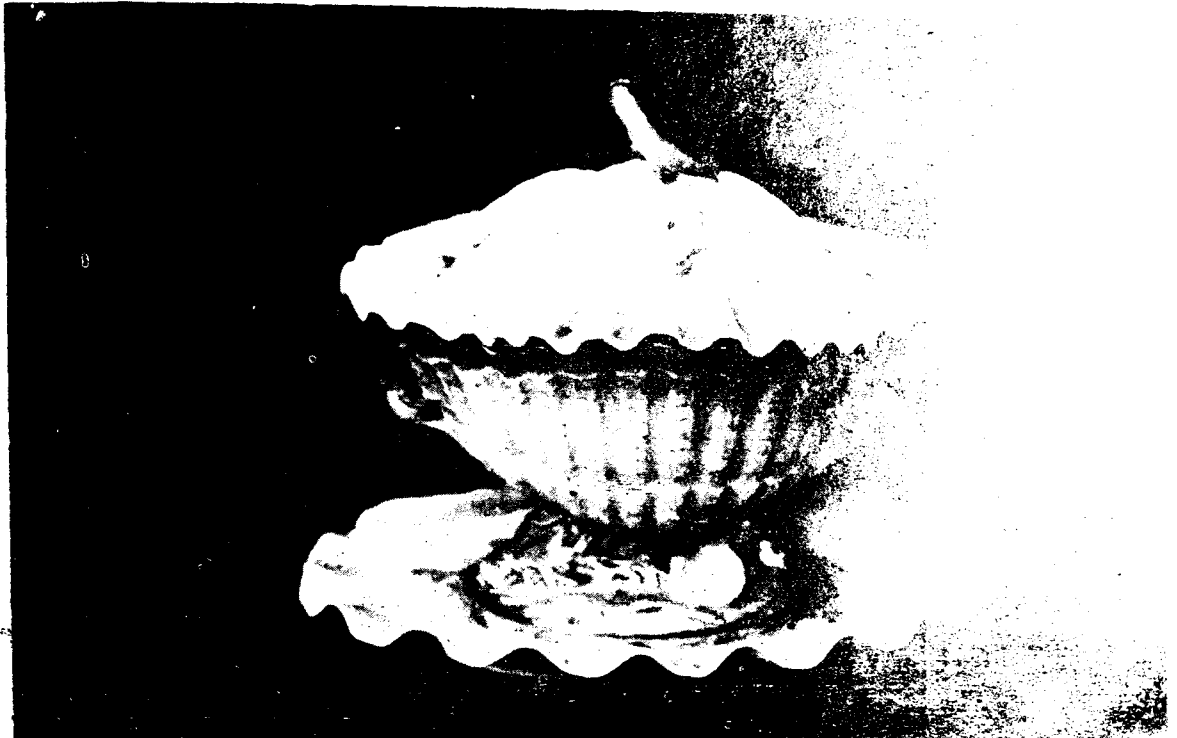
Resim : 11 — Padişaha sunulan Nevruziye Kâsesi