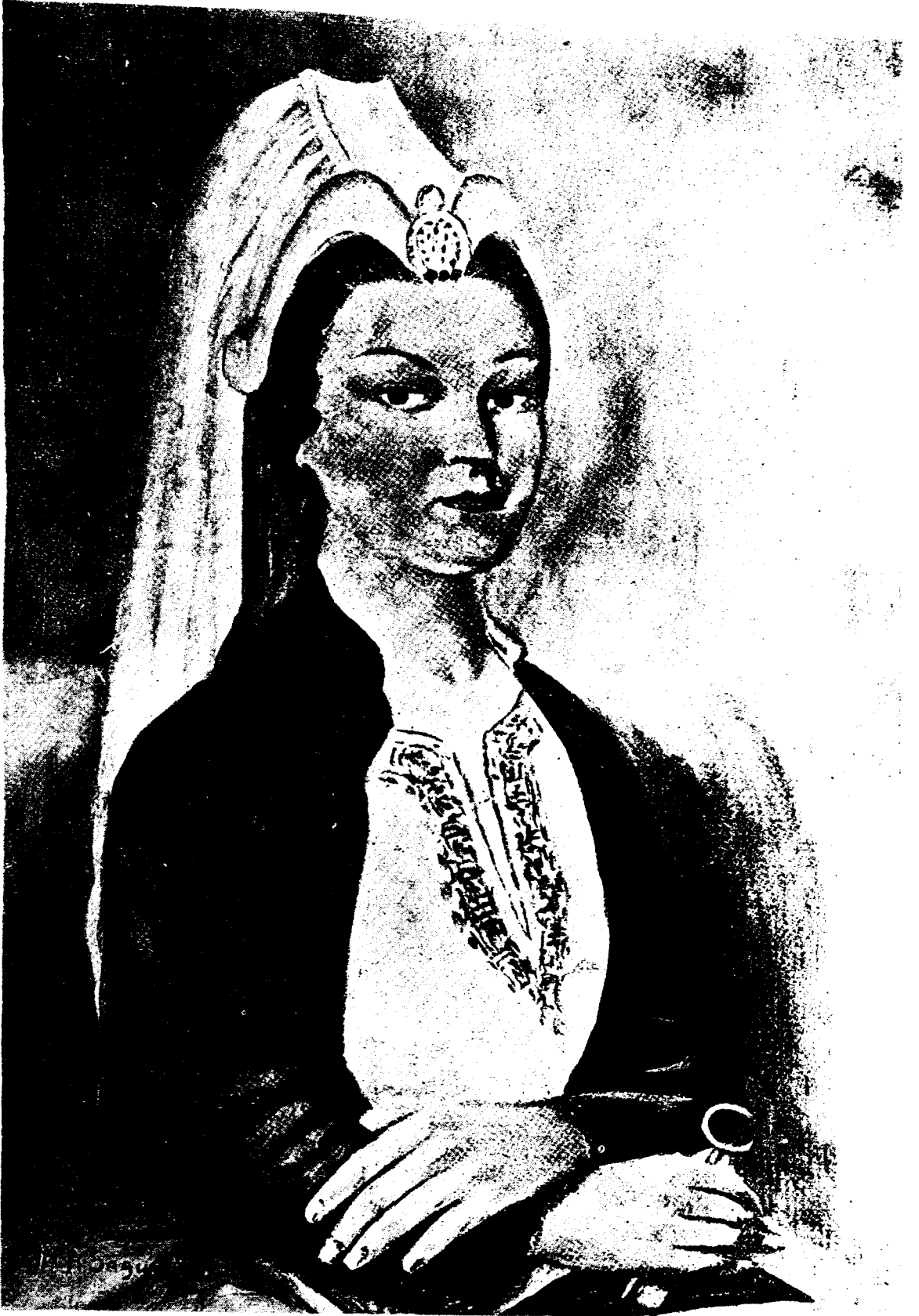
Resim : 1 — Kanuni Sultan Süleyman'ın annesi, Hafza Sultan.