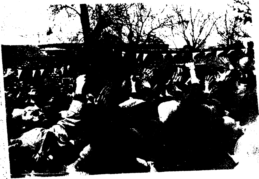
Resim : 5 — Şapkaları ile Mesir Macunu kapışmak isteyen bir grup