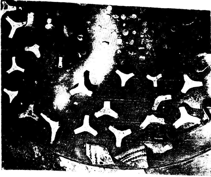
Resim : 6 — Üç ayaklar (saç ayağı)