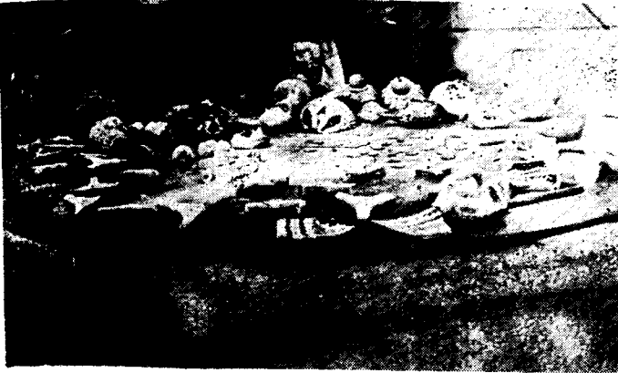
Resim : 3 — Küçük buluntular