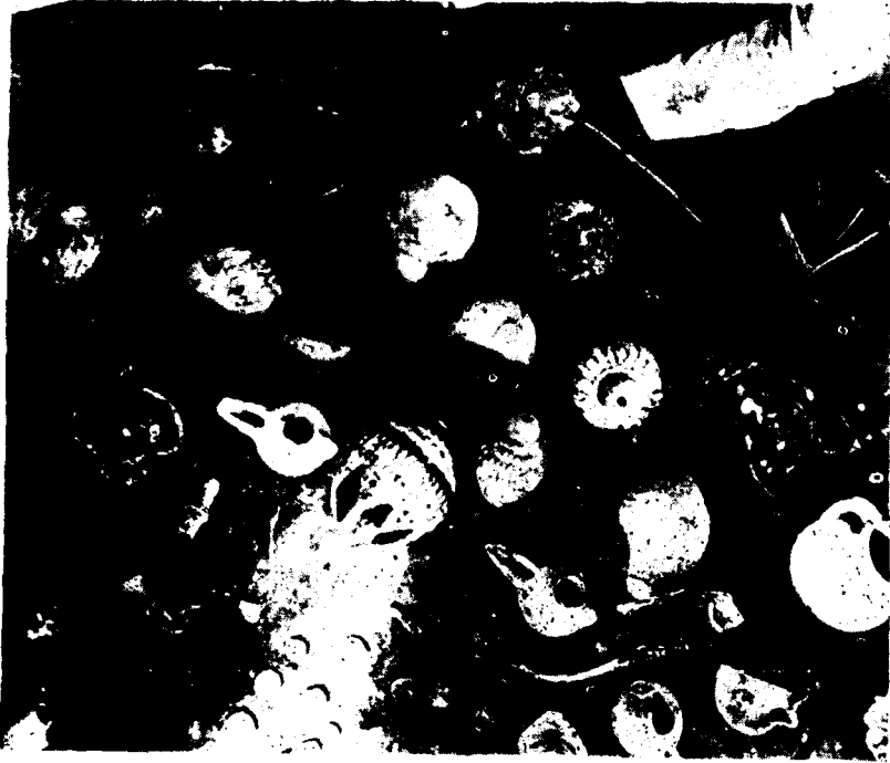
Resim : 5 — Kandillerden üçünün görünüşü