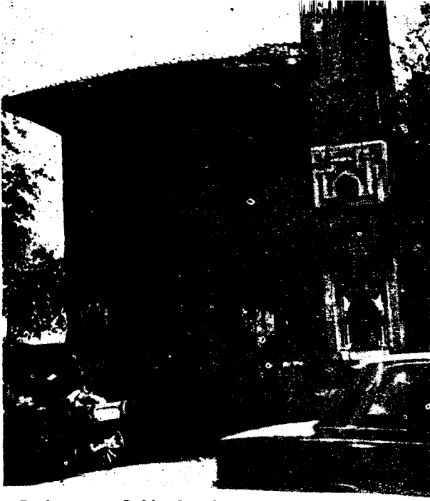
Resim : 1 — Sahip Ata Camii giriş portalinden