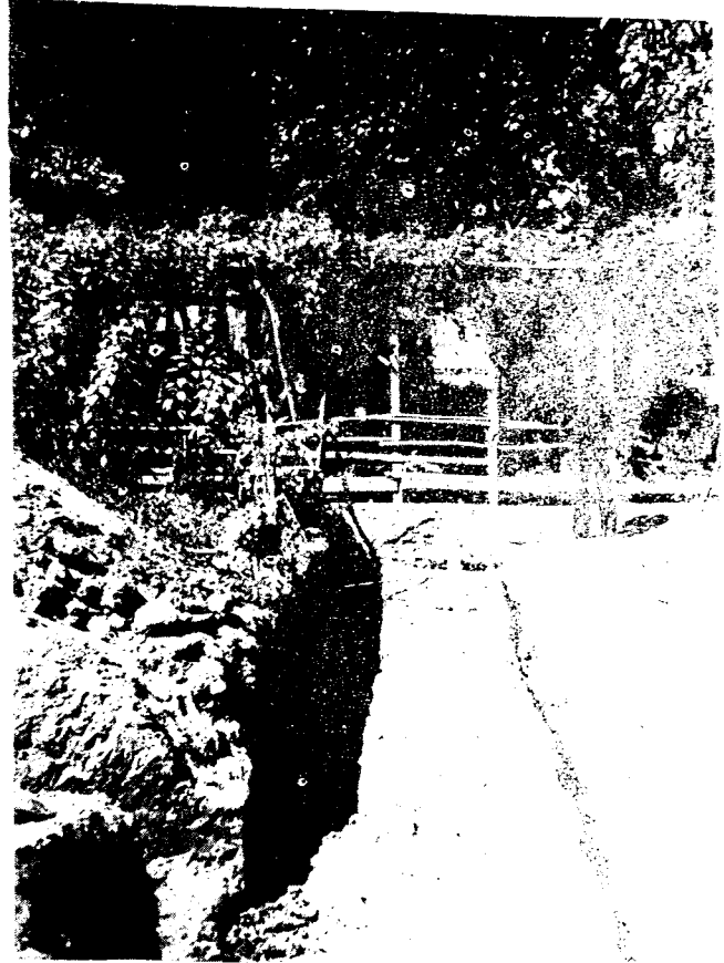
Resim : 2 — Araştırılan yerlerden bir yarma ve bir görünüş