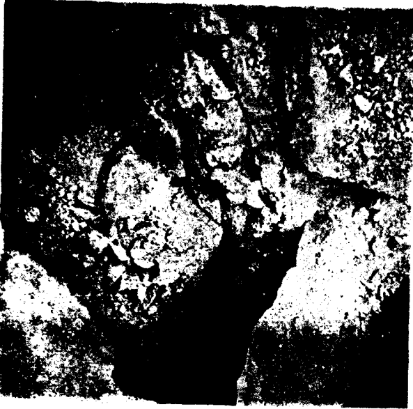
Resim 9 — Üç metre derinlikte bulunan mezarın görünüşü