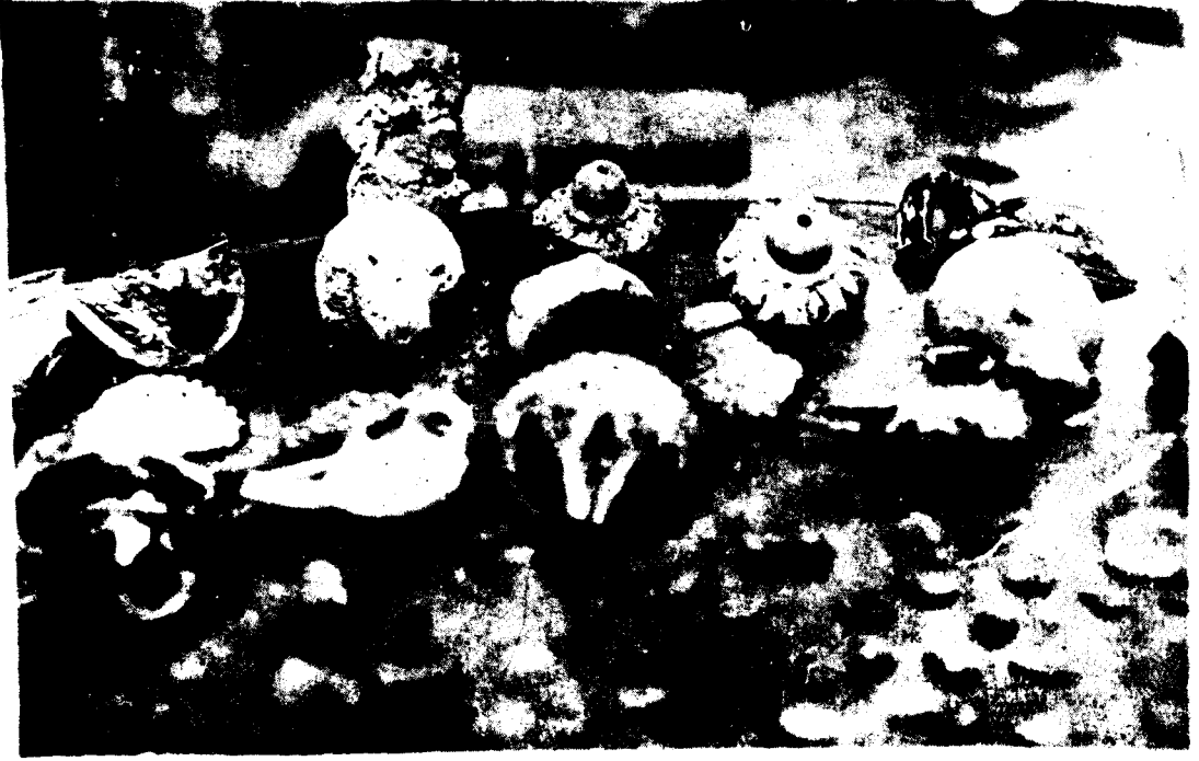
Resim : 4 — Geniş gövdeli ilâç veya yağdanlık parçalarından motifler