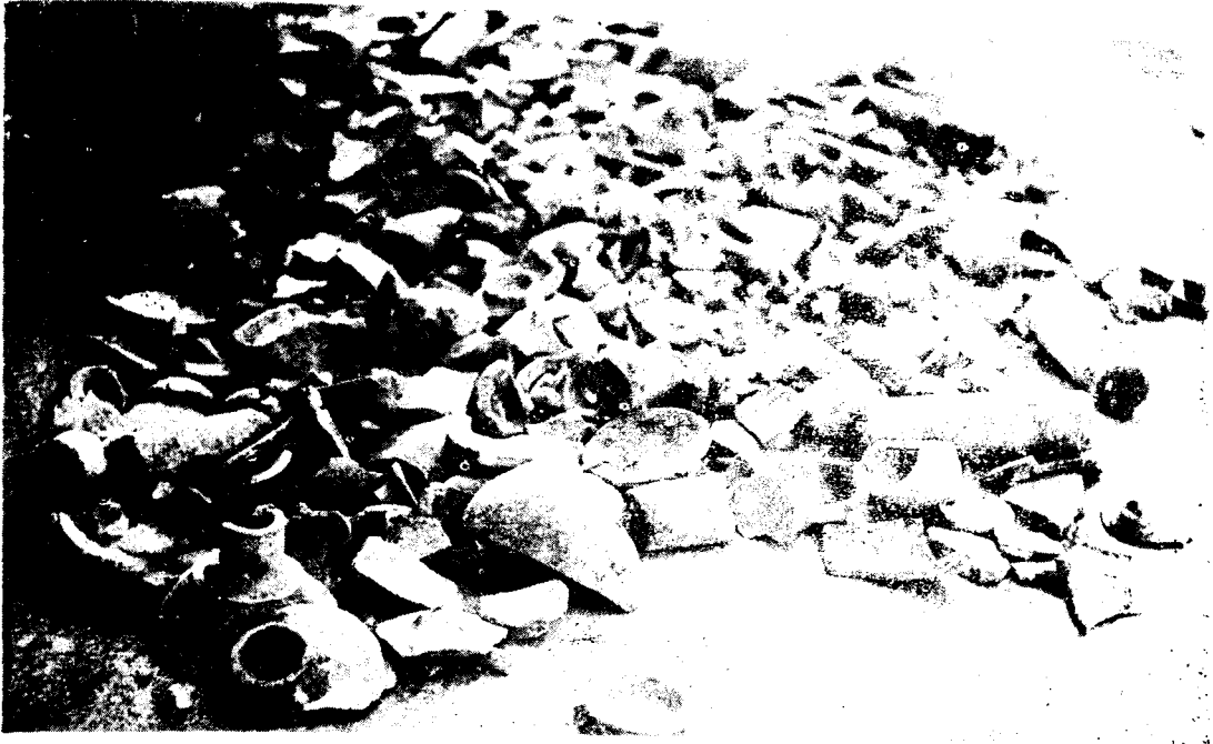
Resim : 7 — Kırık oldukları için atılan yüzlerce seramik parçası ve pişmiş optak çubuklar