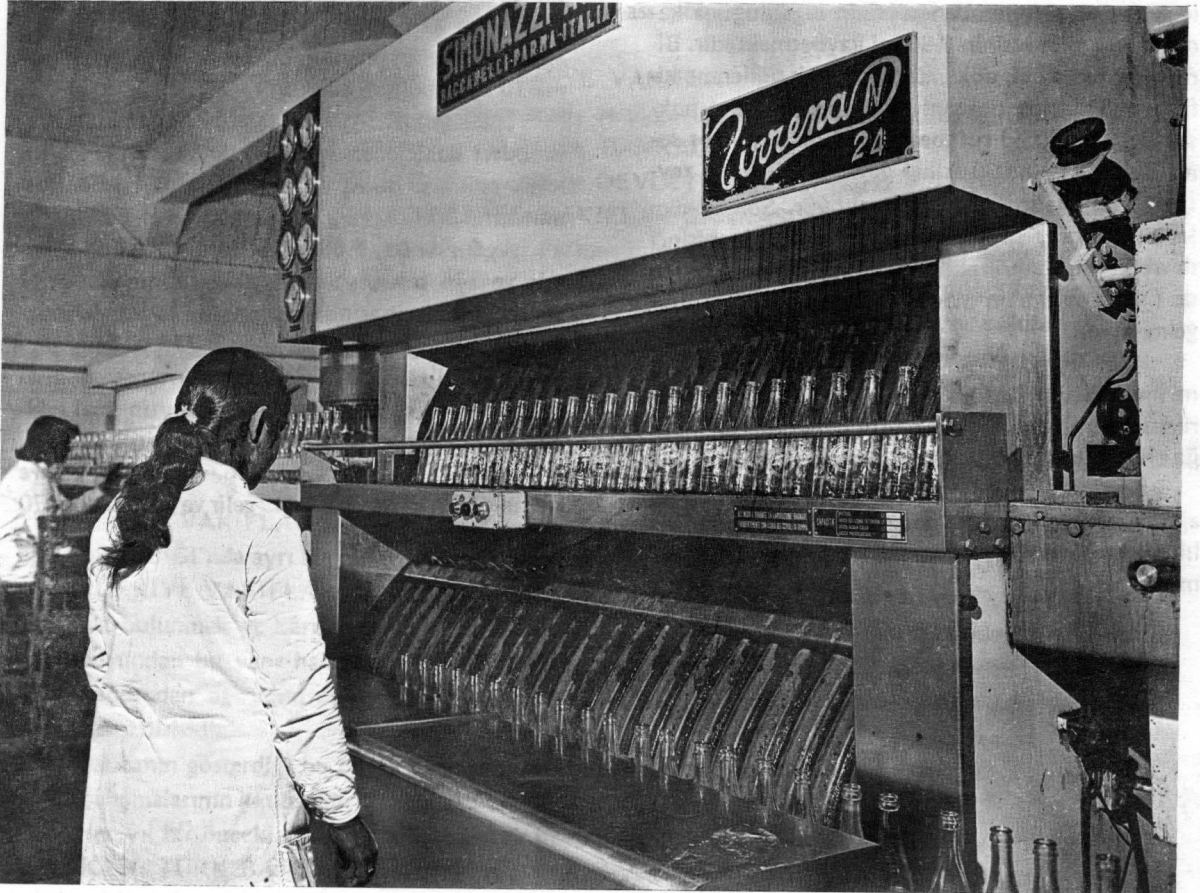
İstanbul Taşdelen Memba Suları İşletmesi, Şişeleme Ünitesi