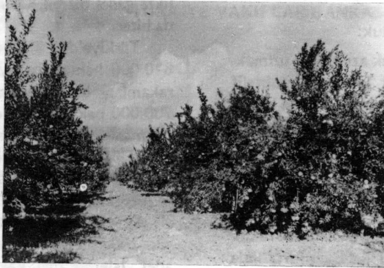
Antalya Murad Paşa Narenciye bahçelerinde mandalin fidanlığı