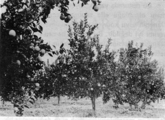
Antalya Murad Paşa Narenciye bahçelerinde portakal fidanlığı