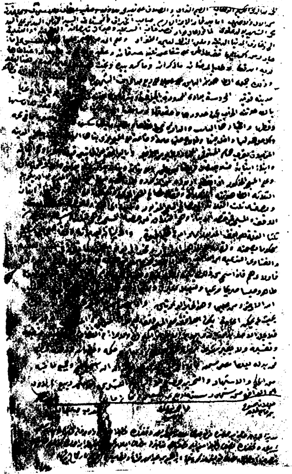
Res. 2 — Alevi Sultan Vakfiyesi sureti (Konya Vakıflar Md. Vakfiye Defterleri C. I, S. 84)