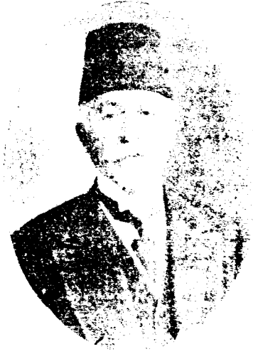
MEHMET FEVZİ PAŞA

Kâmil Paşa'nın dördüncü Sadrazamlığı döneminde 18 Zilkade H.1330 / M.1911'de Evkaf-ı Hümayun Nazırı olmuştur.Kabinenin düşmesi üzerine 15 Safer H.1331 / M.1911'de Nazırlık görevinden ayrılmıştır.