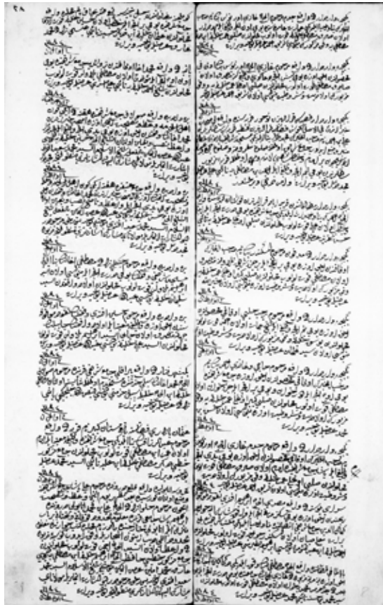
Mahlû Hurûfât Defteri 1202, s. 8-9