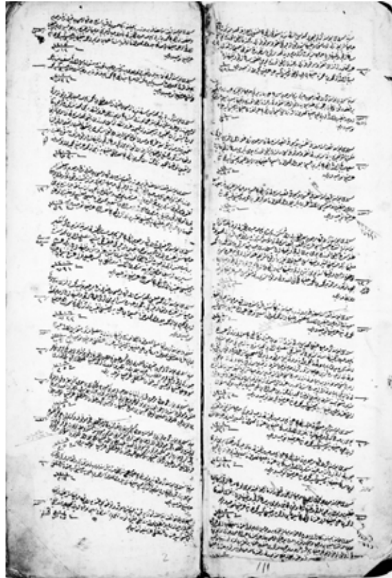
Hurûfât Defteri 1184, s. 1-2