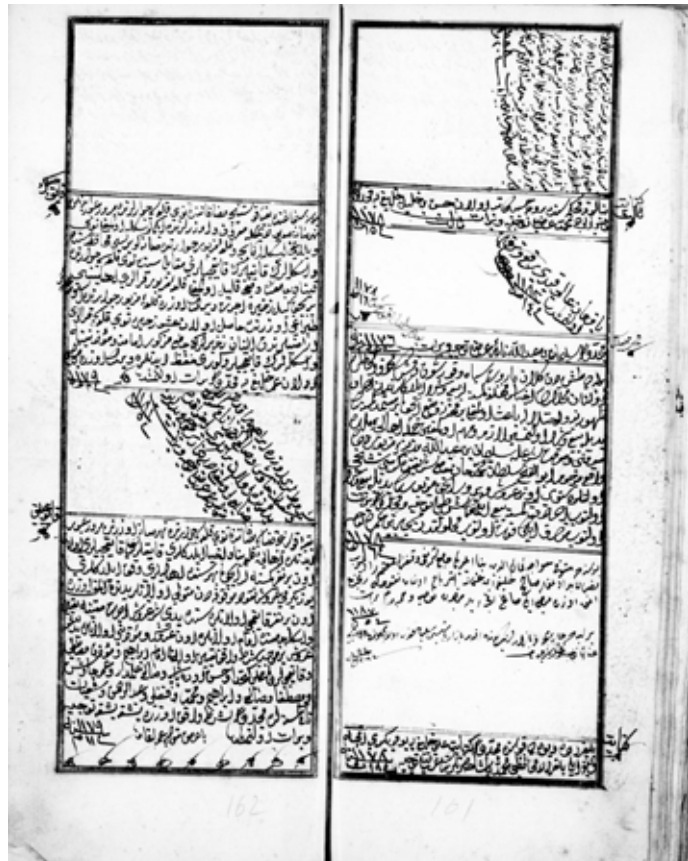
Hurûfât Defteri 1186, s. 161-162