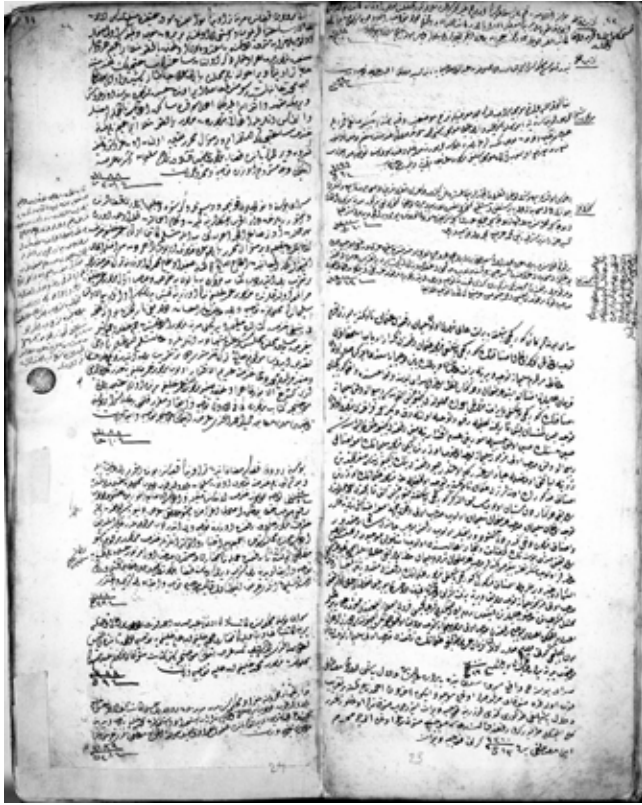
Hurûfât Defteri 1174, s. 23-24