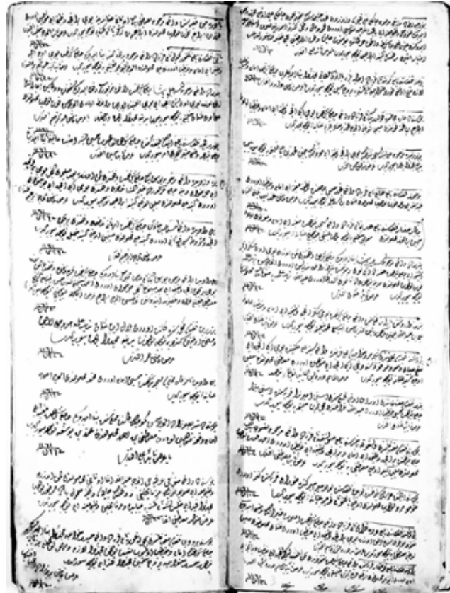
Hurûfât Defteri 1164, s. 3-4