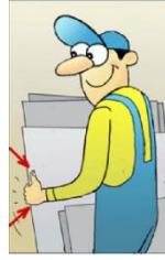
Şekil 3. Keskin köşeli malzemenin KKD'siz tutulduğu göstermektedir.