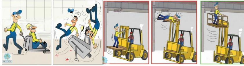
Şekil 4. Çalışanların hatalı davranış örnekleri.

davranışları önemli bir etkidir. Amirlerin yetkin olmayan görevleri yapan çalışanları uarması ve hatta işten men etmesi gereklidir (Şekil 4).