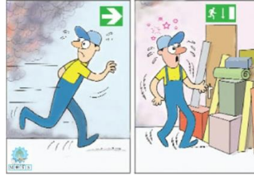
Şekil 6. Uygun olmayan acil çıkışlar