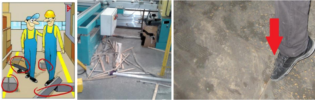
Şekil 2. Soldan sağa doğru ilk iki resim çalışma ortamının uygun olmadığını, üçüncü resim de çalışma zemininin uygun olmadığını göstermektedir.

Çalışma zemini ve etrafının temizliğinin ve bakımlarının düzenli olarak yapılması büyük önem arz etmektedir. Bakımsız zeminler (özellikle profil yüklü sepetlerin hareket ettirilmesinde) çalışanların işlerini zorlaştırmaktadır. Pis ve dağınık çalışma ortamları çalışanlarda psikolojik olarak yıpranmalara ve dikkat dağınıklığına da neden olmaktadır. Zeminde bulunan yabancı maddeler (yağ, alüminyum iş parçası, kalıp, vb.) çalışanların takılıp düşmelerine veya ayaklarına batmalarına neden olabilir. Çalışma zeminin bakımlarının düzenli yapılması ve çalışma sahasının temizlenmesi için bir personelin görevlendirilmesi, haftalık bakımlar arasına temizlik çalışmalarının da eklenmesi yapılabilir (Şekil 2).