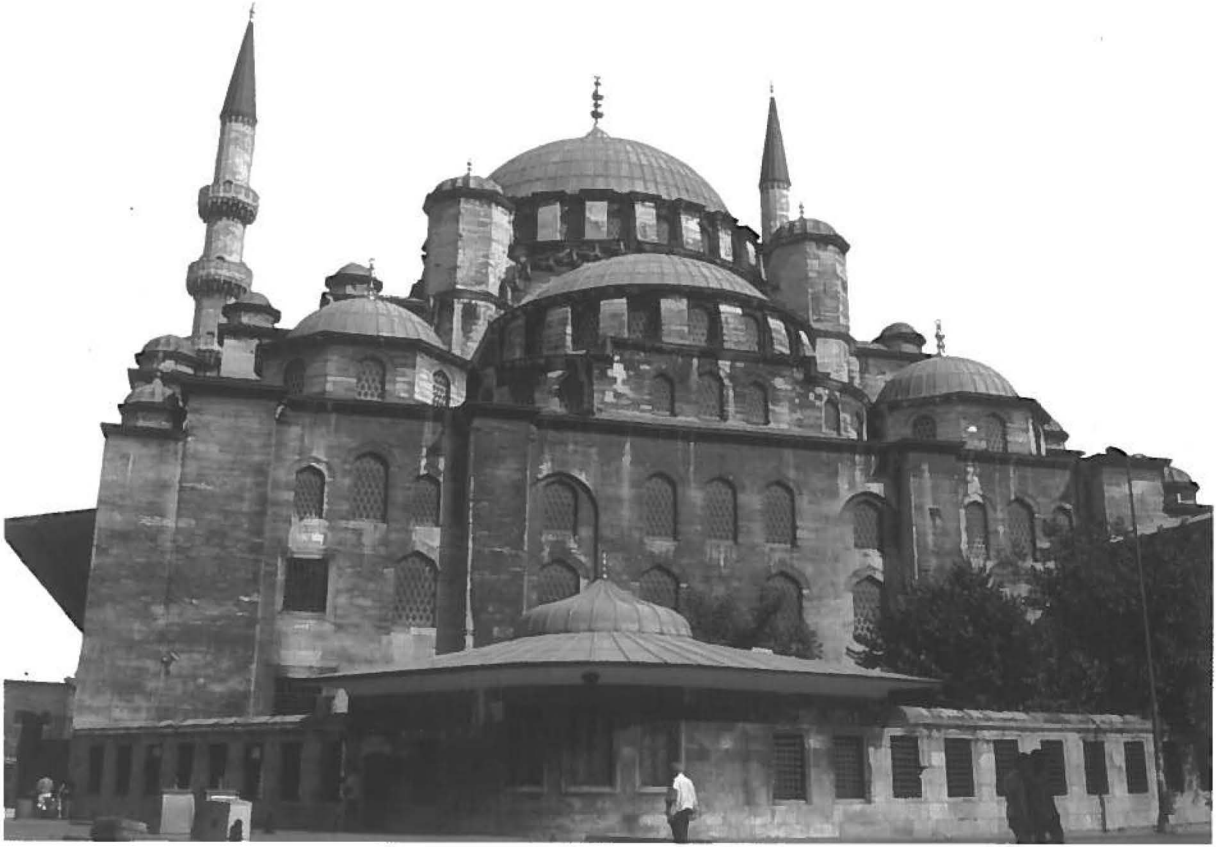
Görsel 3 - Yeni Cami Külliyesi Arka Cepheden Görünüş

İstanbul'daki imar faaliyetleri Sultan II. Abdülhamid'in saltanatının özellikle son devirlerinde devam etmiştir. Bunun için eski Paris Sefiri Salih Münir Çorlu'dan imarla ilgili çalışmalar yapması istenmiş o da Paris Belediyesi baş mühendisi Buvar'la anlaşarak imar planları yaptırmıştır. 1912'de elektrikli tramvay İstanbul'a gelince tramvay geçen yolların on beş metre genişliğinde parke taşıyla döşenmesi istenmiştir. Bu suretle sokakların çehresi değişmiştir. Eminönü, Bahçekapısı ve Alemdar Caddesi'nde