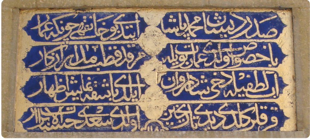
Resim 1. Şeyh Şaban Veli Külliyesi'nin Tamir Kitabesi (1778)