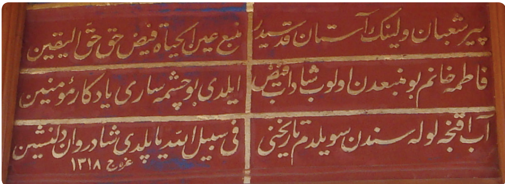
Resim 3. Şeyh Şaban Veli Külliyesi'nde Fatıma Hanım'ın Yaptırdığı Şadırvanın Kitabesi (1900)