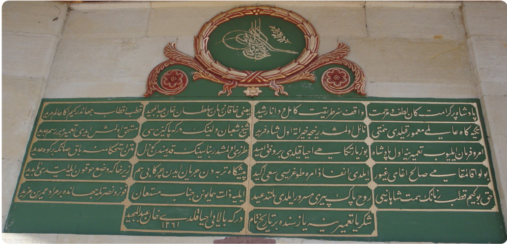
Resim 2. Şeyh Şaban Veli Külliyesi'nin Tamir Kitabesi (1845)