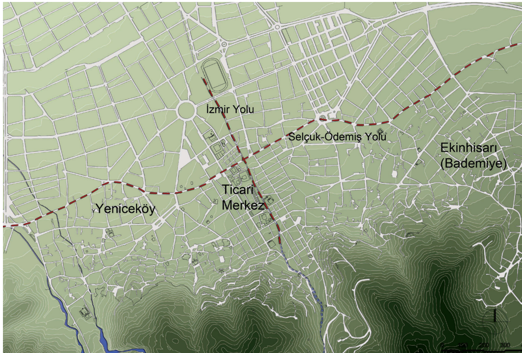
Şekil 1. Tire kent planı (yollar, topoğrafya ve yerleşim bölgeleri işlenmiştir)