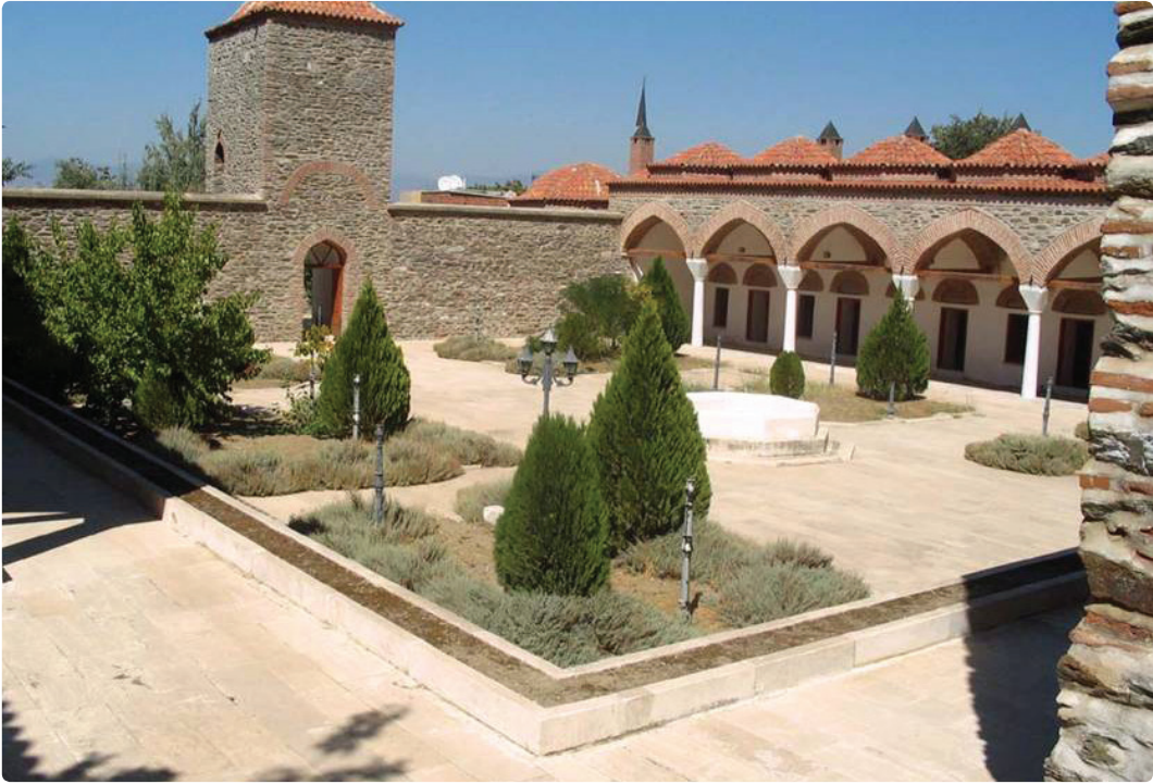
Resim 2. Yavukluoğlu Külliyesi, avludan medrese odaları, rasathane