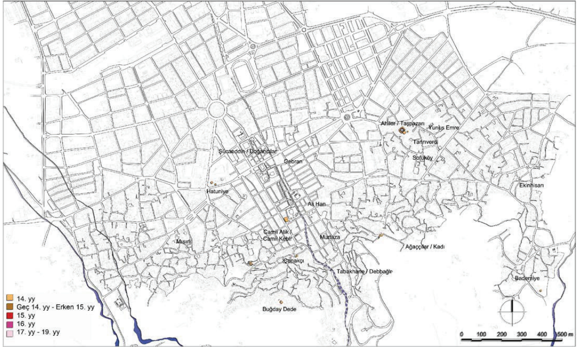
Şekil 2. Birinci Aydınöğulları döneminde mahallelerin dağılımı