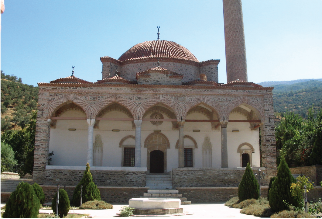
Resim 1. Yavukluoğlu Külliyesi, Cami