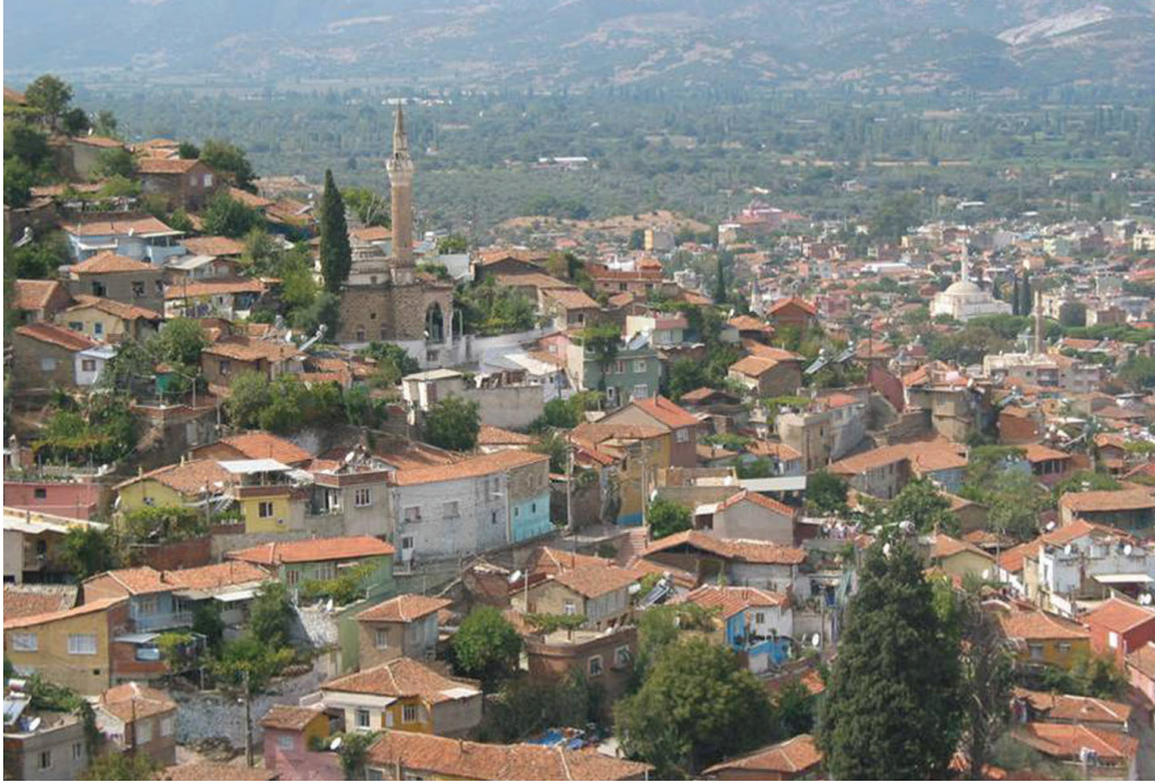
Resim 3. Tire, genel görünüm