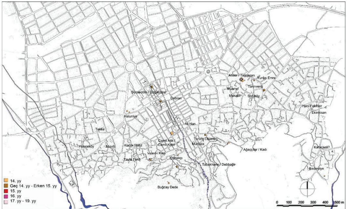
Şekil 3. İkinci Aydınöğulları dönemi mahallelerin dağılımı