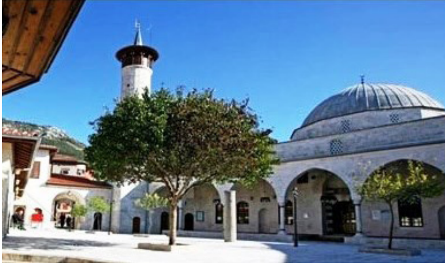
Resim 1. Habîbü'n-Neccâr Camii