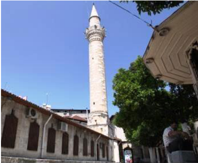
Resim 2. Ulu Camii