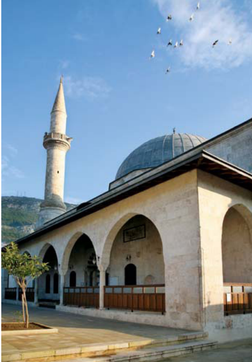
Resim 3. Şeyh Ali Camii