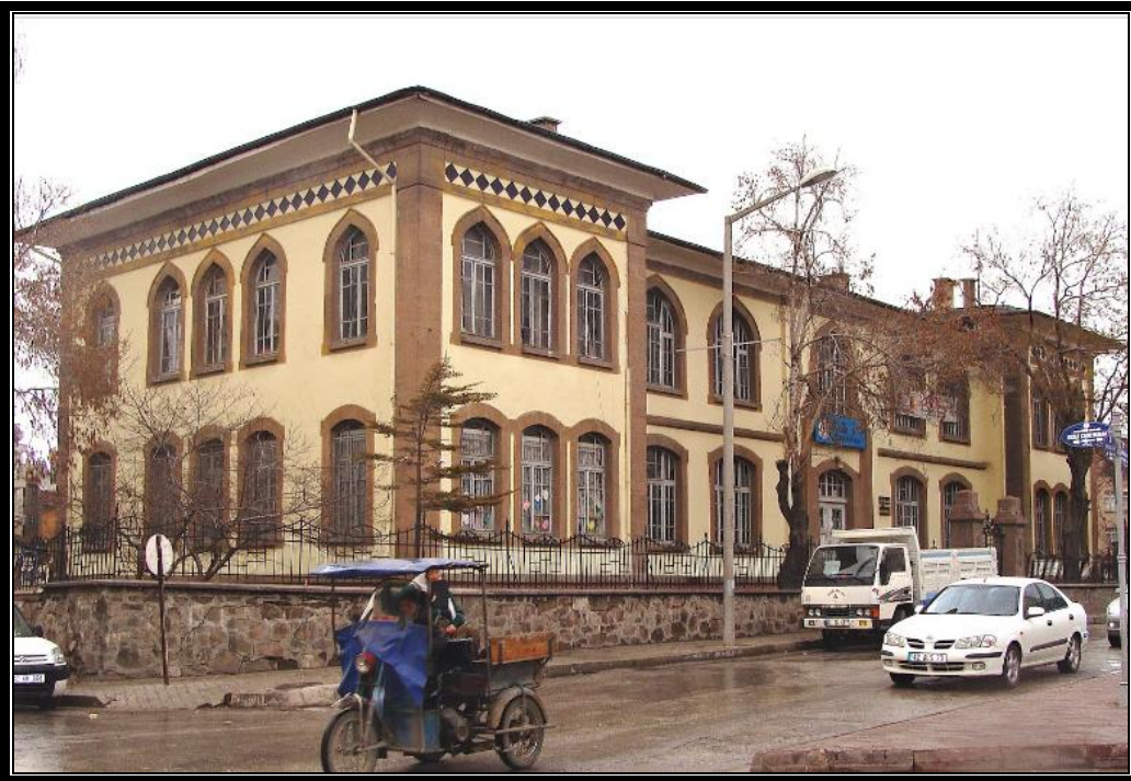
Şekil 2 Ön ve Yan cephe