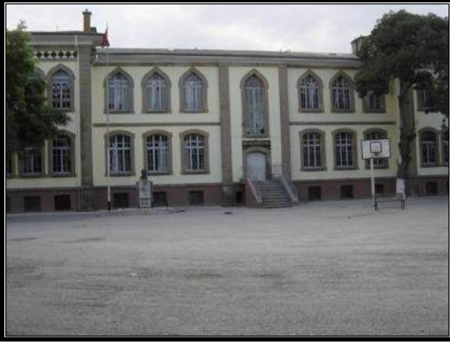
Şekil 3 Arka Bahçe Cephesi