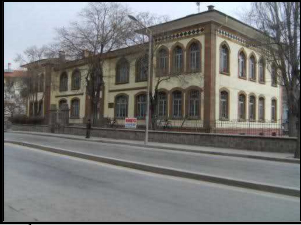
Şekil 1 Ön Cephe

yapıya ilişkin görsel malzemenin listesi ve sağlanabilen örnekler: