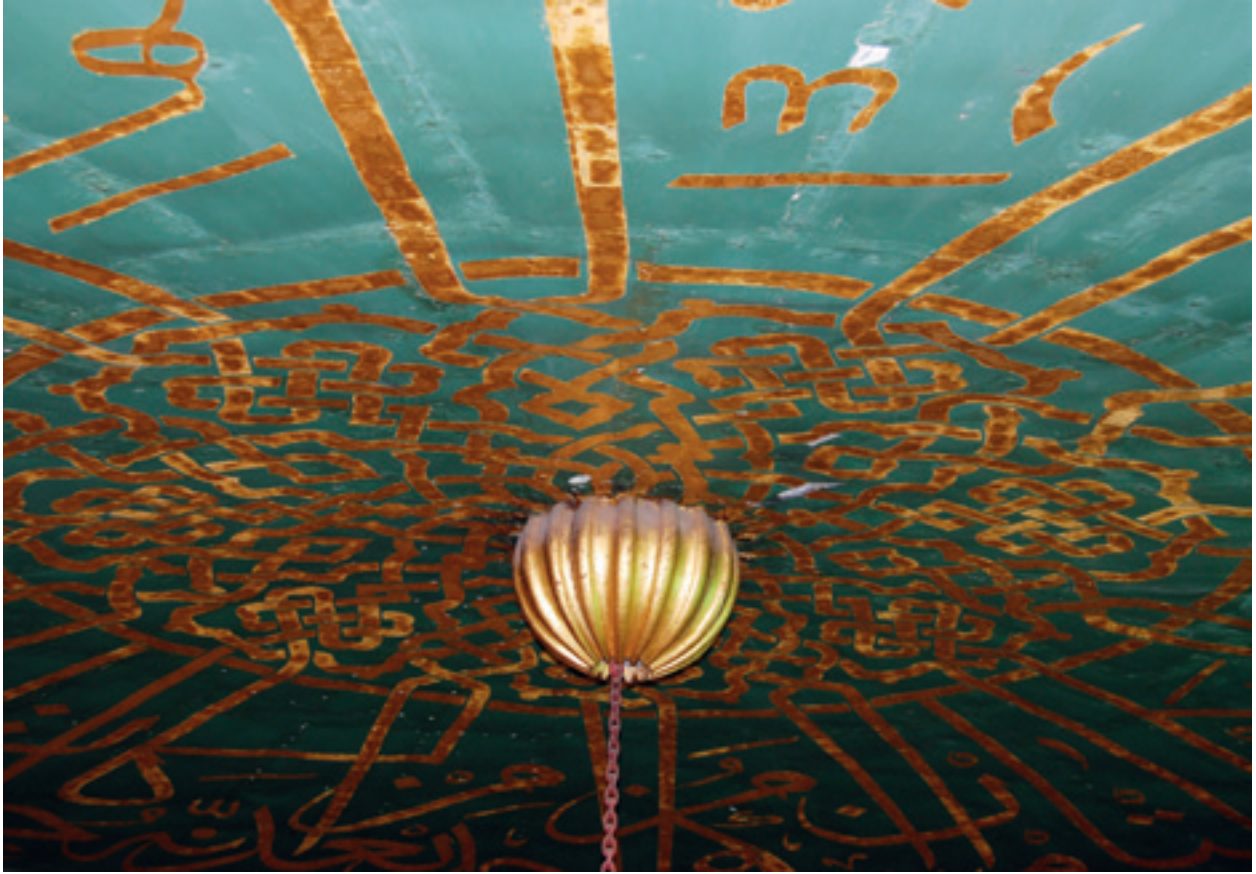
Fotoğraf 4 Restorasyon çalışmaları esnasında ana kubbe göbeği (M.Sav,2008)

mümkün müdür, herif başı korkusundan aklını aldırıldı. Çağırıp siz de sual ediniz, sonra ahvâl müşkil olur” diye buyurdular. Saraya çağırdılar, çarçabuk vardım. Yine ağalar: “Bina ne zaman tamam olur?” dediklerinde, padişah hazretlerine iki ayda tamam olur diye söz verdim, dedim. Şahitler tuttular: “İnşallahü Teâlâ iki ayda tamam edip, tarihte de bir nam koyam” dedim. Bu çeşit cevap verince ağalar padişaha arz edip derler ki: “Saâdetli padişahım! Herife gayret düşmüş, inşallah akli başındadır. Kendisinde bu ihtimam ve gayret varken, pek yakında caminizde namaz kılmak nasip olur.”