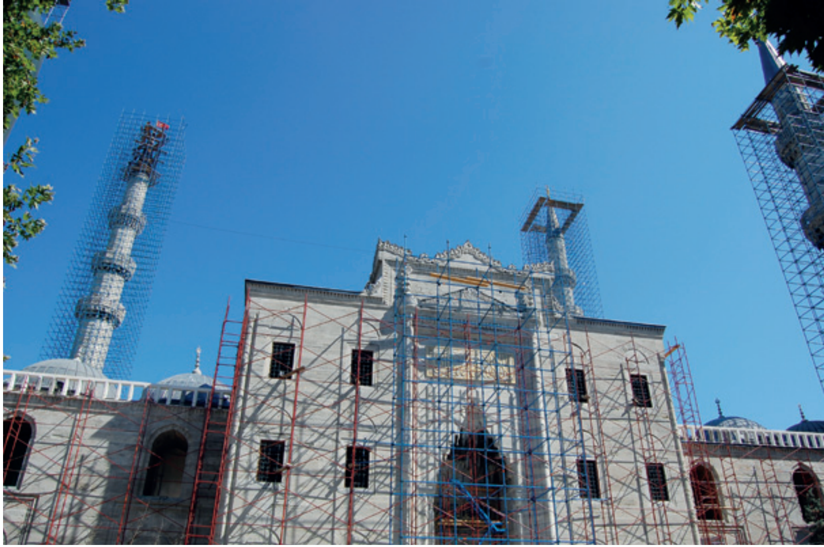
Restorasyon sırasında avlu taç kapısı

Şeyhülislâm Ebussuud Efendi'nin külliyesinin merkezini teşkil eden caminin mihrap duvarı temeline ilk taşı koymasıyla sembolik olarak başlayan inşaat, toprak üzerine dökülen kireç çizgilerle belirlenmiş bir plana göre yürütülmekteydi 2 . Açılan hendeklere temeller oturtulmaya başlanmış, fakat duvarların örülmesi bekletilmiştir. Eğer bu yapı, iç mekânda kubbeyi destekleyen bağımsız ayaklara ihtiyaç göstermeyen küçük bir bina olsaydı, aynı zamanda taşıyıcı olan duvarlar hızla örülüp iş bitirilirdi. Sınırlayıcı duvarların inşasını bir süre bekleten başlıca sorun iç mekândaki büyük desteklerin örülmesi, daha da önemlisi büyük sütun gövdelerinin dikilmesiydi.