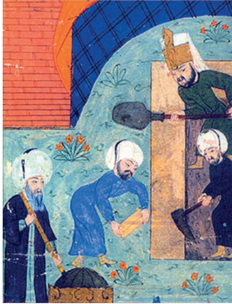
Şekil 3 Tarih-i Sultan Süleyman adlı eserde sultanın cenazesinden ayrıntı

alınması gerektiği, bir yamaç sırtında yer alacak binanın görece uzunlamasına inşa edilmesi gerektiği, Haliç'ten bakılınca haklılık kazanmaktadır. Bu noktaya oturan bir camide, Şehzade şeması uygulanamazdı. Minareler dahil her unsur, bugünkü görünüşüyle de tepe silüeti ve kütle duruşunu onaylamaktadır.