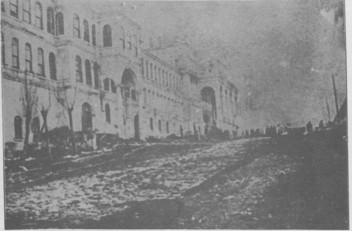
RESİM - 1 : Evrak-ı Resmîyenin yangından kurtuluşu.