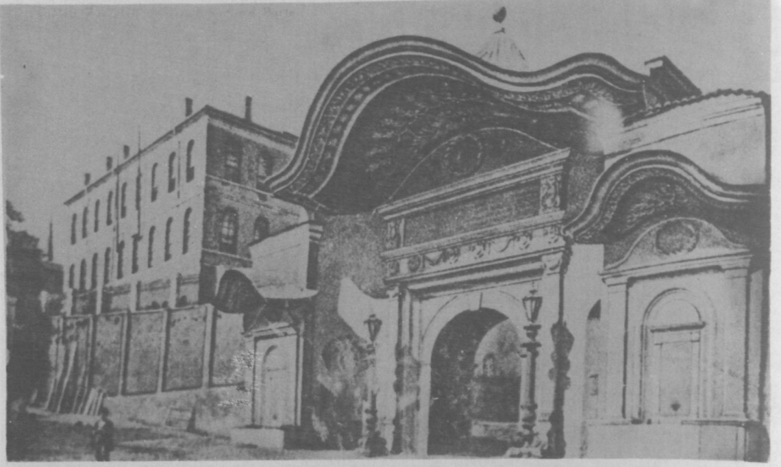
RESİM - 3 : Devlet Arşivleri Binası giriş kapısı