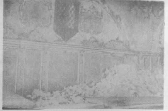
RESİM - 5 : Topkapı Sarayı Kubbe Altı evrak odası.