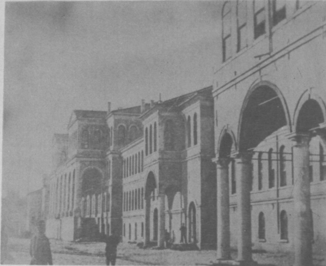
RESİM - 6 : Devlet Arşivleri Binası.