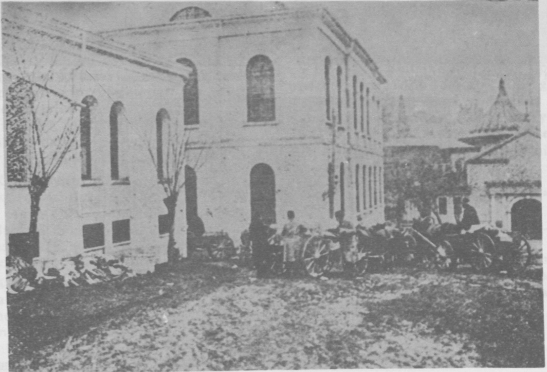
RESİM - 2 : Evrak-ı Resmîyenin yangından kurtuluşu.