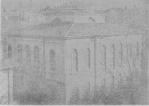
RESİM - 4 : Arşiv'in 1. nolu deposu