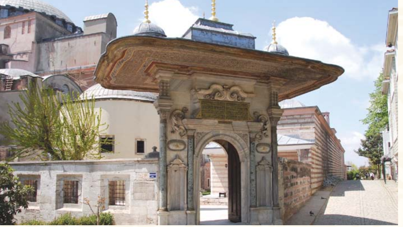
Resim 1 - Halı Müzesinin yeni binası Ayasofya İmaretı Girişı

B aşbakanlık Vakıflar Genel Müdürlüğüne bağlı Halı Müzesi, ilk olarak 13 Nisan 1979 tarihinde Sultanahmet Camii'nin Hünkâr Kasrı binasında Türkiye'nin tek Halı Müzesi olarak ziyarete açılmıştır. Dünyanın en zengin halı koleksiyonlarından birine sahip olan müzenin, çağdaş ve modern dünya müzelerinden geri kalmamak ve yeniden yapılandırılmak amacıyla çağdaş müzecilik sistemine uygun olarak 1742-43 tarihinde dönemin padişahı I.Mahmut tarafından yaptırılan Ayasofya