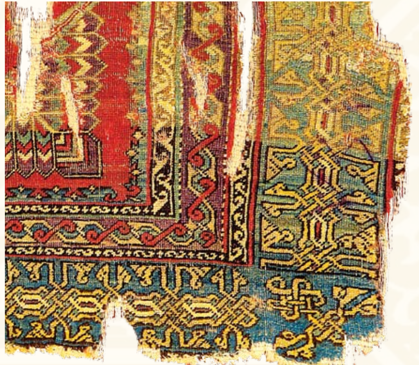
Resim 7- A.217 envanter numaralı 13.yy. Selçuklu Halısı.