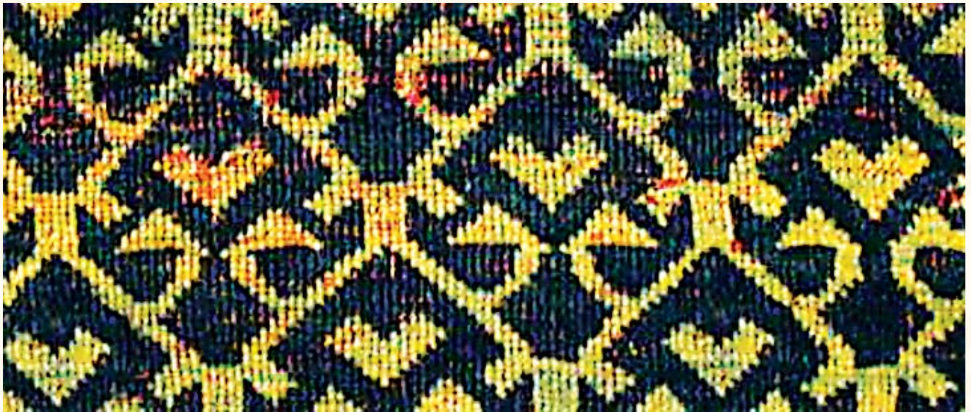
Resim 14- Türk İslam Eserleri Müzesinde bulunan 13.yy. Selçuklu halısından detay.v

Halının zeminini kaplayan küçük sekizgen motifler, I. Grup Holbein halılarına benzemektedir. Aslında bunlar birbirine dü-