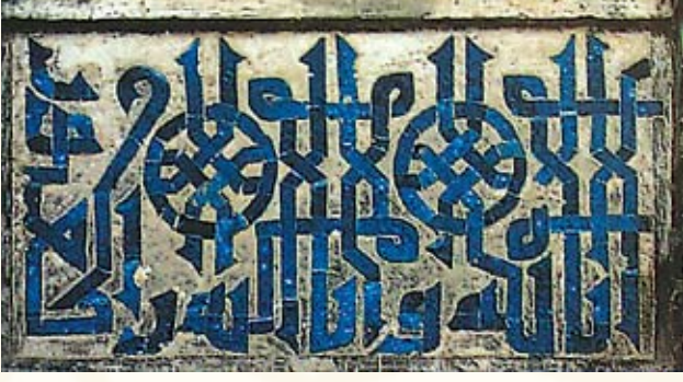
Resim 5- Sivas İzzeddin Keykavus Türbesinden çini detay(13.yy.başı)