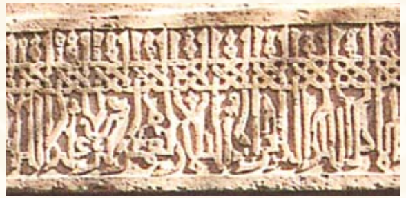
Resim 17- Niksar Kulak Kümbet kapı alınlığından detay.(13.yy. Selçuklu)