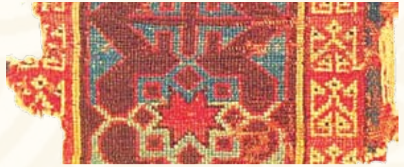
Resim 16- Konya Etnografya Müzesinde bulunan 13.yy.Beyşehir Selçuklu halısından detay