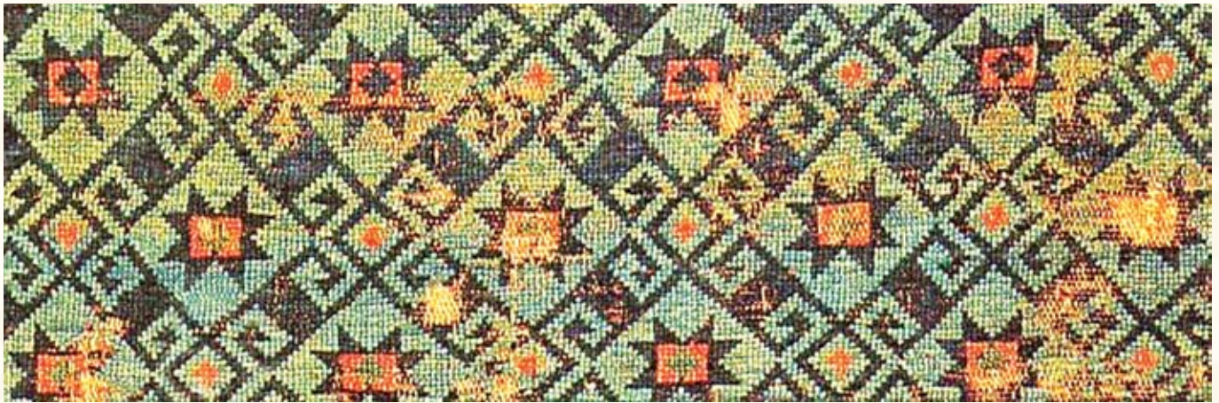
Resim 12- Konya Etnografya Müzesinde bulunan 13-14.yy. Beyşehir Selçuklu halısı.

Bu halının bordüründeki motifler de Selçuklu küfi geleneğinin devamında geç dönemde uyarlanmıştır. Daha önceki müze envanter bilgileri ve yayınlarda 14 ve 15.yüzyıllara tarihlendirilen halı, Selçuklu mimari bezeme unsurları ve diğer dünya müzelerindeki benzer halı örnekleriyle karşılaştırma yapılarak yeniden değerlendirilmiş ve 13.yüzyıl sonu 14.yüzyıl başına tarihlendirilmesi uygun görülmüştür. Nitekim, halının zemin kompozisyonu Konya Etnografya Müzesinde bulunan (Resim-12) 13.yüzyıl Beyşehir Selçuklu halısıyla benzerlik gösterir. 3