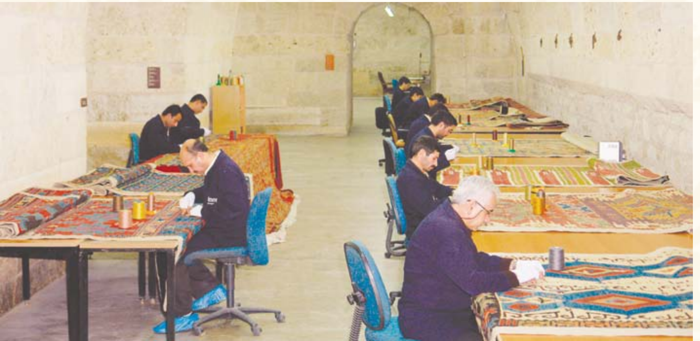
Resim 2- Halı Müzesi Konservasyon Atölyesi

Müzenin zengin koleksiyonunu, Selçuklu ve Osmanlılar döneminde eski bir İslam geleneği ile cami, türbe ve külliyele-