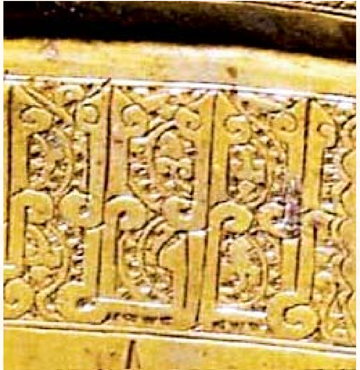
Resim 10- Tiflis Tarih Müzesinde bulunan Selçuklu Şamdanında küfi detay (12.yy.)