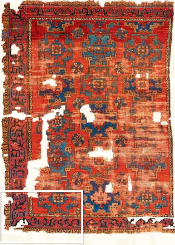
Resim 15- A.305 envanter numaralı 13-14.yy. Selçuklu halısı

ğümlemiş, mücadele eder şekilde verilmiş iki ejder figürüdür. Ejder mücadelesi tasviri uzak doğu kaynaklı olup sembolik olarak gökyüzünde bulutların çarpışmasını, şimşek oluşmasını ve bereketli yağmurların başlamasını, dolayısıyla baharın gelişini anlatmaktadır.