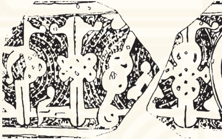
Resim 8 - Cizre Ulu Cami kapı kaplama motiflerinden detay(12.yy.sonu)

Örneğin 1217 tarihli Sivas'taki İzzettin Keykavus Türbesinin pencere alınlıklarındaki çini panolarda görülen motifin aynısı bu halımızın bordüründe de görülmektedir.(Resim-5) Ayrıca Tokat, Kayseri, Konya ve Aksaray'daki Selçuklu mimari bezemelerinin benzerlerini A.344 envanter numaralı halının desenlerinde de görmekteyiz. Örneğin Tokat Sümbül Baba Darüssülehasının(12. yy.sonları) taç kapısının iki yanındaki silmelerde görülen örgülü küfi işleme ile halımız bordüründeki küfi işleme arasında da benzerlik dikkati çeker.(Resim-6) Daha önceleri müze kayıtlarında ve yayınlarda bazı araştırmacılar tarafından 15.yüzyıla tarihlendirilen ve Memluk sanatı etkisinde dokunduğu ve bağlantılı