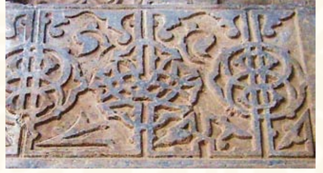
Resim 6- Tokat Sümbül Baba Darü'ssülehasından detay(12.yy.sonu)

da yeni bir sanat üslubunu doğurur. Kökeni Orta Asya ve Uzak Doğu'ya dayanan hayvan figürlü halılar görülmeye başlanır. 14 ve 15.yüzyıl boyunca Anadolu'da dokunan hayvan figürlü halılar Crivelli, Carpaccio, Ferrara, Lorenzetti, Huguet ve Buonacorso gibi Avrupalı ressamın tablolarında resmedilmiştir.