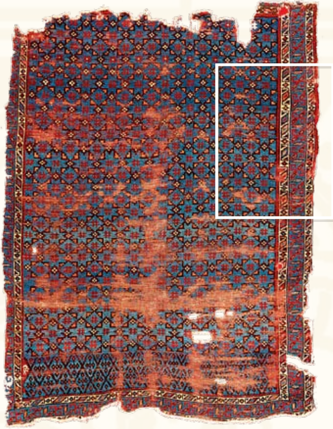
Resim 11- A.85 envanter numaralı 13-14.yy. Selçuklu Halısı.

olarak yapılmış palmete benzer uzantılar Orta Asya'da Salur gölünde de bulunur. Sembolik anlam taşıyan Orta Asya etkili bu motif kaynak olarak, mimariden etkilenmektedir. Belki de mimarların çizimleri haliya uyarlanmıştır. Burada kare planlı bir yapıda sekizgen kasnak ve kubbe ile köşelerdeki dolgularla tromplu geçişler anlatılmaktadır. Halıda dikkati çeken en önemli özellik, Selçukluların karakteristik özelliği olan küfi yazı dekorudur. Halını bordüründe görülen küfi yazı dekorunun aynı ve benzerlerini, Konya, Sivas, Tokat, Erzurum ve Kayseri'deki Selçuklu mimari bezeme unsurlarında da görmek mümkündür.