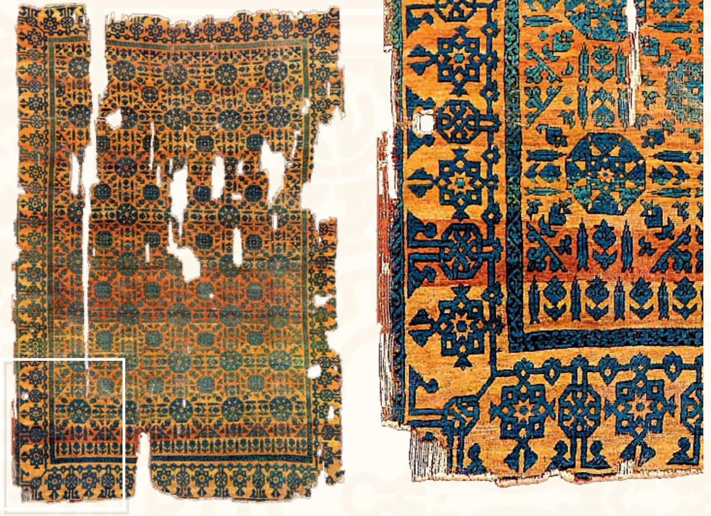
Resim 4- A.344 envanter numaralı 13.yy. Selçuklu Halısı.

sına tarihlenen Orta Asya'daki ' Pazırık Kurganı ' adı verilen mezarda ele geçmiştir. Yine Doğu Türkistan'da M.S. 3 ve 5. yüzyıllara tarihlenen halı parçaları bulunmuştur. Mısır ve Irak'ta da 8 ve 10. yüzyıllar arasına tarihlenen İslam döneminin halı parçaları ele geçmiştir.