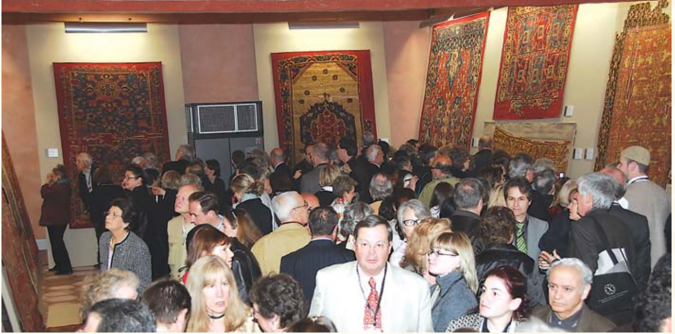
Resim 3 - 2007 Uluslararası Halı Konferansı Vakıflar Halı Sergisi

İnsanoğlunun günümüzden yaklaşık 10 bin yıl önce yerleşik hayata geçerek hayvanları evcilleştirmesiyle birlikte dokumacılık sanatı da doğup gelişmiştir. Dokumacılık ilk başlarda insanoğlunun gereksinimi sonucu doğmuş olsa da daha sonraları gelişip zenginleşerek ihtiyaç olmaktan çok, tüm yaşam biçiminde yer bulan sosyal ve sanatsal bir kimlik olmuştur. Dolayısıyla halı ve diğer dokuma yaygılar, toplumun kültürünü inanç geleneği ve göreneklerini yansıtan çok önemli belgelerdir. İnsanoğlu nasıl ki mezar taşlarına, dikili taşlara, abide ve sanat yapıtlarına inançlarını simgelemişlerse aynı şekilde bir takım sembollerle inanç ve geleneklerini halı ve kilimlere de aktarmışlardır.