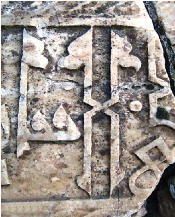
Resim 9- Tokat Müzesinde bulunan Selçuklu lahit kapağı (13.yy.)

tamamlayan köşebentler vardır. Büyük sekizgen madalyonun tam merkezinde sekiz kollu bir yıldız bulunur. (Resim-7) Yıldızın kolları uzatılarak çarkifelek oluşturulmuştur. Bunların etrafında yine bir sekizgen ve bunun dışında iki sıra yörüngesinde dönen sekiz kollu yıldızlar bulunur. Burada da güneş ve etrafında yörüngelerinde dönen yıldızların oluşturduğu diagramla "Allah" anıldığı düşünülmektedir. Daha dıştaki sarı-lacivert şaşırtmalı