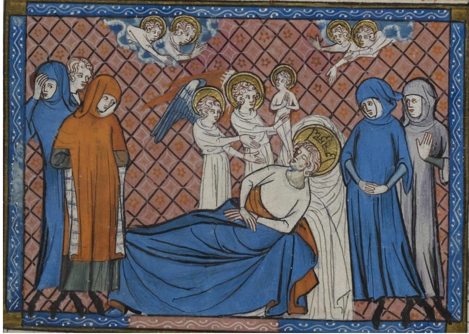
EK-9 Fransa Kralı Aziz Louis'nin ölümü.