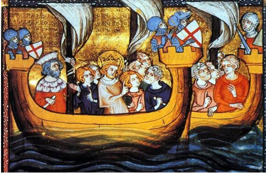
EK-6 Aziz Louis'nin Haçlı Seferi yolculuğu. (www.usu.edu.com)