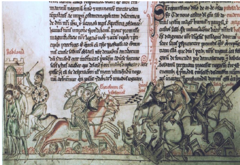
EK-3 La Forbie (Gazze) savaşı