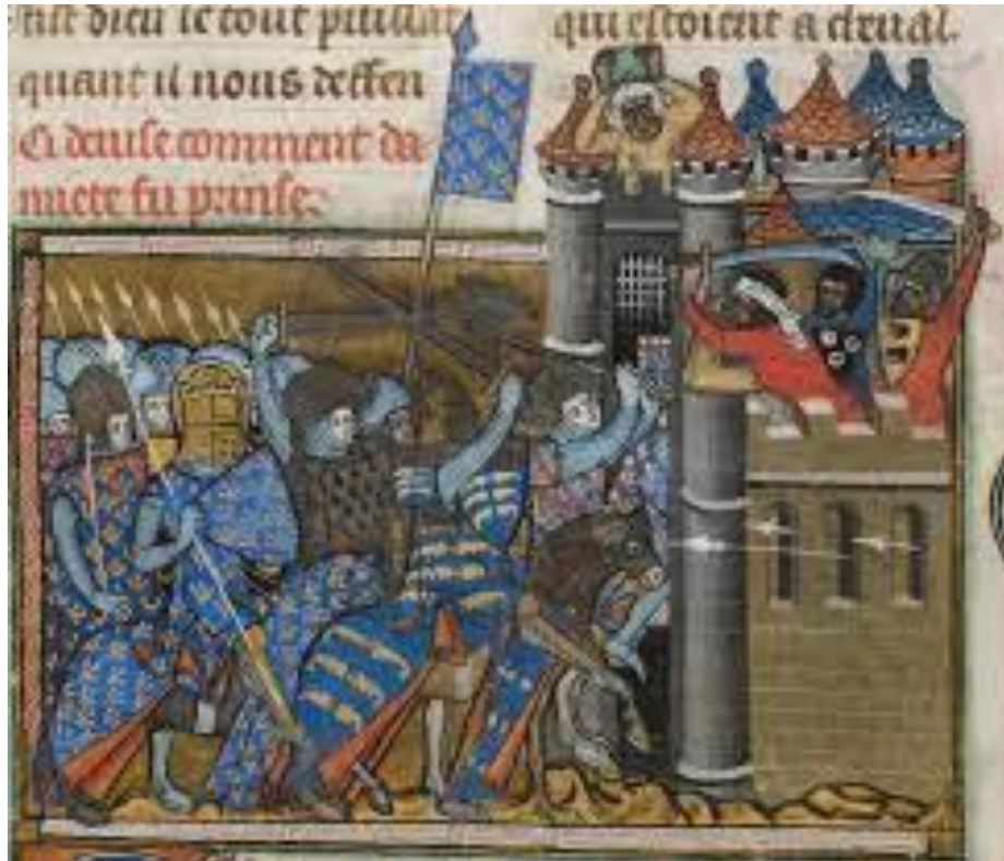
EK-5 Dimyat'ın Zaptı