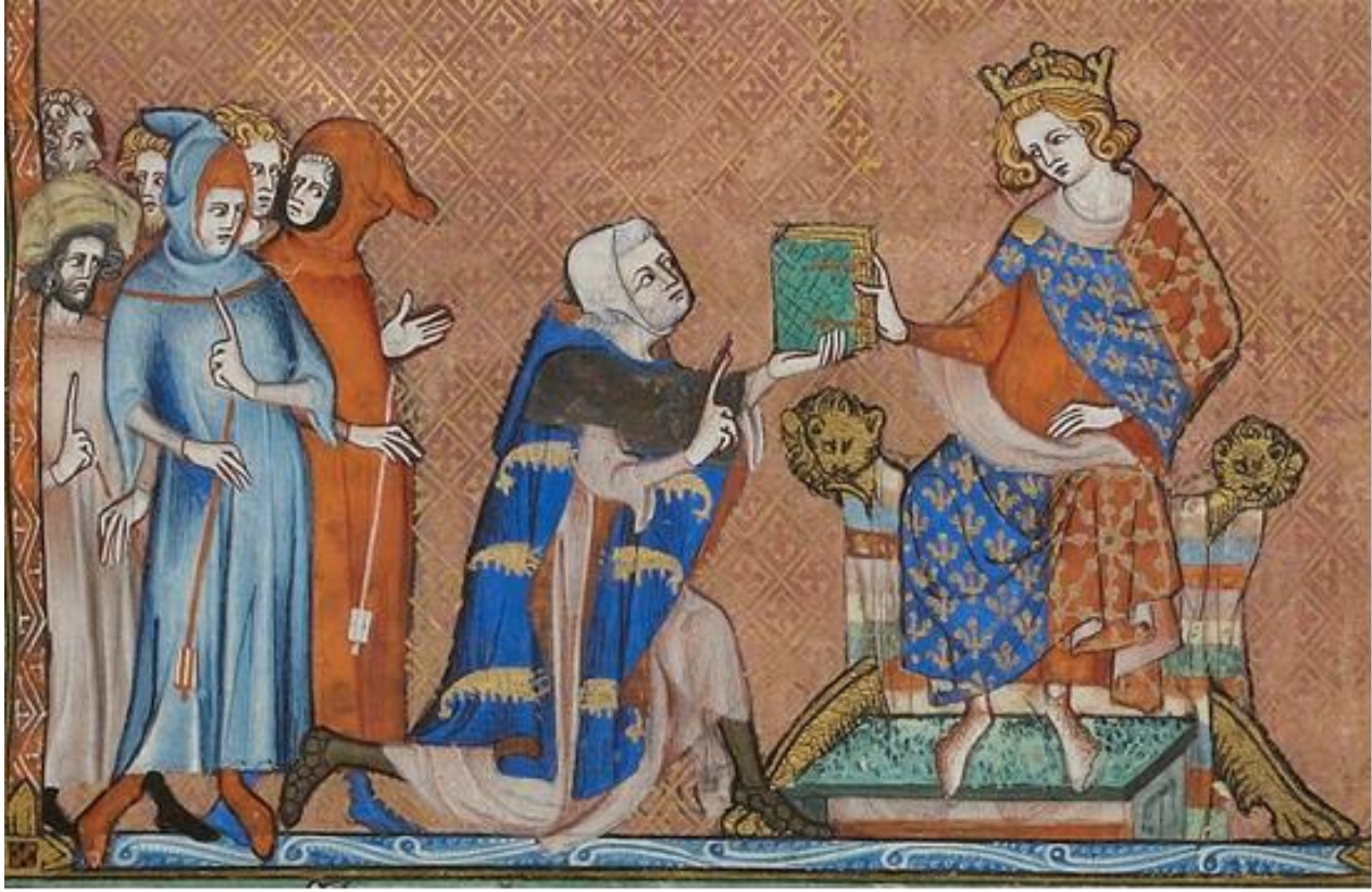
EK-8 Jean de Joinville'in Kitabını X. Louis'ye Takdim Ediři.