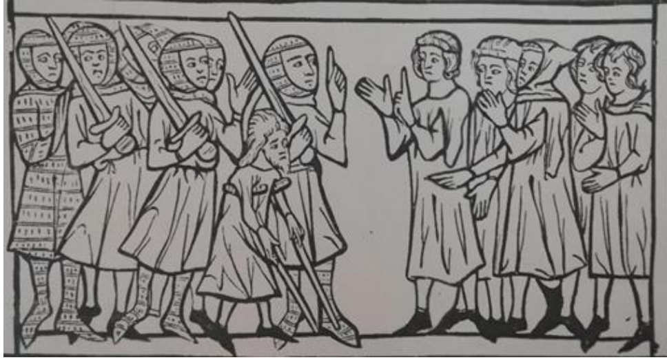
EK-4 Sultan'ın ve Hristiyan Elçilerin Fidyeye görüşmeleri, (Frederick Perry, Saint Louis (Louis IX of France): the Most Christian King, Newyork-London 1900.)