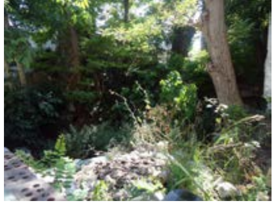
Günümüzde arsanın yol cephesi ve içten görünümü (E.D.İşli)

ğımız mektep. Yazılanları aynen alıyorum: “Zaim Osman Ağa Mektebi. Mülhak. Arsası Evkafça Edhem Efendi’ye icar edilmiştir.” Bir de 284 nolu dipnot var; notta deniyor ki, “Mektebin tamir edileceğine dair ilan, 9 Eylül 1902 Sabah gazetesinde çıkmıştır. (Akbatu Arşivinden 3 )” İhtimal ki, 1894 depreminde harap oldu. Günümüzde bulunmadığına göre, tamir gerçekleşmemiş. Bunu destekleyen bir de belge var. Hayrat Sicil Kaydı. Kaydı da buraya aynen alıyorum: