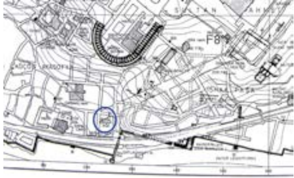
Mektebin yeri, (Müller-Wiener'den, 1970'ler)

yenei malumem bedelinrac sülüsü mezburdan baaki kalan meblağ vakıf ve akara tebdil olunup hasıl olan icare-i müecceleleri merkumede Çatladıkapu karşısında hasbeten lillahi teala müceddeden bina ve vakfeylediğim mektep ve mai leziz çeşmesi ve sebilin iktiza eden vezayıf ve masarıflarına tayin oluna deyu...” şeklinde devam ediyor.