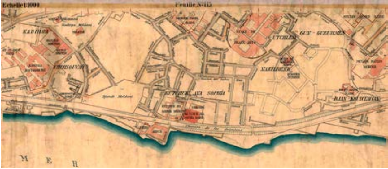
Alman Mavileri haritasında mezarlık