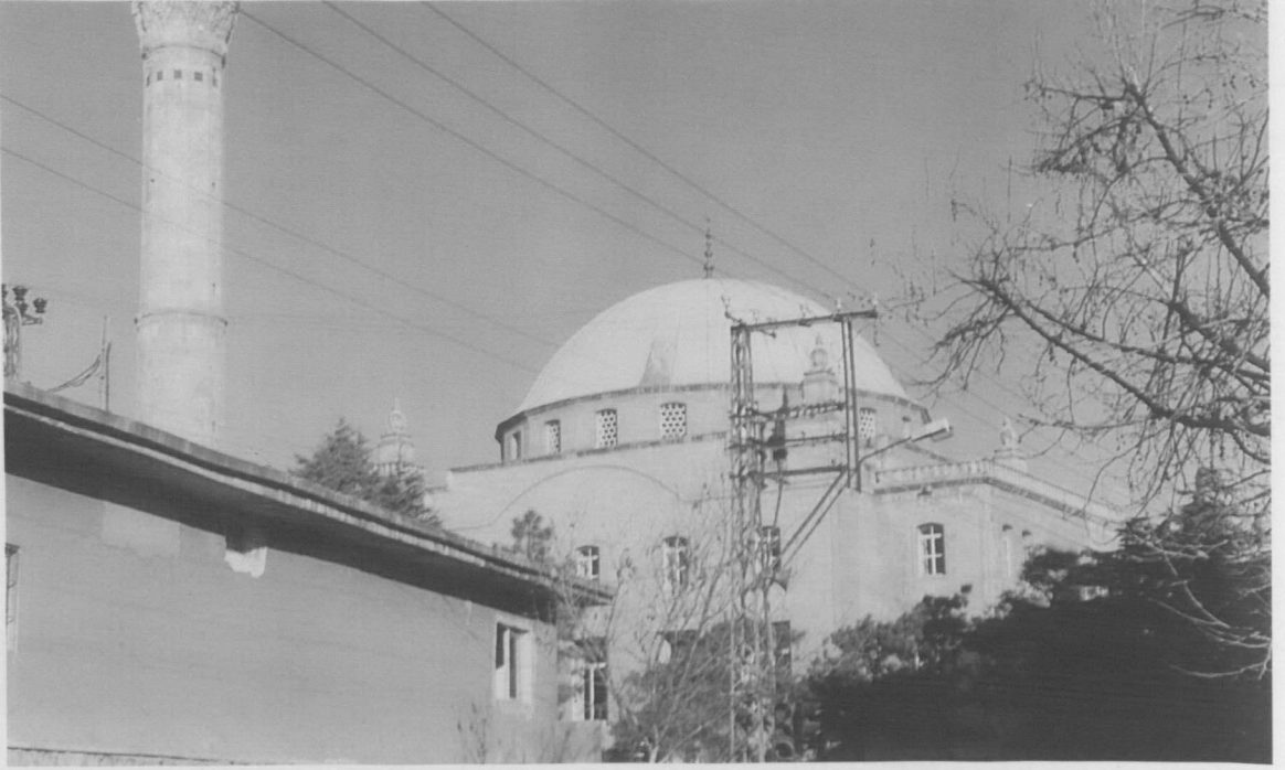
Res. 3: Bayezidli Camii güney cephesi.