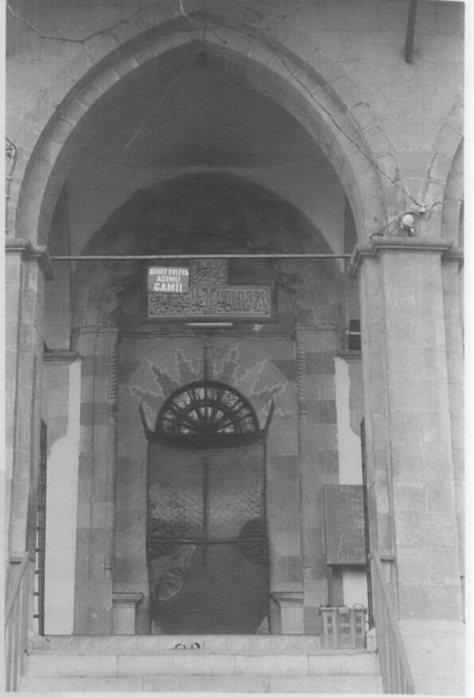
Res. 9: Acemili Camii giriş portalı.