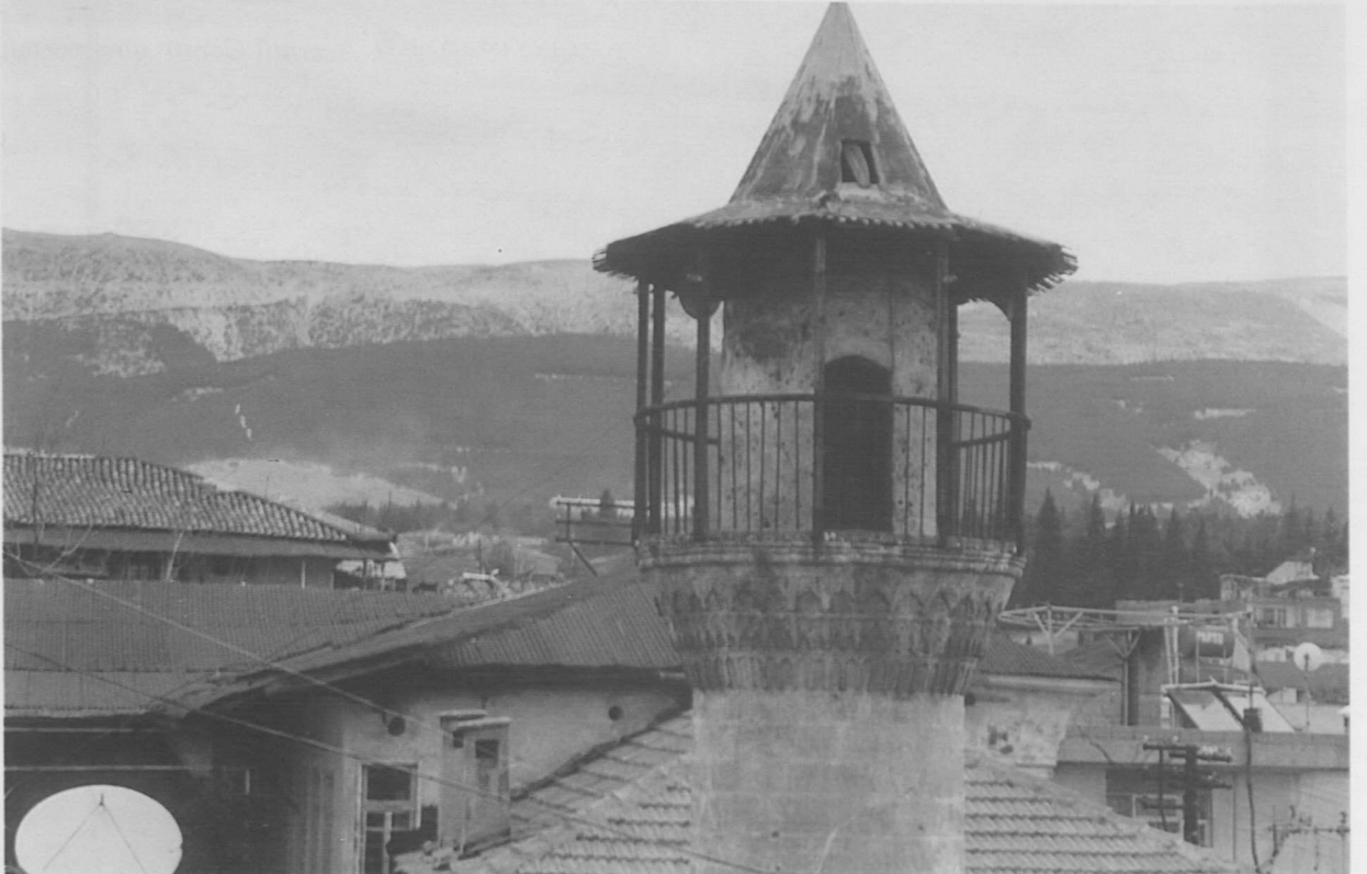
Res. 7: Hacı Veli Camii minaresinin yakından görünüşü.