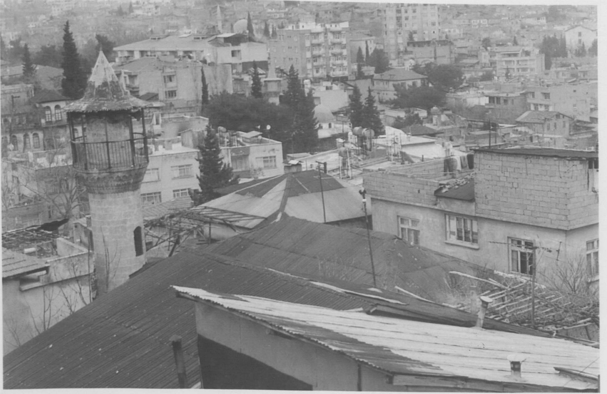
Res. 6: Hacı Veli Camii.