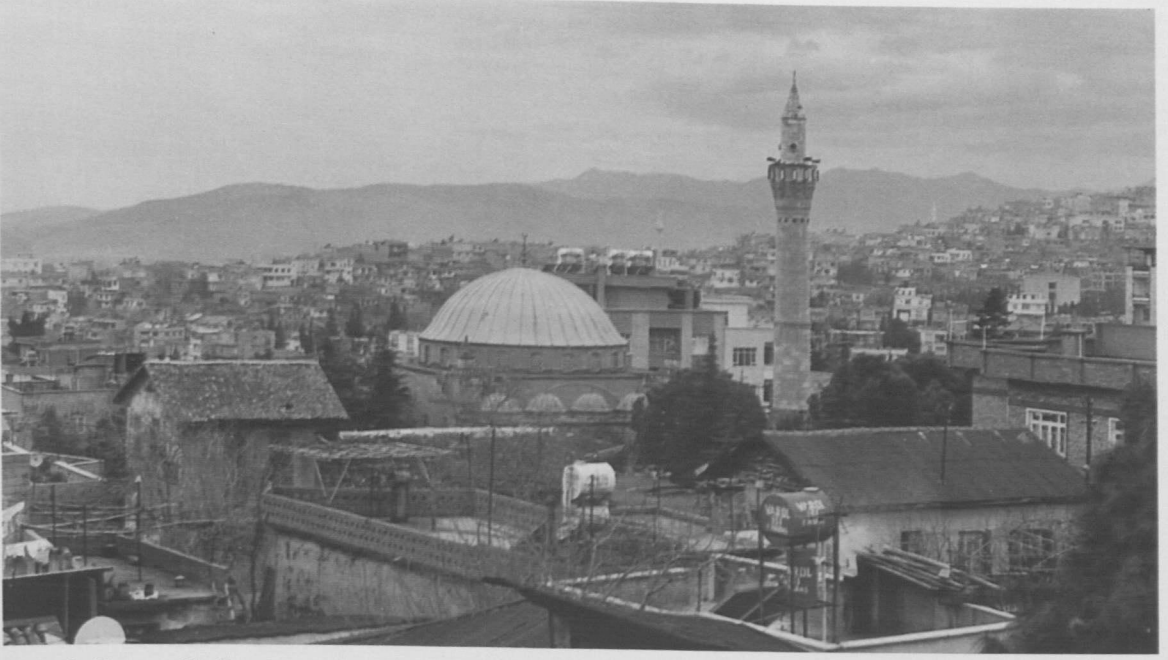
Res. 1: Bayezidli Camii.