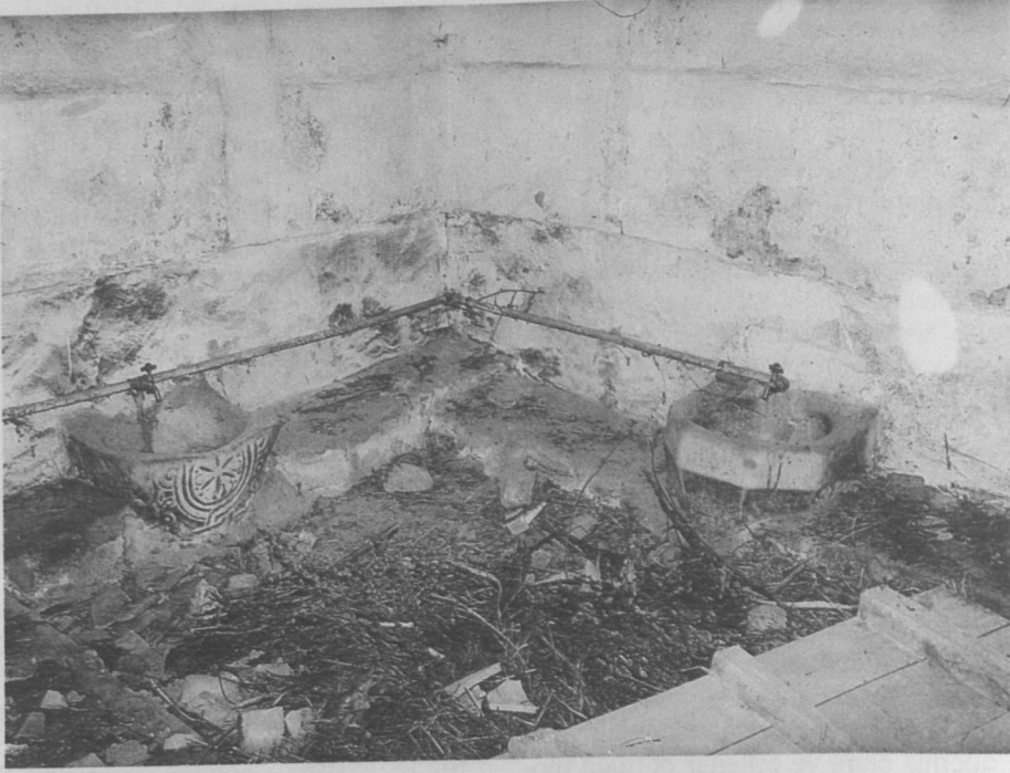
Res. 5: Barla, Çarşın Paşa Hamamı, halvet, ayrıntı.

17. S.Ögel, Anadolu Selçuklularının Taş Tezyinatı , Ankara 1966, s. 55, 151, Lev. XXXIX.