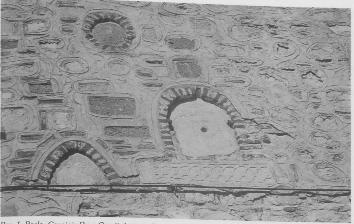
Res. 1: Barla, Çaşnigir Paşa Camii, batı cephe, ayrıntı