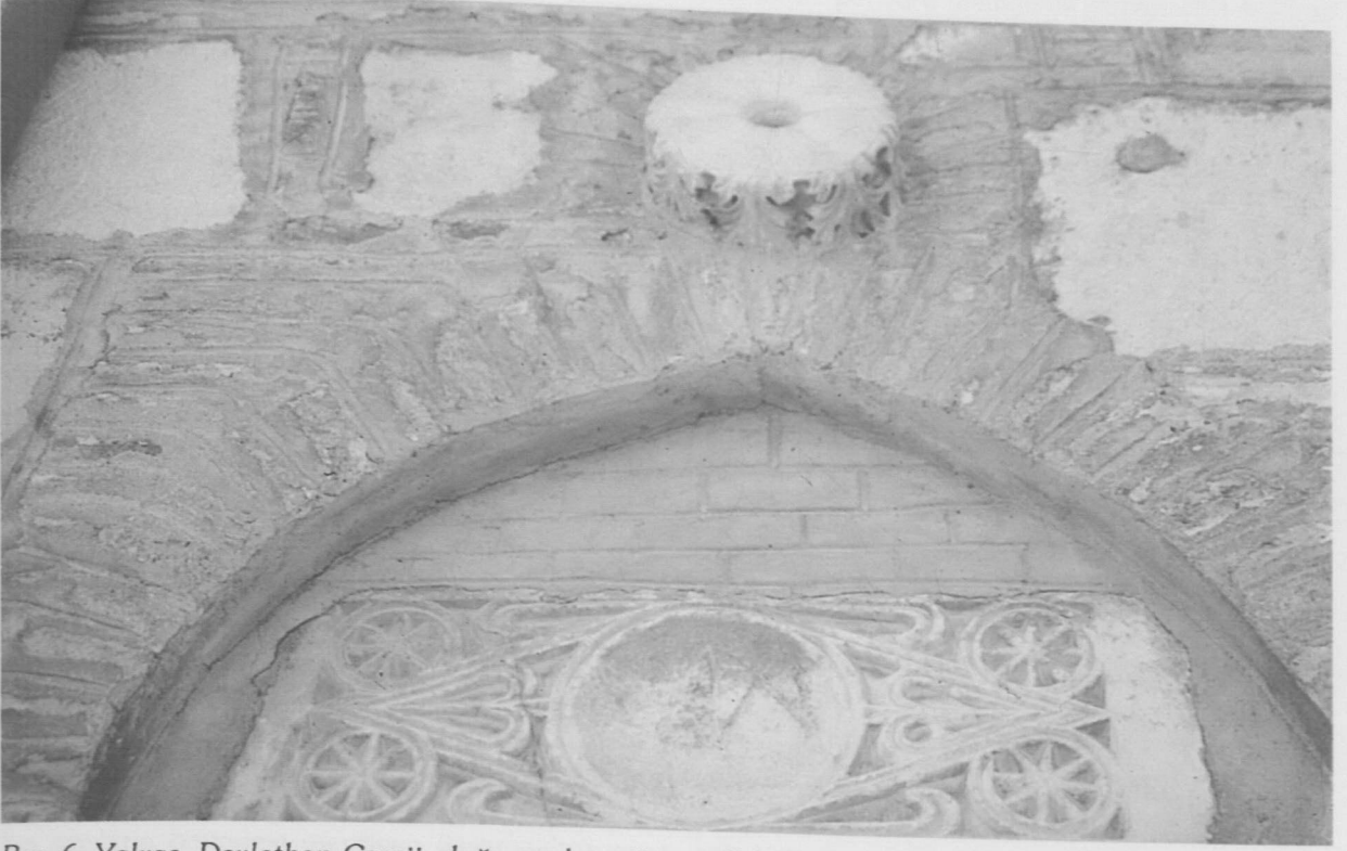
Res. 6: Yalvaç, Devlethan Camii, doğu cephe, güney, ilk pencere