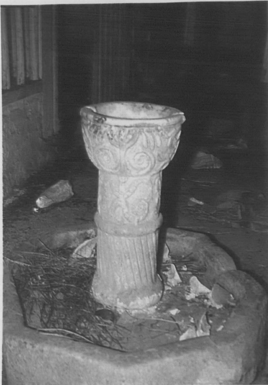
Res. 4: Barla, ÇAŞNIGİR Paşa Hamamı, soyunmalık, ayrıntı