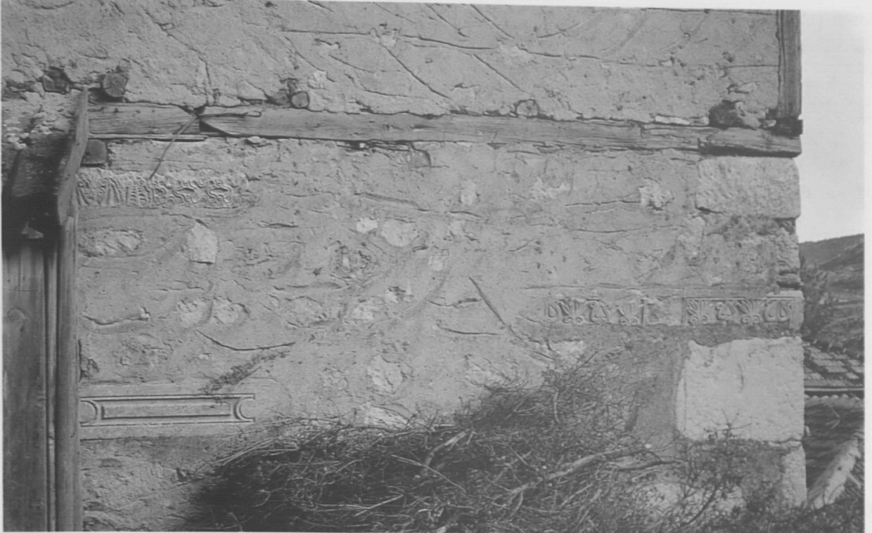
Res. 2: Barla, Çaşnigir Paşa Hamamı, kuzey cephe, ayrıntı