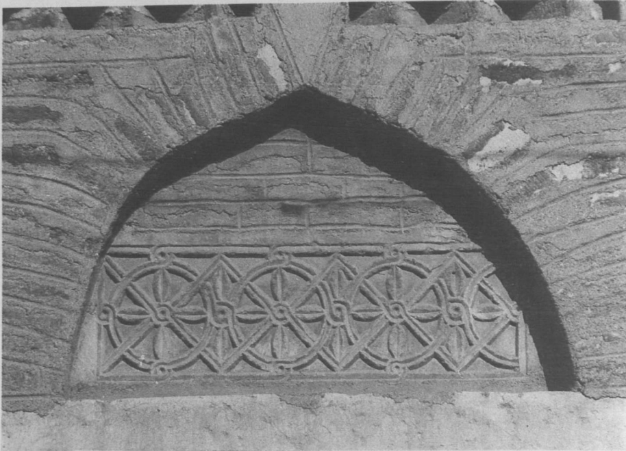
Res. 8: Yalvaç, Devlethan Camii, doğu cephe, güney, üçüncü pencere.