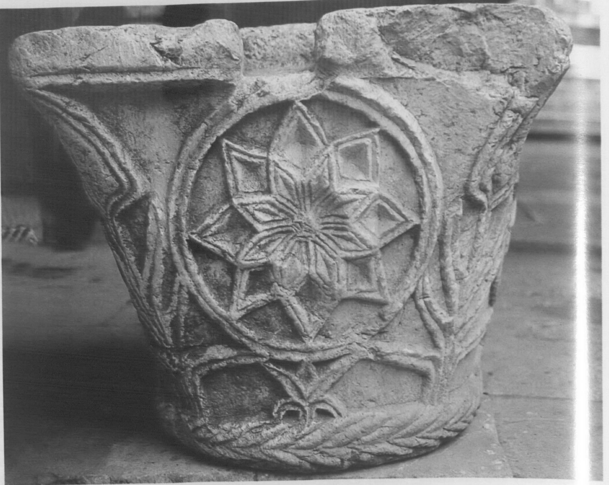
Res. 3: Eğirdir, DüNDAR Bey Medresesi, avlu, sütun başlığı