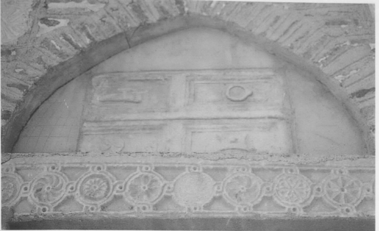
Res. 7: Yalvaç, Devlethan Camii, doğu cephe, güney, ikinci pencere