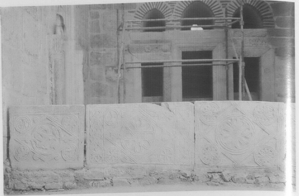
Res. 9: Atabey Ertokuş Medresesi, avlu, batıya bakış