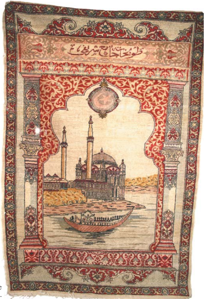
Resim 15- Ankara Vakıf Eserleri Müzesinde bulunan cami tasvirli halı.