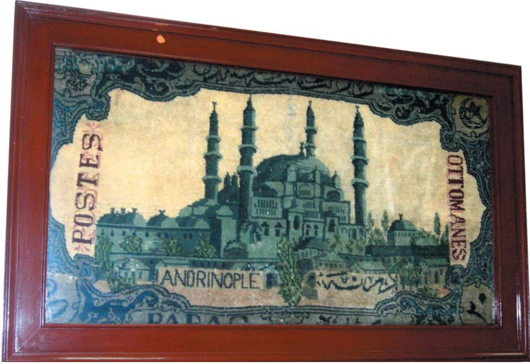
Resim 16- Özel koleksiyonda bulunan Edirne Selimiye Camii tasvirli duvar halısı.