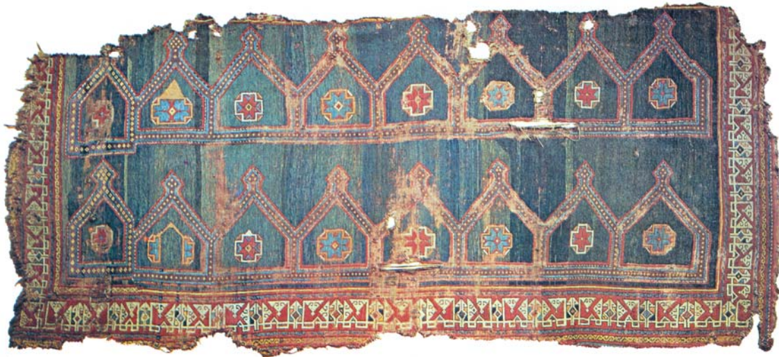
Resim 7- TİEM'de bulunan Safeseccâde.