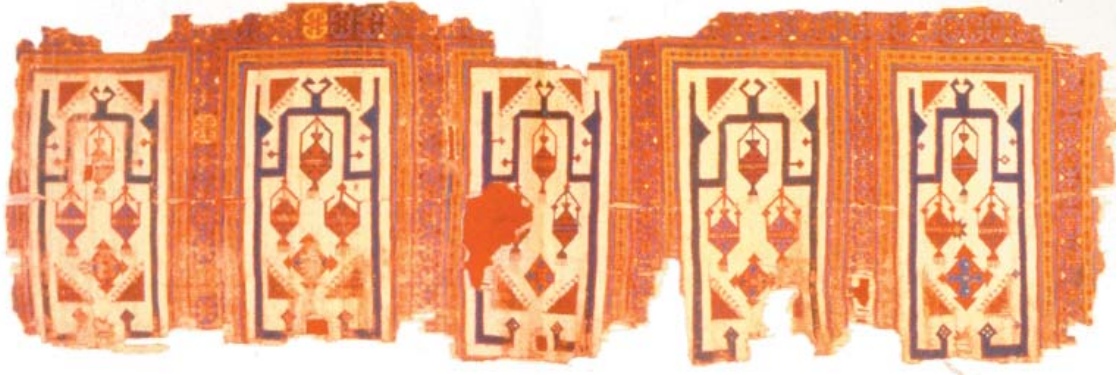
Resim 8- TIEM’de bulunan Safseccâde.