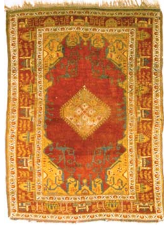
Resim 13- Ankara Vakıf Eserleri Müzesinde bulunan bordürü cami tasvirli halı.