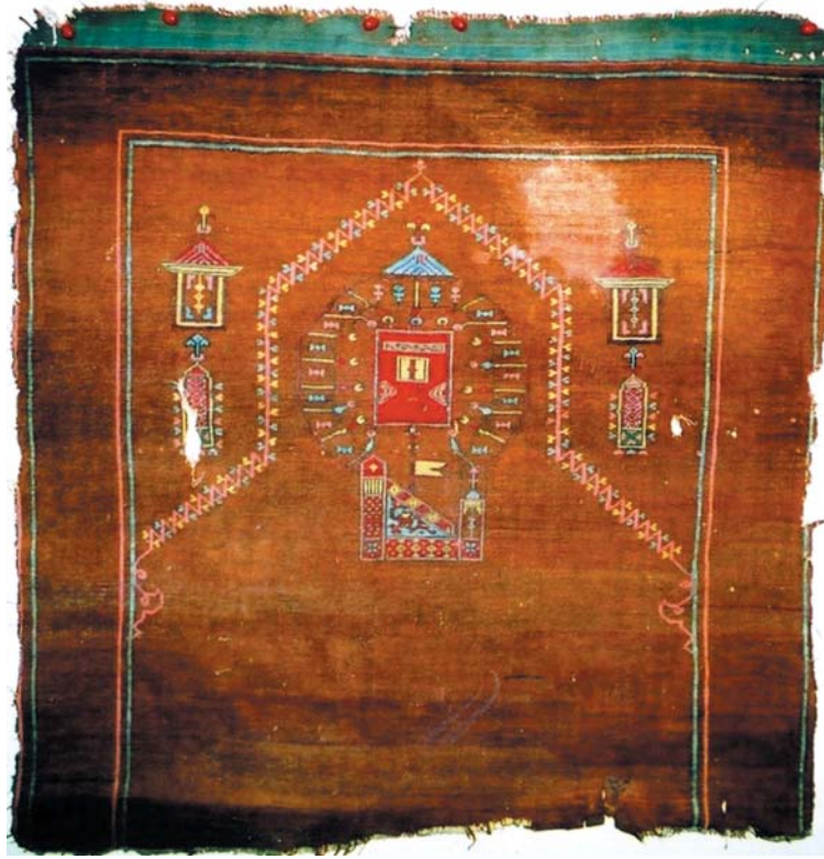
Resim 1- Konya Mevlâna Müzesinde bulunan Kâbe tasvirli halı seccâde.