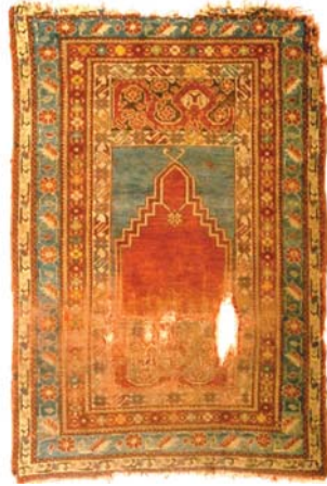
Resim 4- Ankara Vakıf Eserleri Müzesinde bulunan bir Kırşehir Seccâdesi.