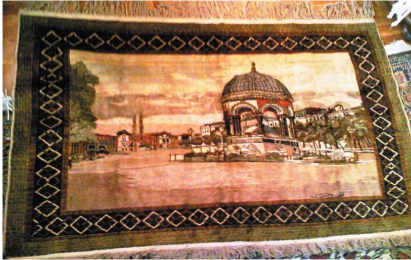
Resim 17- Özel koleksiyonda bulunan Alman Çeşmesi tasvirli duvar halısı.