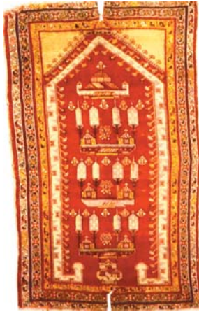
Resim 9- Ankara Vakıf Eserleri Müzesinde bulunan bir Manzaralı Kırşehir Seccâdesi.