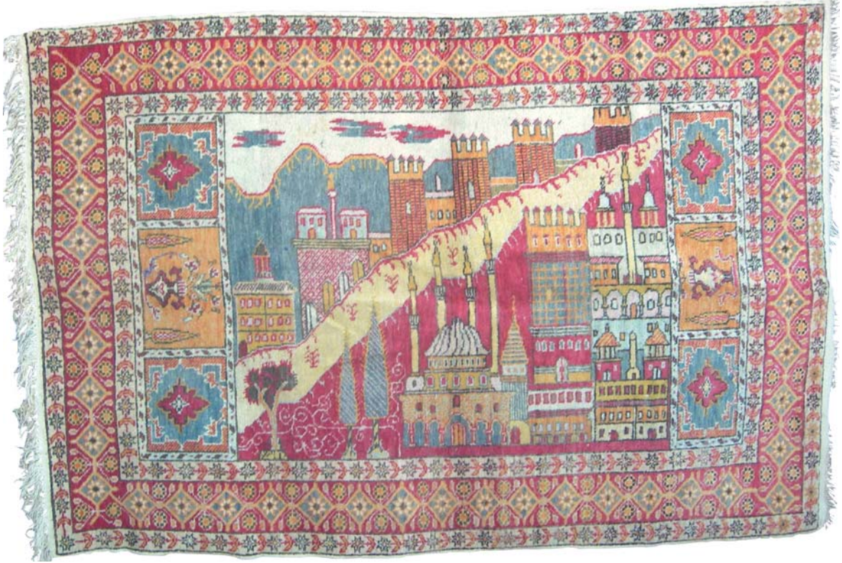
Resim 18- Vakıflar Genel Müdürlüğünde bulunan İstanbul manzaralı halı.