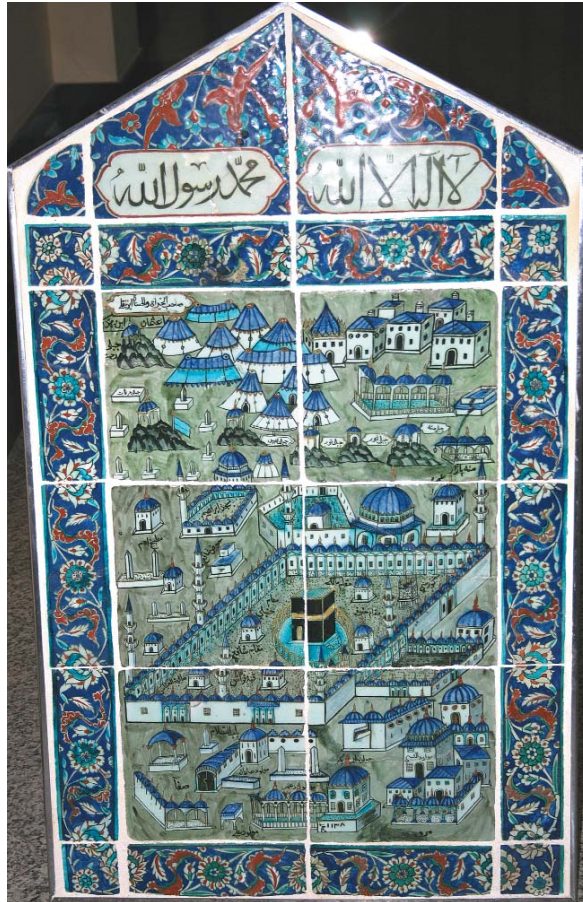
Resim 3- Ankara Vakıf Eserleri Müzesinde bulunan Cezeri Kasım Paşa Camiine ait çini pano.