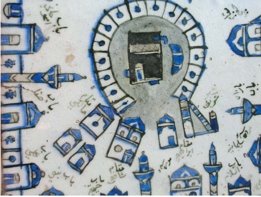
Resim 2- İstanbul Türk İnşaat ve Sanat Eserleri Müzesinde bulunan Kâbe tasvirli çini.