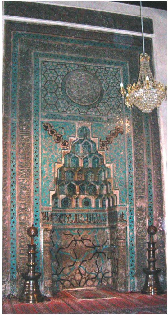
Resim 5- Ankara Arslanhane Camii mihrabı.