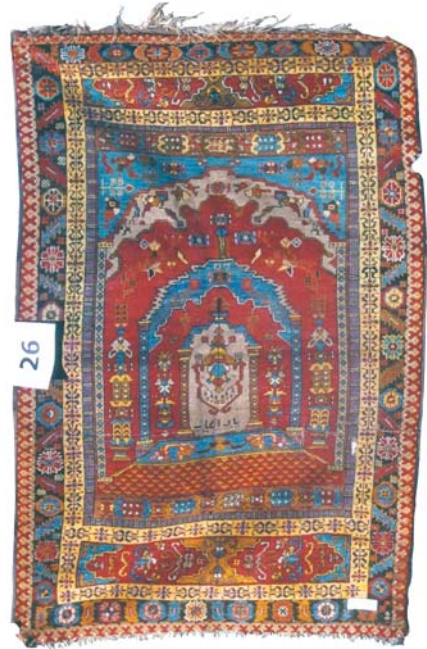
Resim 11- Ankara Vakıf Eserleri Müzesinde bulunan cami iç görünüşü tasvirli seccâde.