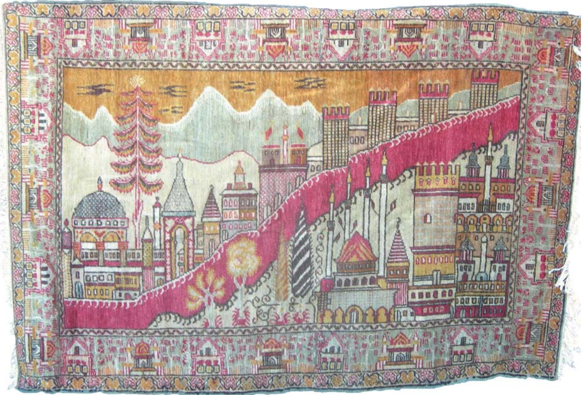
Resim 19- Vakıflar Genel Müdürlüğünde bulunan İstanbul manzaralı halı.