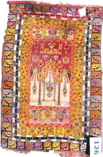
Resim 10- Ankara Vakıf Eserleri Müzesinde bulunan cami iç görünüşü tasvirli seccâde.