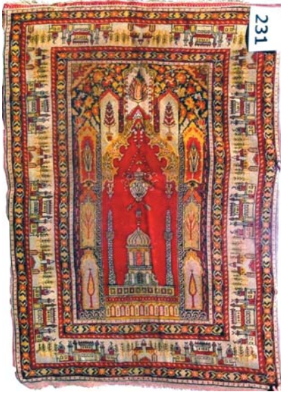
Resim 12- Ankara Vakıf Eserleri Müzesinde bulunan cami tasvirli seccâde.