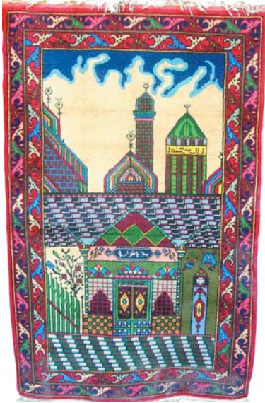
Resim 14- Vakıflar Genel Müdürlüğünde bulunan Mevlânalı halı.