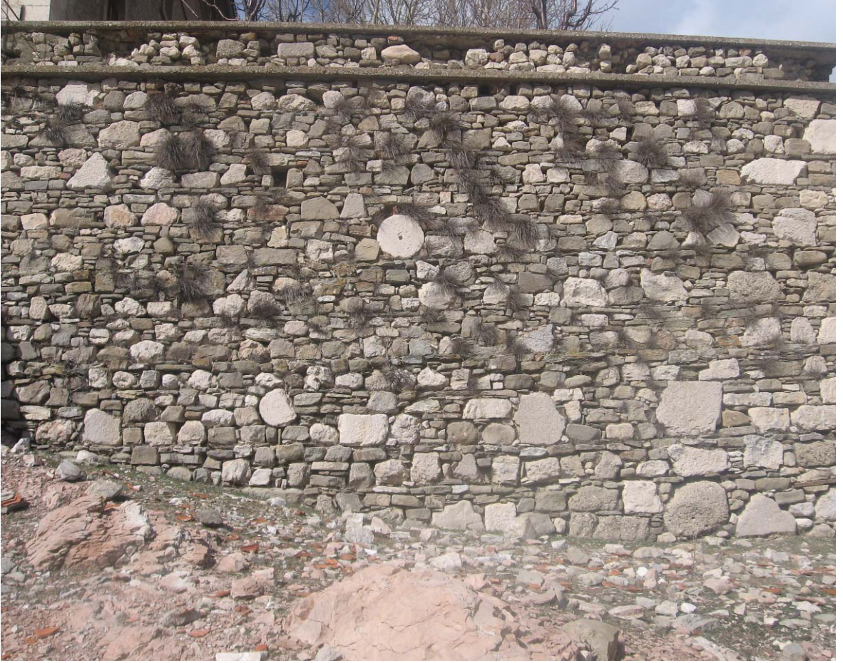
Resim 26: Güney Duvarı, malzeme ayrıntı