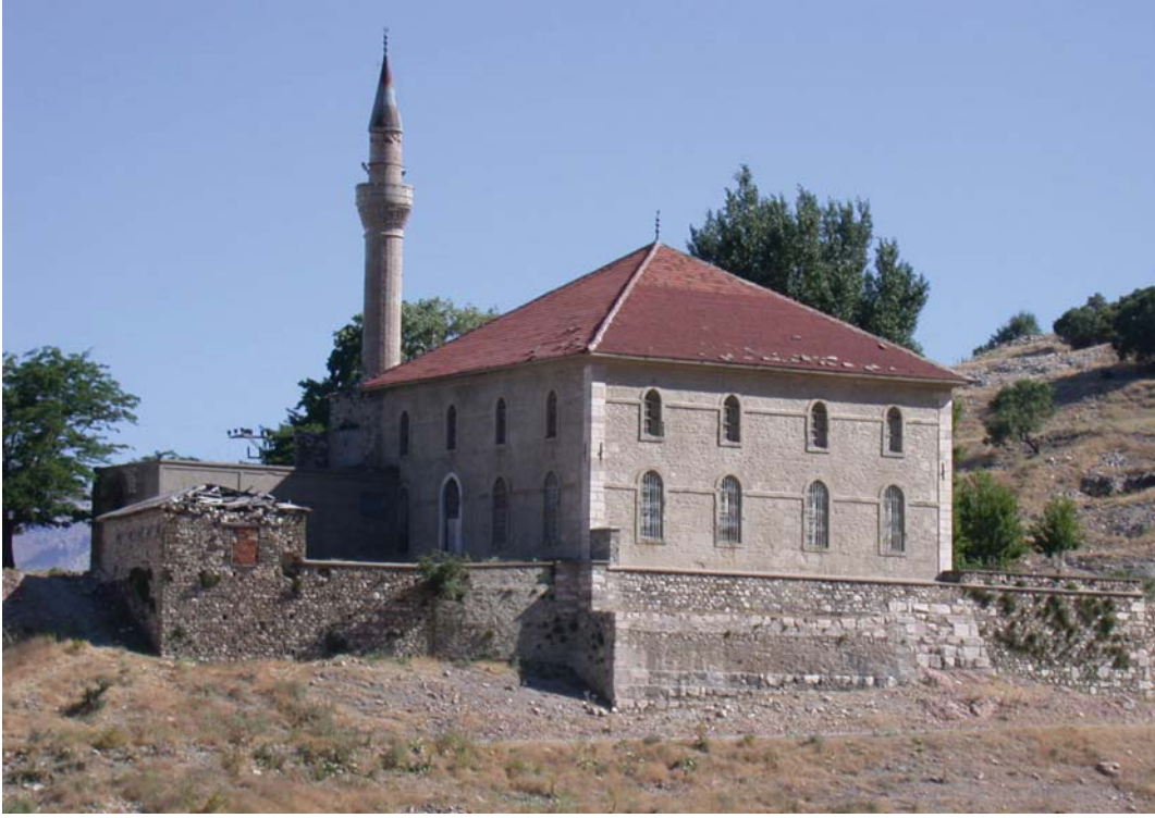
Resim 16: Güney ve batı cepheler