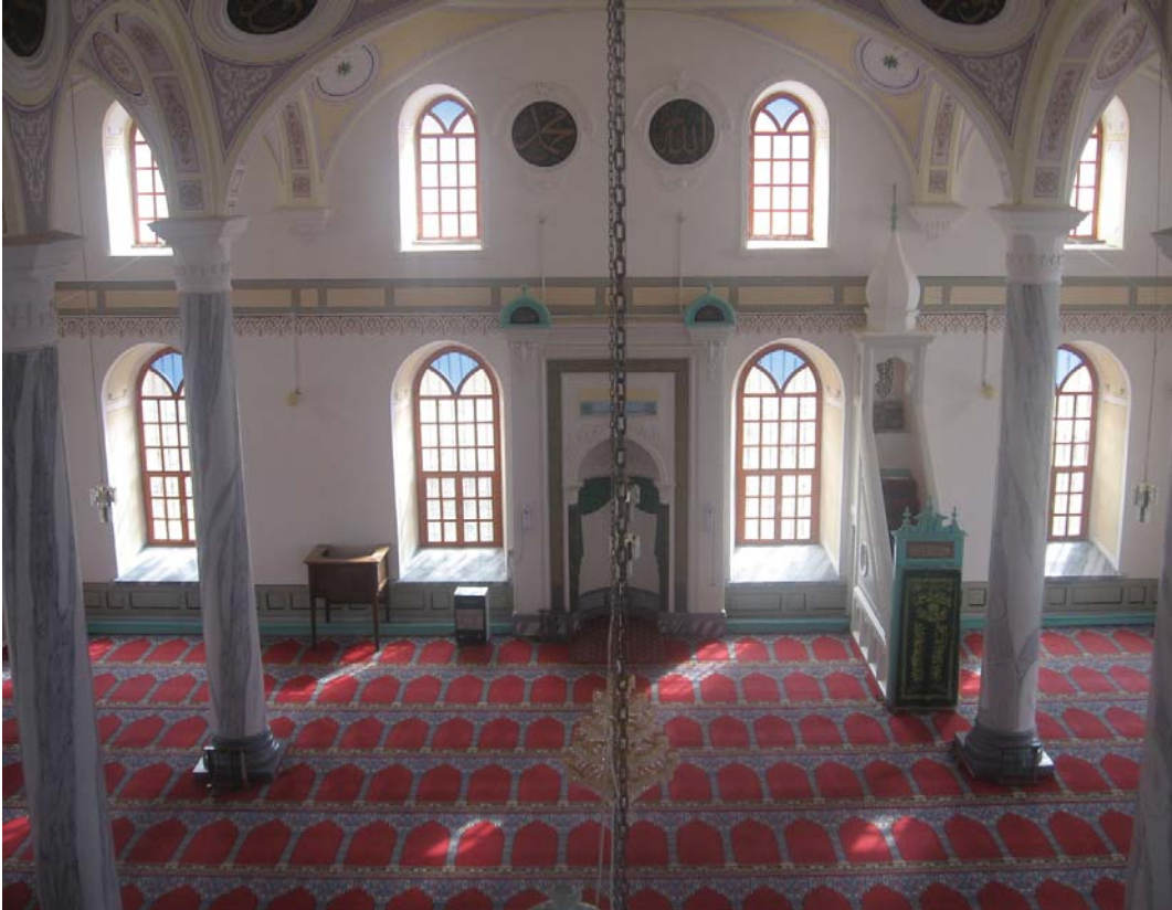
Resim 17: Harim, güney duvara bakış