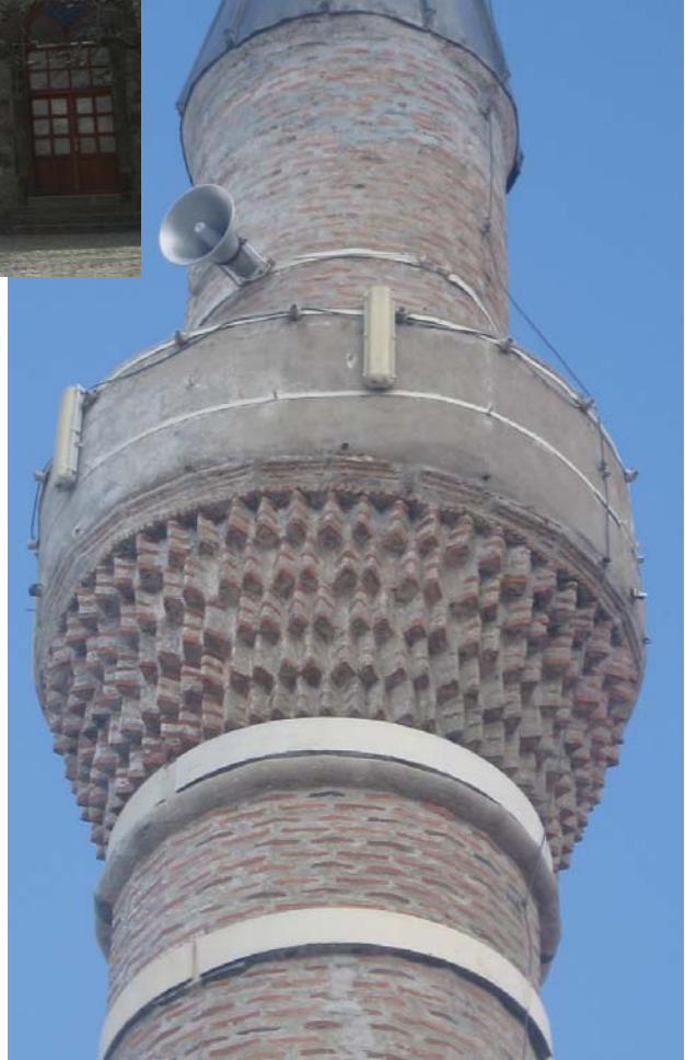
Resim 13: Minare, ayrıntı