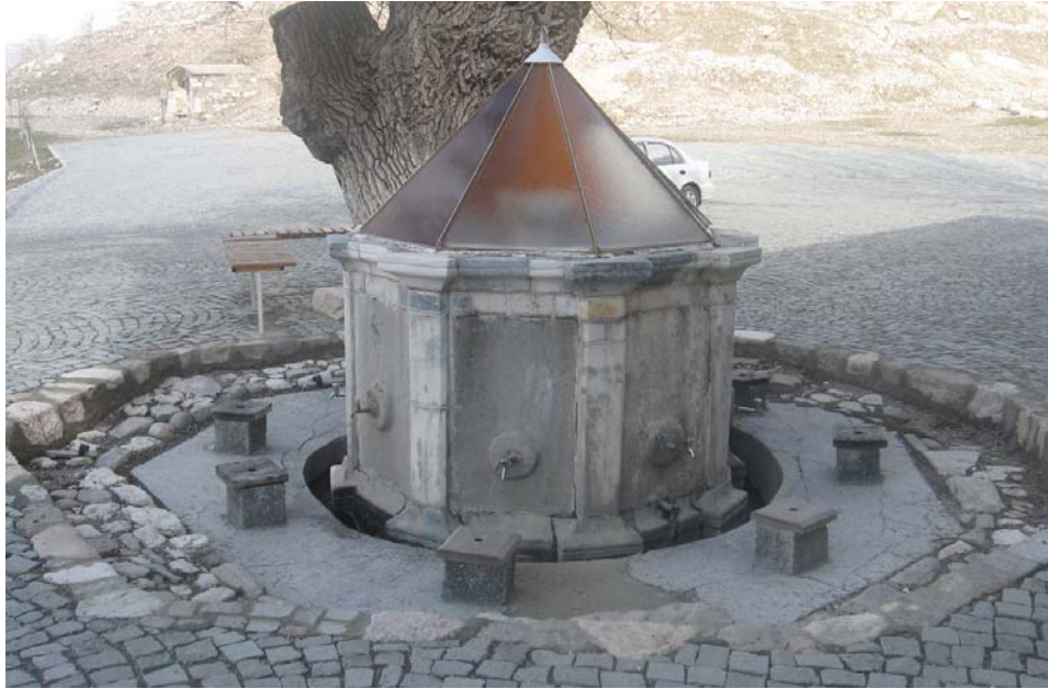
Resim 11: Kuzey Cephenin önü, şadırvan