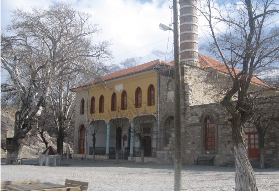
Resim 8: Kuzey Cephe, genel görünüm