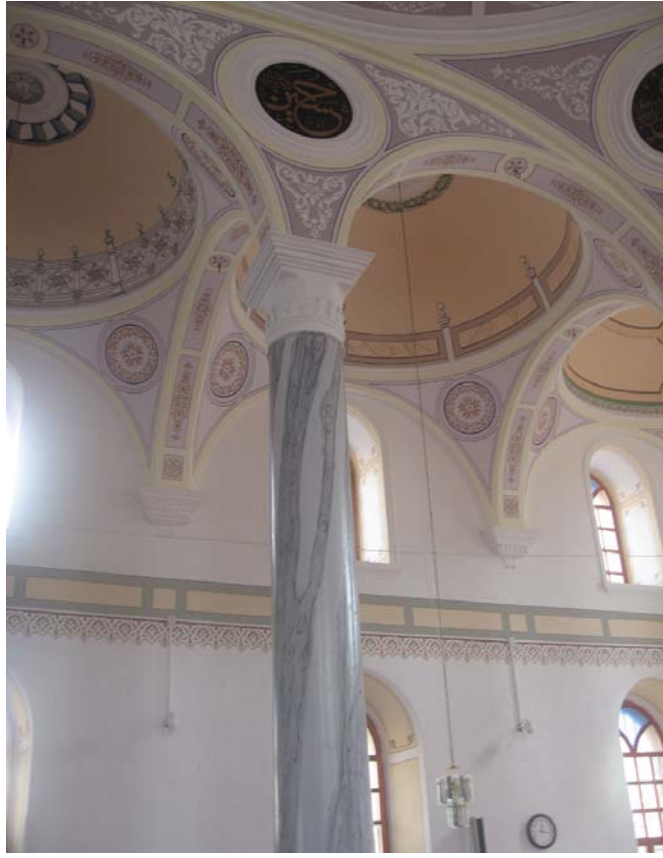
Resim 20: Harim, sütun, ayrıntı