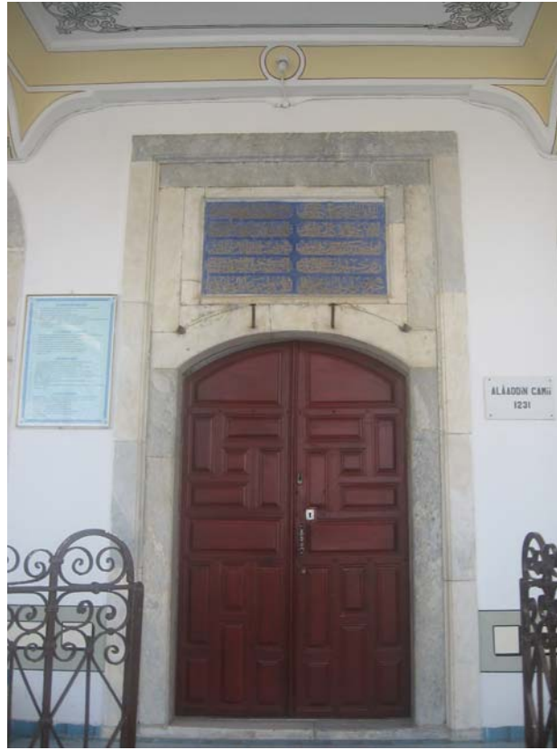
Resim 9: Kuzey Cephe, giriş kapısı