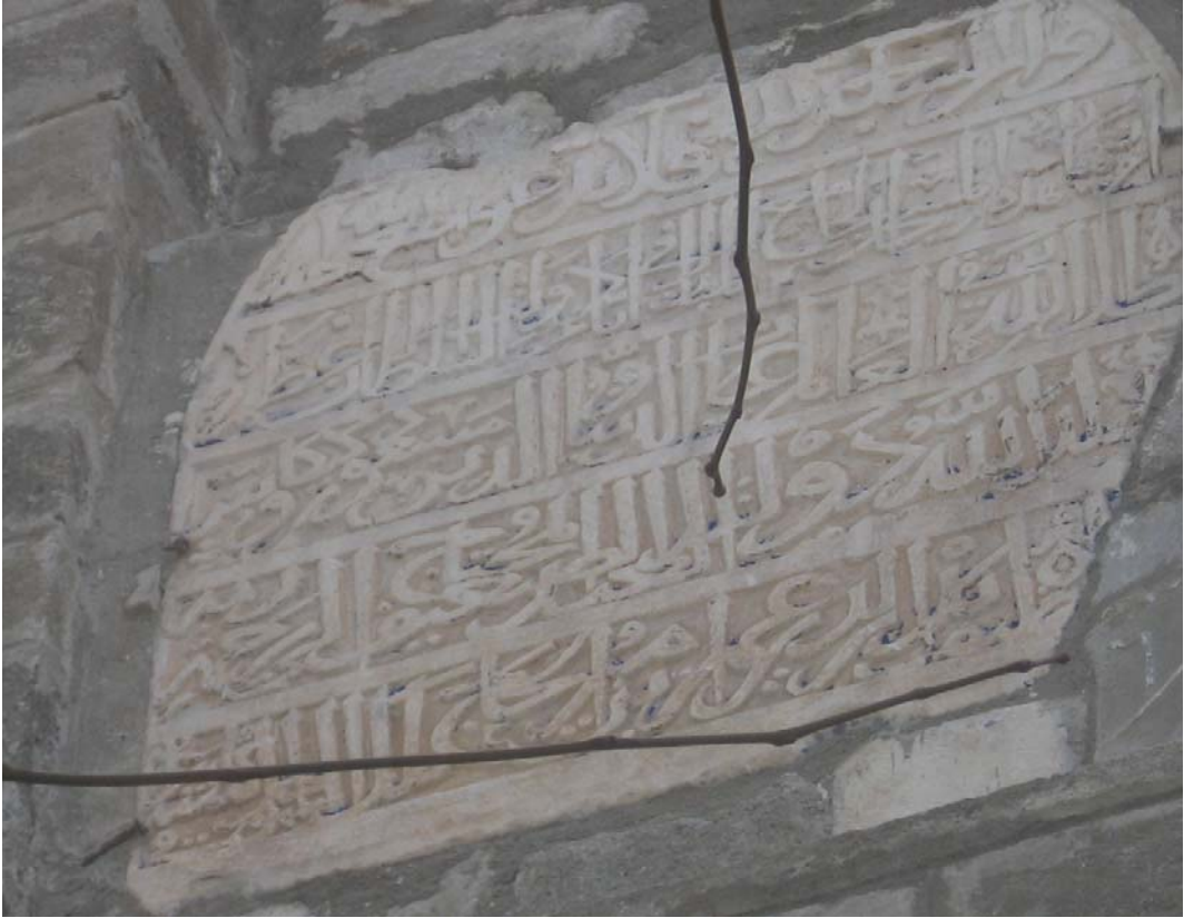
Resim 5: Minare Kaidesi, Kitabe, ayrıntı