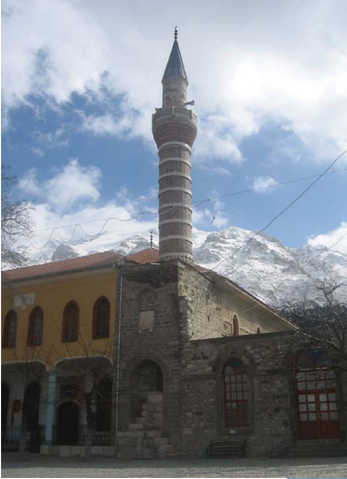
Resim 12: Minare