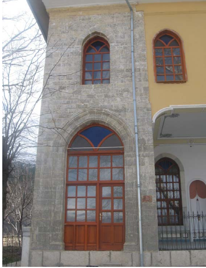
Resim 10: Kuzey Cephe, Türbe Girişi