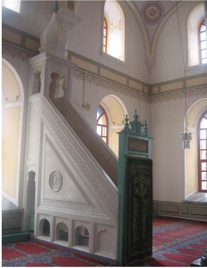
Resim 24: Minber