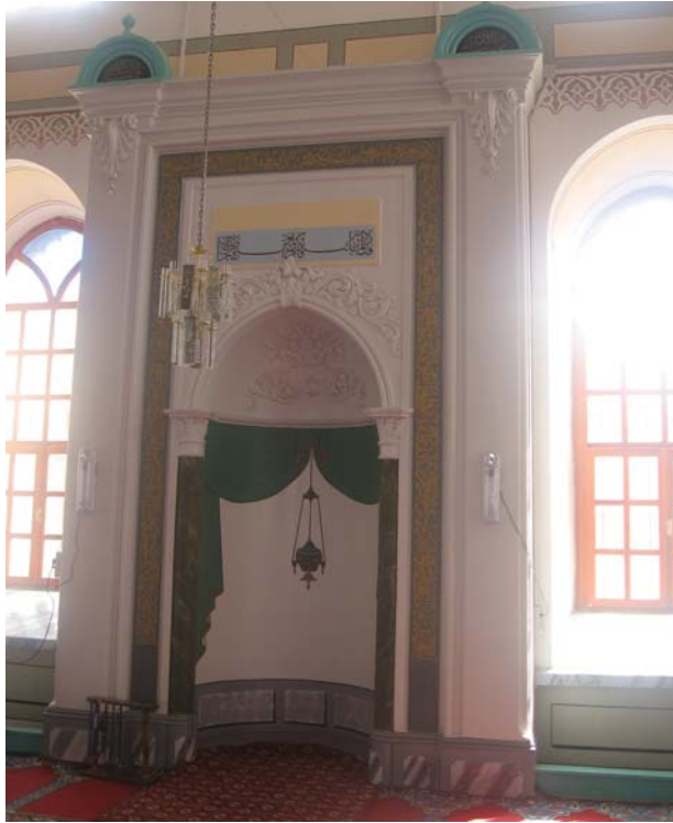
Resim 23: Mihrap