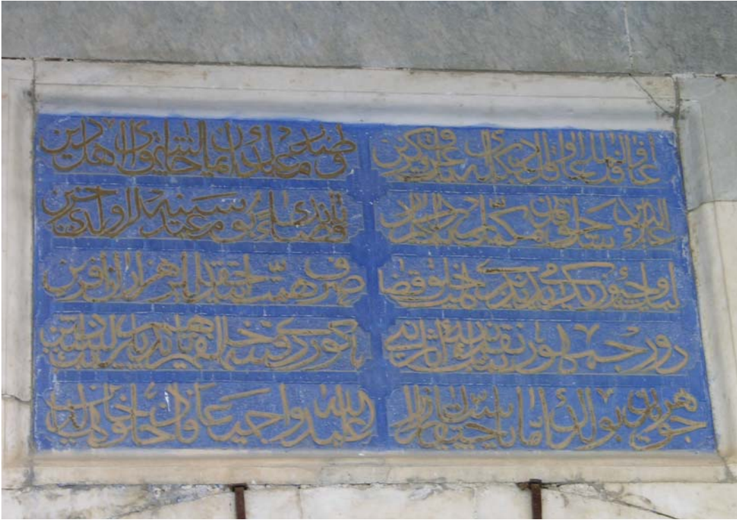
Resim 6: Kuzeydeki kapı, kitabe