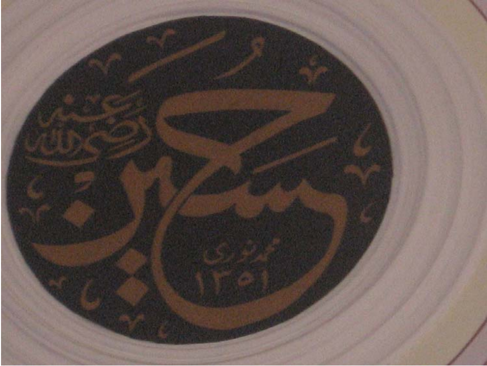
Resim 7: Harim, Kubbe, Pandantif, kitabe