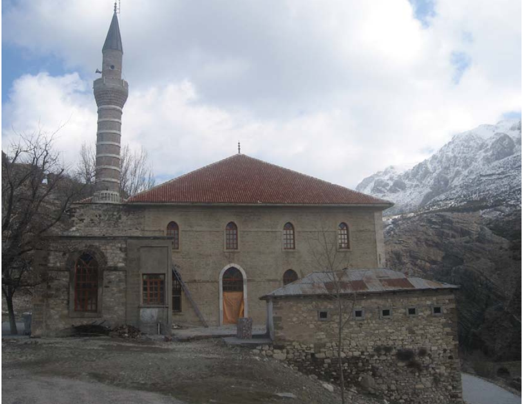
Resim 15: Batı Cephe