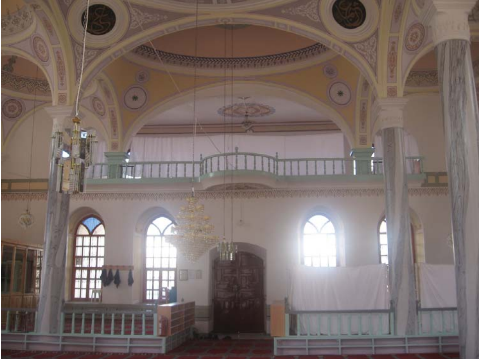
Resim 21: Harim, Kuzey duvara bakış, mahfiller