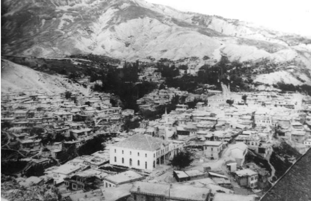
Resim 1: XX. Yüzyıl başları, Eski Uluborlu ve Alâeddin Camii (Isparta Müze Arşivi)