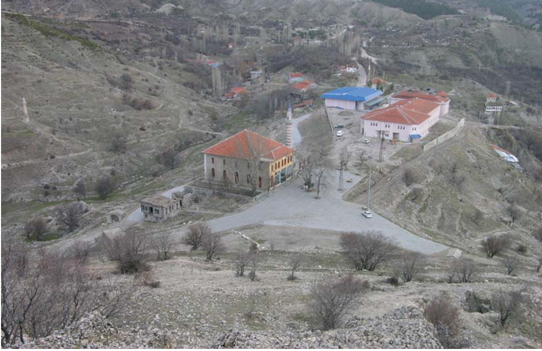
Resim 2: Alâeddin Camii, genel görünüm