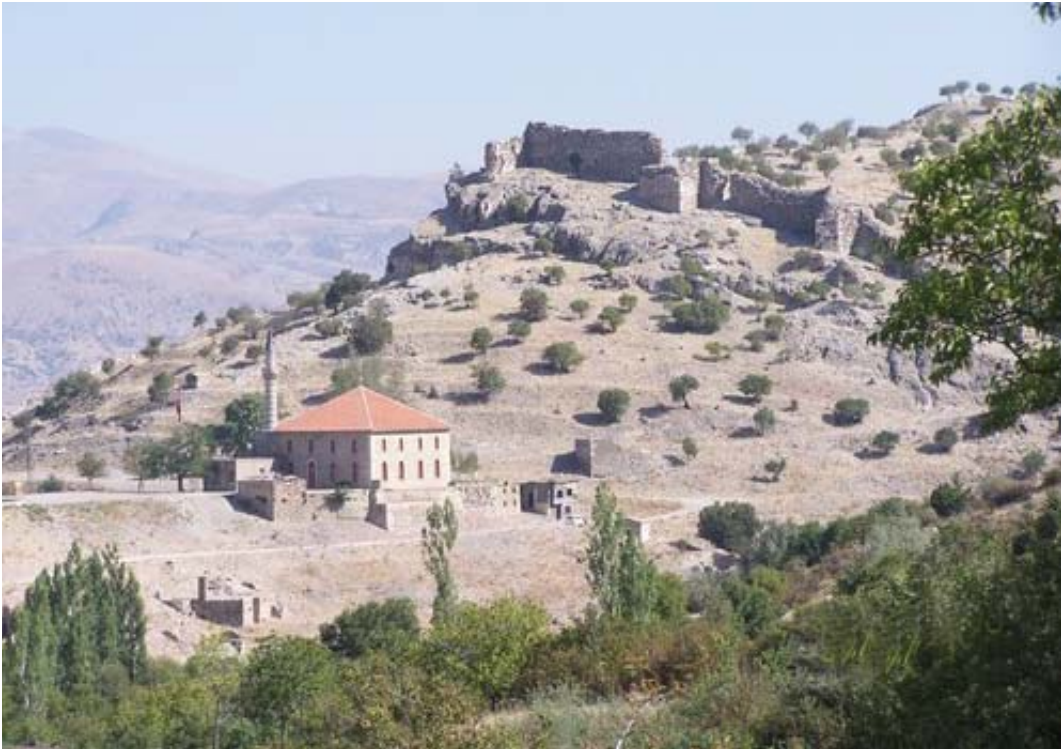
Resim 3: Eski Uluborlu yerleşim alanı, güneybatıdan Alâeddin Camii ve Kale