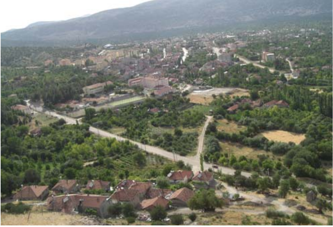
Resim 4: Kuzey, Uluborlu Günümüz Yeni Yerleşimi