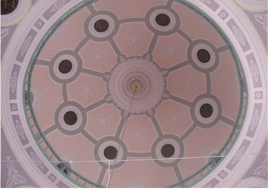
Resim 18: Harim, Orta Kubbe