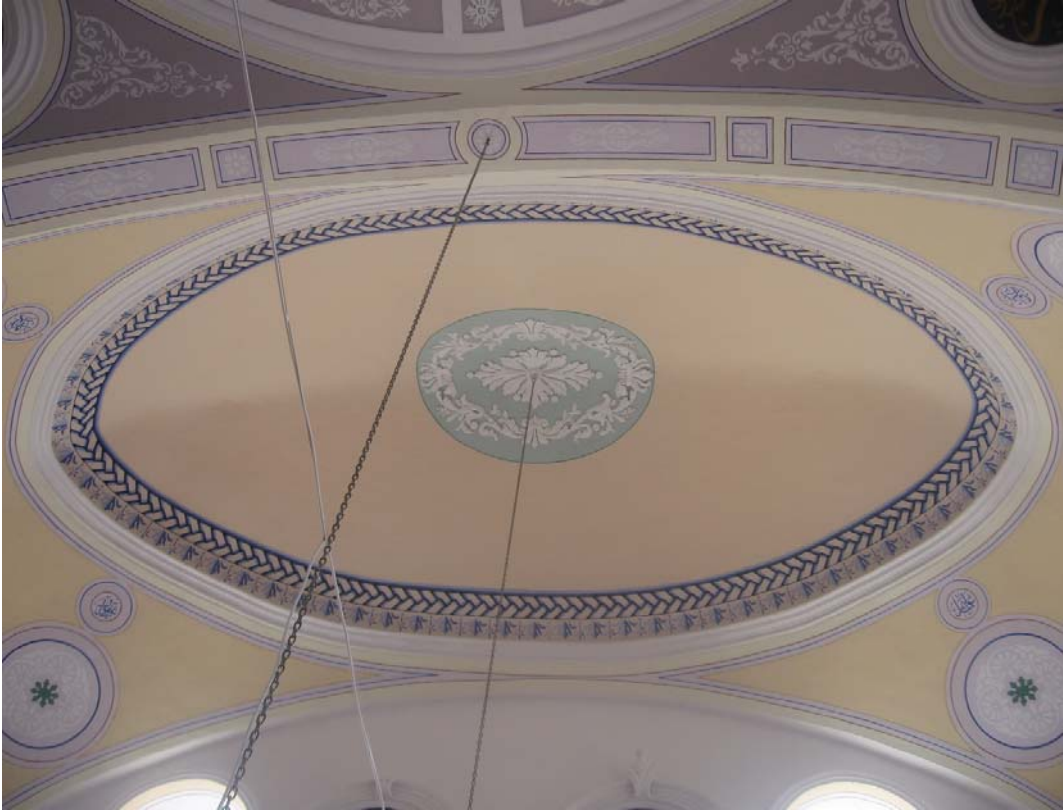
Resim 19: Mihrap önu, kubbe