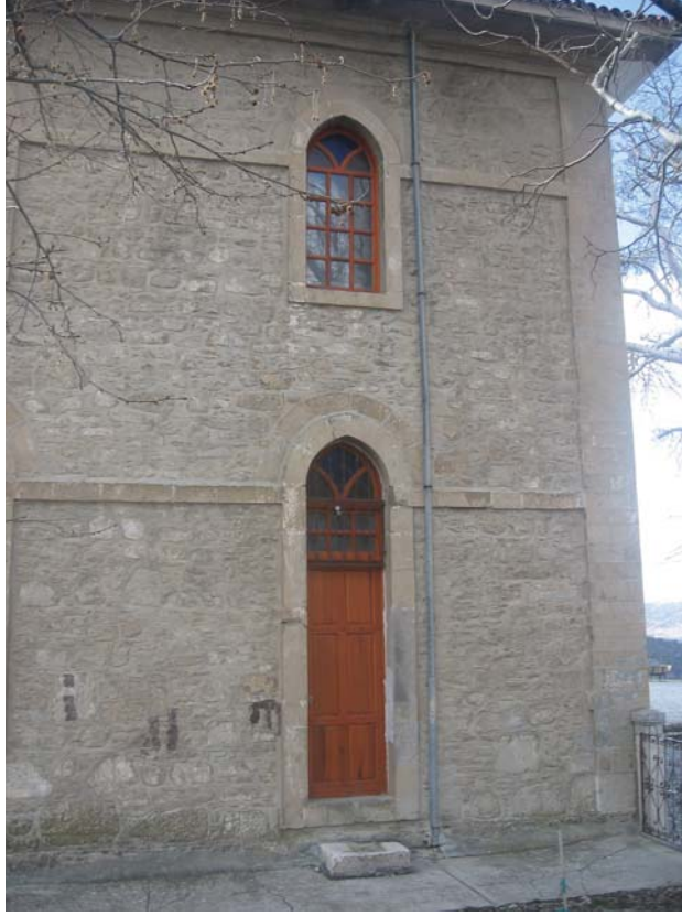
Resim 22: Doğu Cephenin, Kadınlar Mahfili Girişi