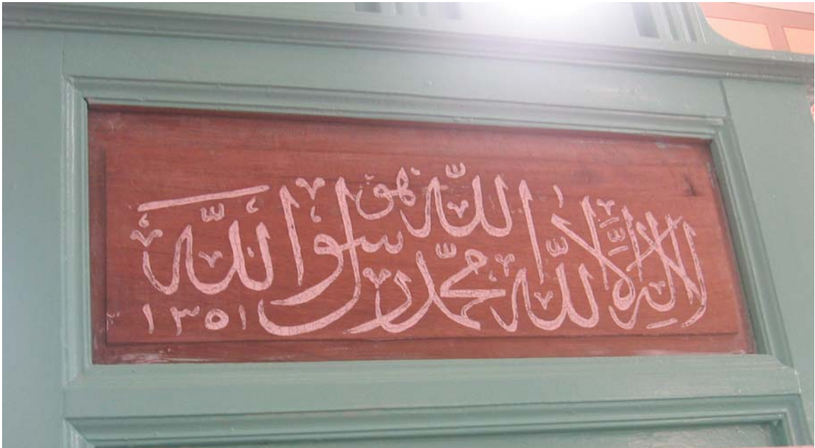
Resim 25: Minber, ayrıntı