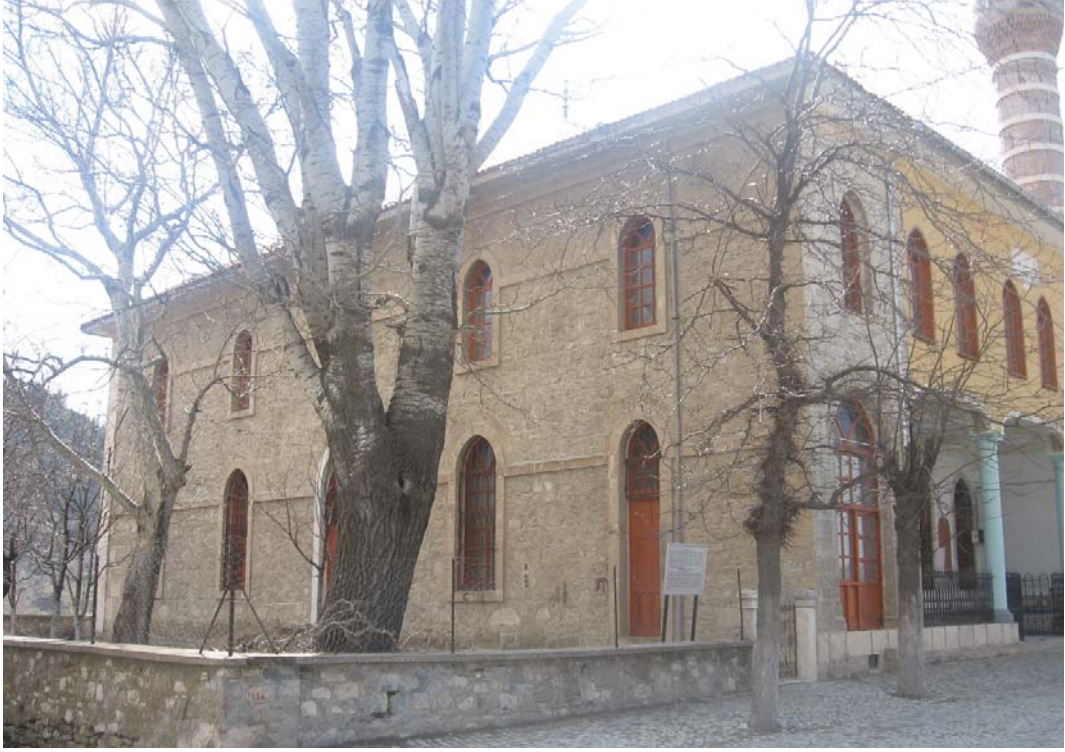
Resim 14: Doğu ve Kuzey Cepheler