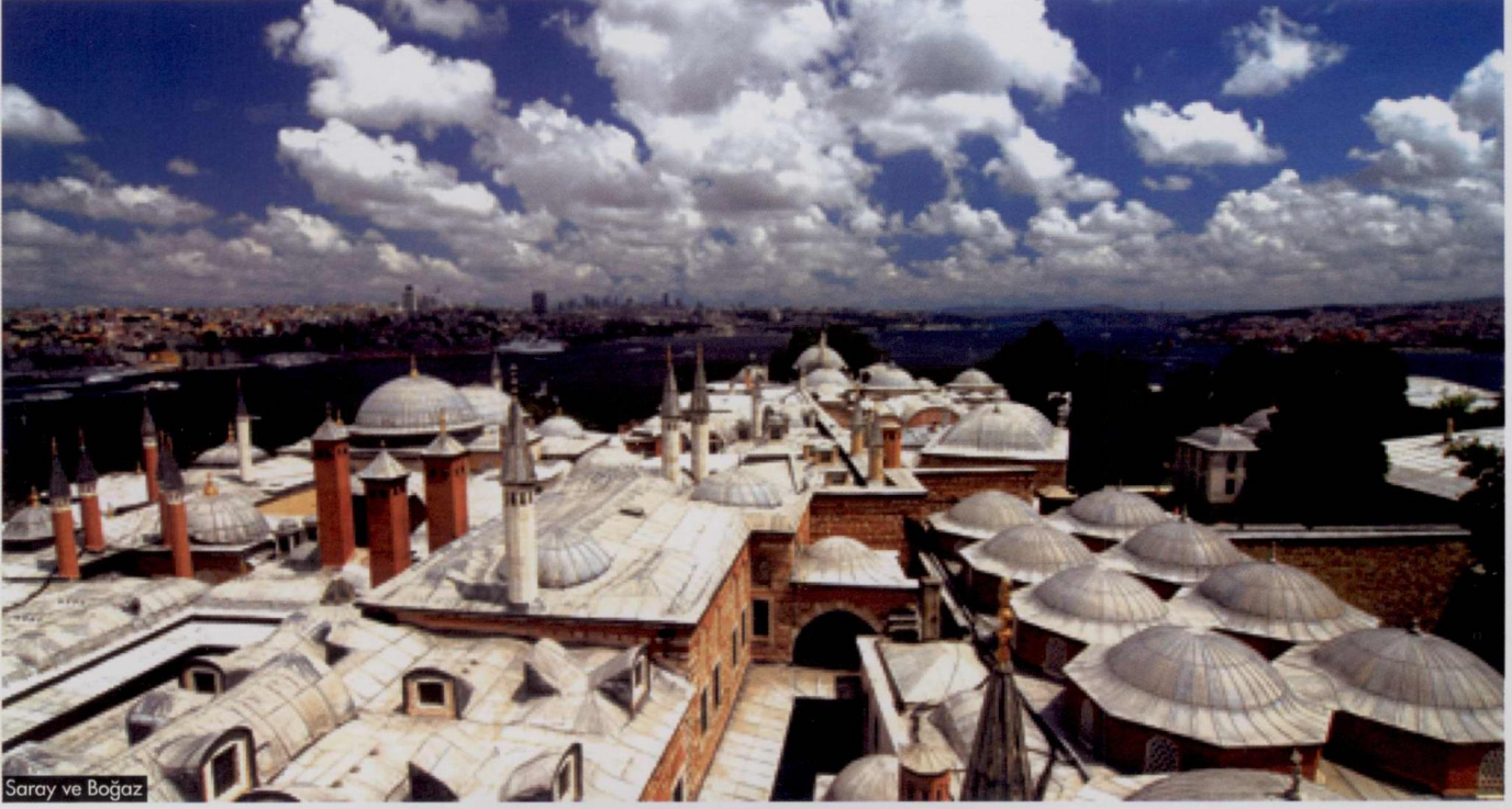
Saray ve Boğaz

yüksek seti olan havuzlu taşlığa çıkılmaktadır. Bu taşlıkta çinili çepesi ile Sünnet Odası, padişaha özel bir yer olan iftariye kameriyesi IV. Murad tarafından inşa ettirilmiş dört eyvanlı Bağdat Köşkü ve üç eyvanlı Revan Köşkü yer almaktadır. Taşlığın sağında Harem dışında, saray içindeki tek ahşap yapı olan Sefa Köşkü, Hekimbaşı Odası, Sefa Camii ve Topkapı Sarayının son yapısı olan Sultan Abdulmecid'in 1850 tarihli Mecidiye Köşkü sıralanmıştır.