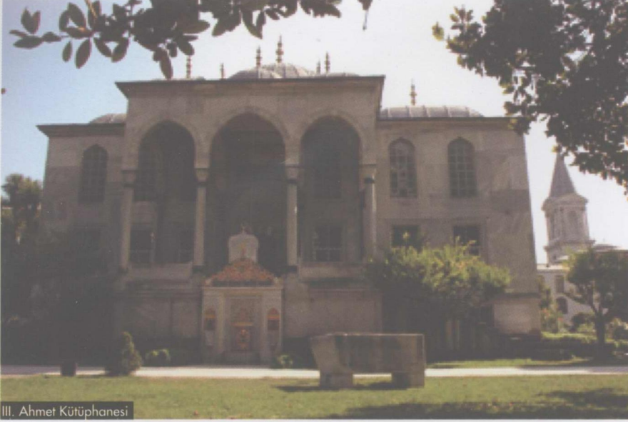
III. Ahmet Kütüphanesi

yapılarının başladığı Bâb-üs Selam arasında yer alan bu alanda iki yanda Sarayın büyük ölçüde günümüze ulaşmamış olan ve bostancılar denetimindeki Birun (dış) hizmet binaları vardır. Solda odun ambarları, "cebehane" olarak kullanılan Hagia Eirene kilisesi, XVIII. yy'da yapılan ve günümüze ulaşabilen darphane binaları, "Deavi Kasrı" vezirin, halkın şikayetlerini dinlediği yer görülürdü. Sağda ise sırası ile Gülhane hastahanesi, Has Fırın ve sarayın su sistemini oluşturan Dolap ocağı, birinci avluyu sınırlayan yapılarıdır.