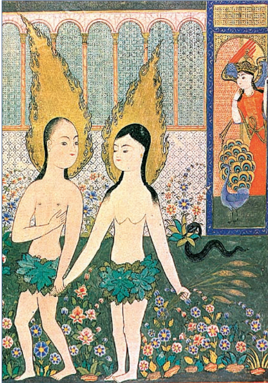
Resim 1. 'Âdem ve Havva'nın Cennetten Kovulması', Falnâme, y. 1610-15, Topkapı Sarayı Müzesi Kütüphanesi, H. 1703, f. 7b.

'Hz. Âdem ile Hz. Havva'nın cennetten kovulması' hadisesinin Türk-İslam minyatürlerinde sıklıkla işlendiği görülmektedir. Konuyla ilgili minyatürlerde cenneti tasvir eden mimari, tabii vb. estetik unsurlar değişebilmekle beraber, Hz. Âdem, Hz. Havva, melek, tavus kuşu ve yılan karakterleri, görünüşleri farklılık arz etse de kompozisyona temel karakterler olarak eşlik etmektedir. Topkapı Sarayı Müzesi'nde yer alan Falnâme yazmasından konuyla ilgili bir minyatürde (Farhad vd. 2009: 69) cenneti temsil eden rengârenk çiçeklerin bulun-