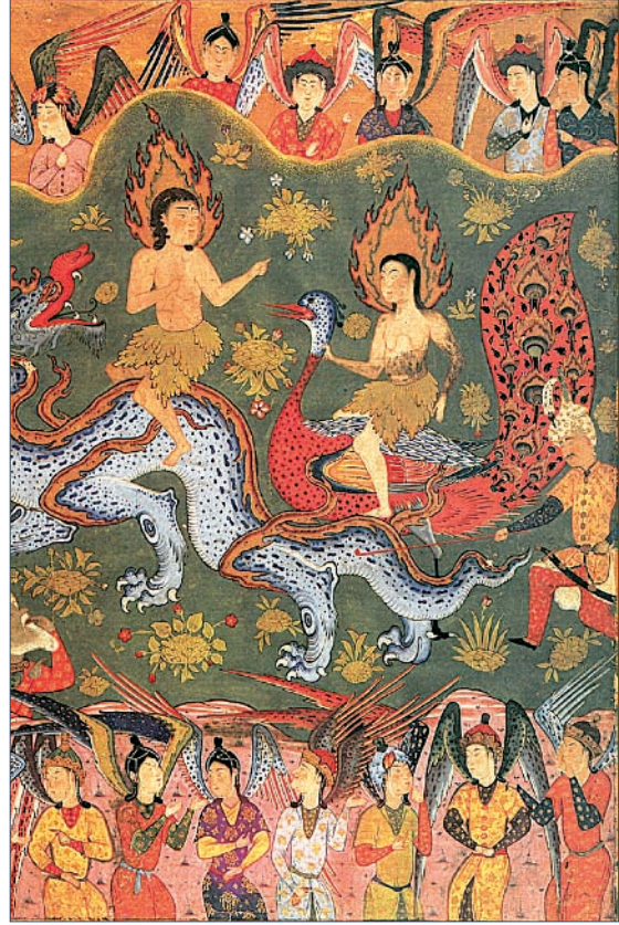
Resim 2. 'Âdem ve Havva'nın Cennetten Kovulması', Falnâme, y. 1550-60, Arthur M. Sackler Gallery, S1986.251a.

duğu zeminde, başlarındaki alevden halelerle tasvir edilen Hz. Âdem ile Hz. Havva el ele tutuşur vaziyette ayakta resmedilmiştir (Resim 1). İncir yapraklarıyla örtülü kısıc bölgeleri dışında gövdelerinin diğer uzuvları çıplak halde tasvir edilmiş çiftten, Hz. Havva'nın sol elinde buğday başakları taşıdığı görülmektedir. Arka planda cenneti betimleyen mukarnas başlıklı sütunlar arasındaki açıklığı örten beşik kemerli alanın yan tarafındaki kapıda şaşkın bakışlarıyla bir meleğin beklemekte olduğu ve meleğin ön tarafında, kapının eşiğinde de bir tavus kuşunun durduğu görülmektedir. Kapının dışında ise kıvrılmış gövdesiyle siyah bir yılanın varlığı dikkati çekmektedir.