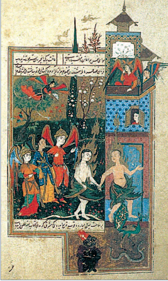
Resim 3. 'Âdem ve Havva'nın Cennetten Kовulması', Hadikatü's-Süedâ , Bibliothèque Nationale, suppl. Turc 1088.