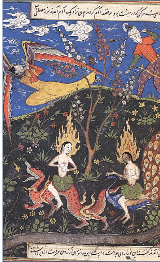
Resim 6. 'Âdem ve Havva'nın Cennetten Kovulması', Kısasü'l-Enbiyâ, Topkapı Sarayı Müzesi Kütüphanesi, H. 1228, f. 3b.

Benim Simurg'la ne işim olabilir ki, yüce cennet me-