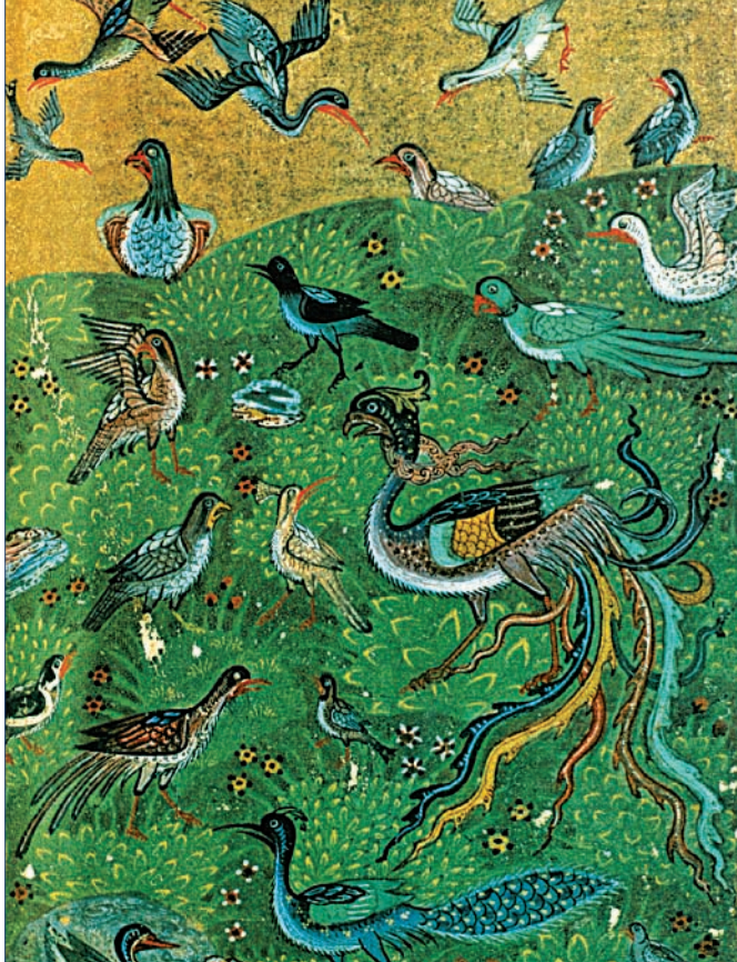
Resim 7. 'Kuşların toplanması', Mantiku't-Tayr, 1493, Bodleian Library, Elliot 246, 25b.

Sühreverdî'ye göre aynı zamanda Simurg'un yuvası olan tüm tohumlar ağacı , ruhun ilk şekline (şekl-i evvel) geri dönüşü ile irtibatlandırılmaktadır. İncil ve Kur'an'daki ifadesiyle Hz. Âdem ile Hz. Havva hikâyesi de Adn (Aden) bahçesinde, iyiyi ve kötüyü bilme ağacı olan kozmik ağaçla (şeceretü'l-huld) ilgili olarak geçmektedir (Cole 1994: 157, 158). Sühreverdî ruhunu irşad etme gayesindeki ve hasta konumunda bulunan sâlikin Kaf Dağı'na gitmesinin gerekliliğinden, orada bulunan bir ağacı öne sürerek bahsetmektedir. İşte Simurg'un yuvası da bu ağaç üzerindedir. Sâlik bu ağacı eline geçirmeli ve onun meyvesini yemelidir. Bundan sonra hasta doktora ihtiyaç duymayacak ve kendisi tabip olacaktır. Bu makam da, insânî nefsin kendisini Nurlar Nûru'nun işrakıyla idrak ettiği, kendisinin ve bütün nurların Nurlar Nûru'nun kahhâr nûrunda yokluğa büründüğü idrak seviyesi olmalıdır (Yenen 2007: 127).