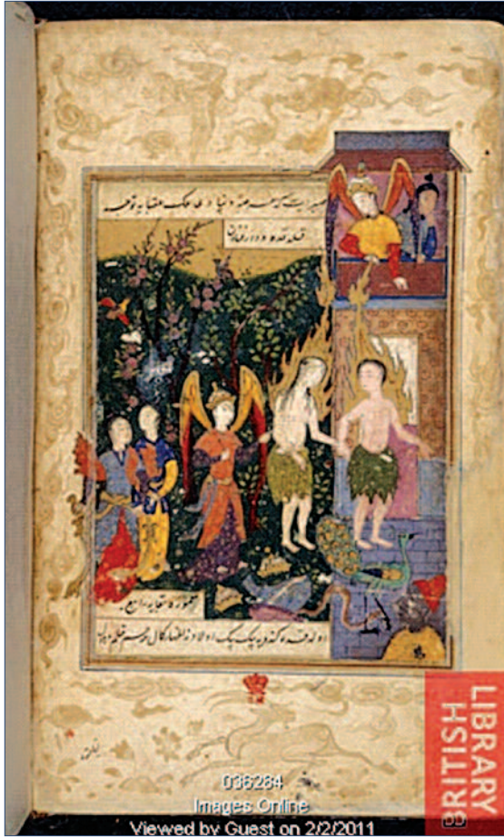
Resim 5. 'Âdem ve Havva'nın Cennetten Kovulması', Hadikatü's-Süedâ, British Library, Or. 12009, f. 7v.

makta olan bir kişinin varlığı dikkat çekmektedir. Şeytan ise, bu defa diğer minyatürlerden oldukça farklı bir biçimde melek görünümünde tasvir edilerek ellerini adeta çifti cennetten uzaklaştırmakla ulaştığı zaferin coşkusuyla alkış tutar konumda birleştirerek kompozisyona katılmaktadır.