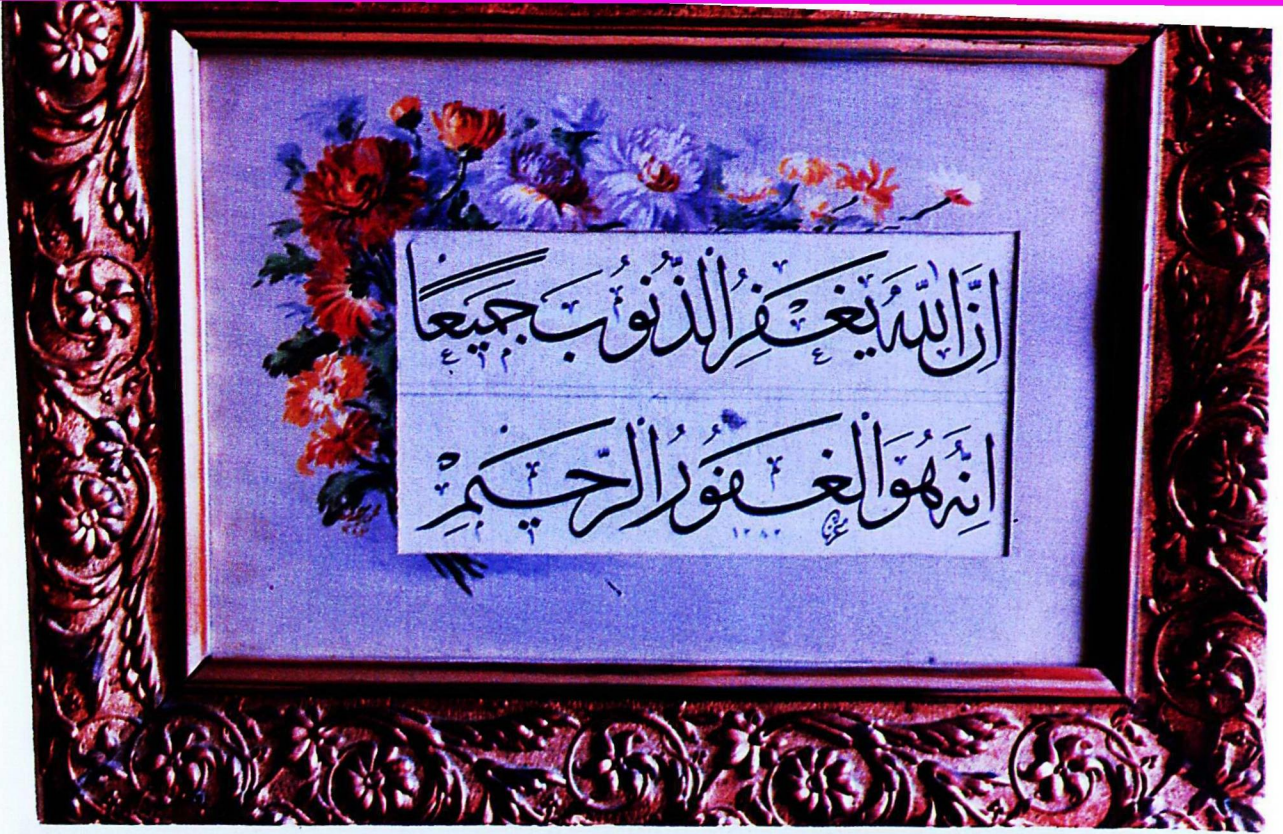
9. Konya Türk İslâm Eserleri Müzesi'nden 197 envanter numaralı eser.