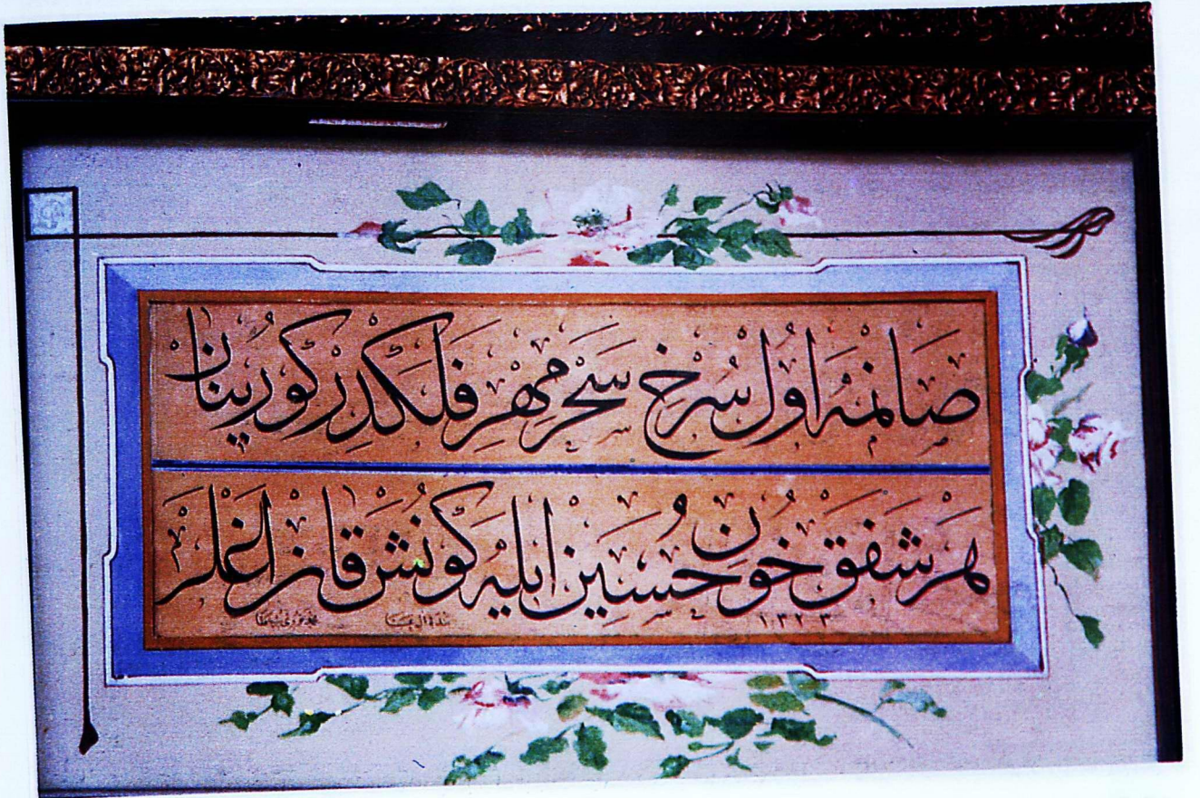
16. Mevlâna Müzesi'nden 232 envanter numaralı eser.