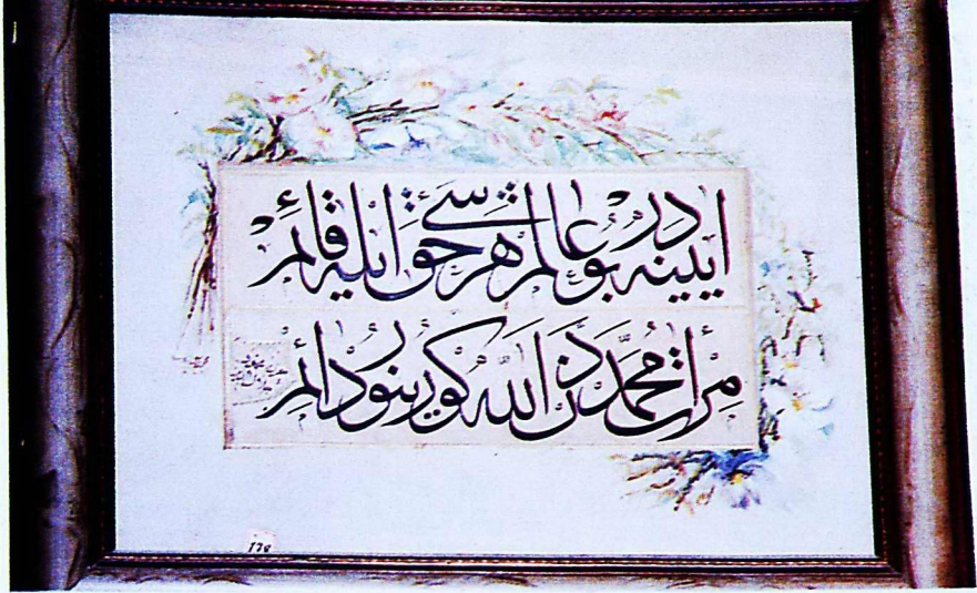
10. Mevlâna Müzesi'nden 178 envanter numaralı eser.