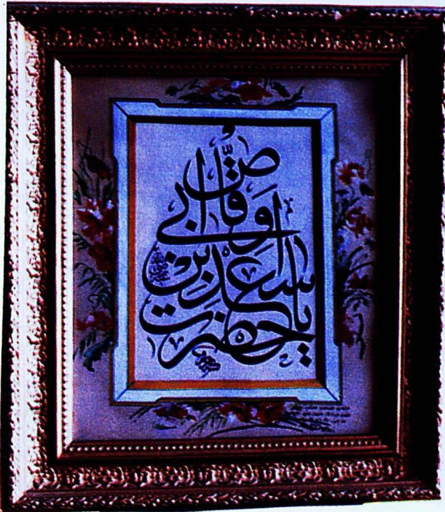
7. Konya Türk İslâm Eserleri Müzesi'nden 175 envanter numaralı eser.