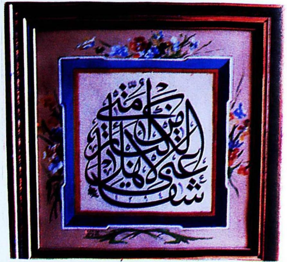
8. Konya Türk İslâm Eserleri Müzesi'nden 189 envanter numaralı eser.