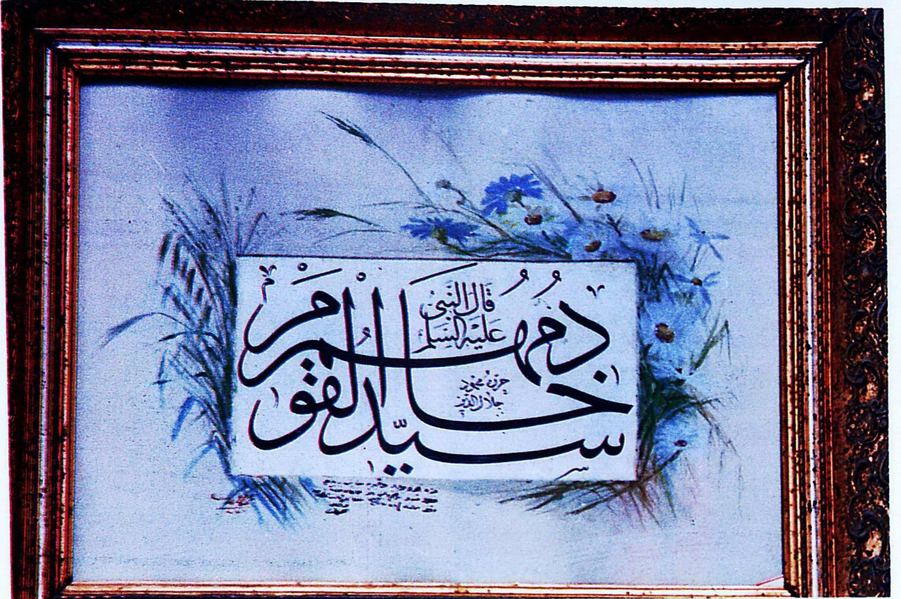
6. Mevlâna Müzesi'nden 179 envanter numaralı eser.