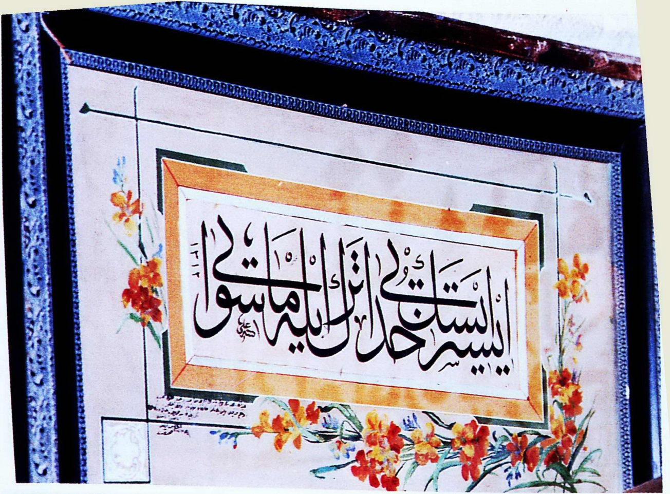
1. Mevlâna Müzesi'nden 216 envanter numaralı eser.