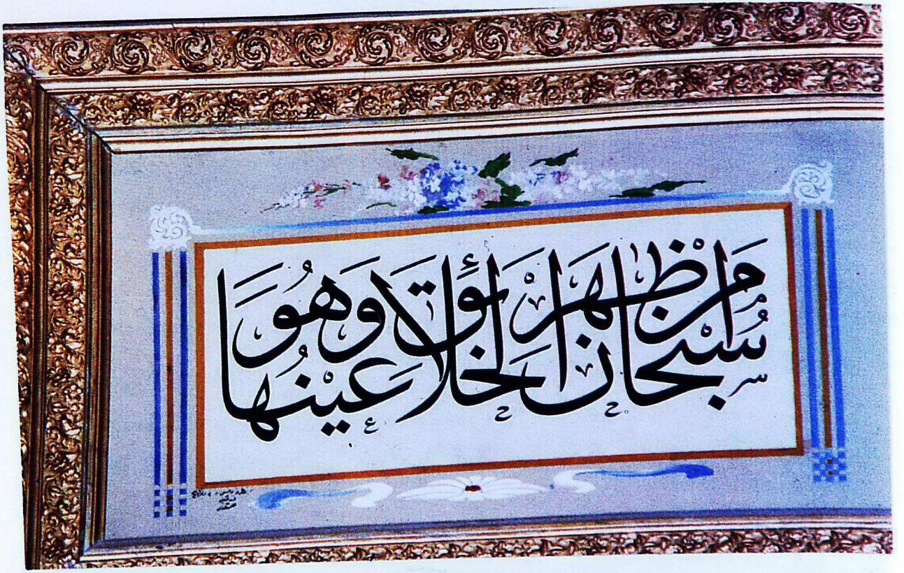
3. Mevlâna Müzesi'nden 236 envanter numaralı eser.