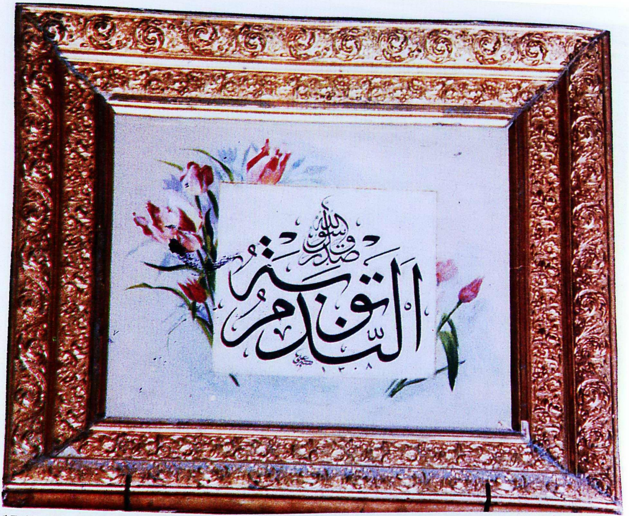
17. Mevlâna Müzesi'nden 212 envanter numaralı eser.