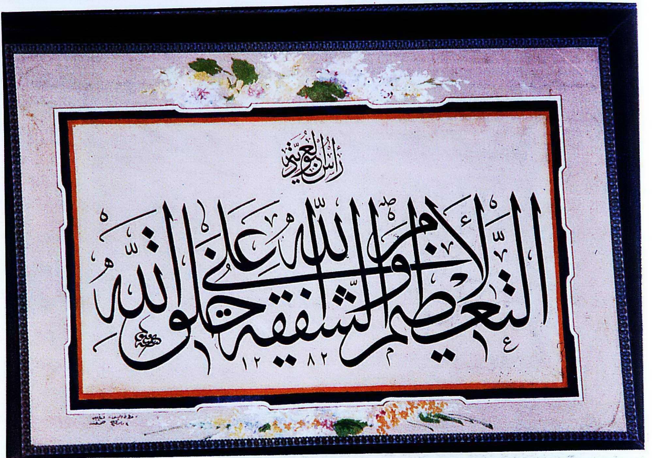
4. Mevlâna Müzesi'nden 191 envanter numaralı eser.