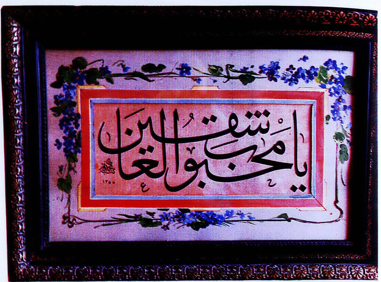
13. Türk İslâm Eserleri Müzesi'nden 238 envanter numaralı eser.