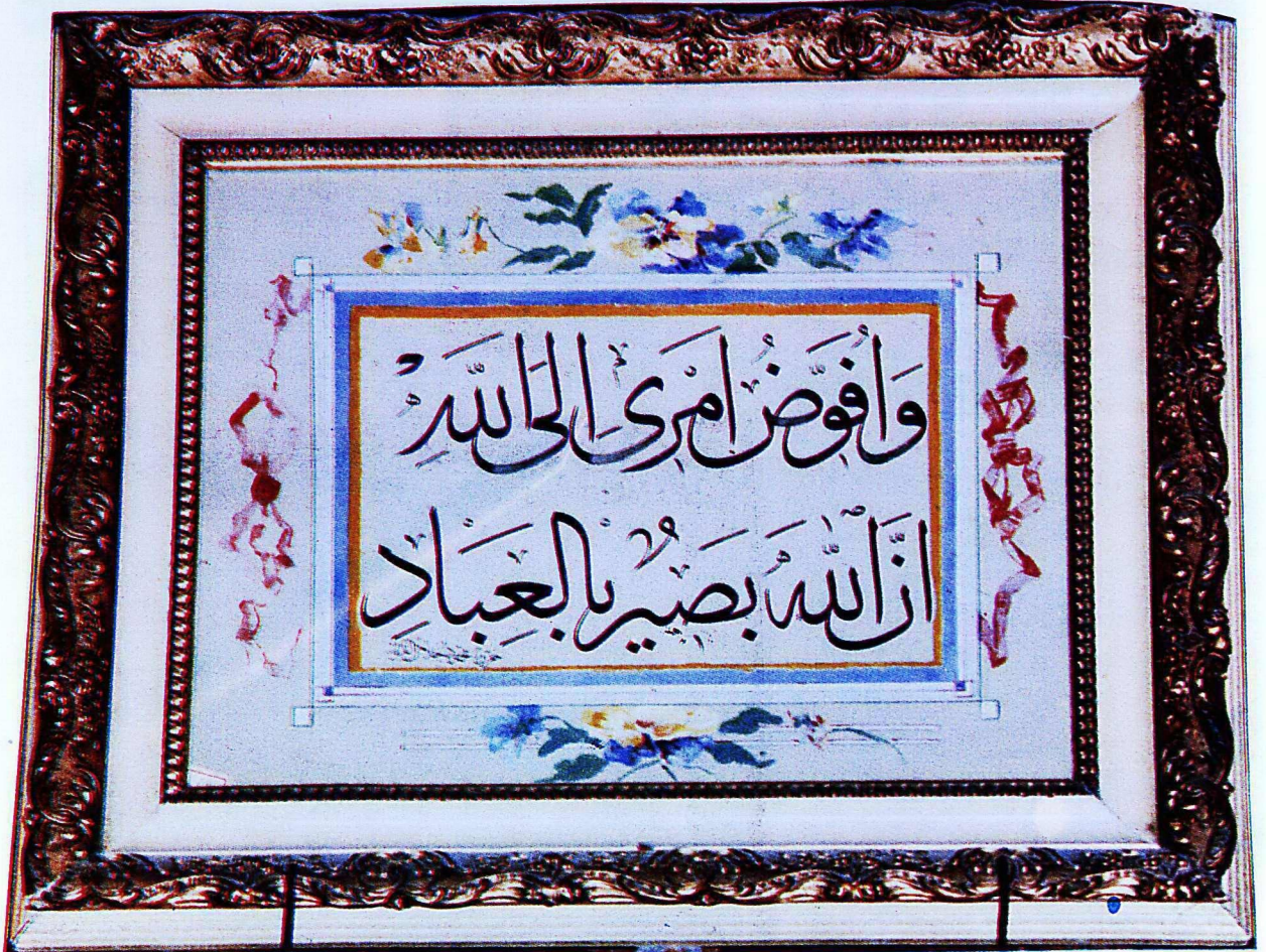
14. Mevlâna Müzesi'nden 180 envanter numaralı eser.