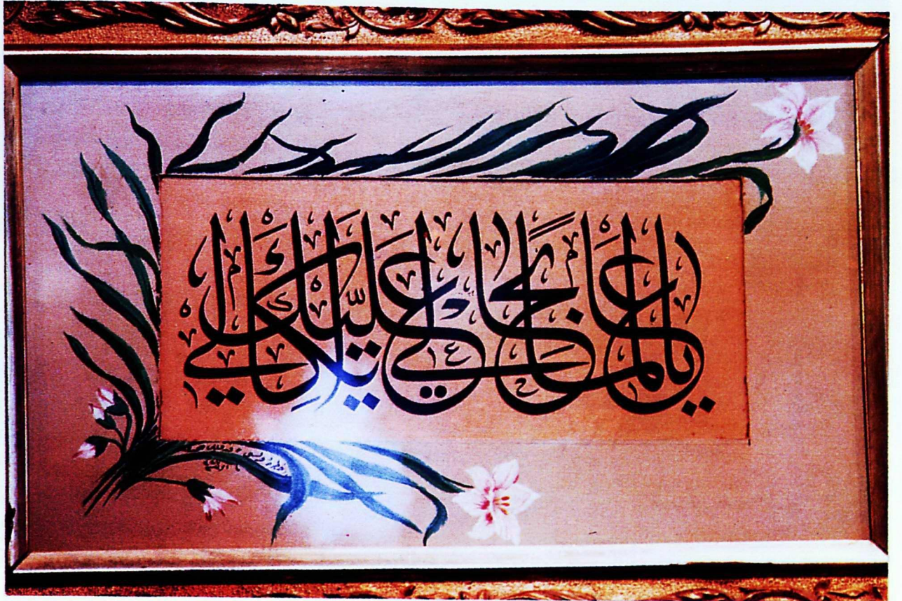
2. Mevlâna Müzesi'nden 252 envanter numaralı eser.