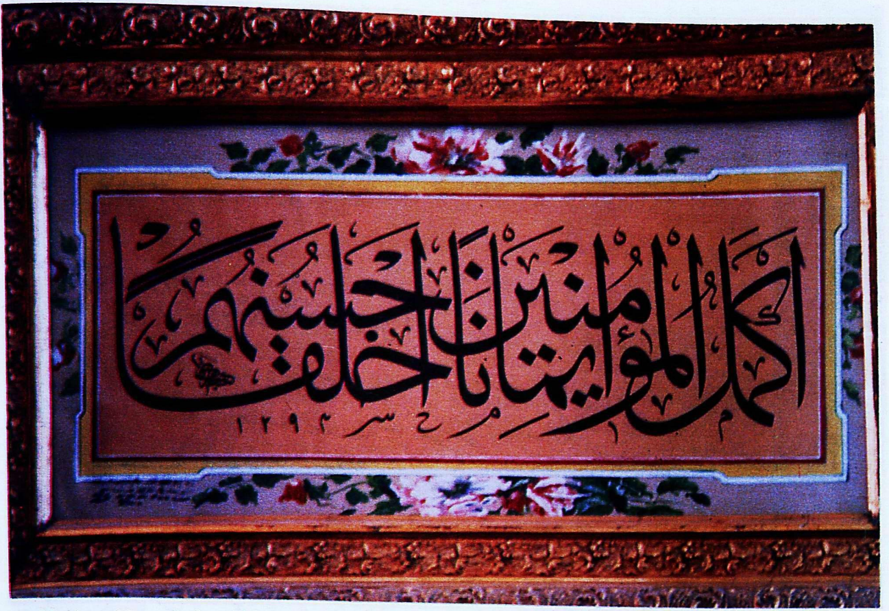
5. Mevlâna Müzesi'nden 190 envanter numaralı eser.