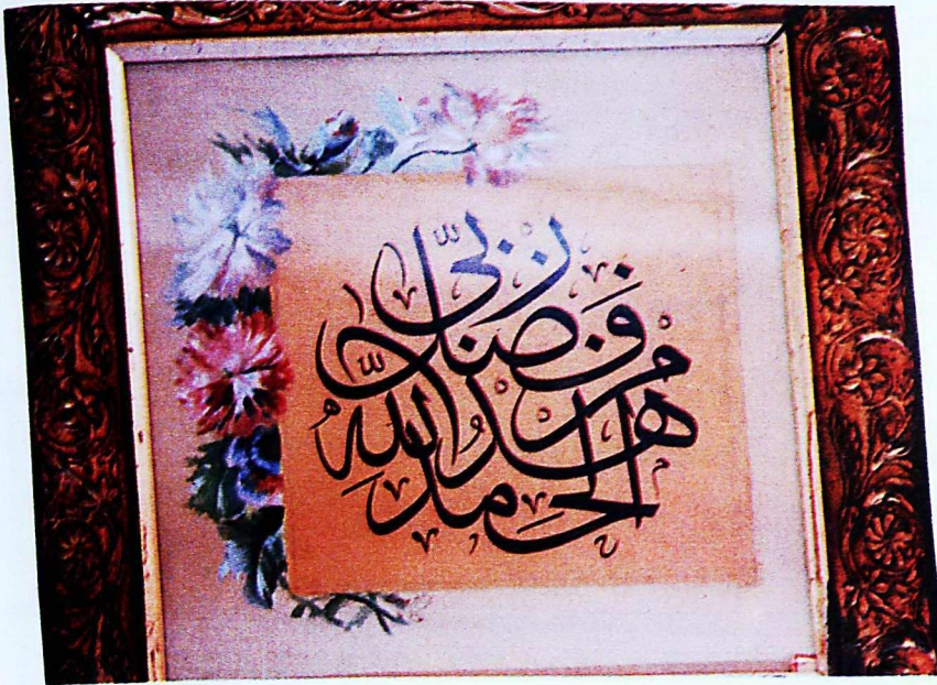
11. Mevlâna Müzesi'nden 229 envanter numaralı eser.