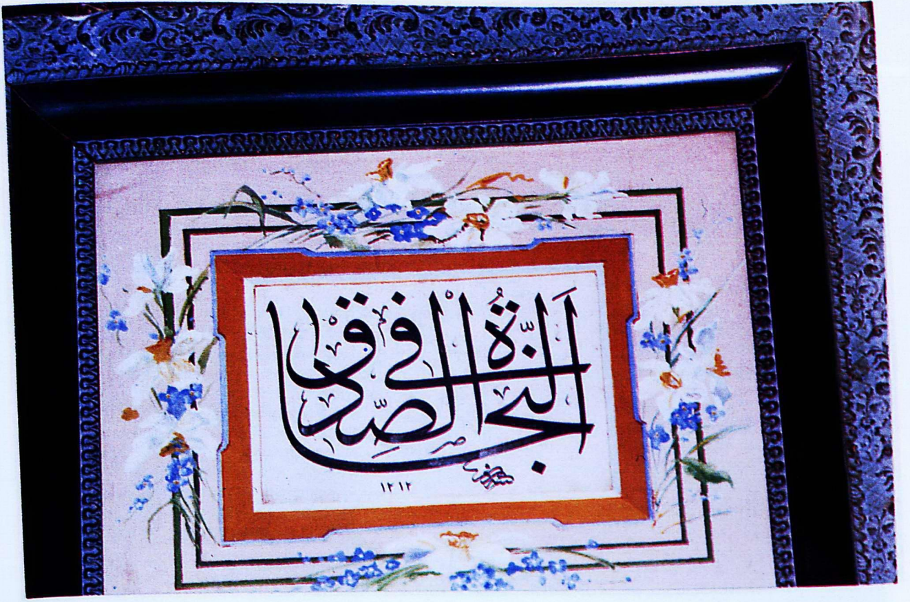
15. Mevlâna Müzesi'nden 174 envanter numaralı eser.