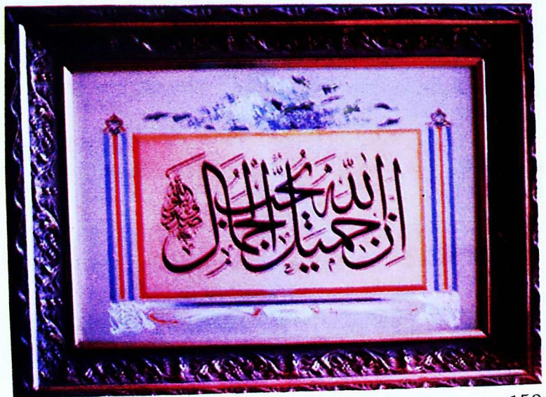
12. Türk İslâm Eserleri Müzesi'nden 192 envanter numaralı eser.