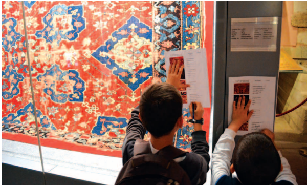
Fotograf 16. Çalışma grubu motif bilgilerini toplarken