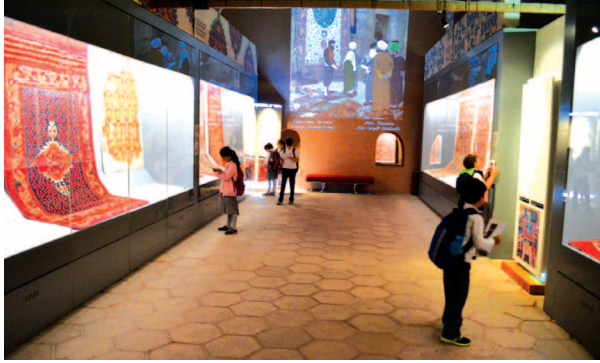
Fotograf 15. Çalışma grubu Halı Müzesinde motif avlarken