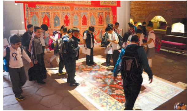
Fotoğraf 14. Çalışma grubu ile birlikte Vakıflar Halı Müzesini keşfederken

eserler hakkında verilen ilginç bilgilerle öğrencilerin merak duyguları ile keşfetme istekleri uyarılarak motivasyonlarının üst seviyede kalması ve halılarda motif avı etkinliği için güdülenmeleri sağlanmıştır. Böylelikle çalışma grubu halılarda motif avı etkinliği için hazır hale getirilmiştir (Fotoğraf 14).