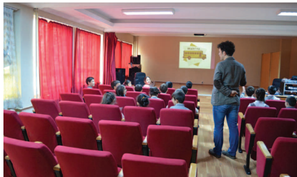
Fotoğraf 2. Çalışma grubuna projenin uygulaması hakkında bilgi verilirken