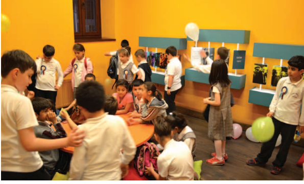
Fotoğraf 19. Çalışma grubu Mustafa Kemal Müzesi çocuk atölyesinde