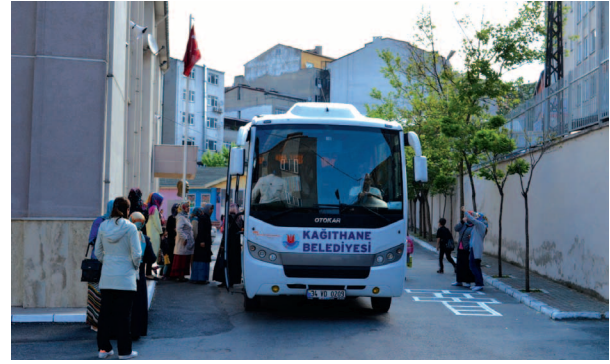
Fotoğraf 12. Çalışma grubu ile birlikte okul bahçesinde Müzelere hareket ederken

Halı Müzesi Etkinlikleri: Proje programında olduğu üzere saat 10.00’da Halı Müzesi’ne ulaşılmıştır (Fotoğraf 13). Çalışma grubu ile kısa bir müze gezisi yapılırken müzedeki yetkili tarafından grubun anlayabileceği bir dille kendilerine müze ve halılar hakkında bilgilendirme ve tanıtım yapılmıştır. Müzedeki interaktif uygulamalar, müze, vakıflar ve