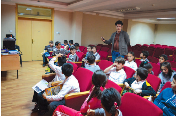
Fotoğraf 4. Çalışma grubuna bir sonraki buluşma için ödevleri verilirken

Ayrıca çalışma grubundan, bir sonraki buluşmaya gelirken aile bireylerinin isimlerini öğrenip gelmeleri istenmiştir. Bu isimlerin ikinci buluşmada yapılacak olan etkinliklerden soy ağacı yapımında kullanılacağı öğrencilere söylenmiştir. Ebeveynlerine aile bireyleri ve akrabalarının isimlerini soracakları düşünülerek öğrencilerin aileleri ile birlikte sürece etkin bir şekilde katılmaları sağlanmıştır (Fotoğraf 4). İkinci buluşma için verilen bu ödevlerle öğrencilerin kitap okuma, araştırma yapma, bilgi toplama, bilgiyi kaydetme, düzenleme ve sunma becerisi kazanmaları hedeflenmiştir.