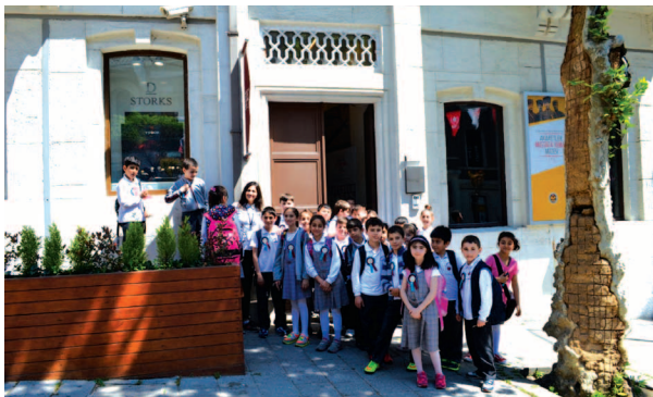
Fotograf 17. Çalışma grubu Mustafa Kemal Müzesinde

Uygulamada bütün çalışma grubu sırasıyla aynı galeride yer almıştır. Ancak sadece o galeride motif avı yapacak grup görevlendirilmiştir. Örneğin çalışma grubunun hepsi 1. galeride iken o galeride sadece 1. grup öğrenciler halılarda motif avı etkinliği yapmıştır. Öğrencilere, motiflerden yola çıkarak buldukları halıları birbirlerine söylememeleri ve izleyici grubun da araştıran gruba yardımcı olmamaları gerektiği söylenmiştir. Halılarda motif avı, 3 galeride 3 grubun da etkinliği gerçekleştirmesiyle sonlandırılmıştır (Fotograf 15, 16). Programlandığı gibi çalışma grubu ile birlikte saat 11.00'de Halı Müzesi'nden diğer etkinlikleri gerçekleştirmek üzere Mustafa Kemal Müzesi'ne doğru yola çıkmıştır.