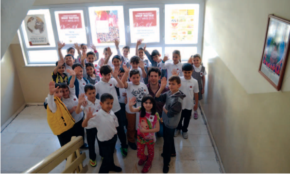
Fotoğraf 8. Çalışma grubuyla Vakıf Haftası afişlerini astıktan sonra