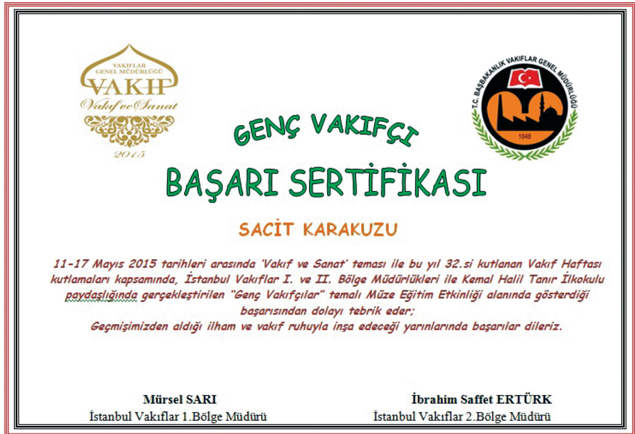
Şekil 5. Genç Vakıfçı Başarı Sertifikası