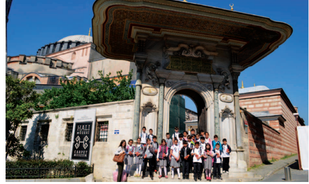
Fotoğraf 13. Çalışma grubu ile birlikte Vakıflar Halı Müzesi önünde