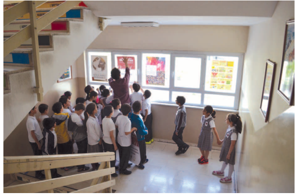
Fotoğraf 7. Çalışma grubuyla okulda Vakıf Haftası afişlerini asarken