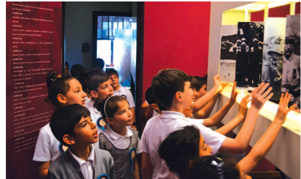
Fotograf 18. Çalışma grubu Mustafa Kemal Müzesini tanırken

Mustafa Kemal Müzesi Etkinlikleri: Program doğrultusunda saat 11.30'da Mustafa Kemal Müzesi'ne ulaşılmıştır (Fotograf 17). Çalışma grubu ile kısa bir müze gezisi yapılırken grubun kolayca kavrayabileceği bir dilde kendilerine Mustafa Kemal Atatürk, ailesi ve müze ev hakkında bilgilendirmeler yapılmıştır (Fotograf 18). Sonrasında çalışma grubuyla müzenin çocuk atölyesi kısmına geçilerek burada yemek ve dinlenme arası verilmiştir (Fotograf 19).