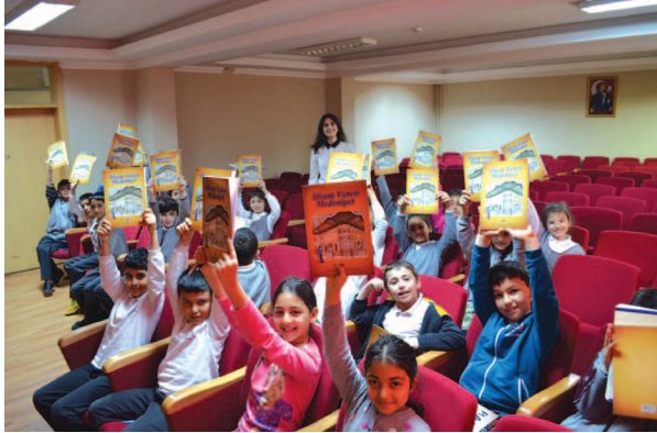
Fotoğraf 3. Çalışma grubu İlham Veren Medeniyet adlı çizgi romanlarıyla

Çalışma grubunu oluşturan 25 öğrenciye yaş ve gelişimlerine uygun olarak hazırlanmış Vakıfların ne olduğunun anlatıldığı "İlham Veren Medeniyet" adlı çizgi roman dağıtılarak bir sonraki buluşmaya kadar okuyup gelmeleri istenmiştir. Böylelikle çalışma grubunun Vakıflar hakkında bilgi sahibi olmaları, iyilik ve yardımlaşma gibi insani kavramları nedensel ağlar kurarak içselleştirmeleri hedeflenmiştir (Fotoğraf 3).