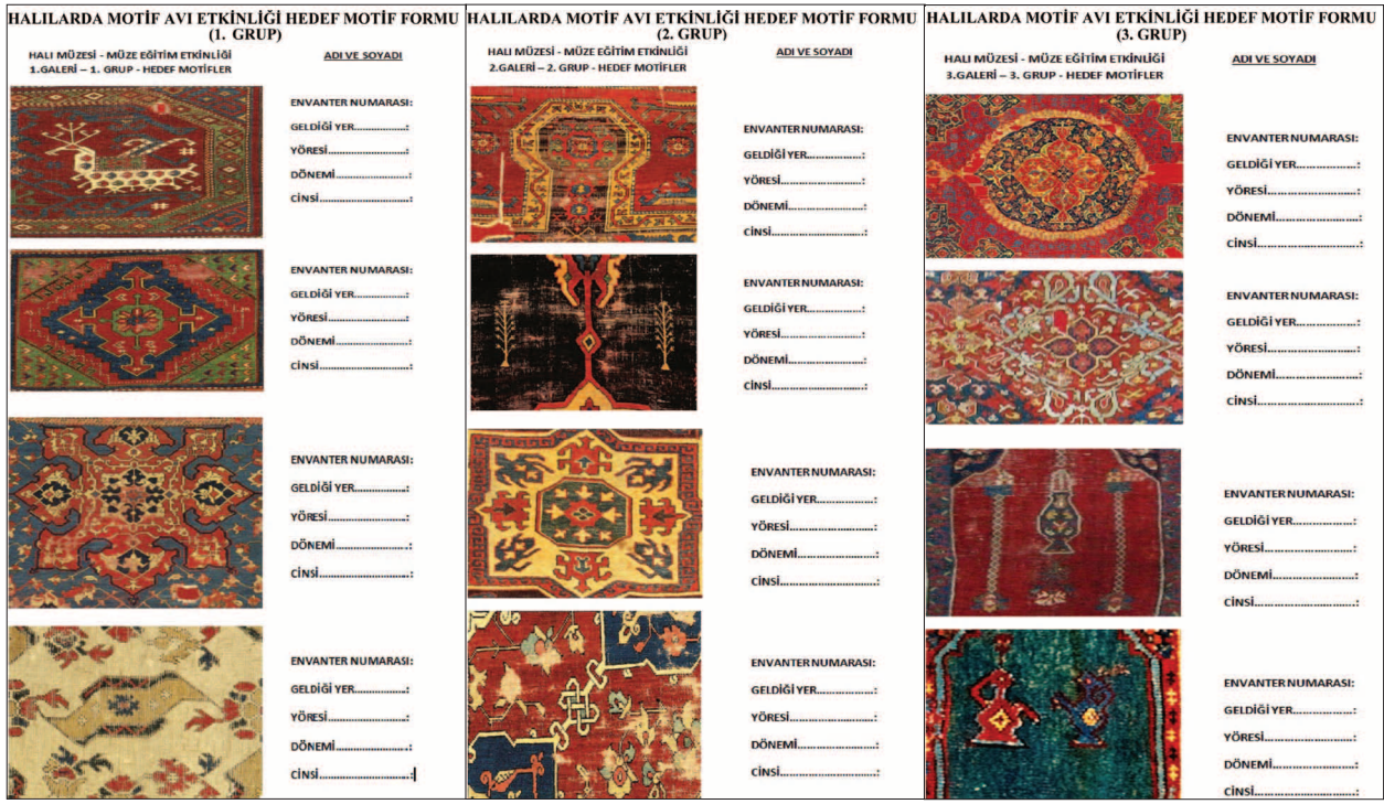
Şekil 4. Halılarda Motif Avı Etkinliği, Hedef Formları (1.grup, 2.grup, 3.grup)