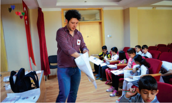
Fotoğraf 10. Çalışma grubuna etkinlikler öncesi materyal dağıtımı