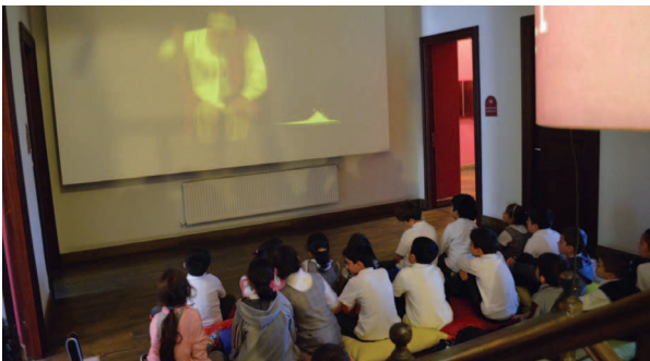
Fotoğraf 23. Çalışma grubu "Çocuk Meddahı Vakıf Dede" filmi izlerken

Mustafa Kemal Atatürk, müze ev ve müzedeki interaktif uygulamalar hakkında verilen ilginç bilgilerle öğrencilerde merak uyandırılarak motivasyonlarının üst seviyede kalması ve sonrasında gerçekleştirilecek etkinlikler için güdülenmeleri amaçlanmıştır. Böylelikle çalışma grubu "Benim Vakfım", "Atatürk'ün soy ağacı yapımı", "yap-boz" etkinlikleri için hazır hale geldikleri gözlemlenmiştir (Fotoğraf 20).