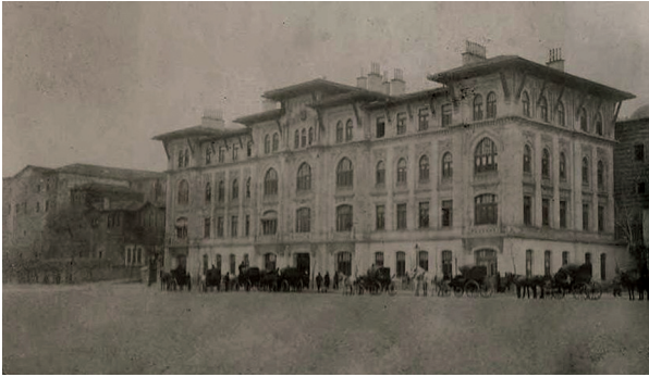
Defter-i Hakani Binası

Osmanlı Devletinin tüm tapu kayıtlarının tutulduğu ve kütük defterlerinin saklandığı merkezi örgüt Defter-i Hakani Nezareti'dir. 1871'e kadar adı Defterhane'dir. Ülke