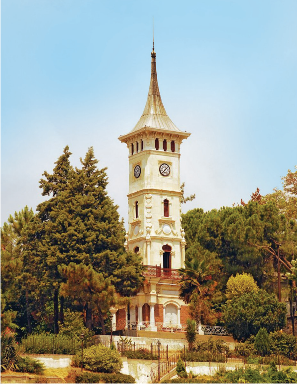
Saat Kulesi, İzmit.

Mimar Vedat'ın tasarladığı anıtsal yapılardan biri de İzmit'te bulunan saat kulesidir. Kule, Atatürk heykeli ile Küçük Saray arasında, 219 ada, 22 parselde yer almaktadır. Sultan II. Abdülhamit'in tahta çıkışının 25. Yıldönümü nedeniyle, 1902 yılında yaptırılmıştır (Onur 1988).