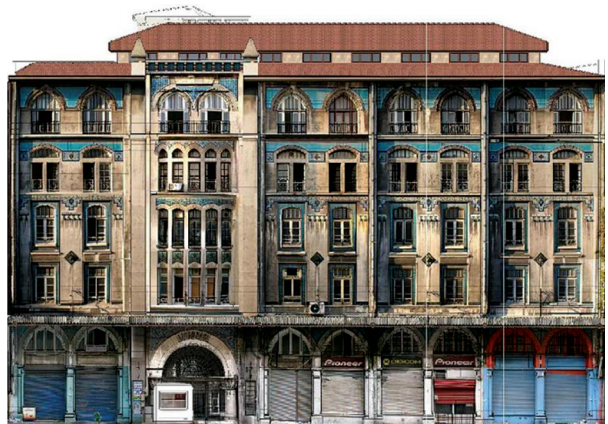
Liman Han Ön cephe

Yapı, betonarme karkastır. Duvarlar, dolgu tuğladan yapılmıştır. 4 katlı olan yapının, giriş katı yüksek tutulmuştur. Bu katta, asma katlı dükkânlar yer almaktadır. Binanın dış cephesinde sivri kemerler, pencerelerin etrafında görülen çiniler yapının dikkat çeken özelliklerindedir.