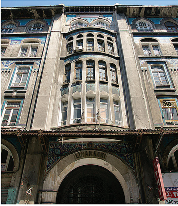
Liman Han giriş detayı