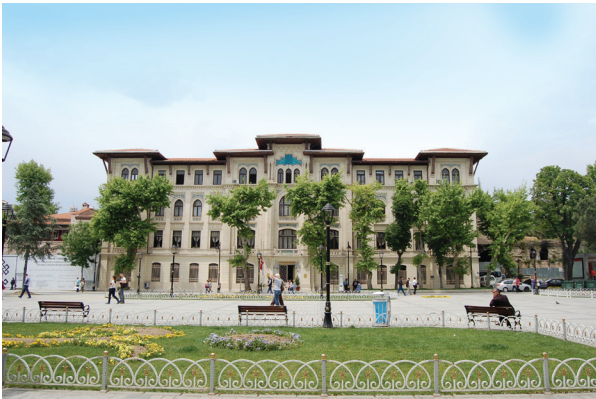
Defter-i Hakani Binası

genelindeki tüm tımar, zeamet, has, mülk, vakıf arazilerine ait toprak yazımlarına ait ana defterler Defterhane'de tutulmakta, gerektiğinde bu defterlerdeki kayıtlara başvurulmaktadır. Defterhane, önceleri Divanı Hümayuna bağlı iken, Defter-i Hakani Nezareti'nin kurulmasıyla, 1871 yılında Sultanahmet'teki Defteri Hakani binasına taşınmıştır (İstanbul Ansiklopedisi).