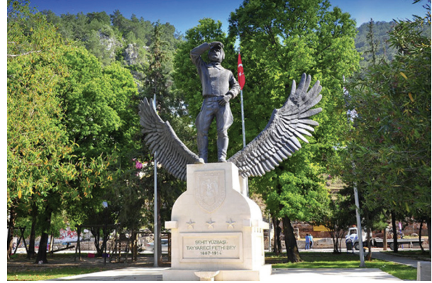
Kastamonu Hükümet Konağı.

Girişi öne çıkarılarak vurgulanan yapı, her iki köşesi öne doğru çıkıntılıdır. Yapı, 80 cm.lik taş duvarlardan, iç bölme duvarlar ise tuğladan yapılmıştır (Onur 1988). Yapının bodrum katı, depo ve arşiv olarak, 1. Katı ise valilik katı olarak tasarlanmıştır. Girişin üstü, valinin odası olarak gösterilmektedir. Pencerelemin üstünde çini işçiliği göze çarpmaktadır. Yapının cephesinde, basık kemerli, sivri kemerli ve dikdörtgen pencereler bir arada kullanılmıştır.