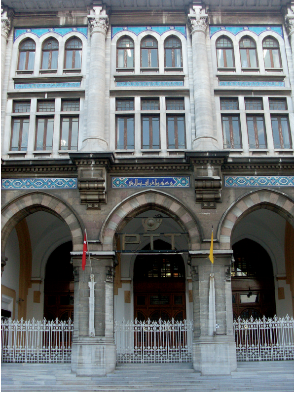
Büyük Postane, yakından

elemanlarının kullanımı ve geçmişe yönelik özellikleriyle, Mimar Vedat'ın mimarlık kişiliği ile özdeşleşen en önemli yapıdır (Seçkin-Sönmezer 2003).