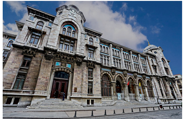
Büyük Postane binası

Mimar Vedat yapının sürecini şöyle anlatmaktadır: "... beni çağıran Posta Nazırı Hasip Efendi, Meydancık'taki tanzifat (temizlik) ahırlarının bulunduğu yerde yapılacak Yeni Posta Nezareti Binasının tarafımdan inşasını münasip görüldüğünü ve derhal işe başlamamı tebliğ etti. Kollar sıvadık, fakat o devrin hali malûm. Adım başına bir müşkülât; vaktinde para vermezler, günlerce durur bekleriz. Tam yarı yerde akıllının biri çıkar "efendim der, üst katlar ahşap olsa!..." Bir münakaşa mücadeledir, gider. Böylece uğraşa, çabalaya nihayet beş senede binayı bitirdik..." Anıtsal yapı kavramına millî mimari içerisinde yeni bir boyut getiren bu yapı, Osmanlı klasik üslubunda süsleme