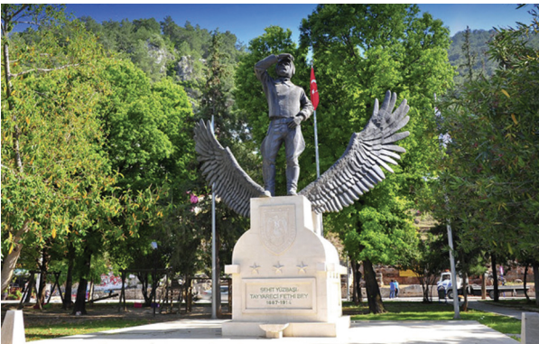
Tayyare Şehitleri Anıtı

Fatih'te, Fatih Belediyesi, yahut Kaymakamlığı önündeki Tayyare Şehitleri Anıtı, Vedat Tek'in eserlerindedir. İstanbul'dan Kahire'ye gidecek uçakların, Şam yakınlarında