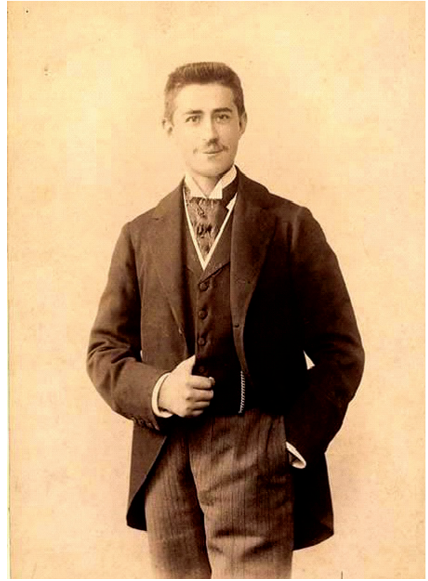
Ecole Nationale et Spéciale des Beaux Arts'ta Vedat Tek (Karahan, O. "Sabit Bey Hanı'nın Restorasyon Projesi", Yüksek Lisans Tezi).

Vedat Tek, Batı'dan aldığı bu yoğun formel eğitime ve buradaki yapılardan etkilenmesine rağmen, ülkeye döndüğünde gördüklerini taklit etmekten kaçınmış, yapıtlarına Türkiye'ye özgü bir nitelik kazandırmak istemiştir. Bunun için de tarihsel Türk mimarlığı üzerinde çalışmış, Arabesk, Osmanlı, Selçuk Mimarlığının ürünlerini kendi eserlerinde kaynak olarak kullanmaya çalışmıştır.