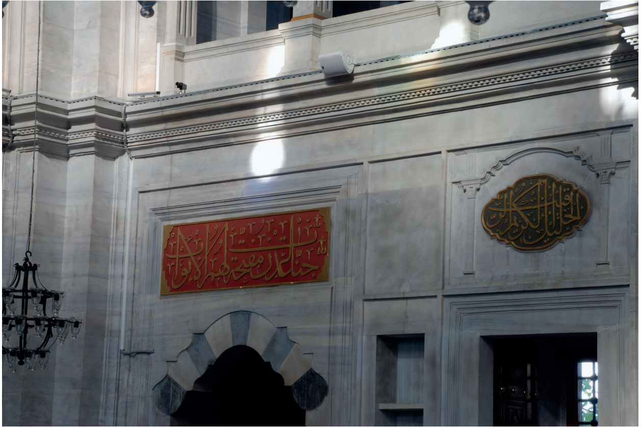
Fotoğraf 1. Yedikuleli Seyyid Abdülhalim Efendi'nin doğu kapısı üzerindeki hatları (H. Murat Ceylan, 2012)