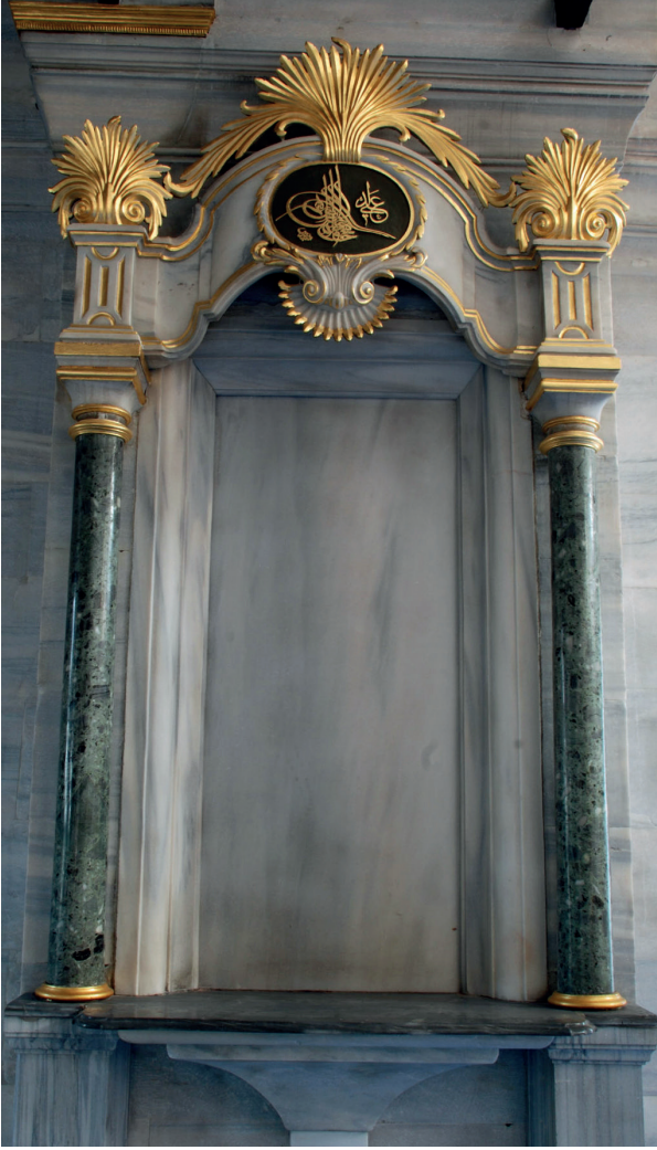
Fotoğraf 23. Hattat Râkım imzalı Sultan II. Mahmud Tuğrası

nan münafik erkeklere ve münafik kadınlara, Allah'a ortak koşan erkeklere ve Allah'a ortak koşan kadınlara azap etmesi içindir. Kötülük girdabı onların başına olsun! Allah onlara gazap etmiş, onları lanetlemiş ve kendilerine cehennemi hazırlamıştır. Orası ne kötü bir varış yeridir! 7. Göklerin ve yerin orduları Allah'ındır. Allah mutlak güç sahibidir, hüküm ve hikmet sahibidir. 8. (Ey Muhammed!) Süphesiz biz seni bir şahit, bir müjdeci ve bir uyarıcı olarak gönderdik. 9. Ey insanlar! Allah'a ve Peygamber'ine inanmanız, ona yardım edersiniz, ona saygı gösterirsiniz ve sabah akşam Allah'ı tespih edersiniz diye (Peygamber'i gönderdik). 10. Sana biat edenler ancak Allah'a biat etmiş olurlar. Allah'ın eli onların ellerinin üzerindedir. Verdiği sözden dönen kendi aleyhine dönmüş olur. Allah'a verdiği sözü yerine getirene, Allah büyük bir mükâfat verecektir. 11. Bedevilerin (savastan) geri bırakılanları sana, "bizi mallarımız ve ailelerimiz alıyordu; Allah'tan bizim için af dile" diyecekler. Onlar kalplerinde olmayana dilleriyle söylerler. De ki: "Allah sizin bir zarara uğramanızı dilerse yahut bir yarar elde etmenizi dilerse, ona karşı kimin bir seye gücü yeter? Hayır, Allah yaptıklarınızdan haberdardır." 12. (Ey münafiklar!) Siz aslında, Peygamber'in