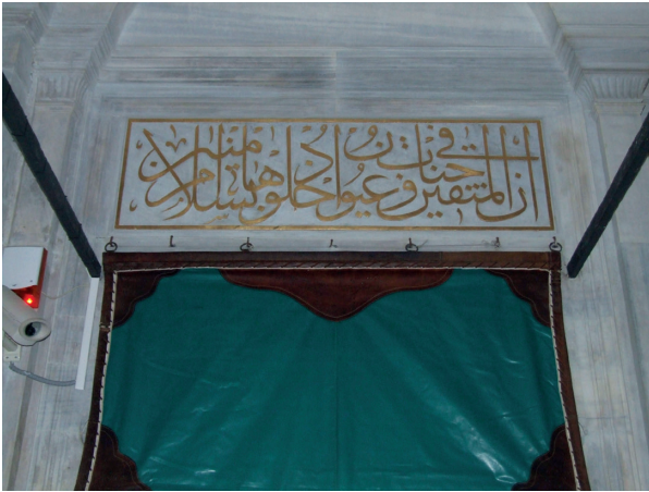
Fotoğraf 6. Avluya açılan kapı üzerinde Raâd Suresinin, 24. Ayeti (batı) (H. Murat Ceylan, 2012)