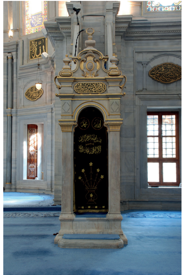
Fotoğraf 14. Minber üzerinde Kelime-i Tevhit (H. Murat Ceylan, 2012)

Hafız ile Bürhan yazılı Hazret-i Muhammed'in gü- zel isim ve sıfatlarının arasında; Padişahın müzehhibi ve