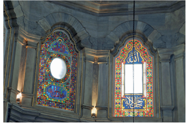
Fotoğraf 11. Mihrap duvarındaki yazılı Osmanlı vitrayları (H. Murat Ceylan, 2012)