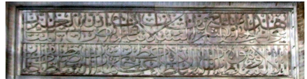
Fotoğraf 4. Avlunun solundaki kapının iç tarafında sultan isimleri

yüzünde yer alan ayet ile caminin içindeki kuşak yazılar, Mumcuzâde Mehmed bin Ahmed Rasim Efendi tarafından; iki yan kapının iç yüzündeki ayetler, Yedikuleli Seyyid Abdülhalim Efendi tarafından; diğer celi hatlar ise, Kâtipzâde Mehmed Refi Efendi tarafından yazılmıştır.