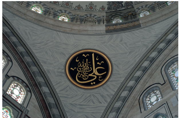
Fotoğraf 16, 17, 18, 19. Pantantiflerde Mumcuzâde Mehmed bin Ahmed Rasim Efendi tarafından yazılan celi hatlar (H. Murat Ceylan, 2012)