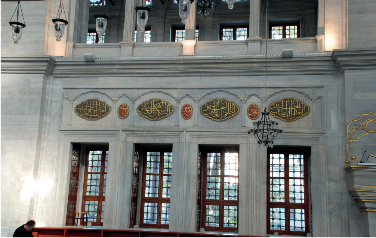
Fotoğraf 8. Alt pencerelerin üzerinde yer alan Esmâü'l Hüsna'lar ve Hazret-i Muhammed'in güzel isim ve sıfatları