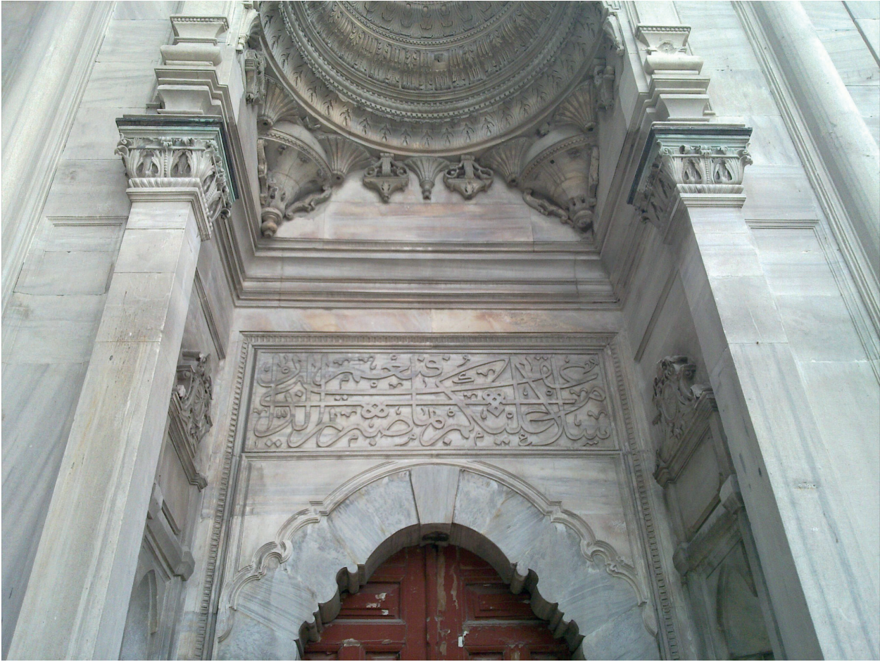
Fotoğraf 5. Avluya açılan kapı üzerinde İniâm Suresi'nin 54. Ayeti.( doğu) (H. Murat Ceylan, 2012)