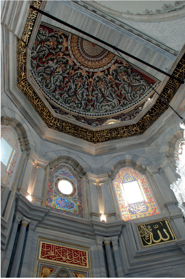
Fotoğraf 20. Kuşak yazıda Fetih Suresinin tamamı