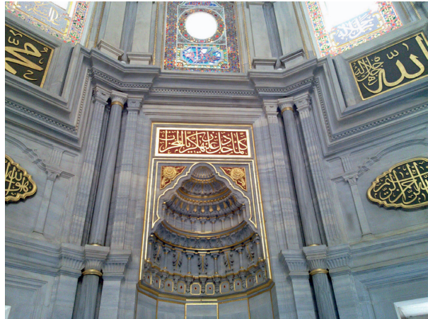
Fotoğraf 9. Mihrabın üzerinde Ali İmran Suresinin 37. Ayeti (H. Murat Ceylan, 2012)

Mihrabın girintisinin sağ ve solunda bulunan dikdörtgen alanlar içine, celi sülüs hat ile sağ tarafta Allah (C.C) lafzı, sol tarafta ise Muhammed (A.S) yazılmıştır.