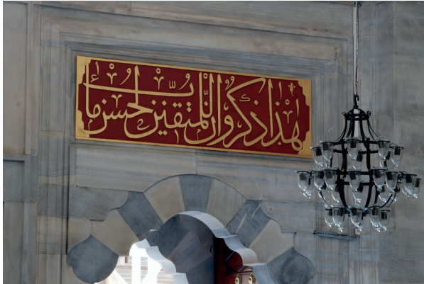
Fotoğraf 2. Yedikuleli Seyyid Abdülhalim Efendi'nin batı kapısı üzerindeki hatları (H. Murat Ceylan, 2012)