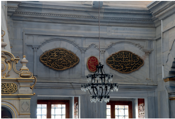
Fotoğraf 13. Ali bin Murad imzalı yazılar (H. Murat Ceylan, 2012)

Ayeti ile Muhakkak ki namaz hayâsızlıktan ve fenalıktan alı- koyar. Allah' ı anmak ne büyük şeydir anlamındaki Ankebüt Süresinin 45. Ayeti yazılmıştır.