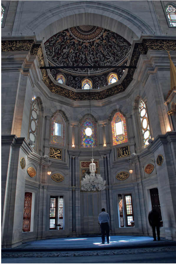
Fotoğraf 10. Mihrabın sağında: Allah (C.C) lafzı, solunda Muhammed (A.S),