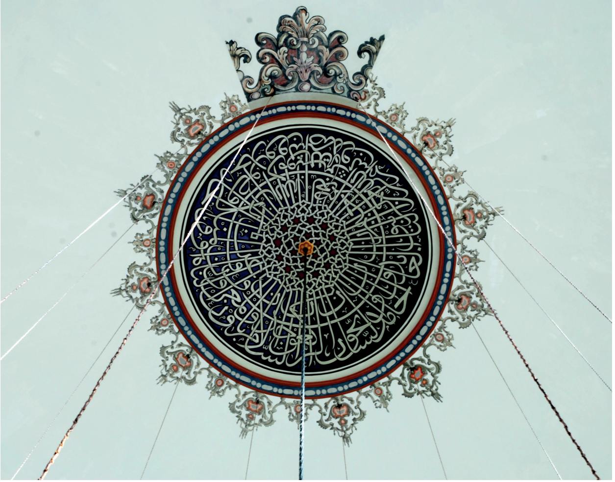
Fotoğraf 15. Ana kubbenin ortasında Tevbe Süresinin 112. Ayeti