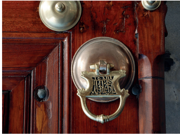
Fotoğraf 7. Sağ ve sol kapıların üzerinde yer alan: Bize en hayırlı kapıları aç anlamındaki dua.

Camiye girişlerdeki sağ ve sol ahşap kapıların üzerinde yer alan, pirinç ile katia tekniğinde yapılmış kapı kollarında, Bize en hayırlı kapıları aç anlamındaki dua yer almaktadır.