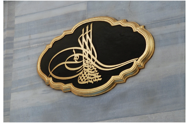
Fotoğraf 12. Sultan III. Mustafa'nın Tuğrası (H. Murat Ceylan, 2012)