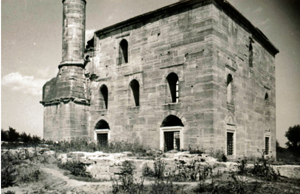
Babaeski Cedit Valide Camii