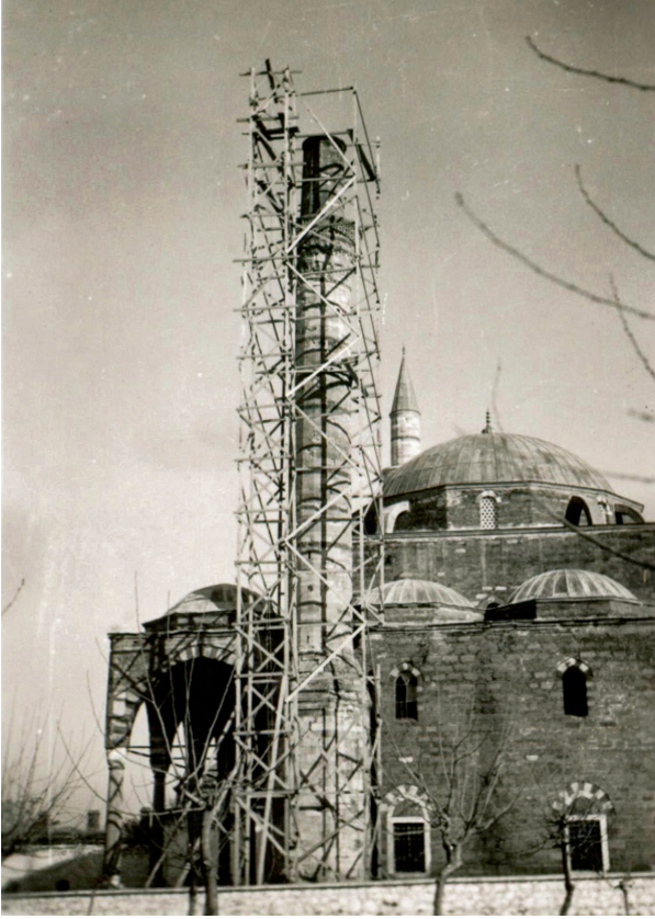
Manisa Ulu Camii restorasyonu (20.12.1953)