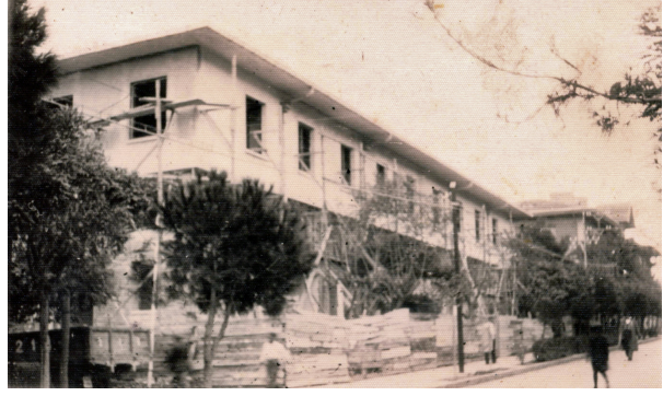
Manisa Vakıf İş Hami restorasyon çalışmaları

Korgeneral Kemal Balıkesir'in yanında Büyükçekmece'den Saros Körfezi'ne kadar uzanan, olası Alman saldırısına karşı Çakmak Hattını oluşturan makineli tüfek ve top mevzilerinin yapımını üstlenmiştir. Devrin Cumhurbaşkanı İsmet İnönü mevzileri yerinde görmüş ve dayanıklılığını ölçmek üzere top- larla mevzileri dövdürmüş ve hattın hiçbir zarar görmeyişinden son derece memnun kalmıştır. Bunun üzerine İsmet İnönü tarafından taltif edilmiştir. O günlerde çok küçük yaşta olmama rağmen anımsadığım bazı olaylar vardır. Bu olayların başında da babam eve geldiğinde üzerindeki subay üniformasını çıkarmadan, generalden gelecek haberi beklemesi gelir. Nitekim hemen her gece yarısı generalin postası gelir, babamı alıp götürdü. Ölümüne kadar Kemal Balıkesir ile dostluğu sürmüştür.