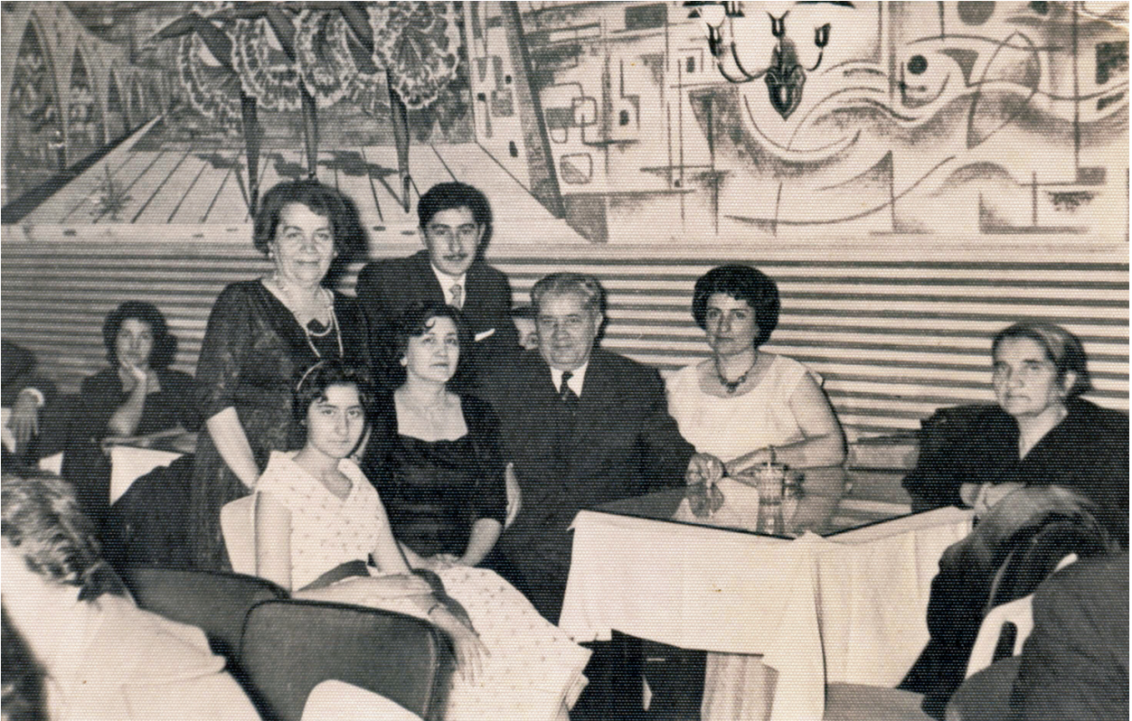
Bir aile fotoğrafı