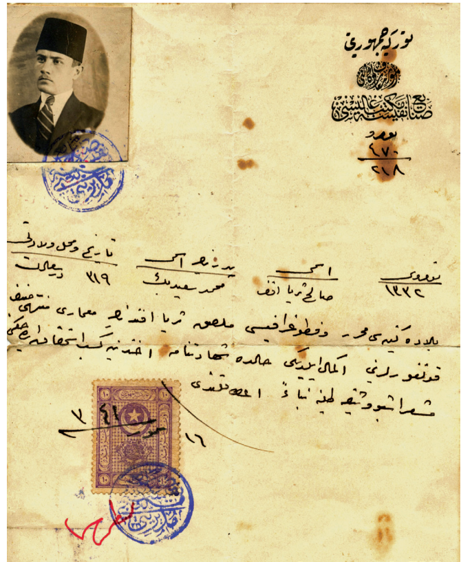
Solda Süreyya Yücel'in ilkokul; sağda üniversite diploması

le ve önemlidir” kaydı ile Başbakanlığa çektiği telgrafında Konya'dakiler başta olmak üzere, Anadolu'daki tarihi anıtların zaman kaybedilmeden onarılmasını istemiştir 4 . Bu tarihi telgrafın ardından Anadolu'daki Selçuklu, Beylikler ve Osmanlı dönemi eserleri olanaklar doğrultusunda onarılmaya başlanmıştır. Bununla beraber o yıllarda anıtları onaracak mimarların işleri hiç de kolay değildi. Başvuracakları kaynak kitaplar yok denilecek kadar azdı. Onarım sırasında karşılaştıkları sorunlar, parça problemlerini çözebilecek, bugün olduğu gibi Kültür ve Tabiat Varlıklarını Koruma Kurulları, üniversitelerin konuyla ilgili bölümleri yoktu. Yalnızca İstanbul Arkeoloji Müzeleri'nde Eski Eserleri Koruma Encümeni ile onun arşivi vardı. Mimari ve sanat tarihi içerikli yayınlar son derece yetersizdi. Türkiye'ye gelen, konusunda uzmanlaşmış birkaç yabancı mimar dışında başvuracakları kişiler de bulunmuyordu. Yalnızca