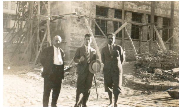
Bir onarım çalışması sırasında

anlamıyla cumhuriyetçi ve Atatürk ilkelerini benimsemiş bir kişiydi (Söylemez 2001: 8-11). Süreyya Yücel Sanayi-i Nefise'yi bitirdikten sonra (1926) İstanbul'da 1926-1927 yıllarında kısa süreliğine Adalar (1927) ve Trabzon Maarif Eminliği (1928-1929) kadastro ressamı ve mühendisliği yapmıştır.