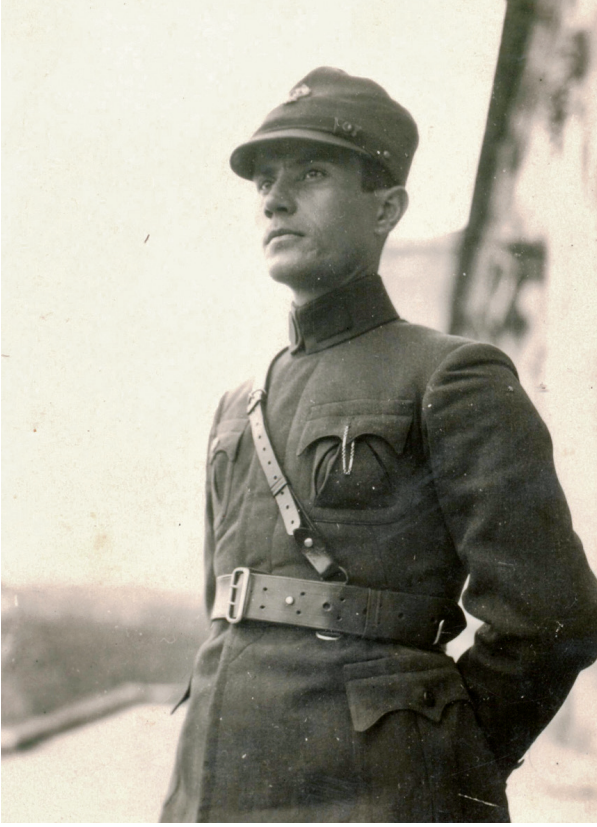
Yedek subay olarak yaptığı askerlik dönemine ait bir fotoğraf