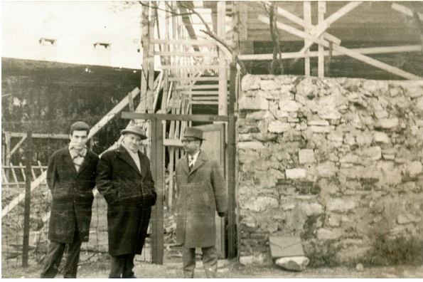
Ortaköy Defterdar Camiinin onarımı