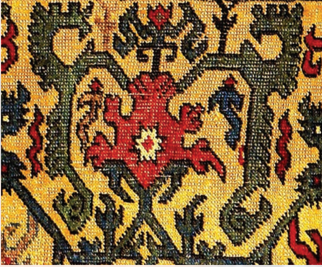
Fotoğraf 14. A.134 envanter nolu halı detayı (Halı Müzesi Arşivi).