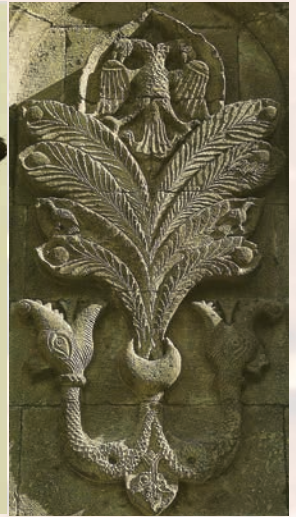
Fotoğraf 4. Erzurum Çifte Minareli Medresede kartal-hayat ağacı-ejder ikonografisi.13.yy. (D.Kuban'dan).

teşkil eden din, dil, tarih, mitoloji ve sanat gibi alanların tamamında semboller kullanılmıştır. Dışarıdan gelen simge ve şekil tarzındaki uyarıcıların bilinç süzgecinden geçirilerek algılanması, bu şifrelerin anlamlara dönüştürülmesi, sembolik unsurlar kullanılarak gerçekleştirilmiştir. Semboller, kelimelerden başlayarak siyasi ve dini eylemlere varıncaya kadar geniş bir alanda yani insanın var olduğu sosyal çevrenin sürekli giden ve gelen iletişim unsuru olmuştur.(Çaycı 2008:31-35) Sınır tanımadan hemen her sanat alanına uygulanmış semboller ve motifler arasında, geometrik oluşumlar ilk sırada yer alır. Çünkü insanoğlu, içinde yaşadığı ve her gün tekrarladığı geometrik ve ritmik hareketleri şekillere aktarmıştır. Bunların bir araya getirilmesiyle oluşan kompozisyonlar, süsleme sanatlarının da en sevilen unsurları haline gelmiştir.(Çaycı 2008:62)