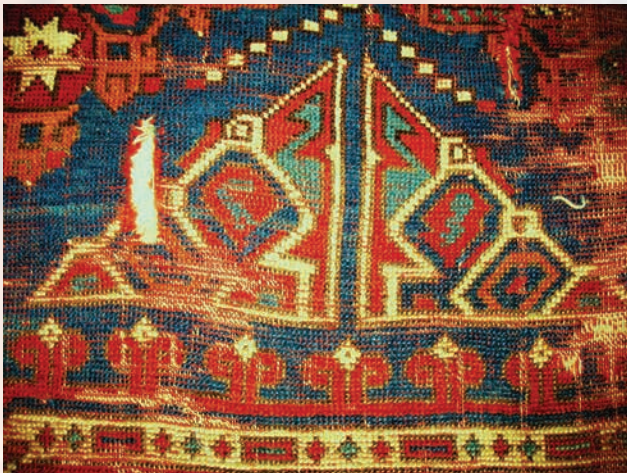
Fotoğraf 16. A.174 envanter nolu halı detayında karşılıklı işlenmiş iki stilize ejderden oluştuğu düşünülen örnek.

geleneğinde içi koçboynuzu motifleri ile işlenmiş küçük kareler sıralanmaktadır. Ana zeminde sekizgenin iki sivri ucu biçiminde işlenmiş geometrik ve girift motifteki, karşılıklı figürlerin stilize iki ejderi tasvir ettiği kabul edilmektedir. (Erbek 2002:150,151). Figürlerin, birbiriyle mücadele edip-etmediği konusu pek açık olmamakla beraber, ejder figürü ile ilgili olarak da öne sürülenler tartışma konusudur. (Fotoğraf-16)