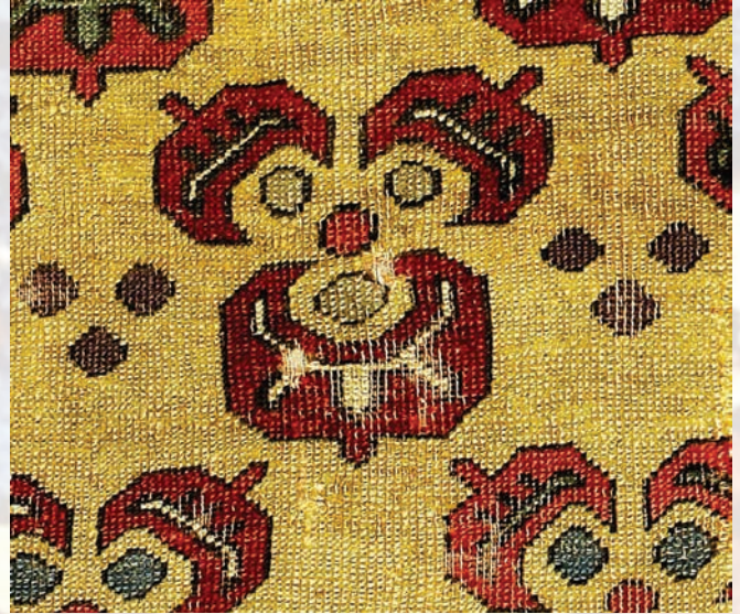
Fotoğraf 40. E.129 nolu halı detayında çintemani.

(Fotoğraf-37 ve 38) Bu nedenle bu motifin güç,kudret,asalet ve iyi şansı temsil ettiği için, Osmanlı hanedanına has, tebaa'dan ayırıcı sembol olduğu söylenebilir. (Biol-Derman 2008:169 / Çaycı 2008:98-100,194 / Çoruhlu 2007 / Gürsu1988:162-163).