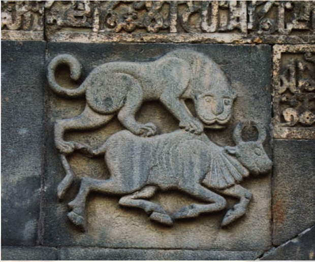
Fotoğraf 2. Diyarbakir Ulu Camii Girişindeki Aslan-Boğa Kabartması. 11.yüzyıl sonu.