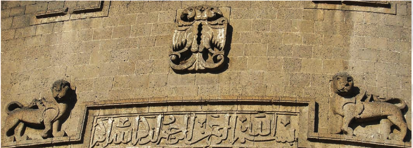
Fotoğraf 1. Diyarbakır Yedi Kardeş Burcundan Detay. 12.yüzyıl (S.Kardeşlik).

Key Words: Carpet, Seljuks, figure, motif, symbol, cosmology, dragon.