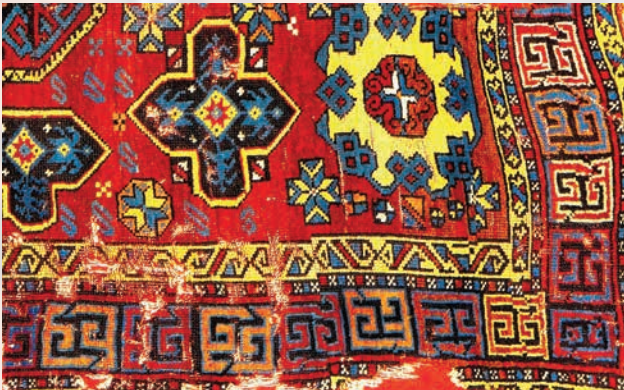
Fotoğraf 31. A-281 nolu halıda gamalı haç-svastika motifli halı (Halı Müzesi Arşivi).

Selçukluların kufi yazı geleneğinden gelişen iki yana kancalı, gamalı haç biçiminde Svastika adı verilen geometrik motif bulunur.(Acar 1978:175 / Bayraktaroğlu-Özçelik 2007: 6-7 /