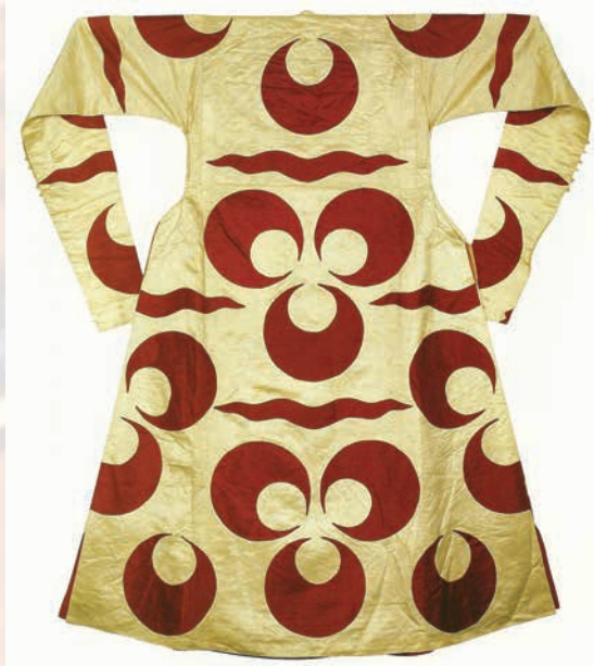
Fotoğraf 37-38 Osmanlı sultan kaftanları.16.yy(Topkapı Sarayı Müzesi).