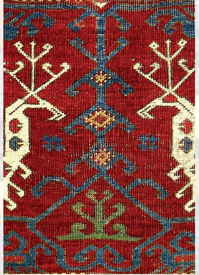
Fotoğraf 44. E.1 numaralı halı detayında ejderin korumasında tasvir edilmiş hayat ağacı.

Hayat ağacının en güzel bir örneği, E-1 envanter numaralı halıda görülür.(Fotoğraf-5 ve 44) Halının detayında iki ejderin arasında tasvir edilen stilize hayat ağacının gövde ve dalları mavi, kökleri de yeşil renktedir.(Aslanapa 2005:81-88 / Aslanapa-Durul 1973:45 /Yetkin 1991:20-21 /Yetkin 1972:291-307) Burada da sonsuz yaşamı simgeleyen hayat ağacı, hayat ağacının koruyuculuğunu üstlenmiş ejder ve ilim-irfan simgesi anka kuşunun misyonu, kozmolojik ve ikonografik anlatımın zengin ürünüdür.