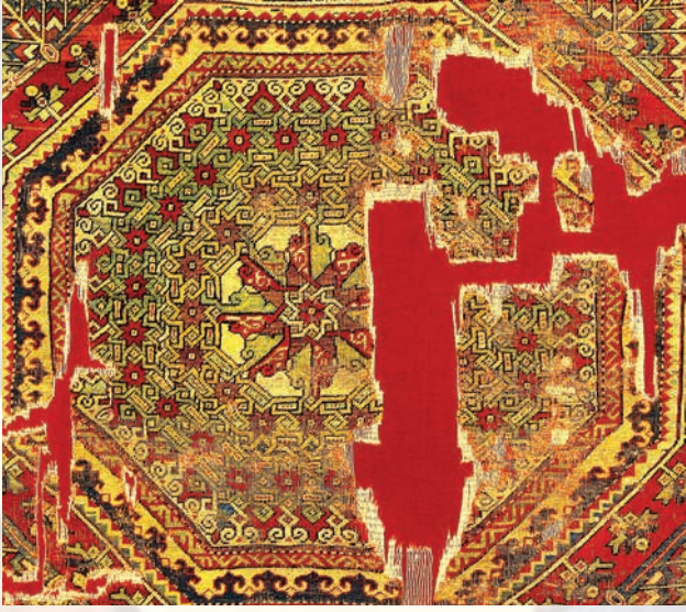
Fotoğraf 41. A-217 envanter numaralı halının detayında uzayın yörüngesi ve çarkifelek (Halı Müzesi Arşivi).