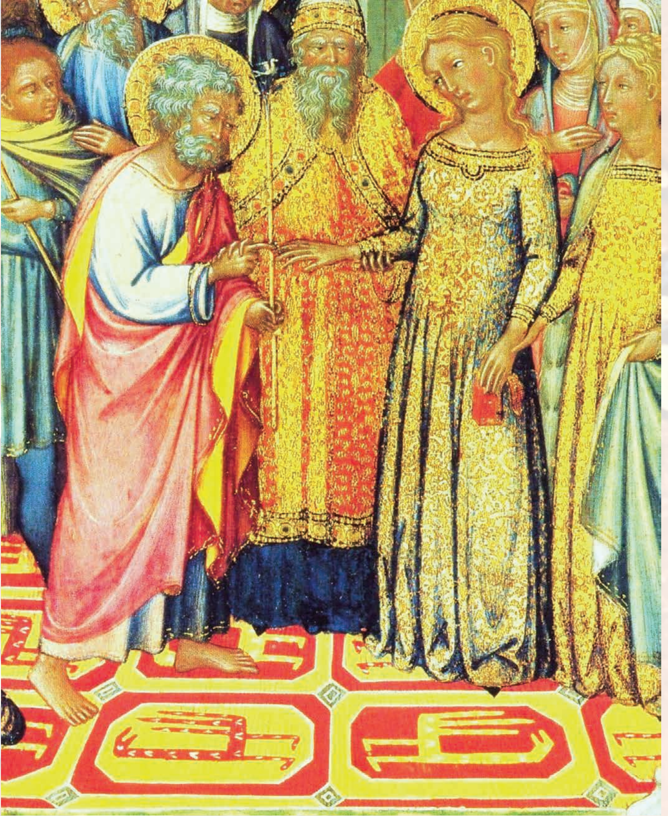
Fotoğraf 7. Nicolo di Buonacorso Tablosu 14.yy.(Londra National Galerisi).

Ejder figürünü tasvir eden bir başka örnek A-305 envanter numaralı halıda görülmektedir.(Fotoğraf-9) 14.yüzyılın başında Doğu Anadolu'da dokunduğu düşünülen halıda, kırmızı zemin üzerinde mavi ve lacivert renklerde düğümlü sekizgenler, sonsuzluğu ifade edecek şekilde sıralanmıştır. Sekizgenlerin içine de kancalı kareler ve sekiz kollu yıldızlar işlenmiştir. En dıştaki ince bordürde sarı renkli, Selçuklu halılarının dar