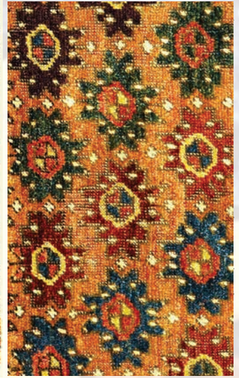
Fotoğraf 18. E-101 envanter nolu halıda verev halde sıralanmış stilize ejder olduğu düşünülen figürler.