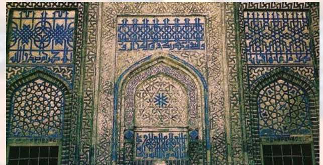
Fotoğraf 32. Sivas I.İzzeddin Keykavus Türbesi. 1217 (D.Kuban'dan).

Hat Sanatı, İslam satında çok az olan veya hiç olmayan figüratif sanatın, resmin ve heykelin yerini almaktadır. Hat sanatı, sadece estetik doldurmakla kalmaz, aynı zamanda okuma yazma bilmeyen kitleler için çekici bir atmosfer yaratır. Anadolu Selçuklular döneminde geniş bir alanda figürsel sanat yerine alternatif olarak kullanılan kufi hat ise bir sır dünyasının işareti olarak görünür.(Fotoğraf- 32) Mükemmelliği ve prestiji yakalayan kufi hat sanatının varlığının amacı, herkesin onu okuması değildir. Zira geometrik bir kûfi yazıtın bilmeceyi andıran istifini okumak zordur. Çoğu da hiç okunamamaktadır. Aslında bilgi vermektten çok semboliktir. Temel amaç sanat