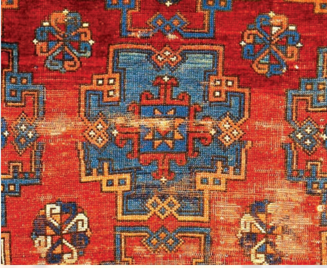
Fotoğraf 10. A-305 envanter numaralı halının detayında birbirine düğümlenmiş stilize iki ejder figürü olduğu öne sürülen figürler.