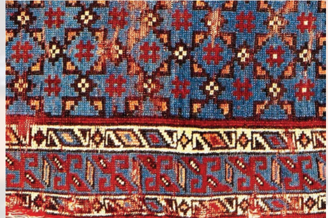
Fotoğraf 28. A-85 nolu halıdan detay. Bordürde gamalı haç-svastikaya benzeyen motif.

Svastika denilen motifin yer aldığı bir örnek, A.85 envanter numaralı halıdır. (Fotoğraf-22 ve 28) Halının ana bordüründe