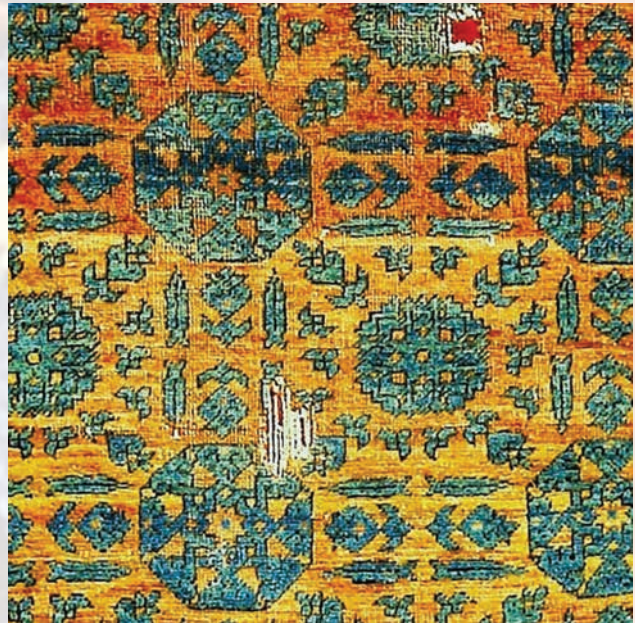
Fotoğraf 21. A-344 nolu halının detayında gökyüzünü simgeleyen yıldız-gezegen motifleri.

Halının zeminine işlenen yıldız-rozet motiflerine, gezegenleri simgelediğine dair anlamlar yüklenerek, bu motifin sanat eserine özel bir manası olduğu, kozmolojik ve astrolojik bir boyut kazandığı düşünülmektedir. (Fotoğraf-21)