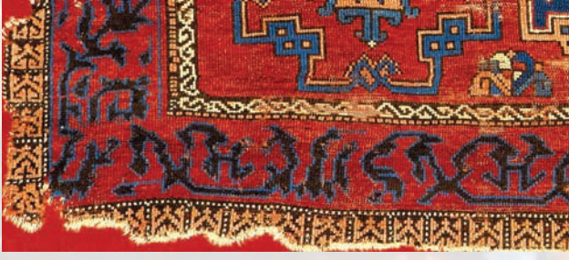
Fotoğraf 36. A-305 nolu halının kıvrık bordürü.