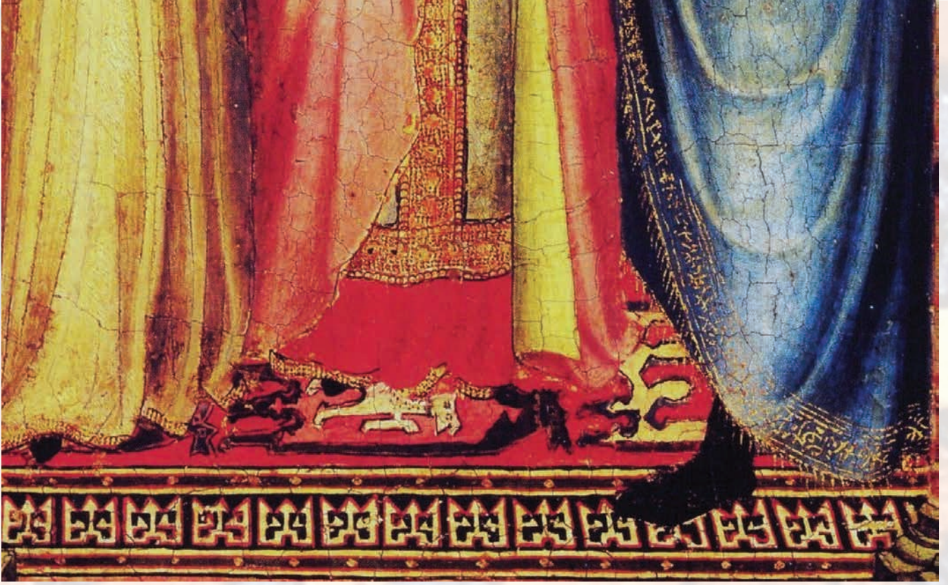
Fotoğraf 8. Sana di Pietro Tablosu 14.yy.(Londra National Galerisi www.flickr.com.'dan).