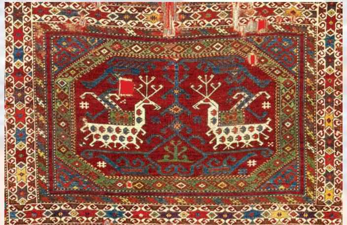
Fotoğraf 6. Hayat Ağacı, Ejder ve Zümrüd-ü Anka Figürlü Halı detayı. (Halı Müzesi Arşivi).

veya duvarda kullanılmıştır. (Yetkin 1991:32) Ayrıca Selçuklulardan itibaren figürlü halıların Avrupa, Orta Asya ve Mısır gibi geniş bir ihraç sahasının olduğu bilinmektedir. Dolayısıyla bu figürlü halıların özellikle yurtdışından gelen siparişler üzerine Anadolu'da dokunduğu anlaşılmaktadır.(Aslanapa 2005:104-106 / Yetkin 1991:32-33) Nitekim, Avrupalı ressamların tablolarında çok yoğun bir şekilde işlenen hayvan figürlü halı örnekleri, Anadolu halılarına olan rağbeti kanıtlar niteliktedir.(Fotoğraf-7-8) E.1 envanter numaralı halının zemini iki dikdörtgen panoya ayrılmıştır. Bu panoların içerisinde yeşil bantlı birer sekizgen ve onların içinde de stilize bir ağacın iki yanında karşılıklı birer kanatlı hayvan figürü yerleştirilmiştir. Bunlar, stilize ejder figürleridir. Dört köşeye de Zümrüd-ü Anka olduğu düşünülen mitolojik kuş figürü işlenmiştir. (Aslanapa 2005:81-88 /Aslanapa-Durul 1973:45 /Yetkin 1991:20-21 /Yetkin 1972:291-307) Bu halıda Hayat Ağacı, Ejder ve Anka kuşunun oluşturduğu üçlü kompozisyonda; sonsuz yaşamı simgeleyen hayat ağacı, hayat ağacının koruyuculuğunu üstlenmiş ejder ve ilim-irfan simgesi anka kuşunun misyonu, kozmolojik ve ikonografik anlatımın zengin ürünüdür. Bu halımıza benzer iki önemli örnekten biri Stockholm Sanat Tarihi Müzesinde bulunan 'Marby' adlı halı ve diğeri de Berlin Sanat Müzesinde bulunan 'Ming' olarak anılan halıdır. İkisi de 15.yüzyılda Anadolu'da dokunmuştur.