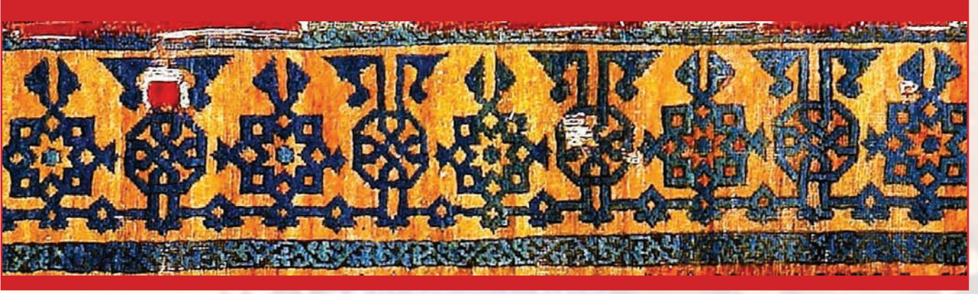
Fotoğraf 33. A-344 envanter numaralı halının bordüründeki kûfi işlemler.

yapıtlarına anıtsal nitelik kazandırarak göze hitap etmek ve anlatılmak isteneni gizemli kılarak yücelik kazandırmaktır. Dolayısıyla Sultan ve Meliklerin güç gösterisinde bulunduğu prestij, yücelik ve kutsallık kazandırma amaçlı dekoratif öge olmalıdır. (Demiriz 1982:941,976-977 / Enginsoy 2008:395-396 / Kuban 2008:355-358 / Schimmel 2004:205)