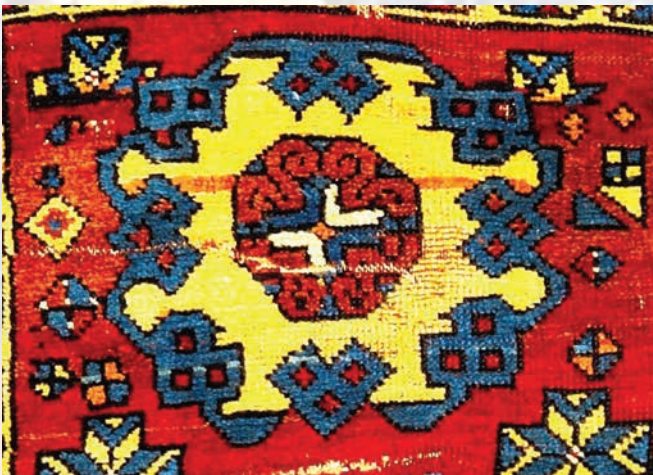
Fotoğraf 12. A.281 envanter nolu halı detayı.