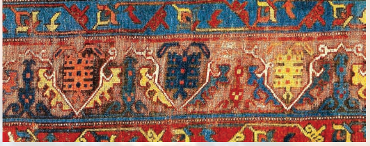
Fotoğraf 43. A.121 numaralı halının bordür detayında stilize akrep figürleri.

A.217 envanter numaralı halıda çarkifelek ve uzay sistemi tasvirinin en güzel örneklerinden biri yer alır.(Fotoğraf-34 ve 41) Halının kırmızı zeminine iki büyük sekizgen şeklinde işlenen geometrik motifin köşelerini kareye tamamlayan köşebentler vardır. Büyük sekizgen madalyonların merkezinde sekiz kollu bir yıldız bulunur. Yıldızın kolları uzatılarak çarkifelek oluşturulmuştur. Çarkifelek şeklindeki girift örgünün çevresinde de iki sıra halinde yörüngesinde dönen