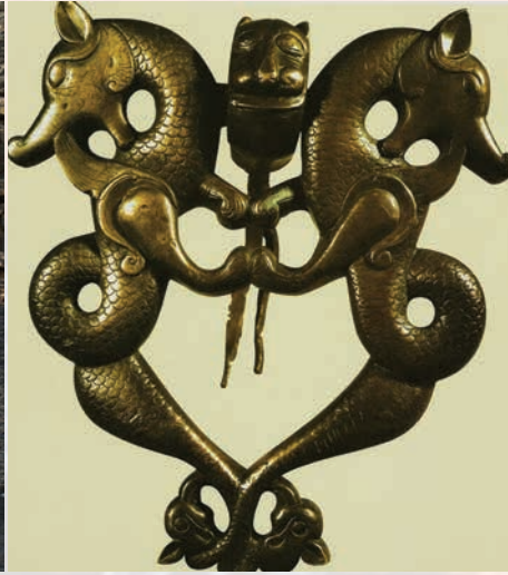
Fotoğraf 3. Cizre Ulu Camii Kapı Tokmağında ejder. 13.yy. başı (D.Kuban'dan).