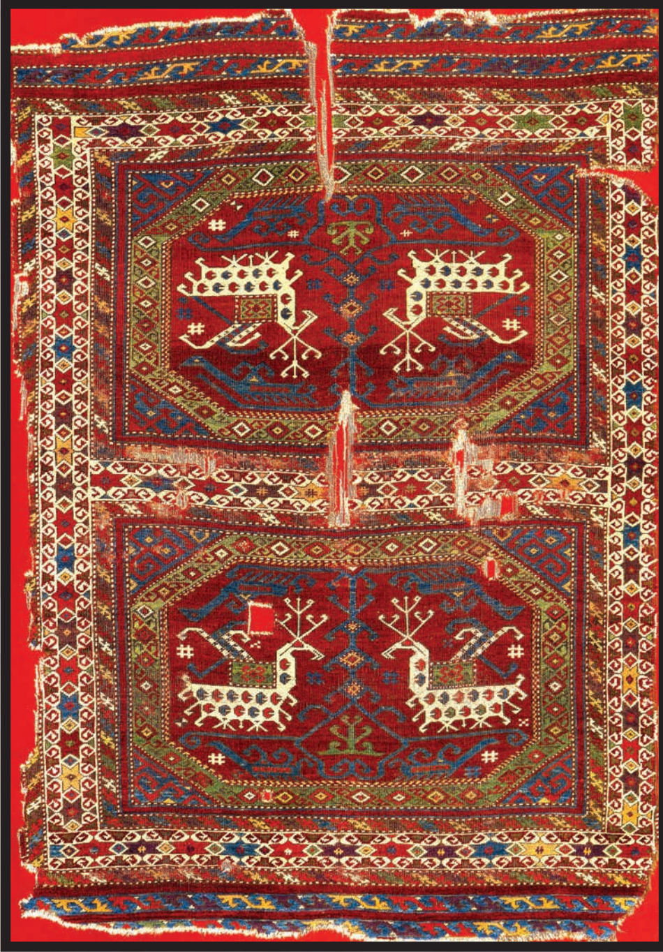
Fotoğraf 5. E-1 envanter nolu Ejder figürlü halı.

ve kötülüğü ifade eder.(Öney 2008:419) Halı ve kilimlerde de yer alan hayvan mücadele ikonografisi, özellikle ejder-anka kuşu sahneleriyle görünür. Selçuklu darüşşifaları, kervansarayları ve çeşmelerinde ebedi hayat, sonsuzluk ve koruyuculuğun sembolü olan ejder figürleri, halı ve kilimlerde stilize edilerek tasvir edilmiştir. Bazen bulutu anımsatan, bazen stilize edilmiş yılan şekliyle bazen de girift geometrik motifler şeklinde yer alır. (Erbek 2002:146-153)