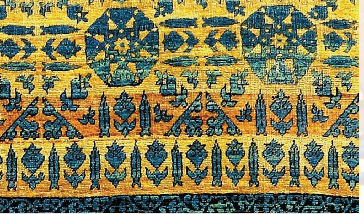
Fotoğraf 45. A.344 numaralı halının detayında servi ağacı ve lotus-palmet (Halı Müzesi Arşivi).

Gürsu 1988:161-162) Eski Mısır'da hayatın, Selçuklularda tanrısal gücün simgesidir. Kökü ölümsüzlüğü, sapı hayatı ifade eder.(Bakırcı 2010:104 / Karamağaralı 1998:36)