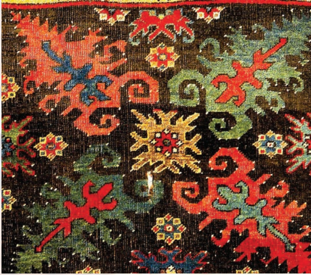
Fotoğraf 42. A.134 numaralı halı detayında akrep figürleri.

şemadır. Bu kozmik şema, yıldız sistemlerinin temelinde bulunur.(Kuban 2008:337-338) Çarkifelek, dairesel dönüşün, hayatın dönen çark misali tekrarlandığı anlamını içermektedir. (Bakırcı 2010:107) Çin ve Orta Asya uygarlıklarında gök çarkının varlığına inanılır. Yine Uygurlarda da gök çarkından bahsedilir. Bir Uygur metninde gök kubbenin en alt çemberinin bir çift gök ejderi tarafından çevrildiği belirtilmektedir. Böylece zaman döngüsü oluşmaktadır.(Çoruhlu 2010:102) Ayrıca Yusuf Has Hacib, eserinde ejderi, kozmik ekliptik çark-ı feleğin etrafına dolanmış kozmik evren olarak tanımlar. Ejderin hareketleri, ekliptik çarkın dönmesini ve gece ile gündüz döngüsünün oluşumunu sağlıyordu.(Esin 2004:156-157)