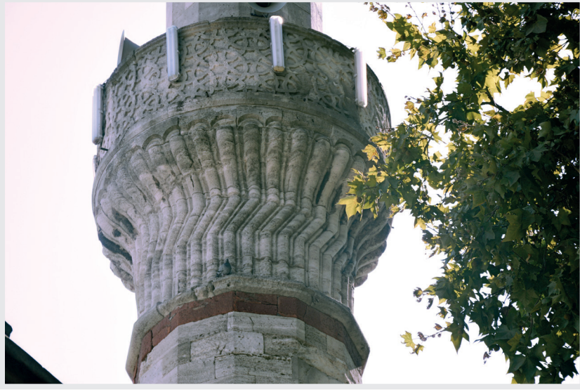
Resim 9. Minare