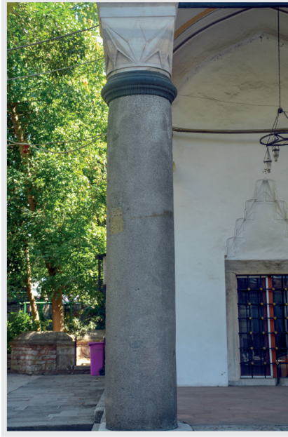
Resim 5. Tonalit Kayası Bileřiminde Sütun