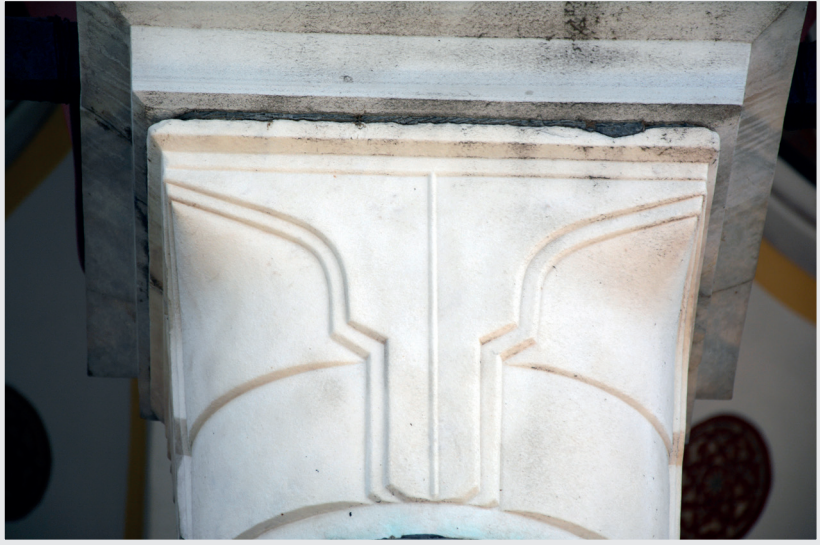
Resim 8. Sütun Başlığı