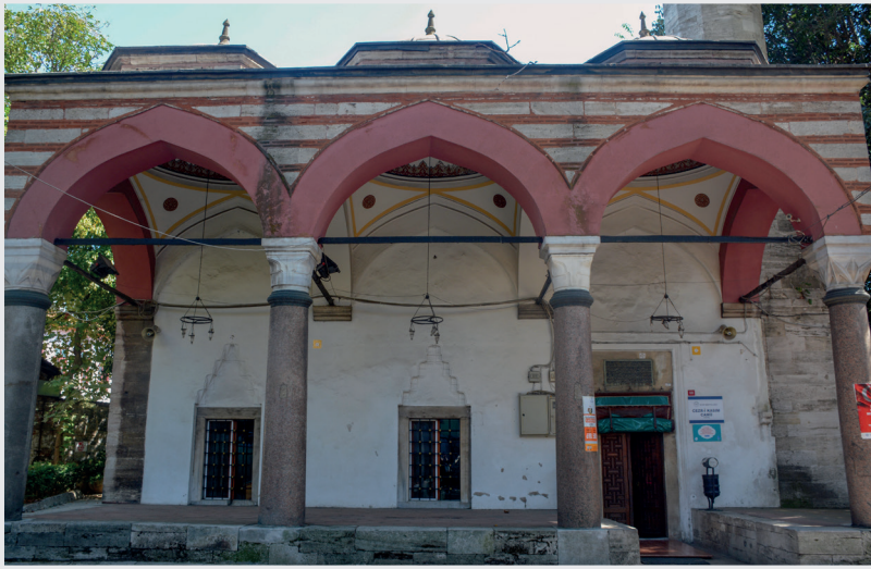
Resim 2. Son Cemaat Yeri