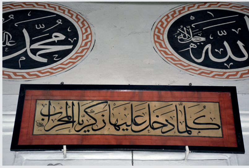
Resim 13. Mihrap Tepelięi