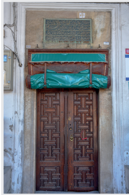
Resim 6. Giriř Kapısı ve Kitabe