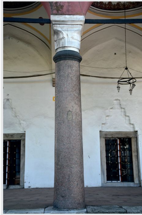
Resim 4. Asvan (Assuan) Graniti Stn