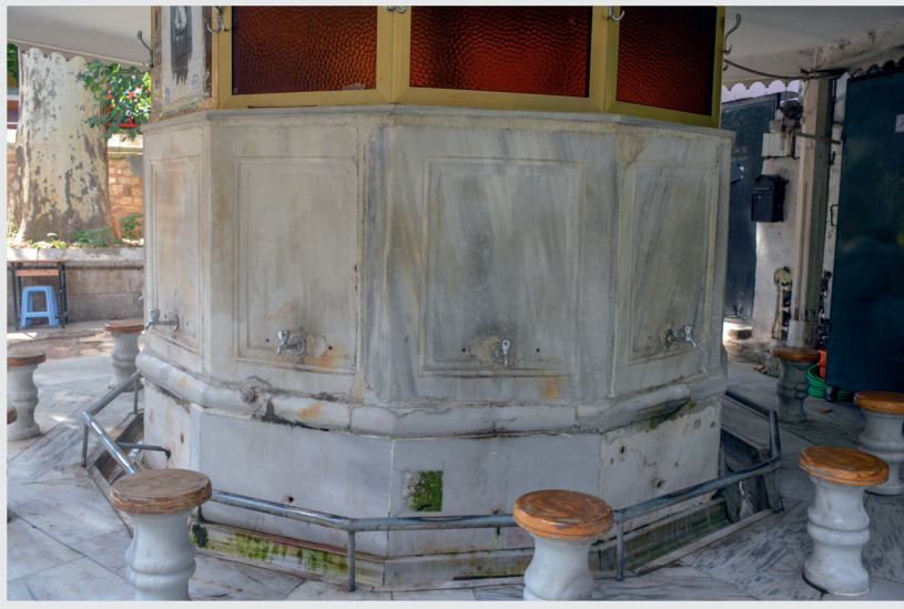
Resim 3. řadırvan