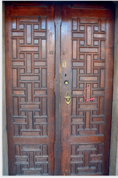
Resim 15. Giri Kapısı