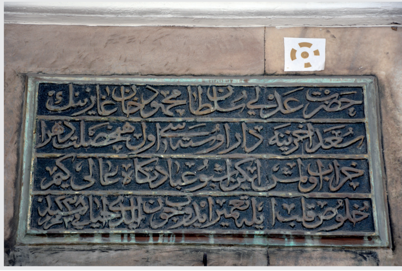
Resim 1. Onarım Kitabesi