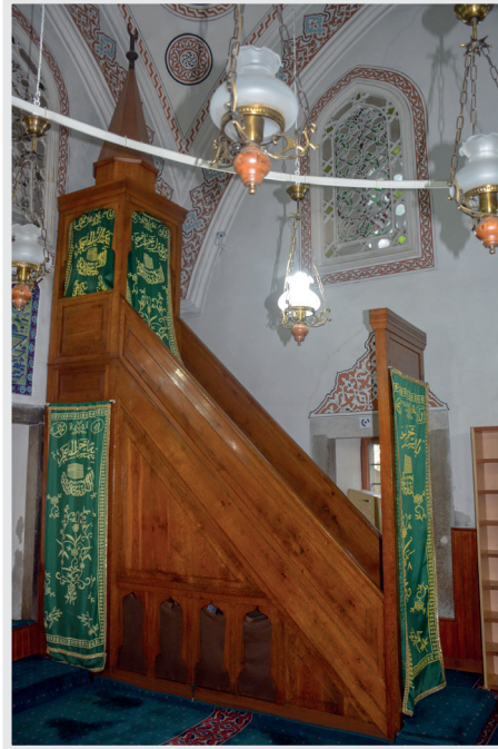
Resim 14. Minber