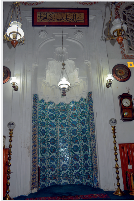
Resim 10. Mihrap