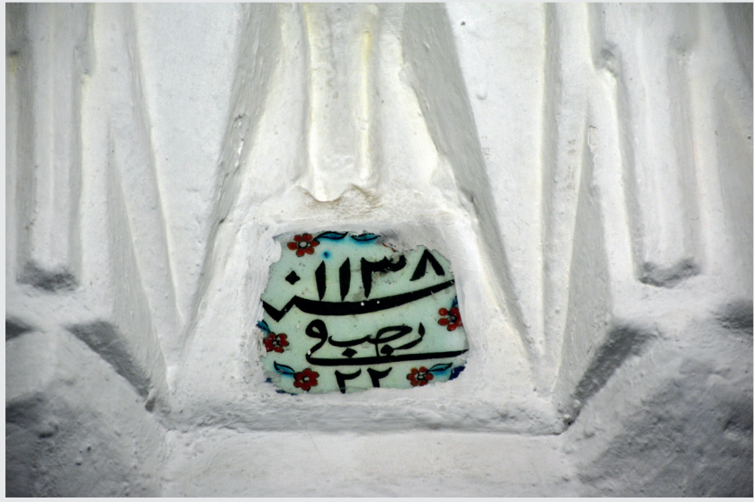
Resim 11. Mihrap, Çini Levha