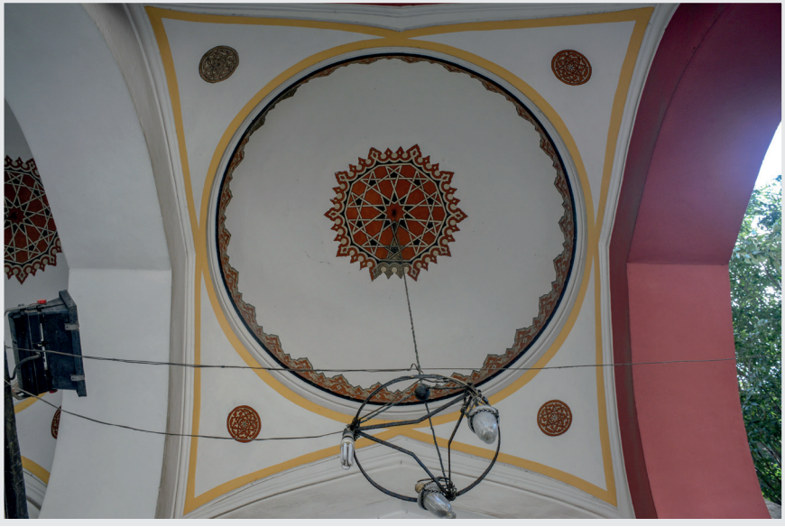
Resim 17. Son Cemaat Yeri Kubbesi