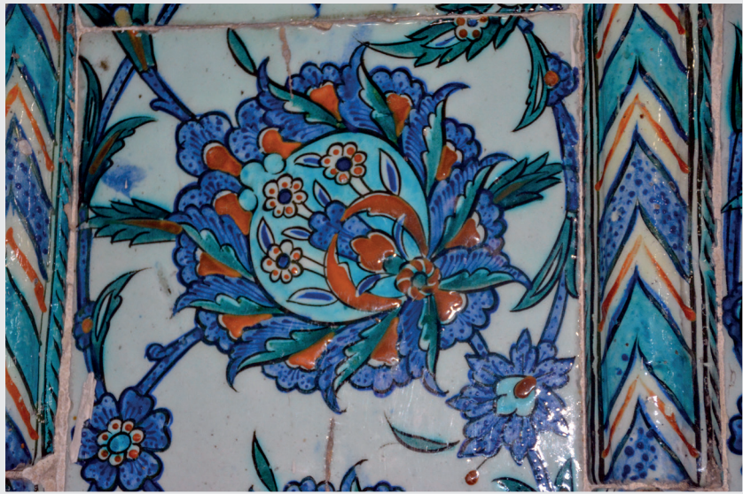
Resim 12. Mihrap Çinisi, Detay