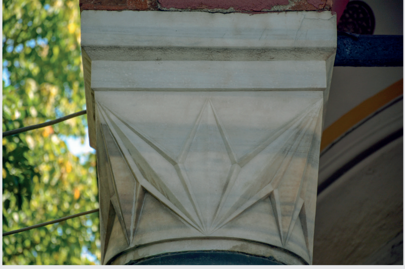
Resim 7. Sütun Başlığı