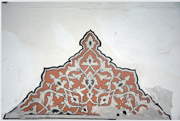
Resim 16. Pencere Alınlığı Sslemesi