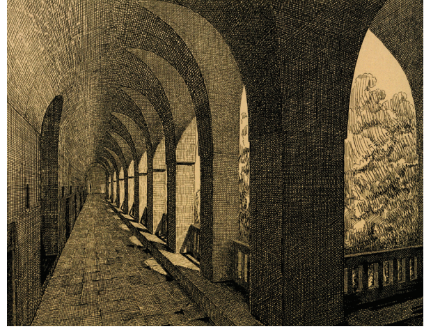
Fotoğraf 8. Bursa Bey Hanı, tarama tekniği (1339), 1934 (A.Ö., Yazıları ve Rölöveleriyle Sedat Çetintaş , İTÜ Yay., 2004, s. 59, lev. 77).

İstanbul Teknik Üniversitesi Mimarlık Fakültesi'nde Sedat Çetintaş'a ait 108 rölöve ve restitüsyon çizimi bulunmaktadır. Yayınlarını incelediğimizde Sedat Çetintaş'a ait 200'ün üzerinde çizim olması gerekmektedir, ancak ne yazık ki günümüze tümü ulaşamamıştır.