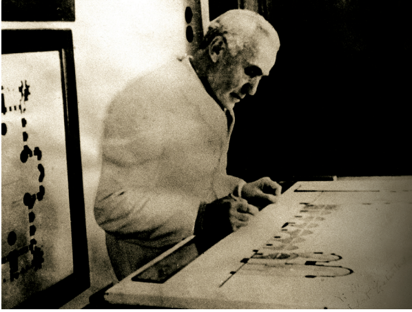
Fotoğraf 1. Sedat Çetintaş masa başında çalışırken (A.Ö., Yazıları ve Rölöveleriyle Sedat Çetintaş, İTÜ Yay., 2004, s. 45).

Sedat Çetintaş, Erken ve Klasik Osmanlı mimarlığı tutkunu bir Cumhuriyet aydınıdır. Bu tutkusuy- la sanatsal değeri yüksek rölöveleriyle Bursa, Edirne ve İstanbul'da Osmanlı anıtlarını belgelemiştir (Yeşim 1943a, Yeşim 1943b, Uyaroğlu 1965, Yücel 1980, Kuban 1992, Onay 1992, Söy- lemezoğlu 1992, Tanyeli 1992, Eyice 1993, Ödekan 2004, Yücel 2004, Dervişoğlu 2011) (Fotoğraf.1).