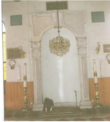
Fotoğraf 35. Hasan Pařa Camii'nin 2004 yılı sonrası mihrap niři, İBB Kùltürel Miras Koruma Mùdùrlüğü Arřivi.

Özellikle 19. yüzyılın ikinci yarısından itibaren görùlen Eklektik üslubun Hasan Pařa Camii'nin kalem işi süslemelerinde etkili olduđu söylenebilir. Oryantalist ve Ulusal Mimarlık üsluplarının izleri ile mihrap niřinde görùlen kıvrımlı perde motifinin temsil ettiđi Barok ve Ampir üslubu hatırlatması yapıda farklı üslupların karma bir biçimde uygulandıđını göstermektedir.