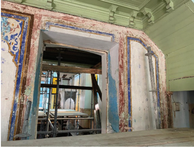
Fotoğraf 19. Son cemaat beden duvarında gün yüzüne çıkarılan kalem işi süslemeler

Harime bakan açıklığın üst bölümünde yarım kalmış çerçeve bordürü görülmektedir. Bordürün içi çivit mavisi, kontur çizgileri ise kahverengi tonundadır. (Fotoğraf 19)