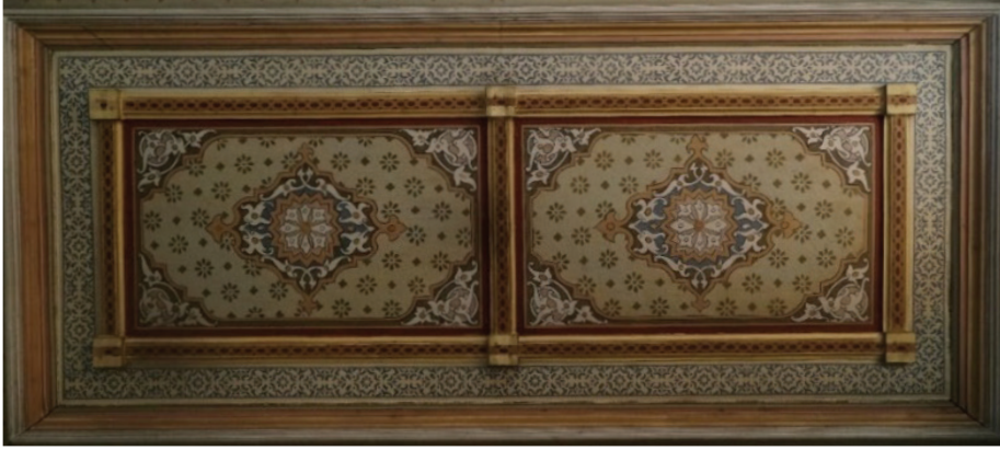
Fotoğraf 17. Mahfilin alt kat tavanında yer alan bezemeler, Güryapı Fotoğraf Arşivi.

Mahfilin alt kat tavanında üst örtü sisteminde olduğu gibi tuval üzerine kalem işi süslemeleri işlenmiştir. Simetrik olarak yerleştirilmiş iki yatay dikdörtgen form içinde aynı desenler işlenmiştir. Köşebentlerde rumi ve kıvrık dal motiflerinden oluşan kompozisyonlar görülmektedir. Ortada ise salbekli şemse motifi görülmektedir. Motifin merkezinde çok kollu yıldız etrafında rumi ve kıvrık dal motifleri vardır. Şemsenin salbekleri palmet motifi şeklinde sona ermektedir. Salbekli şemse motifinin etrafında kalıptan baskı tekniğiyle yapılmış yıldızlar ve geometrik motifleri görülmektedir. Kompozisyonun etrafında yer alan bordürde baskı tekniğinde yapılmış yıldız motifi ve bitkisel ile geometrik motiflerden oluşan bir düzenleme yer almaktadır. (Fotoğraf 17)