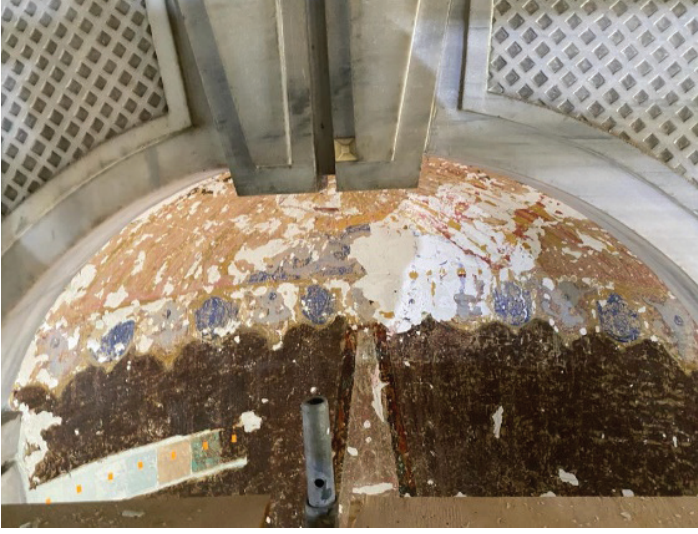
Fotoğraf 28. Mihrap kavsarasında gün yüzüne çıkarılan kalem işi süslemeler

Kavsaranın üst bölümünde tahribat fazladır. Anlaşıldığı kadarıyla çivit mavisinden rumi ve kıvrık dal motiflerinden oluşan bir kompozisyon bulunmaktadır. Söz konusu kompozisyon ile perde motifinin arasında ise kontur çizgileri sarıya yakın renkte kontur çizgilerine sahip oval formlar vardır. Söz konusu motiflerin içi çivit mavisi ile renklendirilmiştir. (Fotoğraf 28)