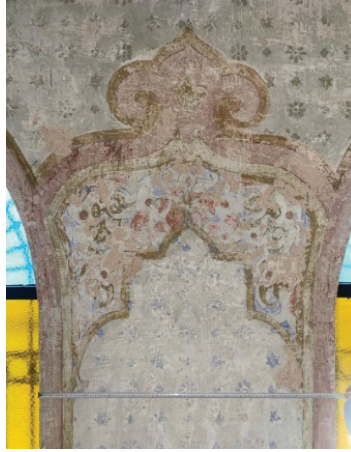
Fotoğraf 21. Harim beden duvarında gün yüzüne çıkarılan kalem işi süslemeler

Beden duvarının üst bölümlerinde, perde-püskül palmet motiflerinin olduğu hizada baskı tekniğinde yapılmış yıldız motiflerinin takibi yapılabilir. (Fotoğraf 22) Çerçevesiz kompozisyonun altında ise yatay dikdörtgen formu çokgen kartuş motifleri ortaya çıkarılmıştır. Pastel tonların hâkim olduğu kompozisyon mermer taklidi 30 kalem işi süslemelerine örnektir. (Fotoğraf 23)