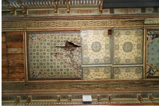
Fotoğraf 15. Mahfil tavanı üstünde yer alan bezemeler ve muşamba, Guryapı Fotoğraf Arşivi.

Harimin kuzeyinde yer alan mahfilin tavanında kalem işi süslemelerinin yer aldığı tuval bilinmeyen bir sebepten dolayı yok olmuş ve yerine muhtemelen cemaatin katkısıyla desenli muşambalar yapıştırılmıştır. Bordürlerde baskı tekniğiyle yapılmış bitkisel motifler görülmektedir. (Fotoğraf 15-16)