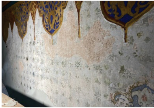
Fotoğraf 22. Harim beden duvarında gün yüzüne çıkarılan kalem işi süslemeler

Beden duvarının üst bölümlerinde, perde-püskül palmet motiflerinin olduğu hizada baskı tekniğinde yapılmış yıldız motiflerinin takibi yapılabilir. (Fotoğraf 22) Çerçevesiz kompozisyonun altında ise yatay dikdörtgen formu çokgen kartuş motifleri ortaya çıkarılmıştır. Pastel tonların hâkim olduğu kompozisyon mermer taklidi 30 kalem işi süslemelerine örnektir. (Fotoğraf 23)