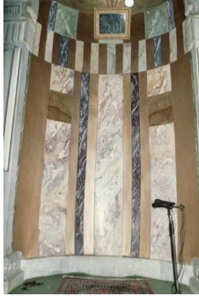
Fotoğraf 34. Hasan Pařa Camii'nin 2004 yılı öncesi mihrap niři