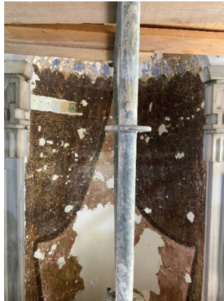
Fotoğraf 27. Mihrap nişinde gün yüzüne çıkarılan kalem işi süslemeler

Yuvarlak kemerli mihrap nişinde yapılan raspa çalışmalarında gün yüzüne çıkarılan kalem işi süslemeler oldukça önemlidir. Nişin üst bölümünden aşağıya doğru iki yana açılmış perde motifi ortaya çıkarılmıştır. Kahverengi tonlarının görüldüğü kompozisyonun iki yana açılan kontur çizgileri kompozisyonun genelinden daha koyu tonlara sahiptir. (Fotoğraf 27) Barok ve Ampir üslup özelliği gösteren perde motifi yapının genelinde ortaya çıkarılan kalem işi süslemelerinden üslup, motif ve renk seçimi açısından farklı olarak kabul edilebilir. Bu durum caminin diğer süslemelerinden farklı bir zamanda yapıldığını düşündürmektedir.