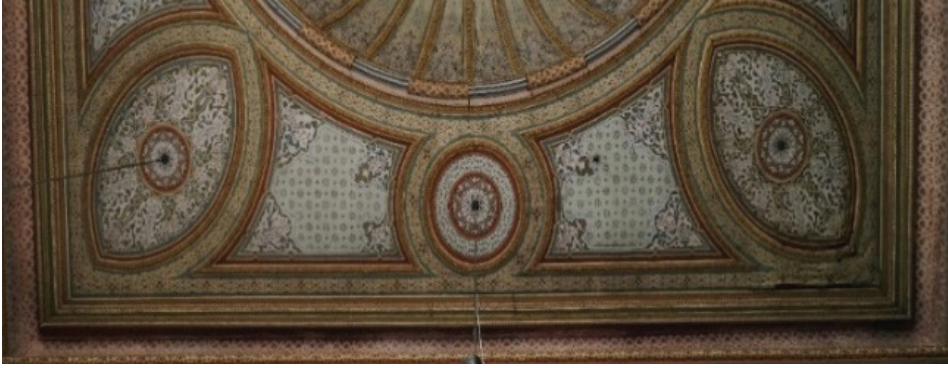
Fotoęraf 12. Hasan Pařa Camii'nin üst örtü sisteminden detay.