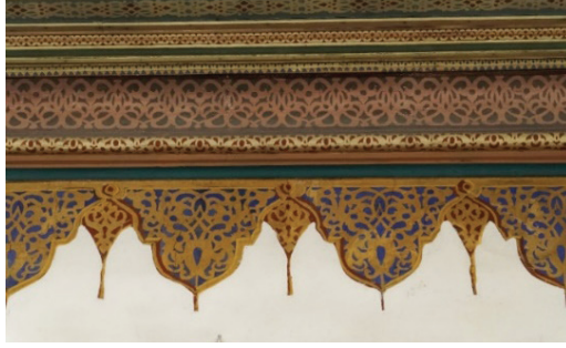
Fotoğraf 14. Harimin beden duvarı üstünde yer alan kalem işi süslemeler

Harimin kuzeyinde yer alan mahfilin tavanında kalem işi süslemelerinin yer aldığı tuval bilinmeyen bir sebepten dolayı yok olmuş ve yerine muhtemelen cemaatin katkısıyla desenli muşambalar yapıştırılmıştır. Bordürlerde baskı tekniğiyle yapılmış bitkisel motifler görülmektedir. (Fotoğraf 15-16)