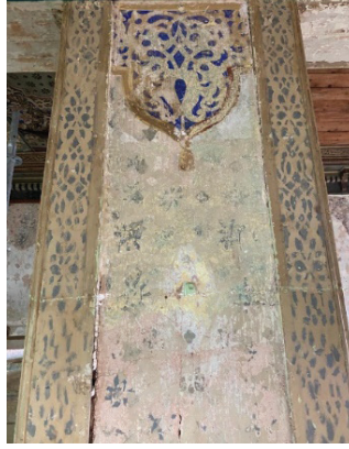
Fotoğraf 26. Mahfil katında gün yüzüne çıkarılan kalem işi süslemeler

Ayrıca bazı taşıyıcılarda mahfil katı beden duvarında görülen perde püskülünü hatırlatan palmet motifleri ve baskı tekniğinde yapılmış yıldızlar tekrar edilmiştir. (Fotoğraf 26)