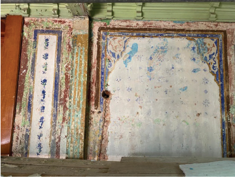
Fotoğraf 18. Son cemaat beden duvarında gün yüzüne çıkarılan kalem işi süslemeler

Harime bakan açıklığın üst bölümünde yarım kalmış çerçeve bordürü görülmektedir. Bordürün içi çivit mavisi, kontur çizgileri ise kahverengi tonundadır. (Fotoğraf 19)