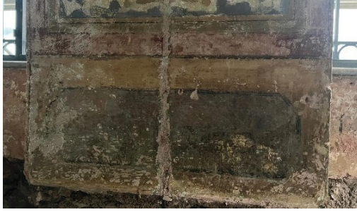
Fotoğraf 23. Harim beden duvarının alt bölümünde ortaya çıkarılan mermer taklidi kalem işi süslemeler

Mahfil katında yapılan raspa çalışmaları sırasında ortaya çıkarılan kalem işi süslemeler dikkat çekicidir. Harimin beden duvarı üst seviyesinde görülen perde-püskülü palmet motiflerine benzer uygulamalar çıkarılmıştır. Ancak renk ve motif seçiminde farklılıklar bulunmaktadır. (Fotoğraf 24)