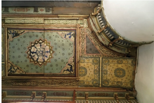
Fotoğraf 16. Mahfil tavanı üstünde yer alan bezemeler ve muşamba, Guryapı Fotoğraf Arşivi.