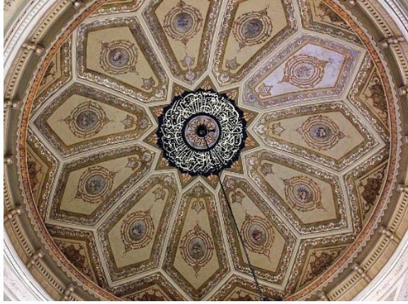
Fotoğraf 29. Eyüpsultan Kaptan Paşa Camii'nin kubbesinde yer alan tuval üzeri kalem işi süslemeleri