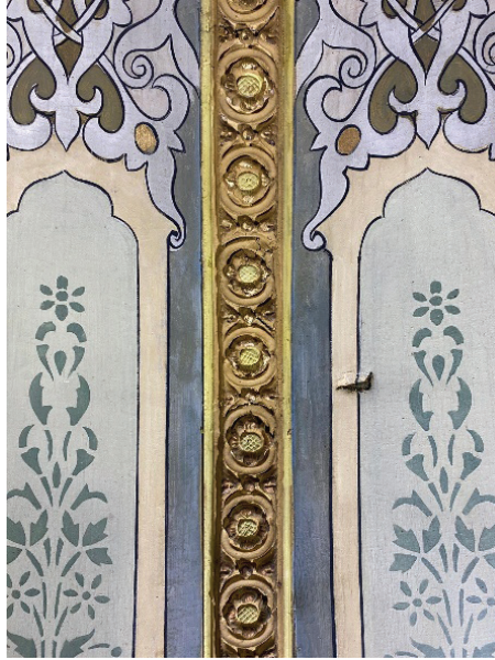
Fotoğraf 10. Hasana Pařa Camii'nin harimini örten kubbede tuval yırtıđı.

Harimin üstünü örten kubbe ve etrafı tuval üzerine yapılmıř kalem iři süslemeleriyle zenginleřtirilmiřtir. Kompozisyonun tuval üzerine yapıldıđı tuvalde meydana gelen küçük yırtıklarda belli olmaktadır. (Fotoğraf 10)