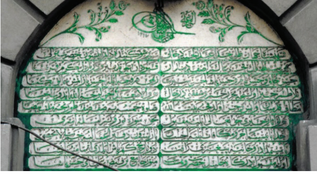
Fotoğraf 4. Hasan Paşa Camii'nde Sultan II. Abdülhamid tuğrası ve yapının kitabesi 22

Sarıyer taşı ile yığma sistemde inşa edilen cami çevre duvarıyla sınırlandırılmış bir alan içinde yer almaktadır. Harim birimi kare planlı olup içten ahşap kubbe, dışarıdan kiremit kaplı çatı ile örtülüdür. Yapının ahşap kubbesi dikkat çekicidir. Zira Osmanlı kaynaklarında “çarpušta kubbe” olarak adlandırılan 23 ahşap iskeletli kubbelerin son örneklerinden birisidir. Klasik dönem mimarisinde de görülen bu kubbe tasarımına 1592 tarihli Takkeci İbrahim Ağa Camii-Tekkesi örnek olarak verilebilir. 24