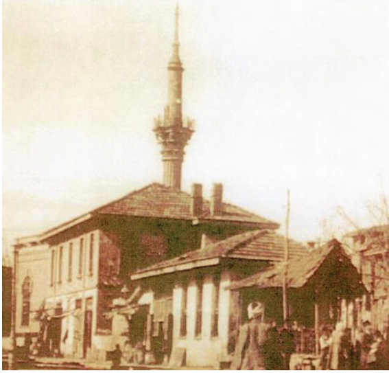
Fotoğraf 7. Hasan Pařa Camii'nin 1911 tarihli fotoğrafta minaresi 27