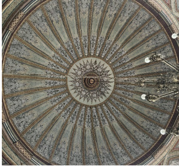
Fotoğraf 30. Hasan Paşa Camii'nin kubbesinde yer alan tuval üzeri kalem işi süslemeleri

Harimin beden duvarlarının üst bölümünde yer alan ve perde-püskül palmet motiflerinde yapılan raspa çalışmalarında aynı tarzda yapılmış ancak kontur çizgileri daha düzgün ve başarılı kompozisyonlar çıkmıştır. Cumhuriyet devrinde beden duvarında yer alan kalem işi süslemeleri sıvayla kapatılmış olup beden duvarının üzerinde yer alan palmet motiflerinin üzerinden başarısız bir şekilde geçilerek kompozisyon tekrar edilmiştir. (Fotoğraf 31)