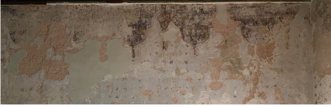
Fotoğraf 24. Harim beden duvarında gün yüzüne çıkarılan kalem işi süslemeler

Mahfil katında yapılan raspa çalışmaları sırasında ortaya çıkarılan kalem işi süslemeler dikkat çekicidir. Harimin beden duvarı üst seviyesinde görülen perde-püskülü palmet motiflerine benzer uygulamalar çıkarılmıştır. Ancak renk ve motif seçiminde farklılıklar bulunmaktadır. (Fotoğraf 24)