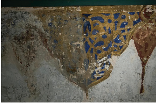
Fotoğraf 31. Hasana Paşa Camii'nin beden duvarı üstünde bulunan palmet motiflerinden detay

Son cemaat mahali ve harimin beden duvarlarında yapılan raspa çalışmalarında ortaya çıkarılan kompozisyonlarda çerçevelerle sınırlandırılmıştır. Betimlemelerde içi rumi ve kıvrık dal motifleriyle zenginleştirilmiş büyük bir palmet motifi dikkat çekicidir. Ayrıca bazı çerçevelerin köşebentlerinde benzer tasarımlar uygulanmıştır. Çerçevelerin merkezinde ise kalıp yardımıyla yapılmış baskı tekniğinde yıldız motifleri ile geometrik motifler görülmektedir. Söz konusu süslemeler Oryantalist ve Ulusal Mimarlık üslubunun izleri olarak yorumlanabilir. Zira özellikle Sultan Abdülaziz devrinde etkili olan Oryantalist üslupta inşa edilen bazı yapılarda rumi, kıvrık dal, palmet gibi motifler daha girift bir tarz tercih edilmiştir. 32 1870 tarihli Keçecizade Fuad Paşa Türbesi'ndeki süslemeler 33 örnek olarak verilebilir. Ulusal Mimarlık üslubunda inşa edilen 1913 tarihli Bebek Camii'nin kalem işi süslemelerinde 34 de aynı motiflerden oluşan kompozisyonlar görülmektedir.