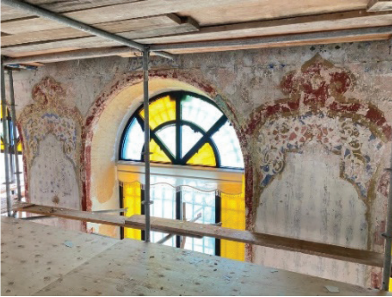
Fotoğraf 20. Harim beden duvarında gün yüzüne ıkarılan kalem iři süslemeler

Yuvarlak kemerli pencere aıklıkları bordo renk tonuna sahip bordürlerle kuřatılmıřtır. Pencere üstünde, aıklığın tepeliğini oluřturan kalem iři süslemeler beden duvarında ortaya ıkarılan ereve tepeliklerinden farklıdır. Tepelikte ivit mavisi zemin üzerine rumi, kıvrık dal ve küçük palmet motiflerinden klasik bir görünüm saėlanmıřtır.