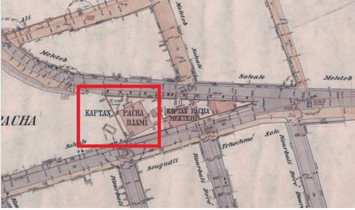
Fotoğraf 2. Alman Mavileri Haritasında Kaptan Camii olarak işlenen Hasan Paşa Camii 18