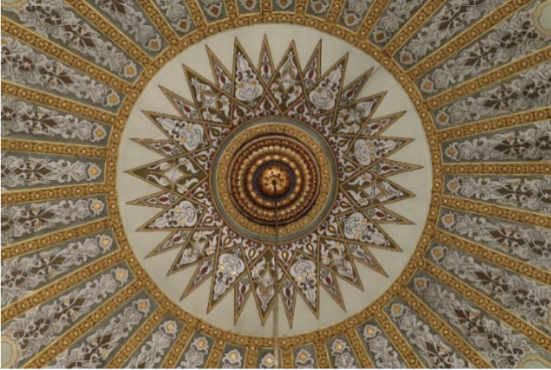
Fotoğraf 11. Hasan Paşa Camii'nin harimini örten kubbe göbeği, Güryapı Fotoğraf Arşivi.

Tuval üzerine kalem işi süslemelerine sahip kubbenin tam ortasında dairesel formda yapılmış düzenlemeler kademeli bir şekilde genişlemektedir. Düzenlemelerin etrafında 32 kollu yıldız motifi bulunmaktadır. Yıldızın kolları rumi, palmet ve kıvrık dal motifleriyle süslenmiştir. Kubbe göbeğinden kubbe eteğine doğru 32 dilime bölünmüş ve her dilimde simetrik olarak aynı kompozisyon işlenmiştir. Kompozisyonda rumi, palmet ve kıvrık dal motiflerinden oluşan klasik desenler görülmektedir. Dilimler birbirinden yaldızlı geometrik motifle ayrılmıştır. (Fotoğraf 11)