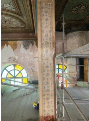
Fotoğraf 25. Mahfil katında gün yüzüne çıkarılan kalem işi süslemeler

Mahfil taşıyıcılarında düşey hatta yapılmış beyaz zemin üzerine çivit mavisi yıldız ve geometrik motifler takip edilebilmektedir. (Fotoğraf 25)