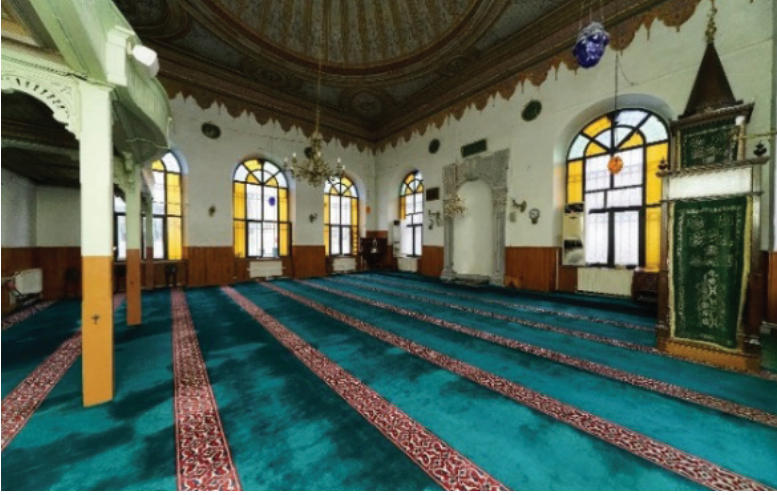
Fotoğraf 9. Hasana Pařa Camii'nin restorasyon öncesi harimi, Guryayı Fotoğraf Arřivi.

Harimin üstünü örten kubbe ve etrafı tuval üzerine yapılmıř kalem iři süslemeleriyle zenginleřtirilmiřtir. Kompozisyonun tuval üzerine yapıldıđı tuvalde meydana gelen küçük yırtıklarda belli olmaktadır. (Fotoğraf 10)