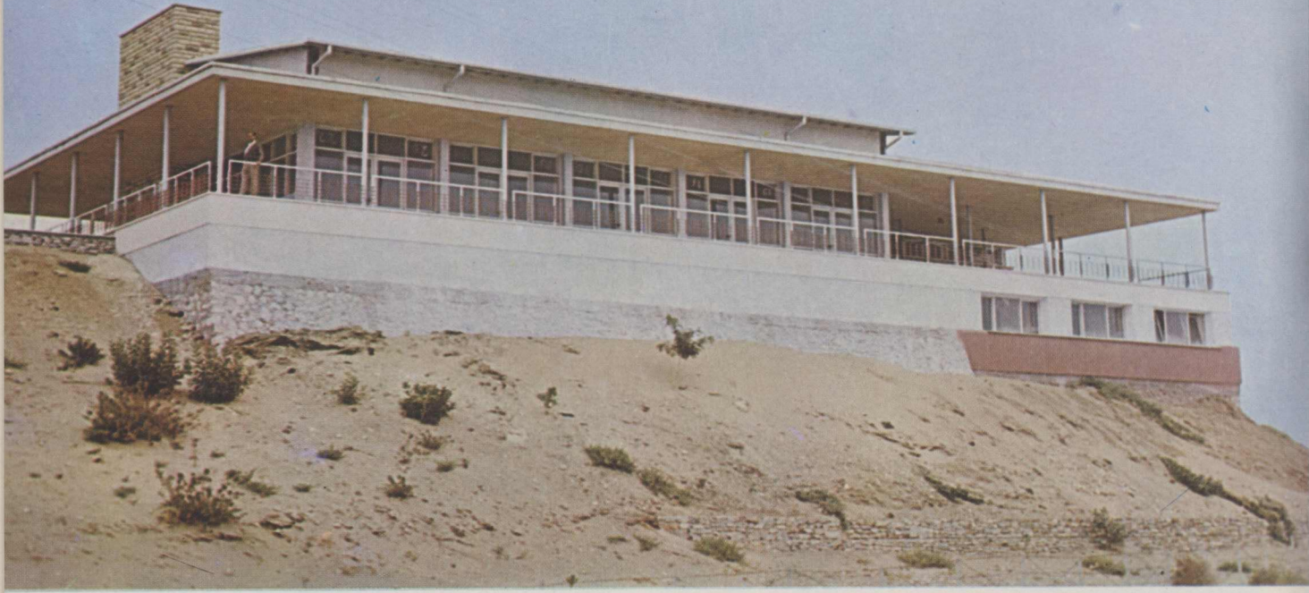
Aydın, Didim Oteli.