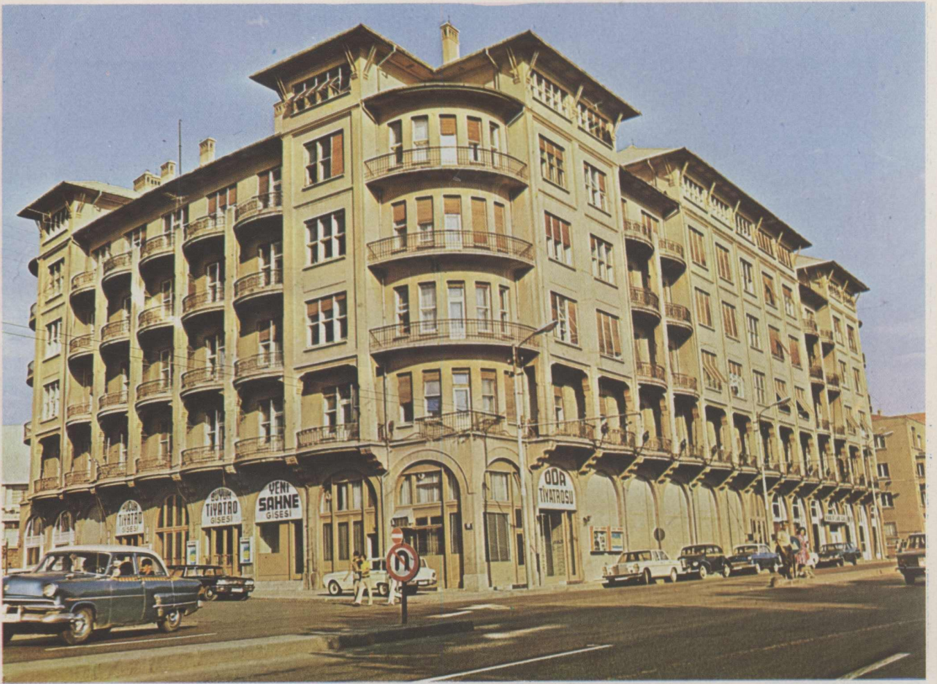
Cumhuriyet Devrinin ilk yapılarından, Mimar Kemalettin'in eseri olan II. Vakıf Apartmanı.