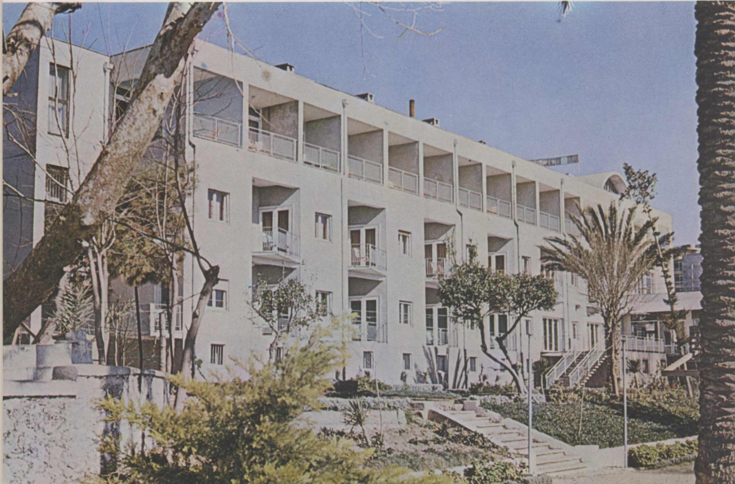
Antalya, Vakıf Teras Oteli.