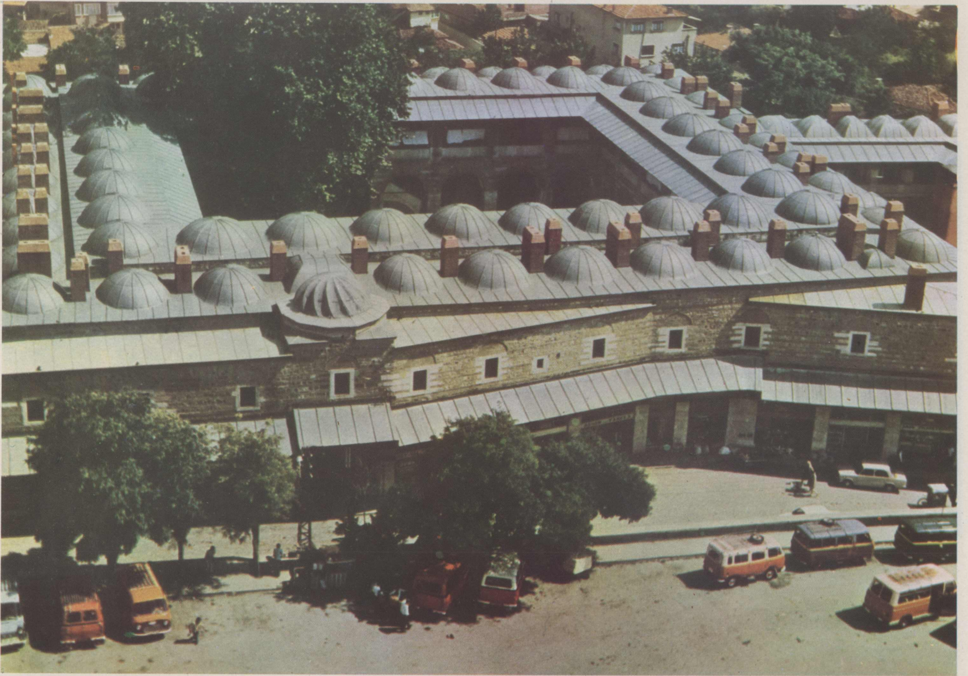
Edirne Rüstem Paşa Kervansarayı. Vakıflar Genel Müdürlüğüne başarılı bir restorasyon yapılarak Türkiye Turizmine katkıda bulunulmuştur.