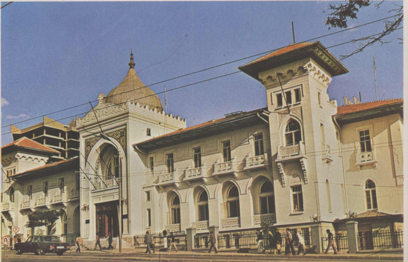
Cumhuriyet devrinin ilk otellerinden biri olan Ankara Palas Oteli.