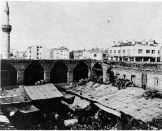
Ankara - Sulu Han onarım öncesi ve onarım esnasında.