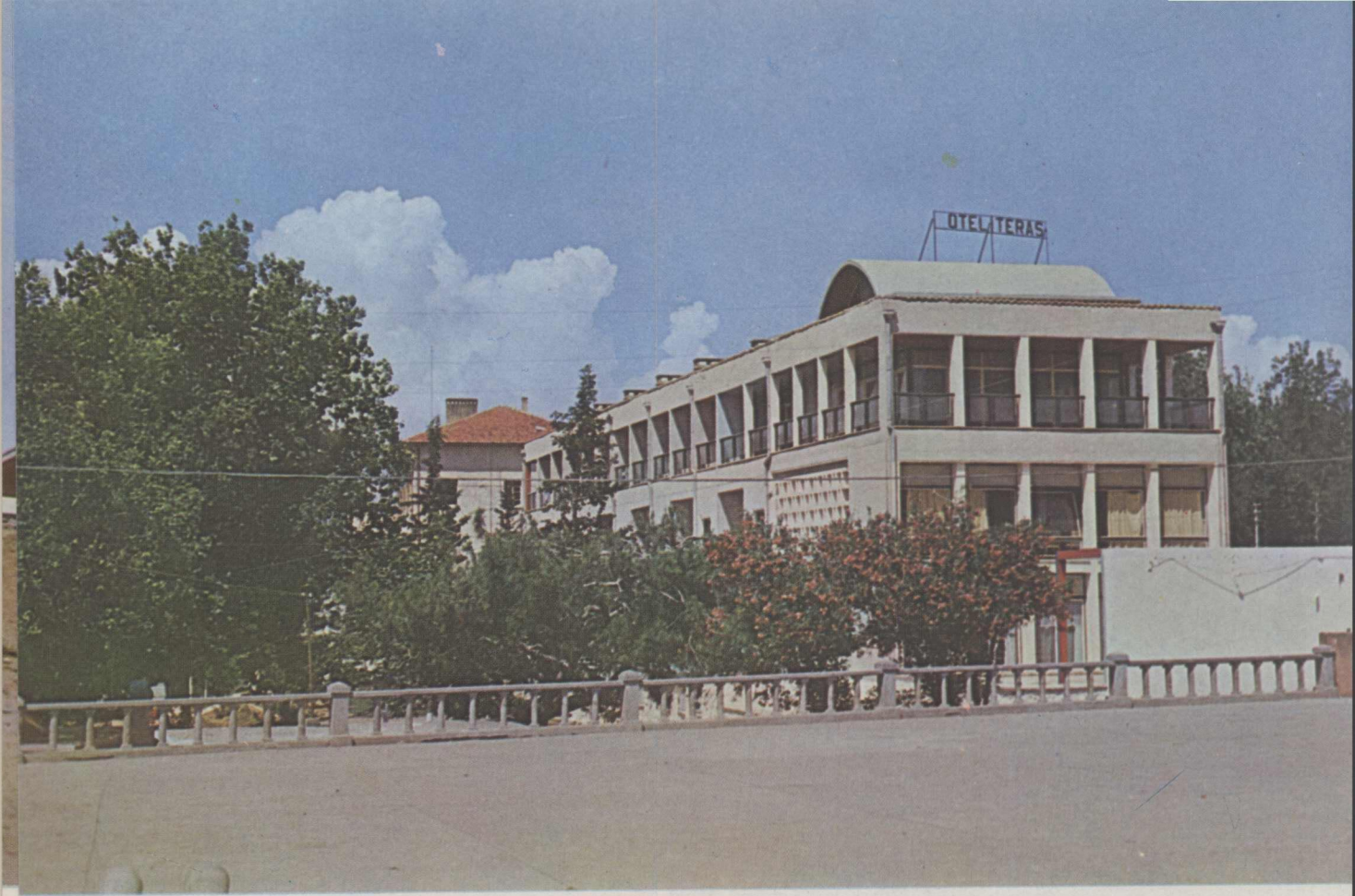
Antalya, Vakıf Teras Oteli genel görünüşü.

Vakıfların şehircilik anlayışının bir örneği olan, İstanbul, Beşiktaş Akaretler