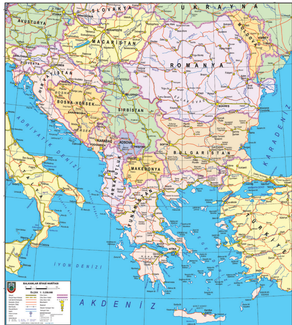
Harita 1- Balkan coğrafyasının bugünkü siyasi haritası.

Rumeli'deki yerleşme Anadolu'dakinden farklı olarak daima devletin benimsediği resmi iskân politikasına uygun olarak gelişmiştir. Osmanlı'nın Rumeli'deki iskân politikasında, Ortaçağda yaygın olan bir görüşün izleri bulunmaktadır. Buna göre devlet, fethettiği topraklara Anadolu'dan nüfus getirip yerleştirmiş, bölge halkını da kolayca denetim