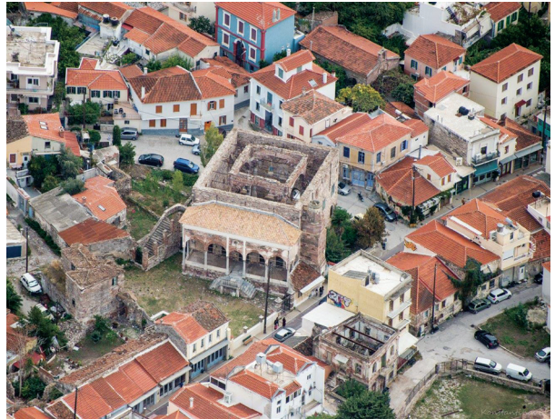
Fotoğraf 30- Yunanistan/Midilli, Nazır Kulaksızade Mustafa Ağa Camii (1825).

riminde karşımıza çıkan Osmanlı Dönemi'ne ait mimarlık mirasının, değişik işlevli yapılardan oluştuğunu ve sayısının binleri geçtiğini söylemek mümkündür. Kuşkusuz diğer Balkan ülkeleri gibi, Yunanistan'da da Osmanlı mimarlık mirasının aynı kaderi yaşadığı görülmektedir. Savaş, deprem, yangın, vd. nedenlerle, ülkede Osmanlı idaresinde inşa edilen toplam 3771 adet yapıdan yarısından fazlasının yok olduğu gözlenmektedir.