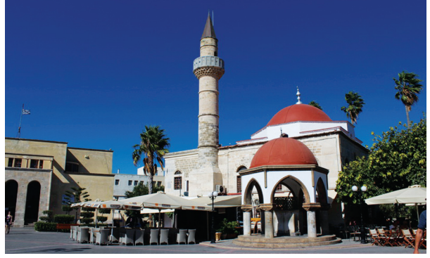
Fotoğraf 28- Yunanistan/Kos, Defterdar İbrahim Efendi Camii (18. yy. sonları).

Yunanistan: Çirmen kazasının 1371 yılında Osmanlı yönetimine girmesiyle Rumeli olarak adlandırılan Balkan coğrafyasında fetih faaliyetleri hızlanmıştır. Günümüzde Yunanistan olarak bilinen ve bünyesinde pek çok adayı da barındıran coğrafyanın fetih süreci aynı anda olmadığı gibi, Osmanlı idaresinden çıkışı da kademeli olmuştur. Mora yarımadası, Girit, Selanik, Dimetoka, Atina, Serez, Kavala, Gümülcine, Larissa- Yenişehir gibi önemli yerleşim birimlerine sahip ülkenin fethinde, özellikle akıncı ailelerinden Turhanoğulları ile Evranosoğulları önemli rol oynamışlardır. 1829 yılından itibaren bu bölgedeki topraklarını kaybetmeye başlayan Osmanlı Devleti, son olarak I. Dünya Savaşı sonrasında, 1918 yılında yapılan anlaşma doğrultusunda Yunanistan ile sınırını oluşturmuştur. Yapılan araştırma ve incelemeler sonucunda; ülkenin hemen her yerleşim bi-