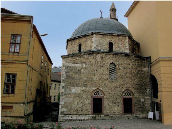
Fotoğraf 13- Macaristan/Pecs, Yakovalı Hasan Paşa Camii (16. yy. ikinci yarısı).