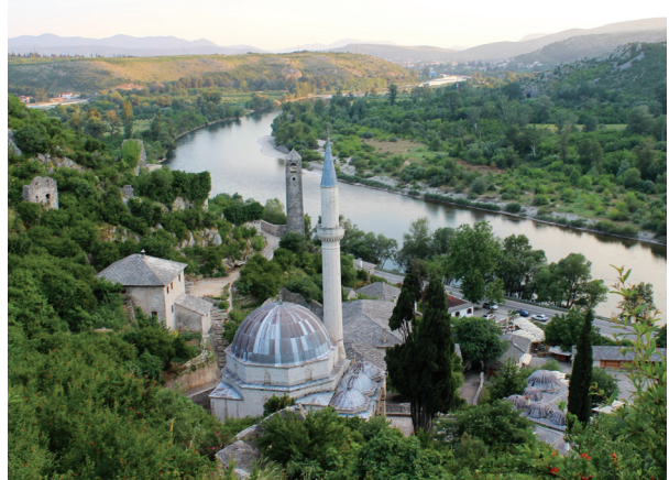
Fotoğraf 6- Bosna- Hersek, Poçitel, Şişman İbrahim Paşa (Ali Paşa) Camii ve çevresi (18. yy).