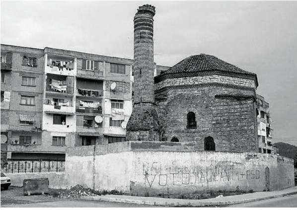
Fotoğraf 2- Arnavutluk, Elbasan Nazir Bey Camii, restorasyon öncesi fotoğrafı (yapım tarihi, 1599).

rinin, bugün birkaç farklı ülkenin sınırları içerisinde kaldığı anlaşılmaktadır. Bu çalışmada biz, bir karşılığa meydan vermemek için, güncel ülke sınırlarını dikkate alarak bir değerlendirme yapmayı tercih ettik.