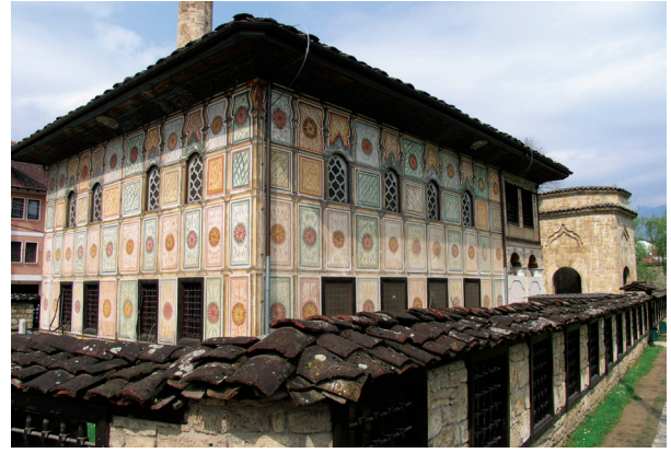
Fotoğraf 21- Makedonya, Kalkandelen Alaca Camii ve türbesi (1833).