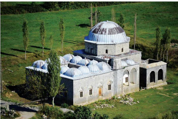
Fotoğraf 4- Arnavutluk/İşkodra, Kurşunlu (Buşatlı Mehmed Paşa) Camii (1773-74).

Avlonya, İşkodra, Elbasan, Berat, Dıraç, Tiran, Tepedelen belirtilebilir. Yapılan araştırma ve incelemeler sonucunda ülkede, Osmanlı Dönemi'nde, değişik işlevli (dini, ticari, askeri, sosyal, eğitim, vb.) toplam 1015 adet eser inşa edilmiştir. Ne yazık ki bu eserlerden çok azı (1/3) günümüze ulaşabilmiştir.