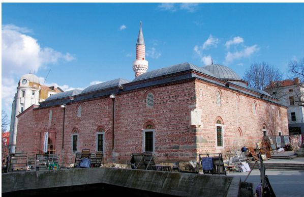
Fotoğraf 9- Bulgaristan/Filibe, Murad Hüdavendigâr Camii (1369-1389).