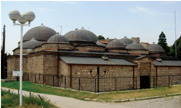
Fotoğraf 19- Makedonya, Üsküp, Davud Paşa Hamamı (1489- 1497).