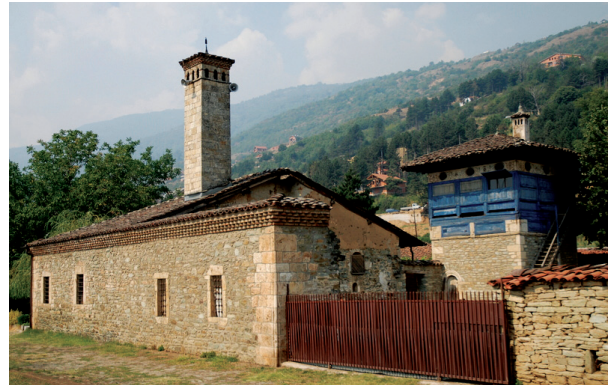
Fotoğraf 23- Makedonya/Kalkandelen, Harabati Baba Tekkesi (1538).

Romanya: Osmanlı idaresine girdiği 1484 yılından 1878 yılına kadar ülkede, değişik fonksiyonlu pek çok mimarlık eseri inşa edilmiştir. Önemli şehirleri arasında Bükreş, Baba-dağ, Dobruca, Hırşova, Köstence, Temeşvar'ın olduğu ülkede, yapılan araştırma ve incelemeler sonucunda, Osmanlı idaresinde toplam 291 adet yapının inşa edildiği bilinmektedir.