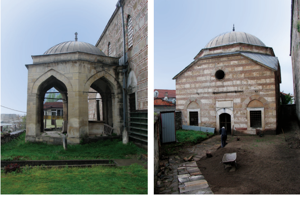
Fotoğraf 25- Makedonya/Üsküp, Dağıstanlı Ali Paşa Türbesi, (solda). Fotoğraf 26- Makedonya/Üsküp, Beyhan Sultan Türbesi, (sağda).