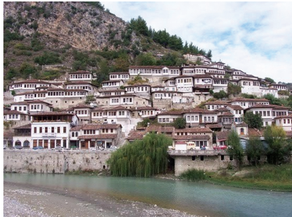
Fotoğraf 1- Arnavutluk/Elbasan'daki Osmanlı dönemi mahalle-kent dokusu.

XVI. yüzyılın ikinci yarısında Balkan şehirlerinin nüfus bileşimlerinde, Türk- Müslüman unsurun oranı büyük ağırlık kazanmıştır. Ayrıca, istenilen koşullara uymayı kabul ve yükümlülükleri yerine getirdikten sonra mahalle değiştirmek, başka bir şehre göç etmek, Osmanlı toplumunda açıktır. Bu nedenle, şehirde kiracılara, bir başka yerden gelenlere rastlamak da mümkündür. Birlikte ekonomik uğraşıda bulunan, para ve emek ortaya koyarak ticaret yapan müslüman ve zımmilerin sosyal yaşantılarını da birbirlerine