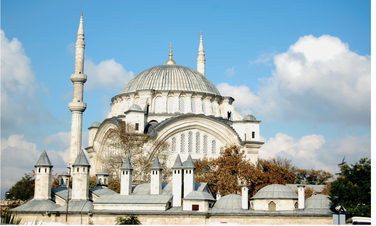
Fotoğraf 1. Caminin Çemberlitaş yönünden görünümü