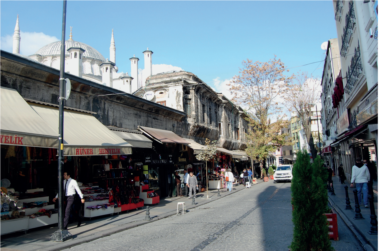
Fotoğraf 2. Külliyeeye ait dükkânların Nuruosmaniye Caddesinden görünümü (Murat Sav, 2012)

Bu yapı ve yapı gruplarının korunmasına yönelik çalışmalarda, Vakıf yapılarının korunması hakkında çeşitli kararlar alınmakta, yönetmelik, ilke kararı gereğince kararlar alınmakta, ilgili kurullardan geçerek, koruma uygulamaları gerçekleştirilmektedir. Yasal mevzuat ile korunmaları güvence altına alınmış olan bu yapı ve yapı gruplarından, İstanbul Tarihi