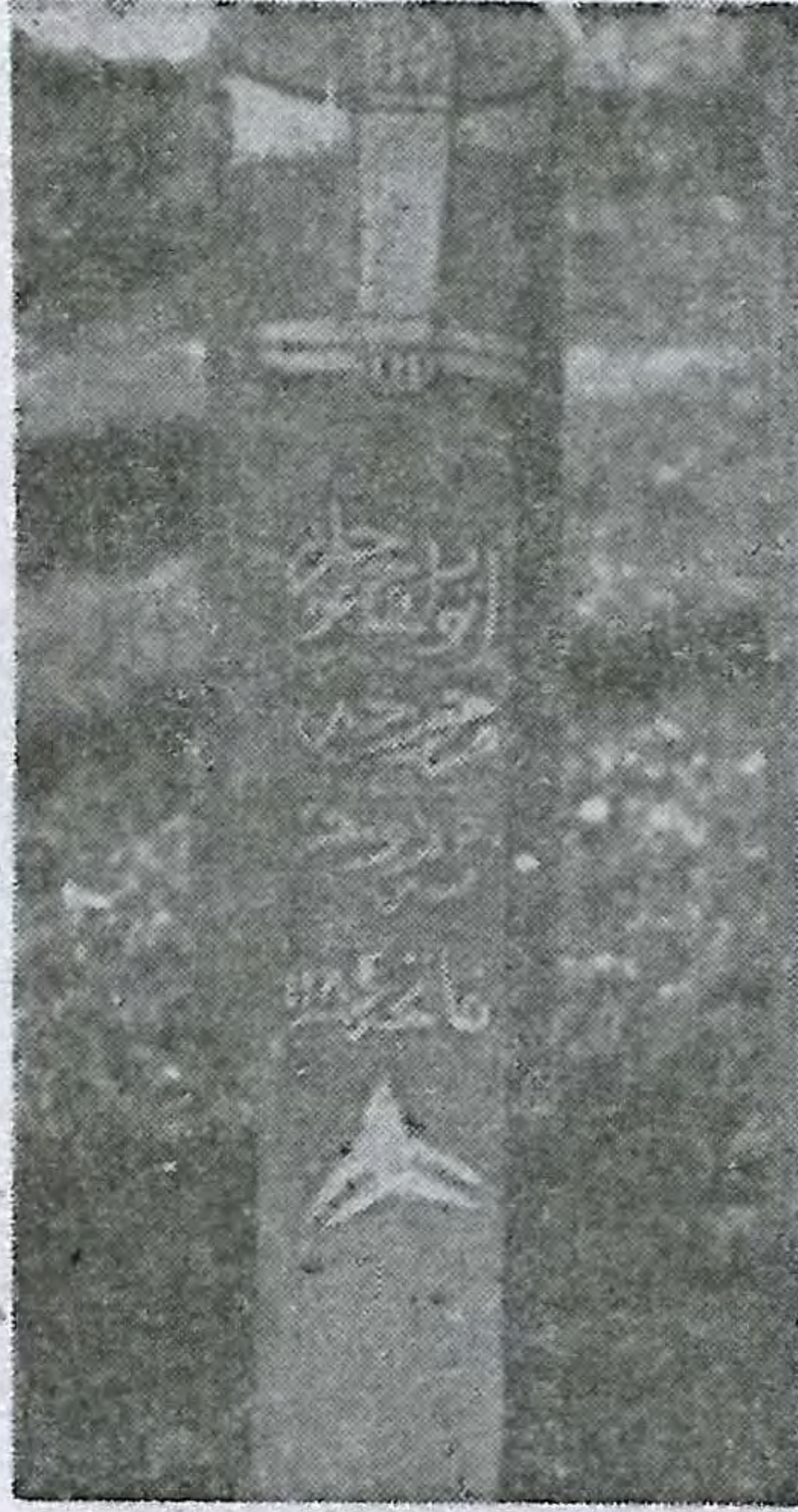
Resim No : 12