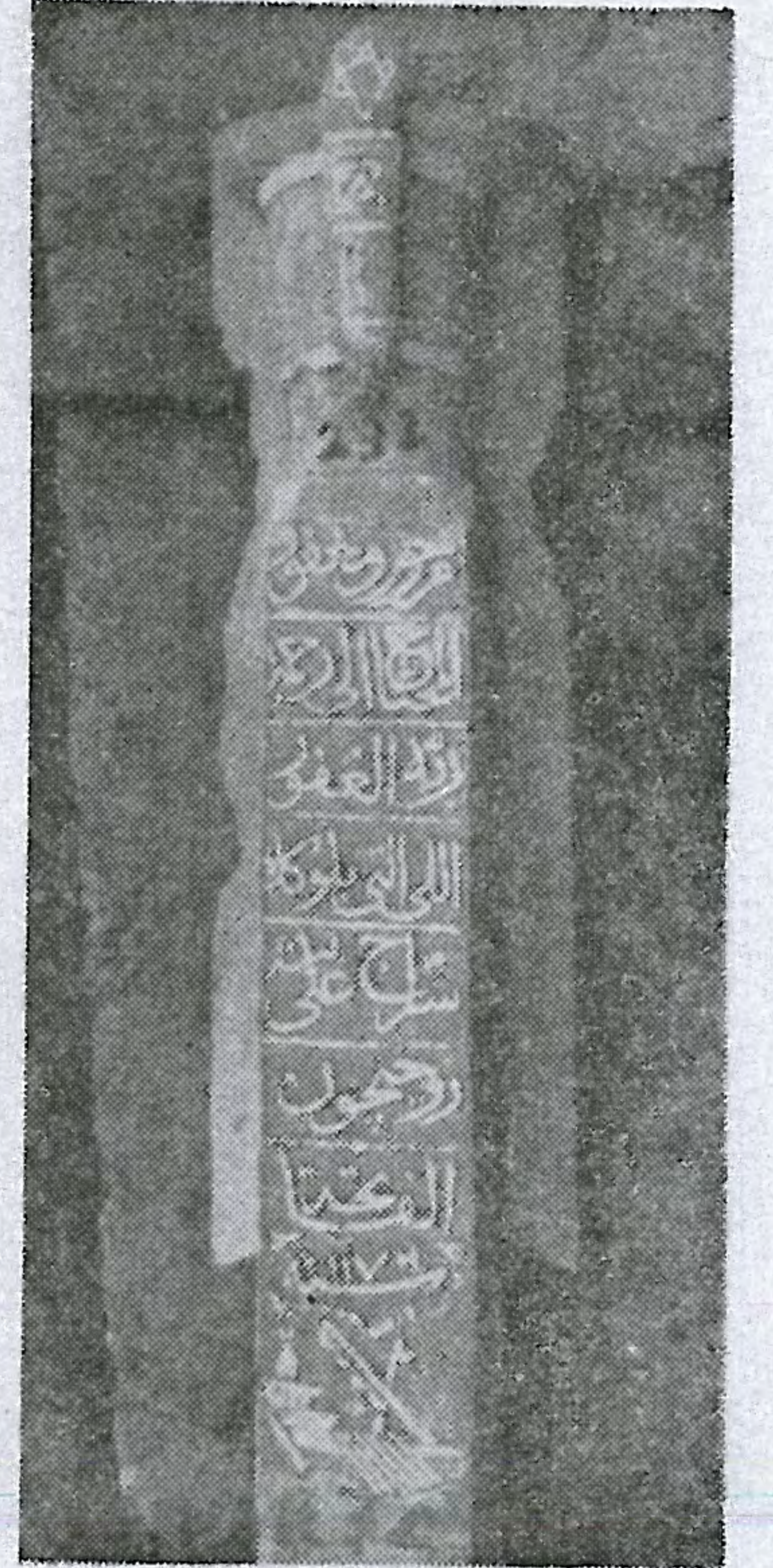
Resim No : 11

Taşın ölçüsü : Yükseklik: 211 En: 14,5 Yatırma yük: 89 Yatırma en: 28