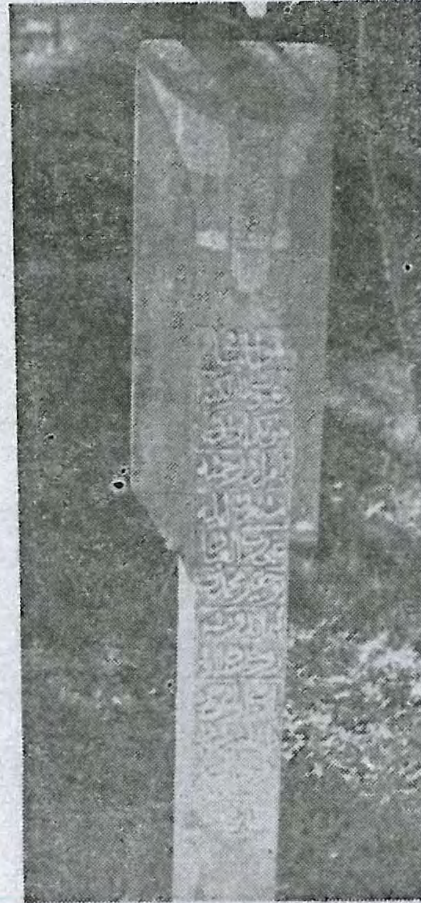
Resim No : 8

Taşın sahibi : Mehemed Taşın tarihi : 1171 H/1757 M Taşın cinsi : Mermer Taşın yeri : Deniz Müzesi Taşın ölçüsü : Yükseklik: 126 En: 13 Yatırma yük: 67 Yatırma en: 26