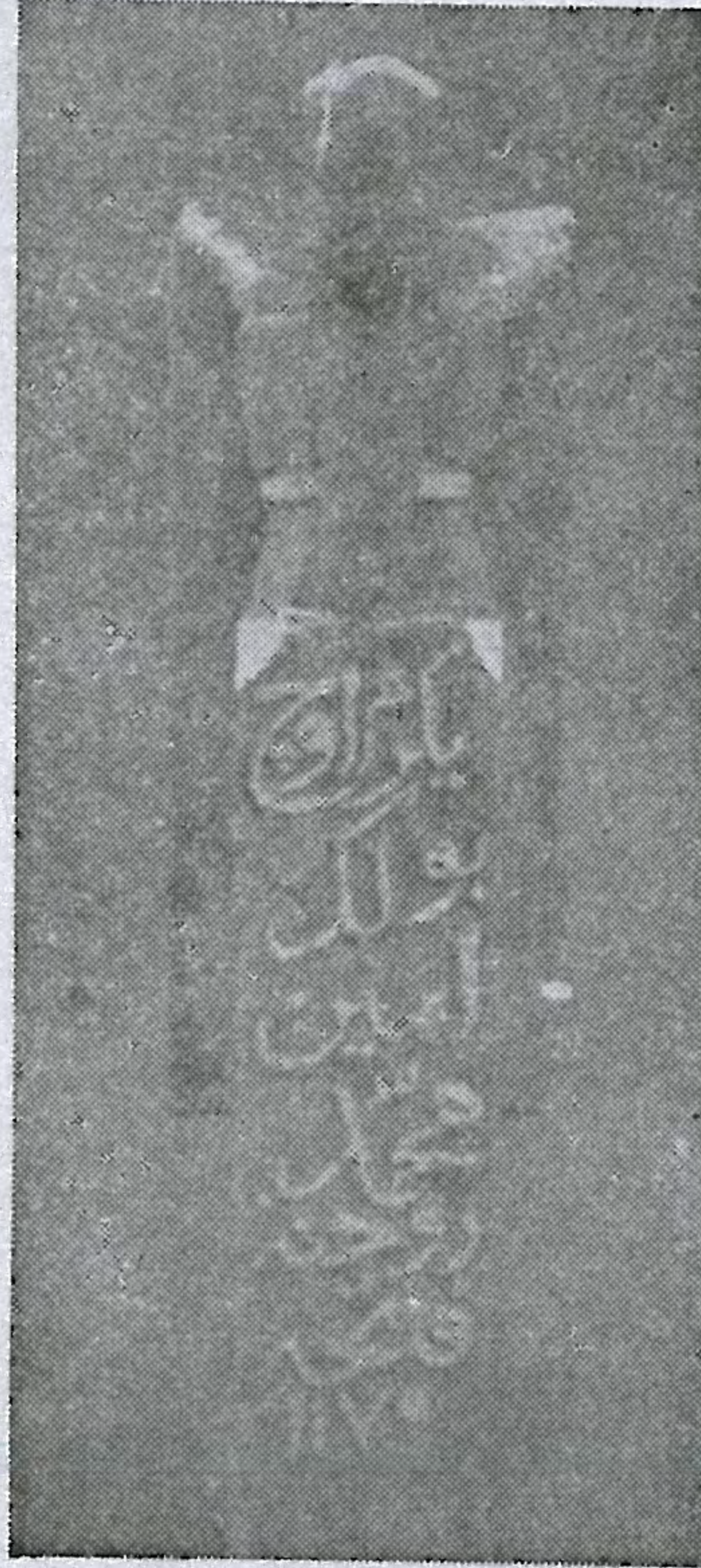
Resim No : 10

Taşın ölçüsü : Yükseklik: 63 En: 9,5 Yatırma yük: 34 Yatırma en: 15