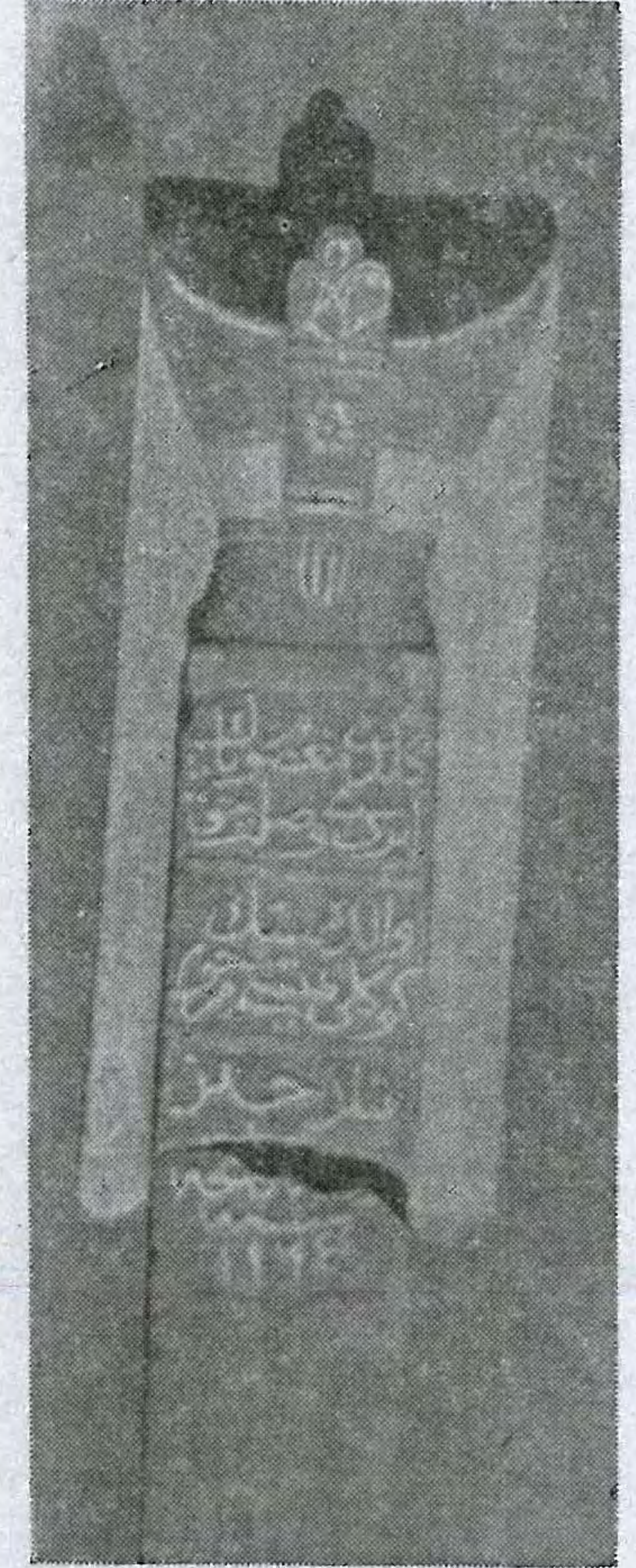
Resim No : 5

Taşın sahibi : Monla Hüseyin Taşın tarihi : 1164 H/1750 M Taşın cinsi : Mermer Taşın yeri : Türk ve İslâm Eserleri Müzesi Env : T-394