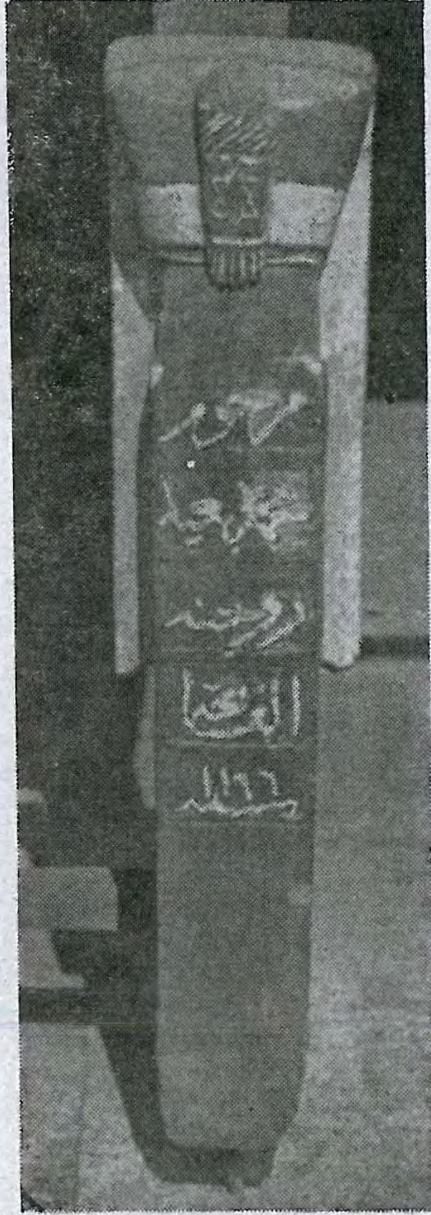
Resim No : 6