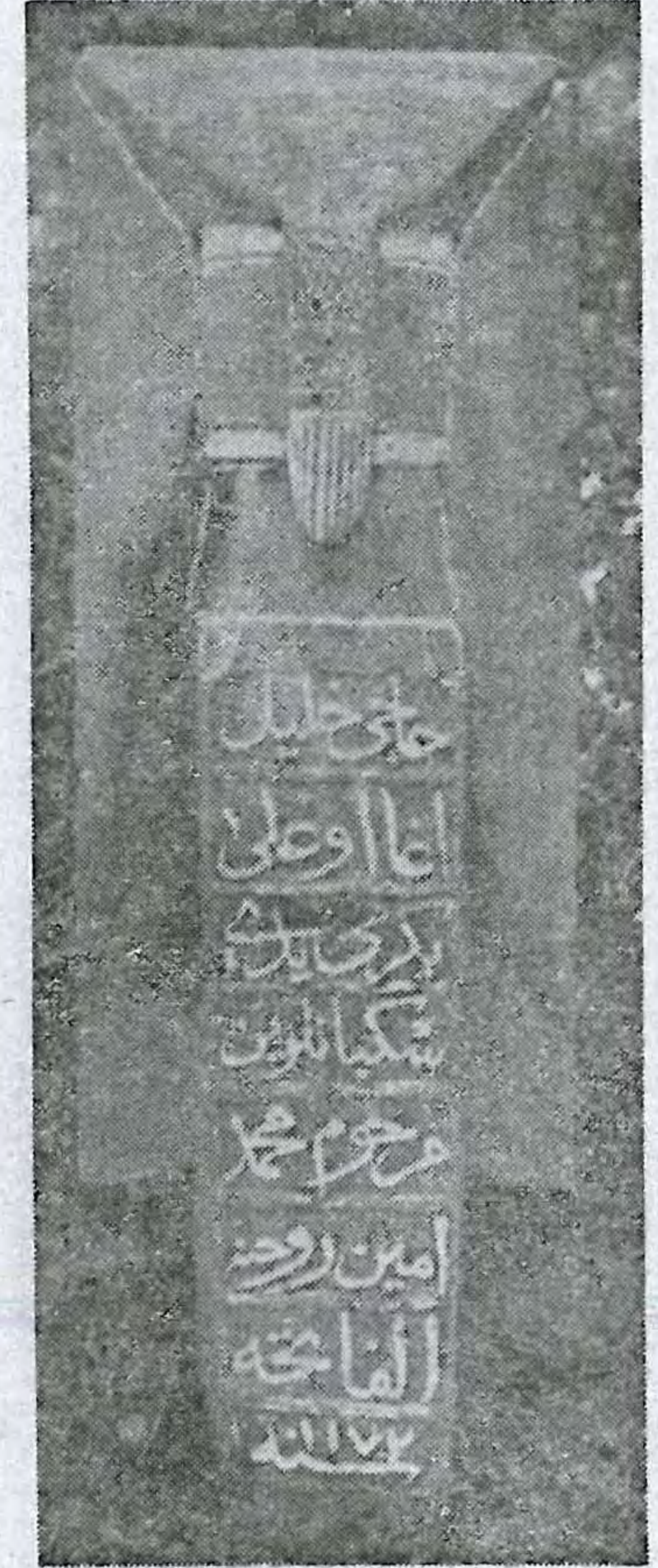
Resim No : 9