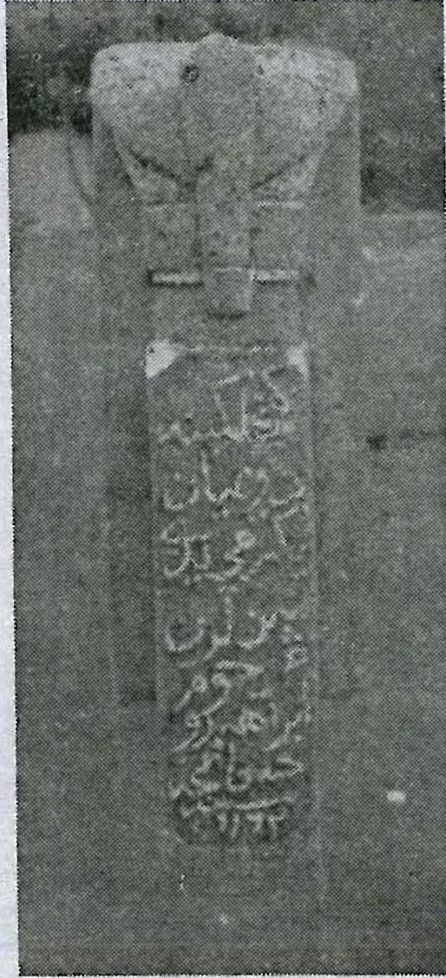
Resim No : 4