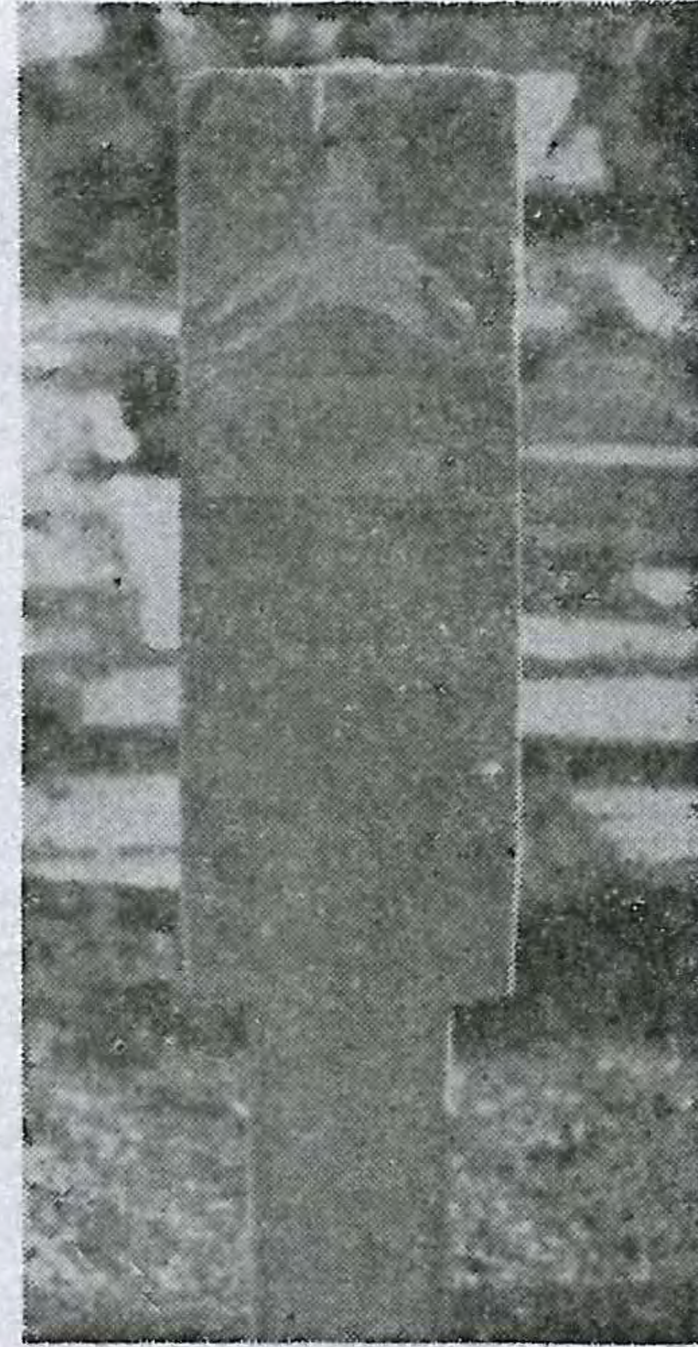
Resim No : 12 a