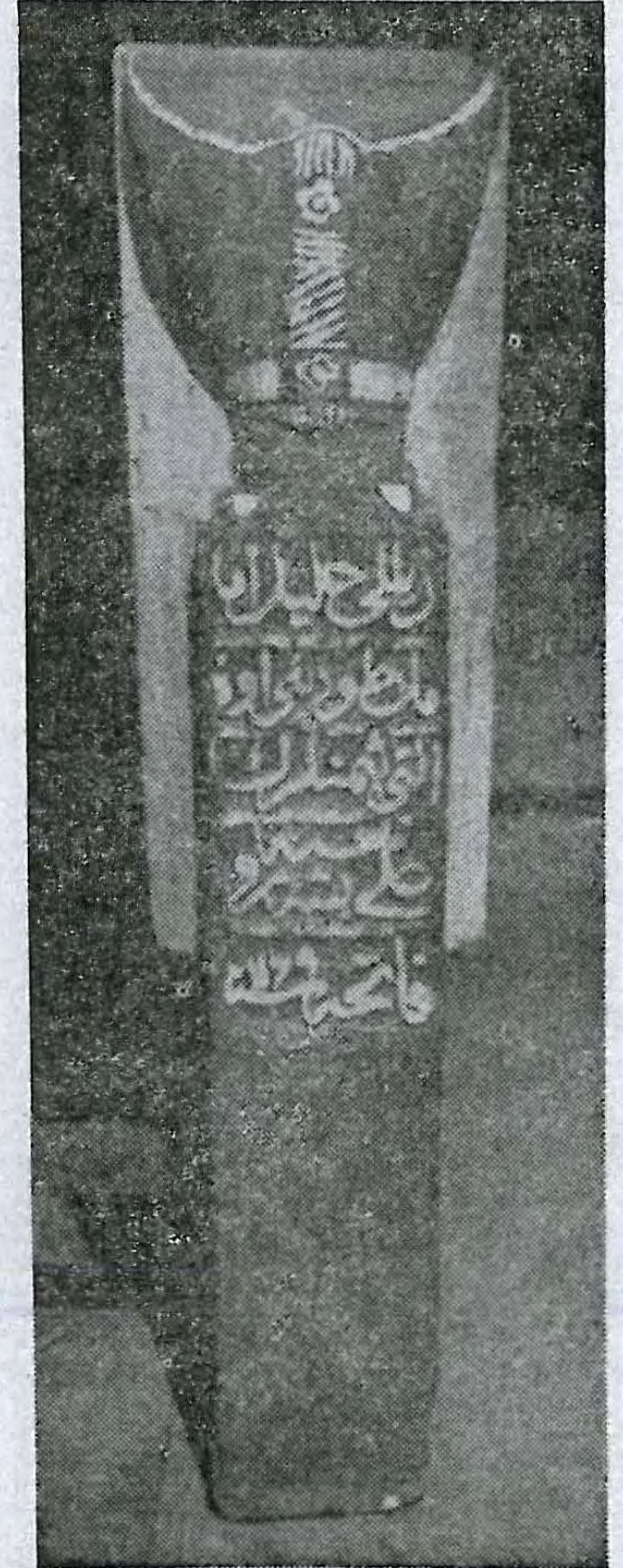
Resim No : 7

Taşın sahibi : Ali Beşe Taşın tarihi : 1169 H/1755 M Taşın cinsi : Mermer Taşın yeri : Türk ve İslâm Eserleri Müzesi Env : 2835