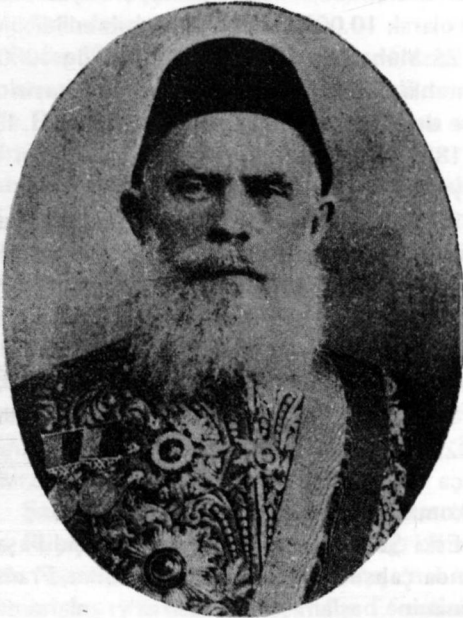
Ahmet Cevdet Paşa

"İşkodra'ya yetkili bir memur gönderilip âteşi söndürmesi için bir münasiplisinin araştırılması sırasında, Ali Paşa'nın mahremi esrarı ve tercümanı efkârı olan Meclisi Vâlâ Reisi Kâmil Paşa (Sadri Esbak Yusuf Kâmil Paşa) "Cevdet Efendi münasiptir" dedi. "Devletin böyle mühim bir işini kabûlde tereddüt etmek caiz olmaz. Fakat şimdiye kadar yalnız başıma böyle bir işte bulunmadım. Şayet bir kusur edersem ma'zur olurum" dediğimde, Kâmil Paşa: "Sen bu memuriyeti kabul ettiğin gibi biz işin yarısını bitmiş biliriz" dedi"(77).