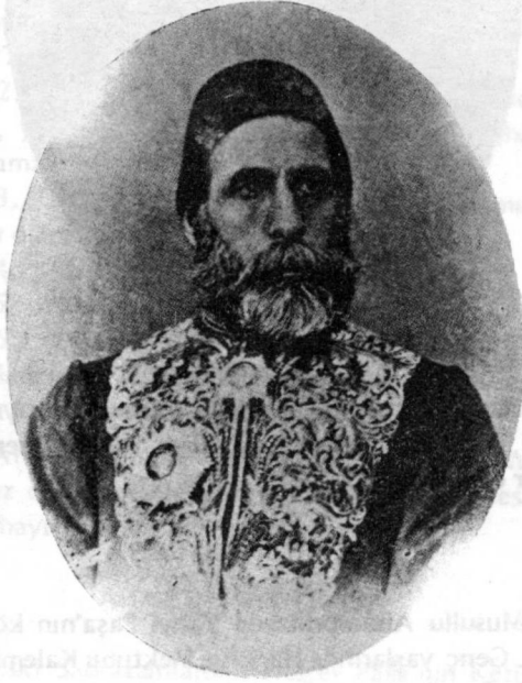
Mehmet Hürşid Paşa

vel H. 1289/M. 1872'de Çarsacak ile birleştirilip Diyarbakir Vilayetinden ayırmak suretiyle yeniden teşkil olunan Ma'muretilaziz (Elazığ) Vilayeti Valiliğine, 27 Cemaziyelûlâ H. 1289/M. 1872'de Sivas Valiliğine, 24 Safer H. 1290/M. 1873'de ikinci defa Evkaf-ı Hümayun Nezaretine, 9 Rebiyulevvel H. 1290/M. 1873'de, Şirvanizade Rüşdi Paşa'nın Sadrazamlık döneminde Sadaret Müsteşarlığına (65) , 28 Recep H. 1290/M. 1873'de Divanı Ahkâmı Adliye Nezaretine, 5 Safer H. 1291/M. 1874'de ikinci defa Edirne Valiliğine tayin edilmiş, Ramazan H. 1292/M. 1875'de bu görevden ayrılmıştır.