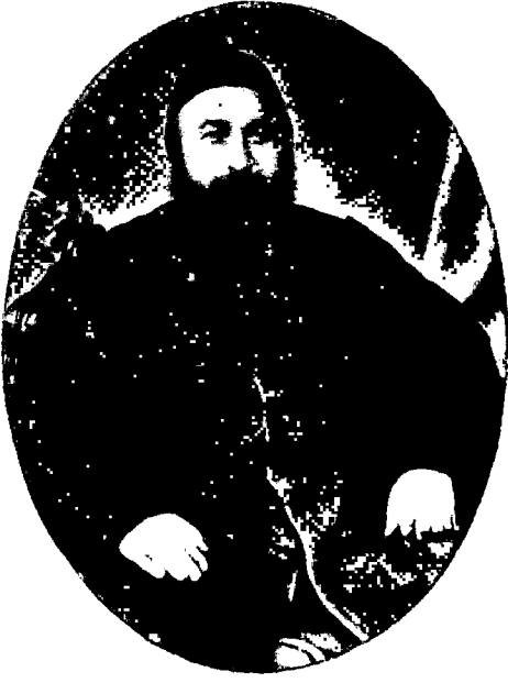
Şirvanizade Mehmed Rüşdi Paşa