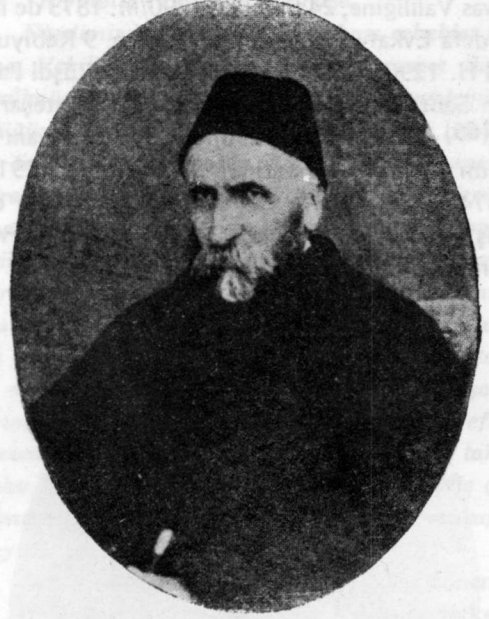
Ahmet Hamdi Paşa

Mektebi Sultani civarında hazırlanan mezara defnedilmiş, üzerine irade-i seniye ile türbe inşa edilmiştir. Mütedeyyin, dürüst, iffetli ve doğru sözlü, güzel sıfatlara sahip bir şahıs idi.